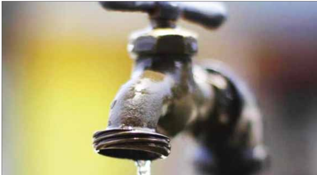
TENSIÓN. Plantean residentes que mesa de negociación sea en un sitio neutro porque ya hubo un enfrentamiento entre dos grupos del mismo poblado.

Detallaron que luego de mucha insistencia, lograron establecer mesas de diálogo, donde