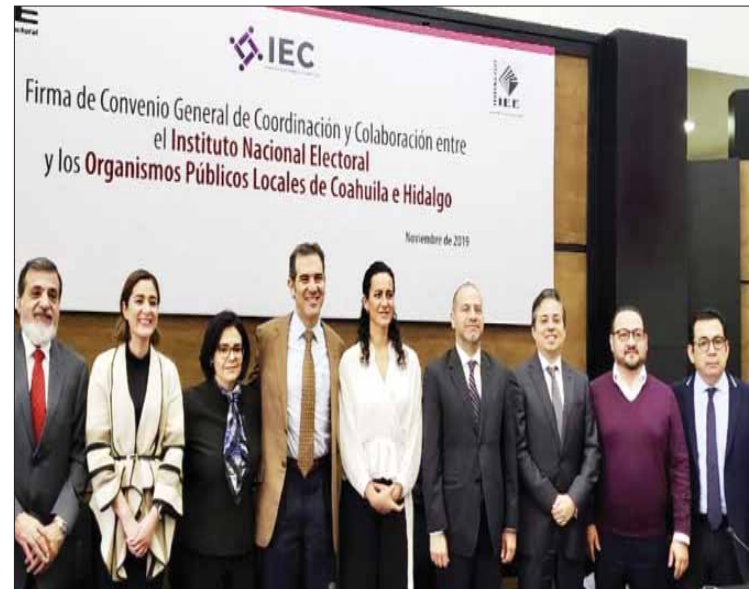
FORMATOS. Indica consejera presidenta que cada proceso lleva un sello y el que se avecina estará marcado por la aplicación de la reciente Reforma Electoral Local.

Las elecciones, hoy en día son la base de la convivencia pacífica, estabilidad política, económica y social del país, en contraste con el panorama democrático de otras naciones concluyó.