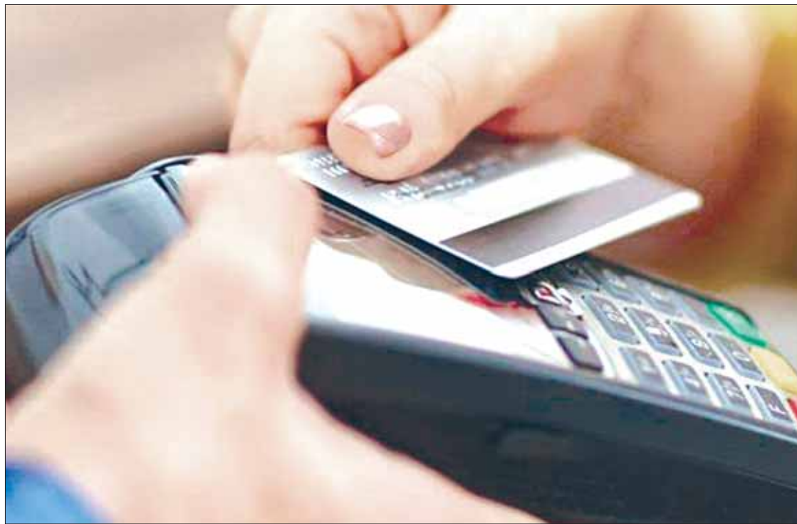
LAPSO. La próxima semana el procurador, Ricardo Sheffield Padilla, será quien dé a conocer las estadísticas de quejas y denuncias presentadas por los consumidores.

PAUTAS Desde el pasado miércoles inició el trabajo con algunas cadenas comerciales