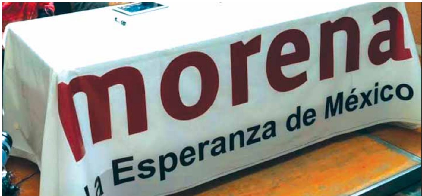
CAMINOS. Consejo Estatal tuvo una reunión para definir la postura que plantearán en el cónclave nacional, respecto a la situación particular de Hidalgo, además de precisar las diversas actividades de cara a la contienda de presidencias municipales.

Sobre ello, el presidente del Consejo Estatal de Morena dijo que analizarán la solicitud formal de juicio político contra el edil y la oficial mayor del citado municipio, ya que son recurrentes las quejas o denuncias por irregularidades.