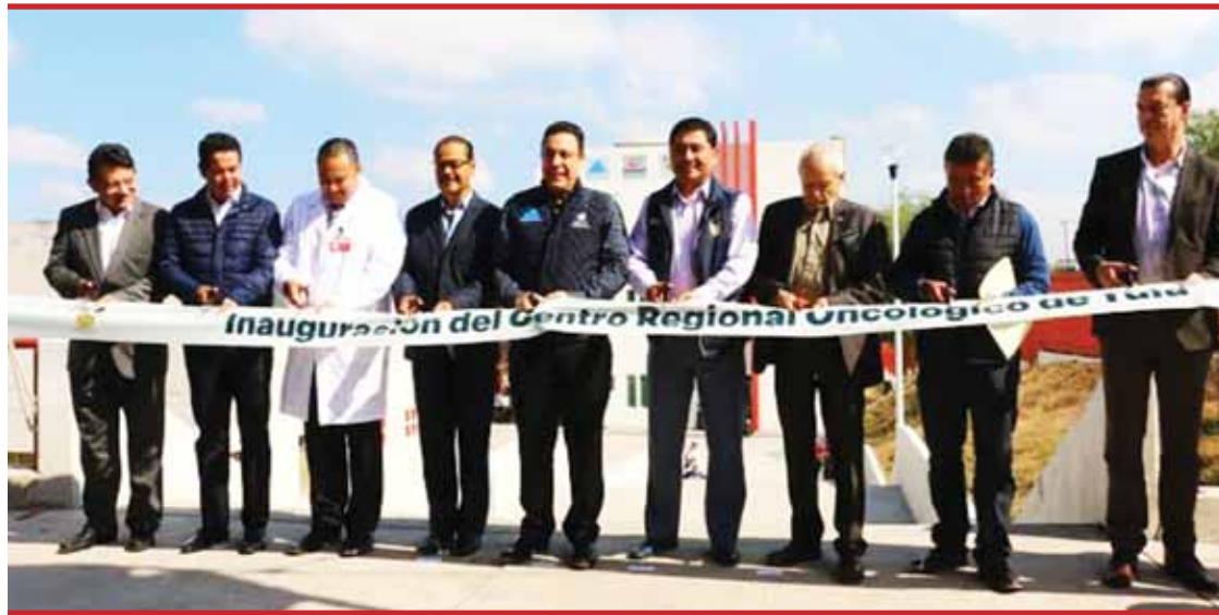
COMPLICACIONES. Área en Hospital Regional Tula-Tepeji fue inaugurada en 2016, luego de un retraso de casi 2 años y medio en su construcción.