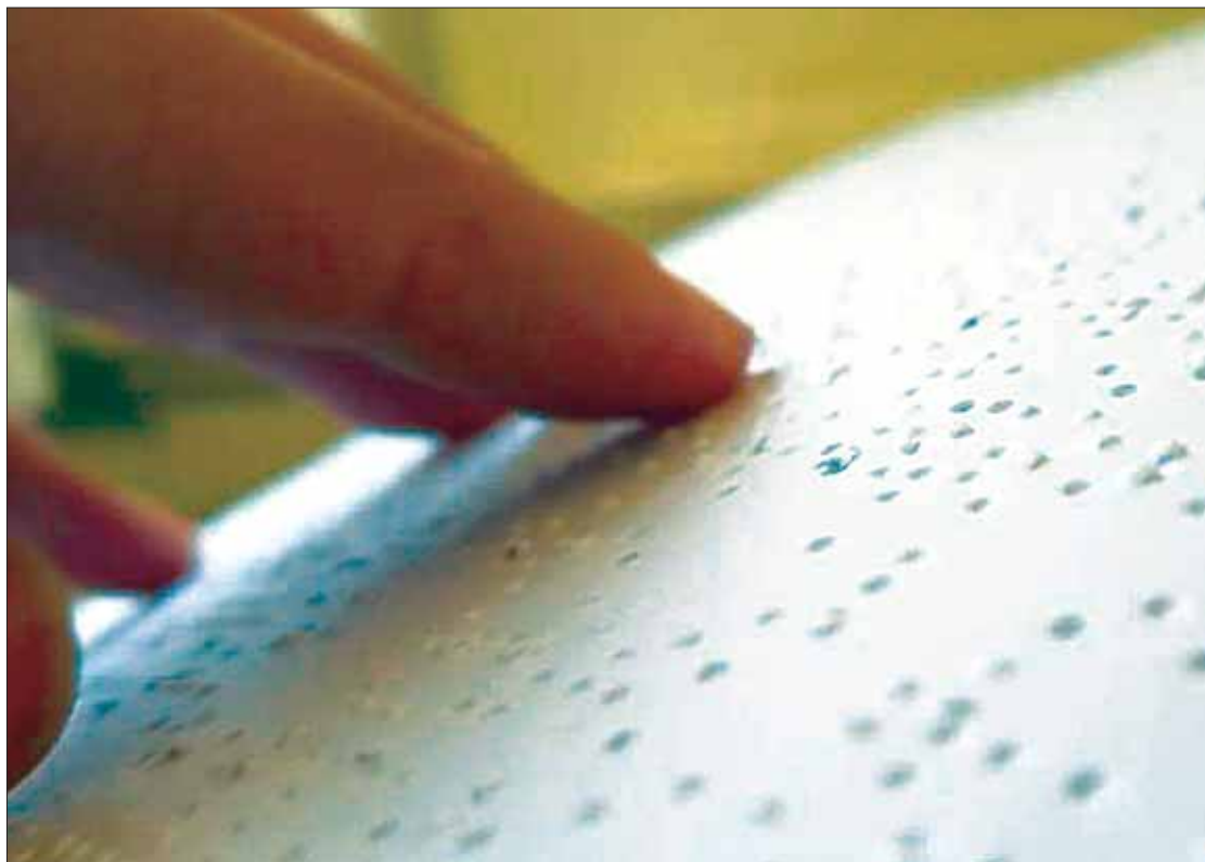
VISUALIZACIÓN. Garantizar su postulación a cargos de elección popular, así como su incorporación en el servicio público.

Los magistrados federales decretaron por unanimidad