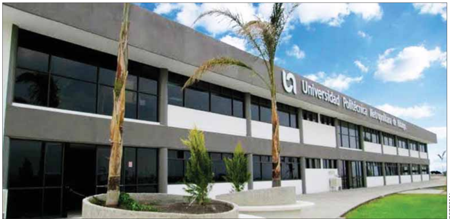
CIMENTOS. Con ello compartirán experiencias y aprendizajes, de acuerdo con los programas establecidos por parte de la agencia aeroespacial.

El cierre de la convocatoria será el 14 de noviembre, se llevará a cabo el registro de la solicitud a través del portal digital. (Adalid Vera)