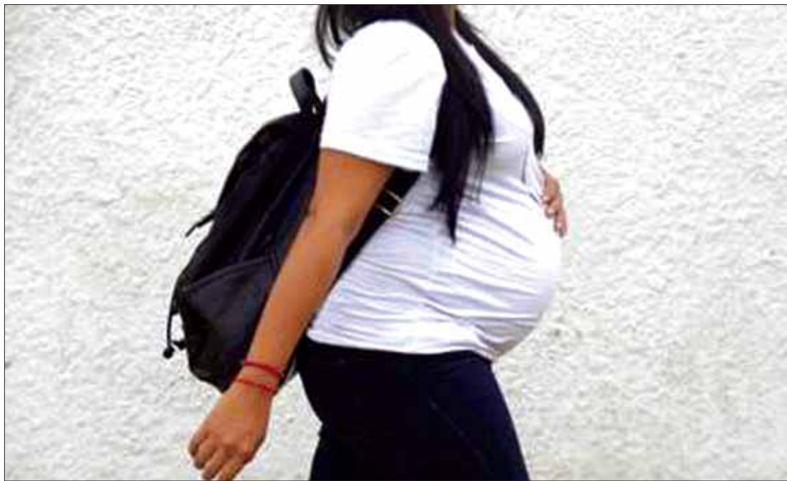
COESPO. Prevención del Embarazo en Adolescentes desde la perspectiva de Género.

Este grupo representativo de la Utec trabaja bajo una línea de investigación enfocada a la síntesis y caracterización de materiales avanzados, nanoestructurados mediante el uso de técnicas electroquímicas a partir del tratamiento de efluentes industriales y soluciones de laboratorio, utilizando para la deposición sustratos de diversa naturaleza, lo anterior con el fin de impactar en problemas ambientales y de beneficio tecnológico.