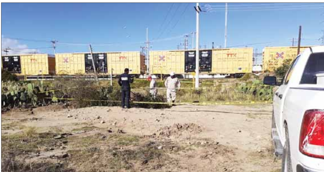
PRONTITUD. El punto fue asegurado y resguardado de manera inmediata, por lo cual no hubo riesgo para la población.

guardada de manera inmediata, por lo cual no hubo riesgo para la población.