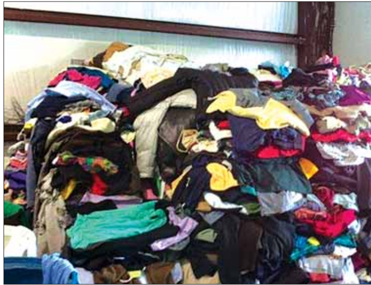
INTENCIONES. Apuesta es por contrarrestar efectos negativos.

"La gente debe tomar en cuenta que comprar ropa usada no representa un ahorro a su economía, la ropa que ingresa al país procedente de la Unión Americana no garantiza que lle-