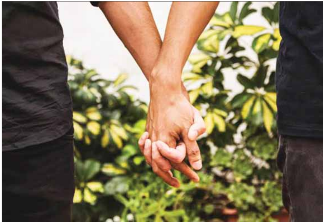
ENTIDAD. Requiere escenario donde se enaltezcan las garantías individuales y de respeto hacia cualquier expresión.

Citó que dentro del contexto legislativo son contados los re-