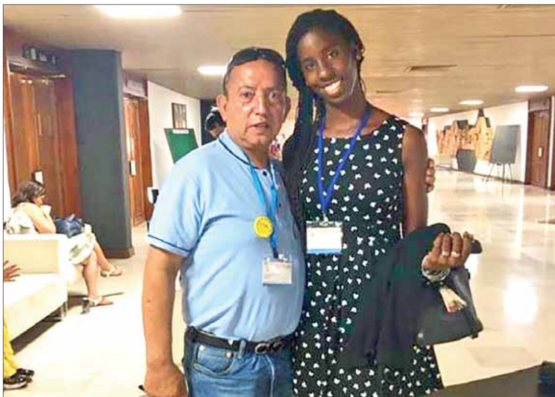
MOTIVACIONES. Señaló que los cinco diputados que también acudieron pagaron ellos mismo sus gastos.