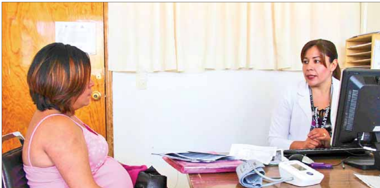
DEFINICIÓN. Sangrado que ocurre durante el embarazo, parto o puerperio, que puede aparecer peligrosamente de forma intraabdominal.

La invitación para que los interesados se inscriban es solicitar informes de manera directa en la Jefatura de Enseñanza y Capacitación del Hospital Obstétrico Pachuca en el teléfono 771 7166192 ext. 149 o al correo electrónico obstetricoenseñanza@hotmail.com y la página de Facebook.