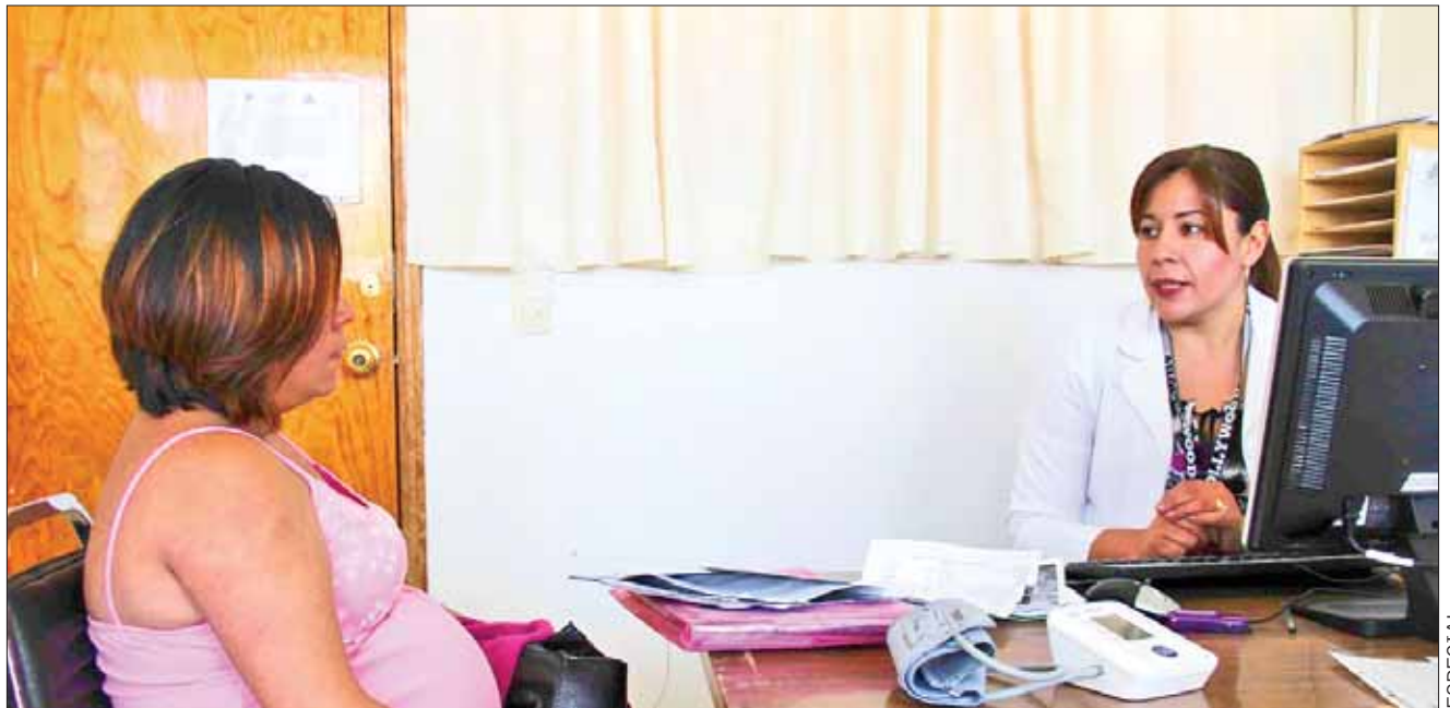
DEFINICIÓN. Sangrado que ocurre durante el embarazo, parto o puerperio, que puede aparecer peligrosamente de forma intraabdominal.

La invitación para que los interesados se inscriban es solicitar informes de manera directa en la Jefatura de Enseñanza y Capacitación del Hospital Obstétrico Pachuca en el teléfono 771 7166192 ext. 149 o al correo electrónico obstetricoenseñanza@hotmail.com y la página de Facebook.