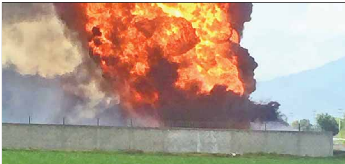
PREVENCIÓN. Ejército Mexicano y la Policía Estatal mantuvieron una restricción a civiles en un perímetro mayor a un kilómetro.

De manera preventiva también fue necesario evacuar a los habitantes de la comunidad Ulapa, quienes fueron trasladados a la cabecera municipal de Tetepango.