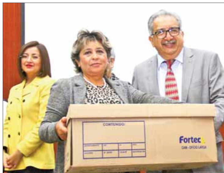
EXPERIENCIA. Recordó que gobernador conoce de primera mano los requerimientos.

el mandatario estatal, al haber transitado como titular de dicha dependencia, conoce de primera mano las necesidades y requerimientos para solventarlas, por lo que ha instruido la aplicación de recursos y acciones para generar efectos positivos en el fortalecimiento del sector educativo, mismo que ac-