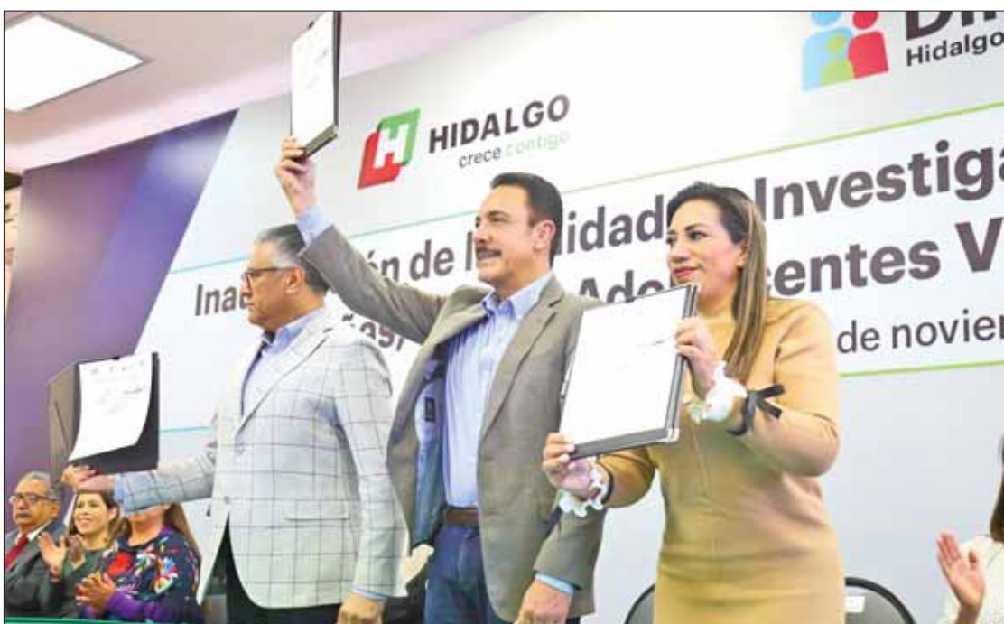
Ofrecer espacios dignos y estrategias adecuadas para prevenir la violencia en niñas, niños y adolescentes es una tarea fundamental, sostuvo el mandatario estatal.

"Si pretendemos mejorar como sociedad, tenemos que hacerlo comenzando por lo más valioso que tenemos como sociedad y en familia". 3