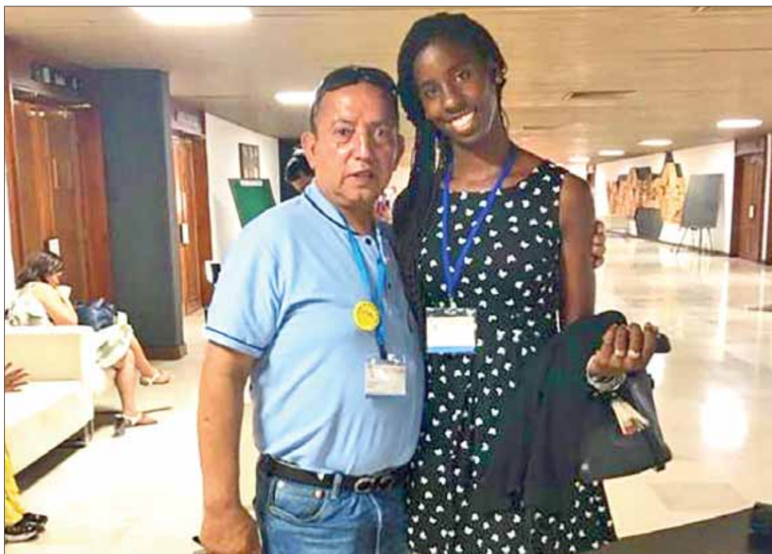
MOTIVACIONES. Señaló que los cinco diputados que también acudieron pagaron ellos mismo sus gastos.