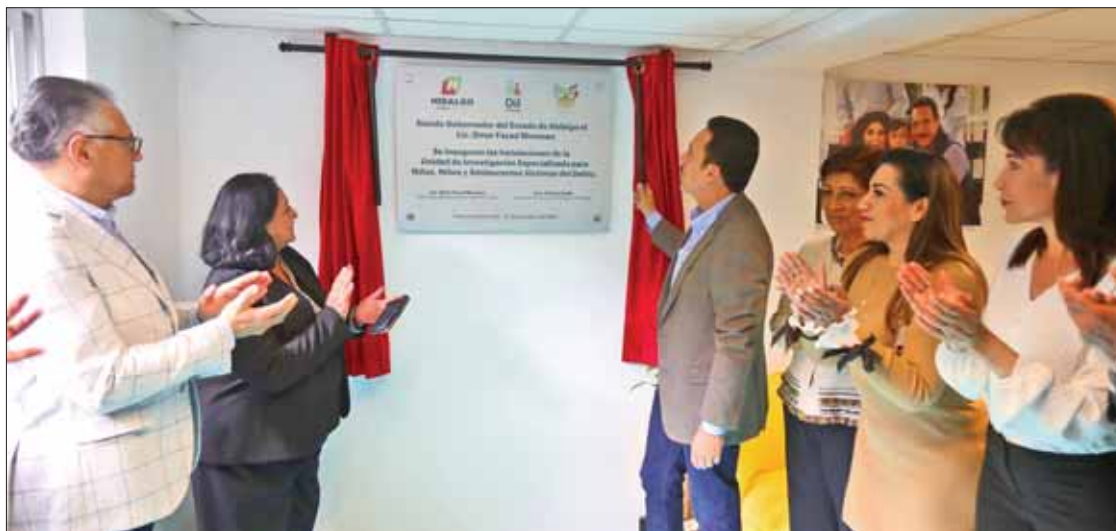
RECONOCIMIENTO. Destacó procuradora nacional esfuerzos realizados en tema por la administración estatal.

expresó, se propuso hacer un mejor Hidalgo, donde es imperativo el respeto a derechos humanos. Por ello las políticas públicas en materia de protección de derechos deben ser transversales, para atender a múltiples dependencias que protegen los derechos fundamentales de la niñez.