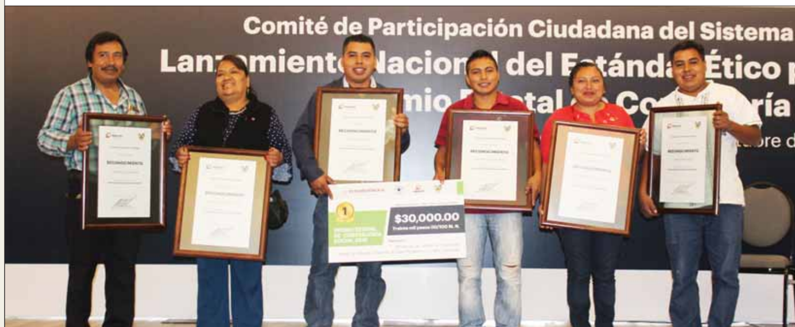
MANEJO. Fue Hidalgo el estado que más expedientes envió a la federación para su participación en el Premio Nacional de Contraloría Social 2019.

Integrados por ciudadanos, coadyuvan en la ejecución de las políticas públicas y dan certeza de que los recursos invertidos en obras, acciones y programas sociales favorecen a las familias hidalguenses aplicándose de manera correcta para brindarles una mejora en su calidad de vida.