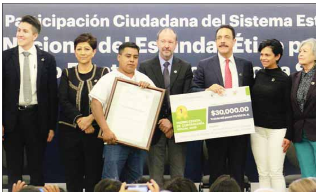
RUTA ESTATAL. Cuenta Hidalgo con 3 mil 729 Comités de Contraloría Social, conformados gracias a la visión del gobernador Omar Fayad.

Durante esta edición, Hidalgo se posicionó como el estado que más expedientes envió a la federación para su participación en el Premio Nacional de Contraloría Social 2019, registrando el 20 por ciento (%) de los expedientes totales pertenecientes a la categoría "Acciones de Comités de Contraloría Social". 3