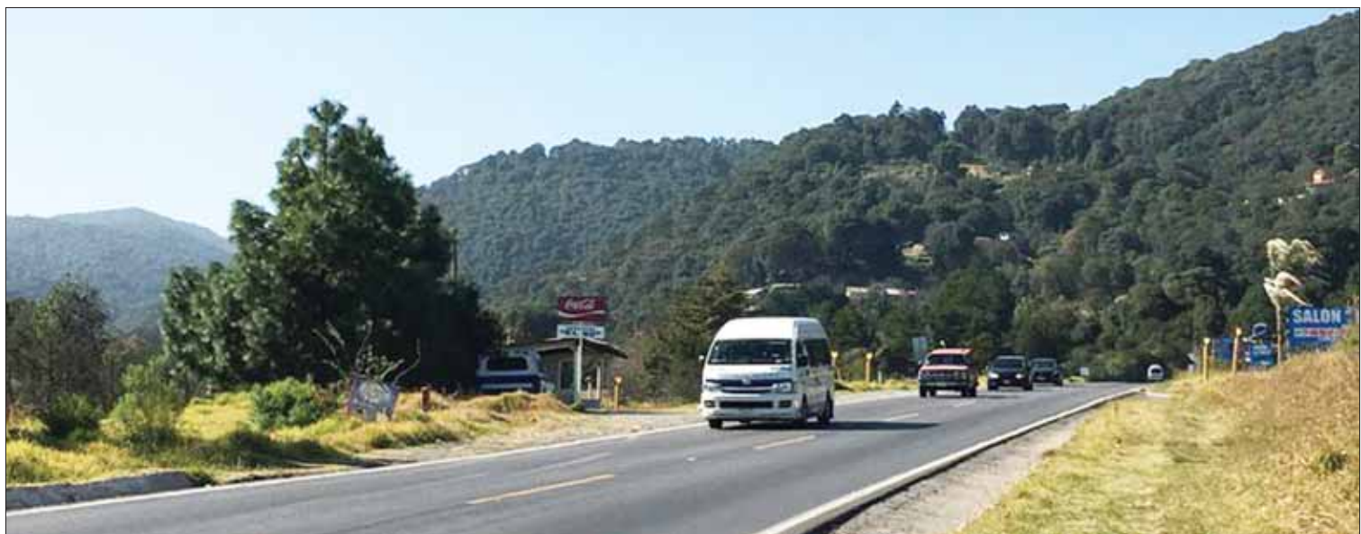
MENSAJE. La dependencia agradece la paciencia y comprensión ante las molestias temporales de esta obra que permitirá mejorar la movilidad de manera segura.

"Los empleados del gobierno estatal conocen la situación por la que atraviesa la administración estatal, al no tener los recursos económicos suficientes para dar respuesta a las peticiones de la clase trabajadora". (Alberto Quintana)