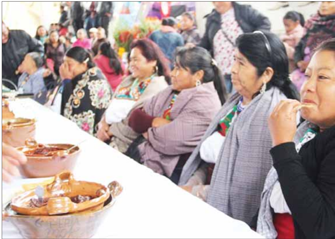
MEDICIÓN. Para la elección de los tres primeros lugares se calificó la presentación del platillo, sabor y textura del mismo, así como la vestimenta de quien lo presenta y la exposición en la lengua indígena otomí o español.

Para la elección de los tres primeros lugares se calificó la presentación del platillo, sabor y textura del mismo, así como la vestimenta de quien lo presenta y la exposición en la lengua indígena otomí o español.