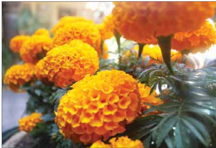
REFLEJOS. Esta misma semana tendrán balance general sobre las ventas; adelantan que fue una de las mejores temporadas en los últimos 15 años.

Luego de una jornada en la que incrementó la cosecha y venta de cempasúchil, productores afirmaron que la calidad de la misma incrementó hasta en un 50 por ciento con respecto a otros años, lo que les permitió que distribuidores otorgaran preferencia a la adquisición de la misma a