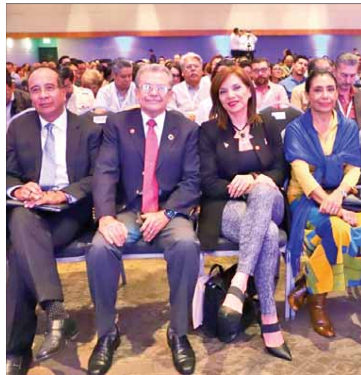
CAMINOS. Recibe secretario de Salud galardones nacionales y reconocimientos por mayor esfuerzo y desempeño en la implementación de programas estatales.

bernador, Omar Fayad Meneses, es el eje angular de la plataforma.