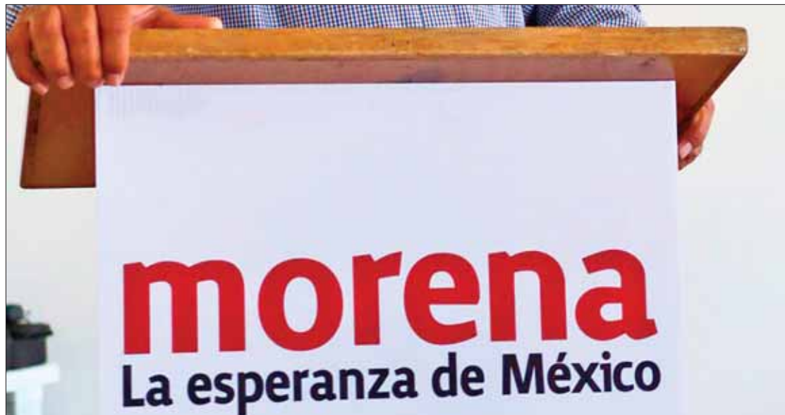
DETERMINACIÓN. Solicitud será presentada ante el Consejo Nacional, aplica sólo para el caso de Hidalgo.

El próximo 10 de noviembre llevarán a cabo el Consejo Nacional, integrados por 300 "morenistas" de todo el país entre delegados distritales y por asignación estatutaria, en dicho cónclave prevén la revisión, análisis y discusión de la sentencia del Tribunal Electoral del Poder Judicial de la Federación (TEPJF), la cual anuló la convocatoria y padrón del partido a utilizarse en los diferentes procesos de selección de cargos partidistas.