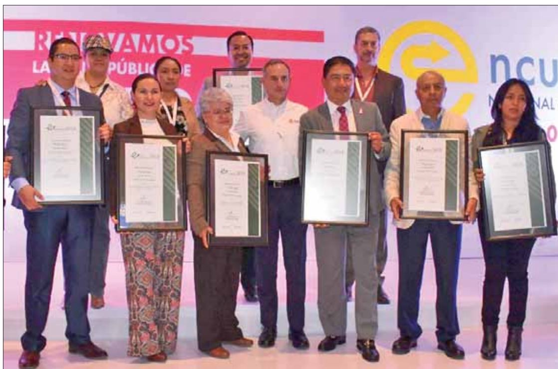
Manifestó Marco Antonio Escamilla que estos premios representan el esfuerzo de cómo ha incidido el estado en programas de prevención, en donde se pone de manifiesto que la salud pública para el gobernador, Omar Fayad Meneses, es el eje angular de la plataforma.

■ Figuró entre las entidades mencionadas durante el Encuentro Nacional de Salud Pública 2019 "Renovamos la Salud Pública de México"; titular de la SSH atestiguó la entrega de reconocimientos a los que se hizo acreedora la entidad, por desempeño