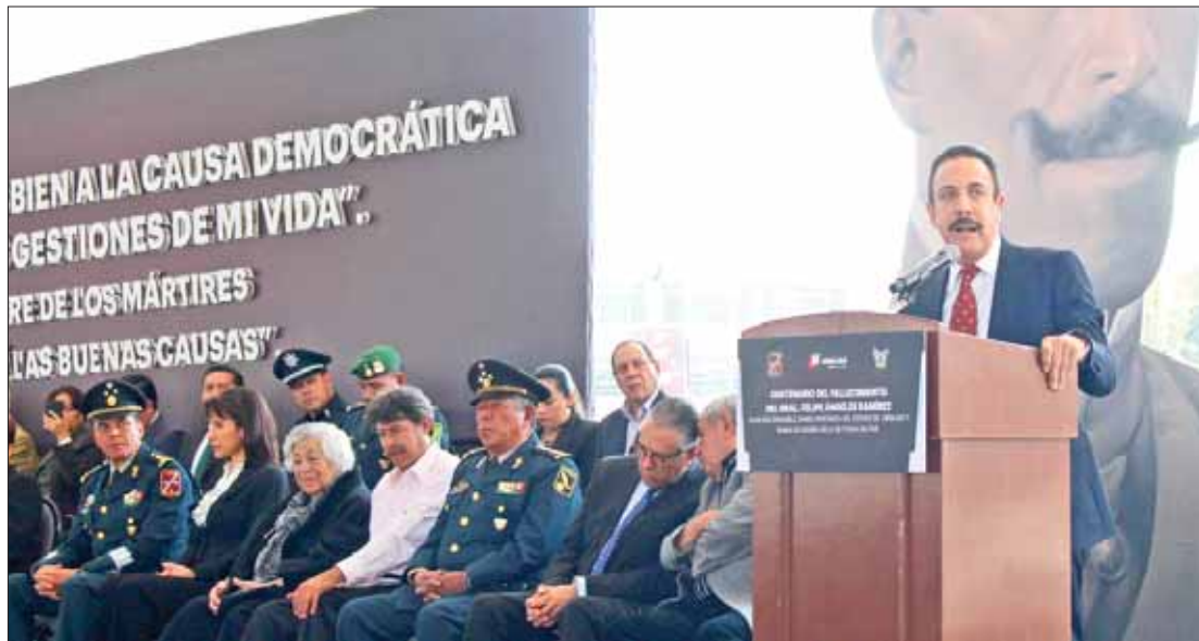
Encabezó gobernador Omar Fayad ceremonia para conmemorar el centenario del fallecimiento del general revolucionario Felipe Ángeles.

Indicó que esta situación generó marchas. .3