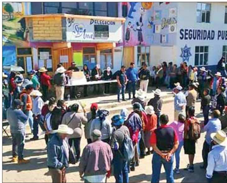
PREMISA. Establecer si se dio o no cumplimiento a la obligación de convocar oportunamente a los integrantes de la comunidad.

Lo anterior para estar en la certeza de que la voluntad de quienes viven en Santa Ana Hueytlalpan haya quedado plasmada en un acta o en cualquier