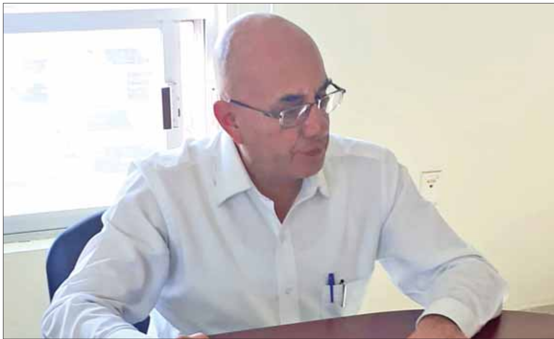
LEMAS. Actividades deben realizarse de manera permanente.

En lo que corresponde a la Instancia Municipal para el Desarrollo de las Mujeres, ésta trabaja constantemente en prácticas de sensibilización, asesoramiento e igualmente con jornadas informativas para promover a la red de servicios de la dependencia en colonias y comunidades del municipio. (Redacción)