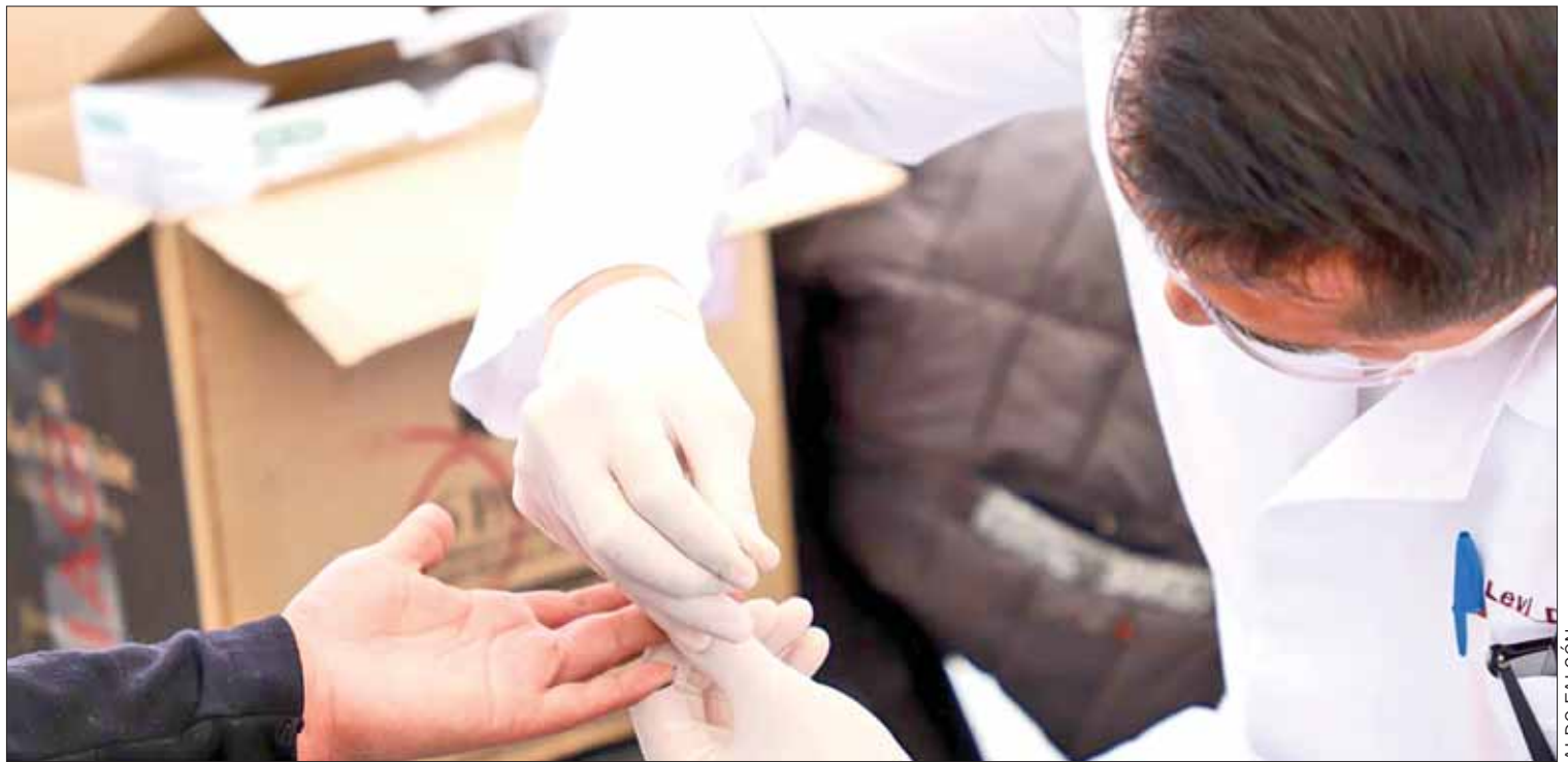
CIFRAS. Según estimaciones del Onusida, 2.2 millones de personas vivían con el virus en Latinoamérica, de las cuales 207 mil 369 mil son de México.

Sin embargo, recordó que las acciones no culminan y este 1 de diciembre se llevará un mensaje de compasión, esperanza, solidaridad y comprensión sobre el Sida. (Redacción)