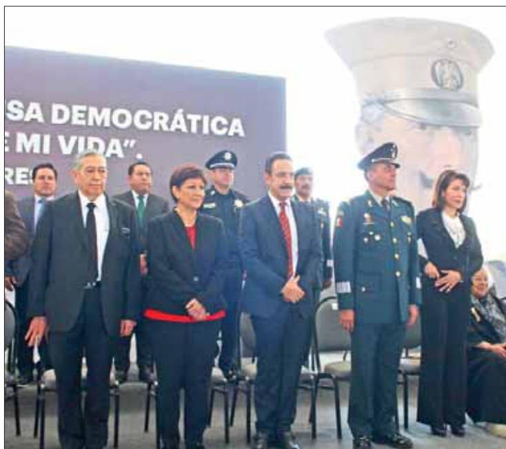
INTERESES. Expuso que Grupo Universidad puede estar detrás de falsos argumentos.

La responsabilidad del gobierno hidalguense es dar respuesta a las demandas sociales y no permitir psicosis en la entidad