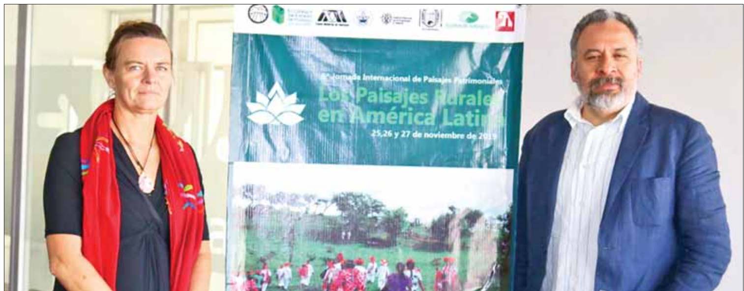
CONOCIMIENTOS. Habrá presencia de funcionarios estatales, así como académicos y especialistas, informó el organismo.