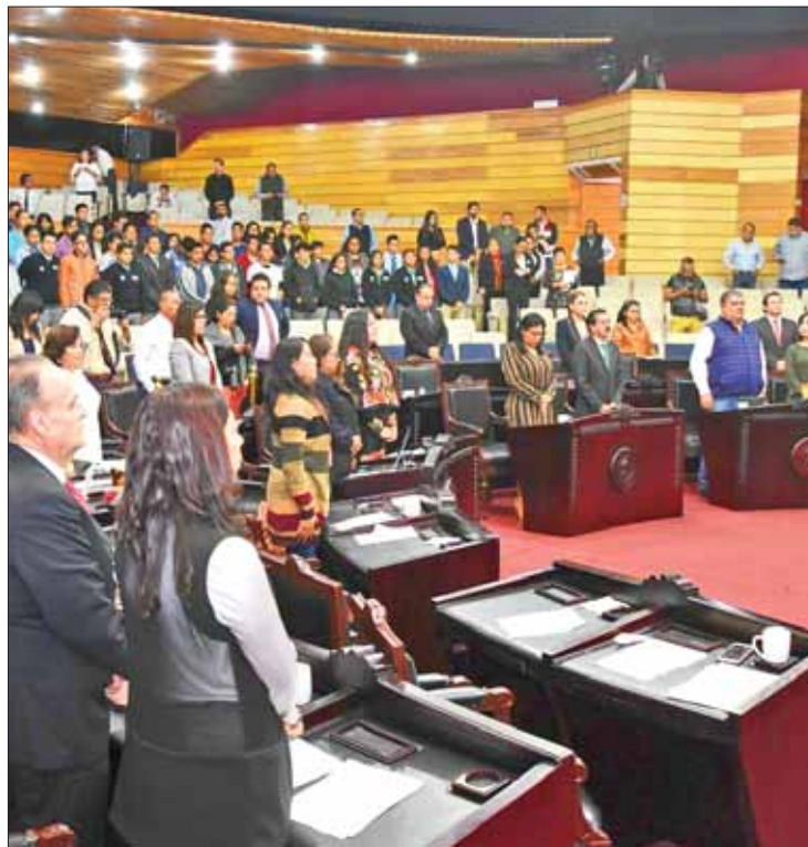
MISIÓN. Salieron a la defensa algunos integrantes del Morena.

tó a la LXIV Legislatura a que en el debate del presupuesto estatal atienda rezagos y necesidades sociales, en materia de derechos humanos, culturales, de género, laborales, alimentación, entre otros.