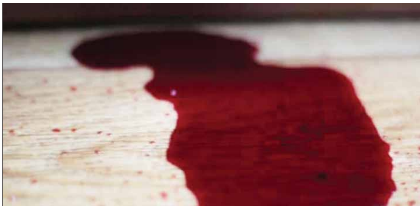
FINALIDAD. Generar estrategias que tengan un mayor impacto para frenar los asesinatos, ya que los esfuerzos que hay hasta el momento no han hecho eco, según expresaron.

Por su parte, la Procuraduría General de Justicia del Estado de Hidalgo lleva acreditados a la fecha, 17 feminicidios.