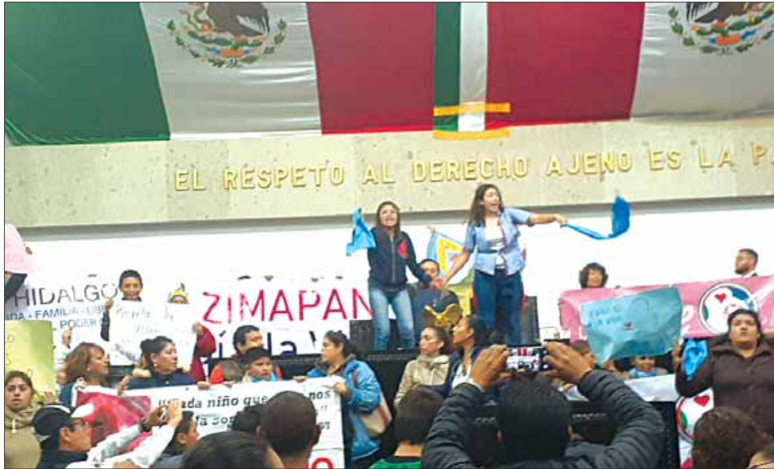
TESITURAS. Con el único interés de salvaguardar la integridad y derechos de quienes laboramos en el Poder Legislativo.

Los más de 100 inconformes, quienes rechazan la iniciativa para despenalizar el aborto en Hidalgo, invadieron el recinto de la soberanía e impidieron el desahogo de los puntos del orden del día, por