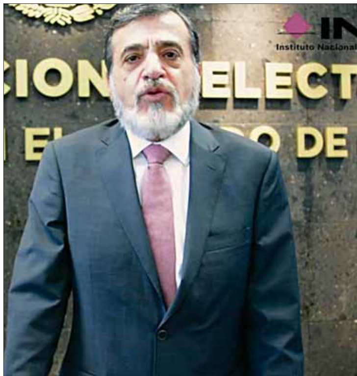
INSTRUCCIÓN. Comprende a los capacitadores y supervisores electorales, quienes apoyan a los ciudadanos que son insaculados como funcionarios de casilla.

Por ello, lanzarán la convocatoria para la contratación de los capacitadores y supervisores, quienes comenzarán a laborar a principios de febrero y hasta pasada la jornada electoral