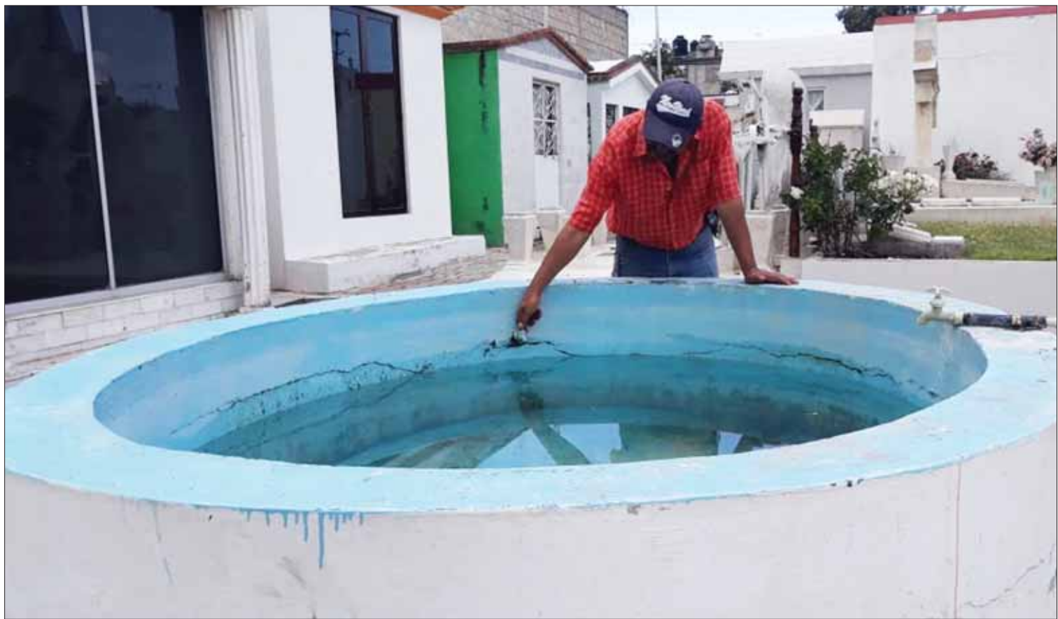
CARACTERÍSTICAS. El agua con la que la población cuenta cumple con las normas adecuadas para su uso, además de que antes de proceder al llenado de tanques se revisará que estos se encuentren con las condiciones óptimas de limpieza.

Para evitar presencia de basura en vía pública se aplican estrategias tales como: programas de sensibilización así como el Reglamento de disposición de residuos, en el cual ya han sido sancionadas a personas que dispusieron incorrectamente desechos domiciliarios y comerciales. (Redacción)