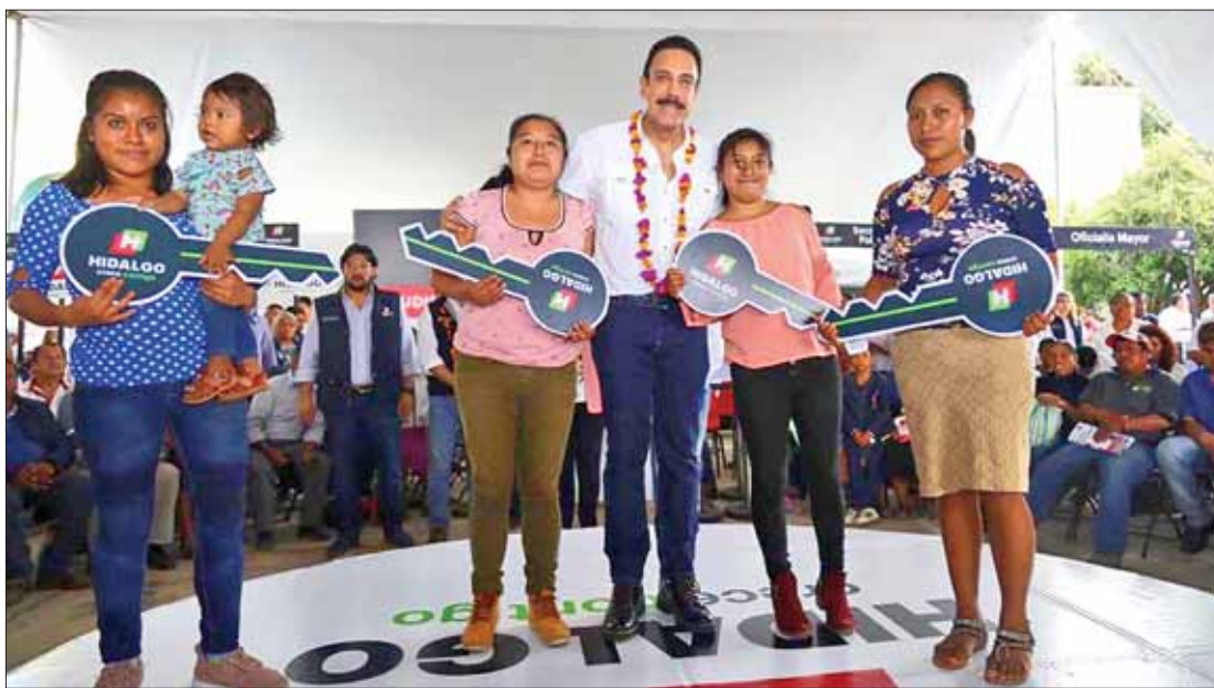
Atendió el gobernador Omar Fayad a población de Huazalingo, durante audiencia pública con su gabinete.

Según la investigación, Lorena abordó el vehículo de la pareja implicada y se dirigieron a un domicilio en Tizayuca. .3