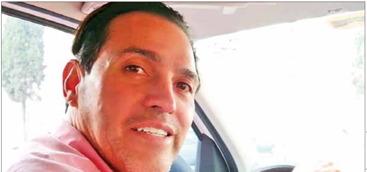
DETRÁS. Labor es impulsada por el expresidente Felipe Calderón y su esposa Margarita Zavala.

En tal sentido precisó que desde que empezaron las asambleas distritales federales, menos del 5 por ciento de participantes son personas que ya habían participado en un partido político como tal, por lo que descartó que en su mayoría México Libre sea integrado por antiguos militantes panistas.