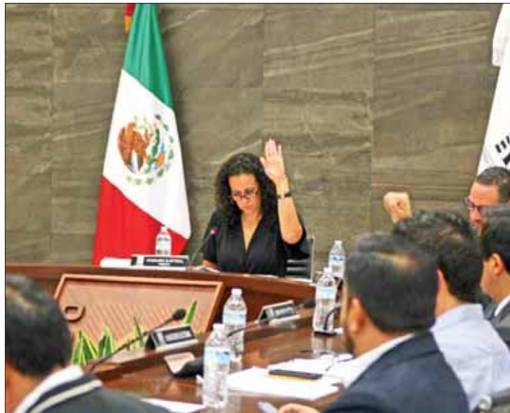
VIAS. Los montos fueron enviados por la Unidad de Fiscalización del Instituto Nacional Electoral.

México sólo adeuda 10 mil 557.53 pesos del remanente original de 2 millones 536 mil 464;