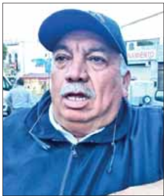
EXHORTO. Piden a padres de familia evitar que los niños jueguen o tengan contacto con ésta.

► Mencionan autoridades de Tulancingo que han recibido reportes frecuentes sobre quemas de este material, en diversas colonias