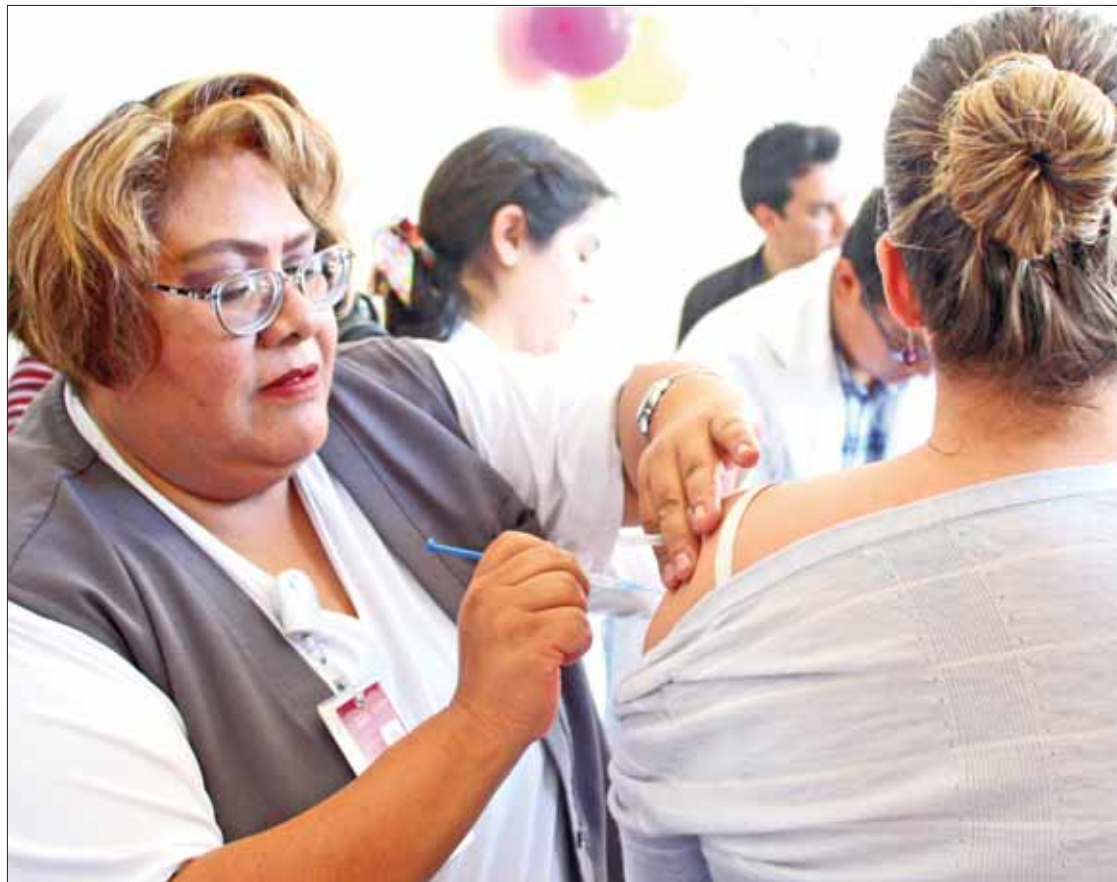
VALOR. Es una de las mejores herramientas para la protección, pero debido a la variación antigénica del virus debe repetirse anualmente.

El llamado a la población en general es acudir a recibir la dosis de manera oportuna en los próximos días a las clínicas y hospitales del Sector Salud.