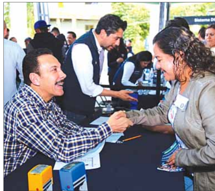
ACCIÓN. Los servidores públicos del gobierno estatal tienen la instrucción de atender a todas las personas.

Para finalizar, ayer puntualizó que los servidores públicos del gobierno estatal tienen la instrucción de atender a todas las personas, las brigadas médicas móviles no se retirarán hasta brindar atención a toda la población presente.