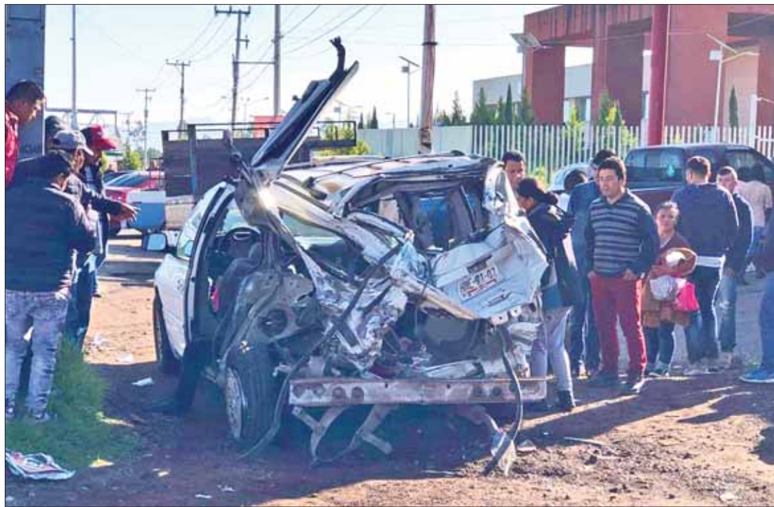
CLÁUSULAS. La premisa del jefe del Ejecutivo en Tulancingo es evitar nuevos percances en la bajada del corredor vial San José, como el suscitado el 4 de noviembre.

VÍA Petición institucional ante la Policía Federal y la SCT para vigilancia y señalamiento