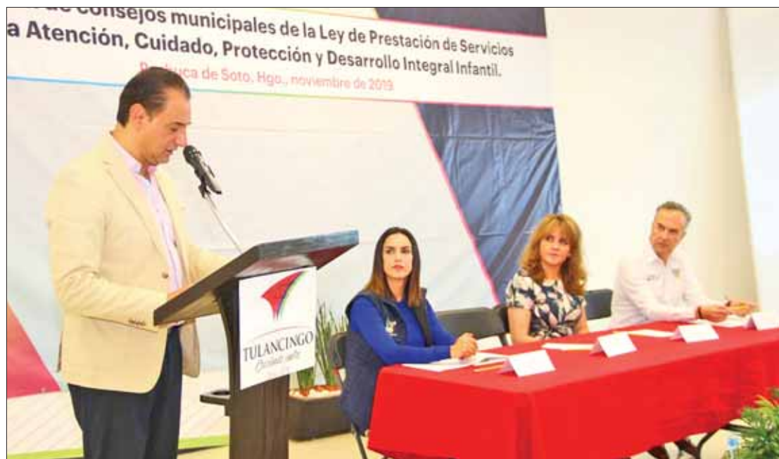
FIN. Atención para menores de 5 años de los municipios de esta región de Hidalgo.

que se realizará un registro de los espacios que se destinan para la guarda y custodia de los infantes, una vez identificados se hace un diagnóstico y un plan de intervención que permite capacitar al personal y revisar los inmuebles en materia de Protección Civil y Seguridad.