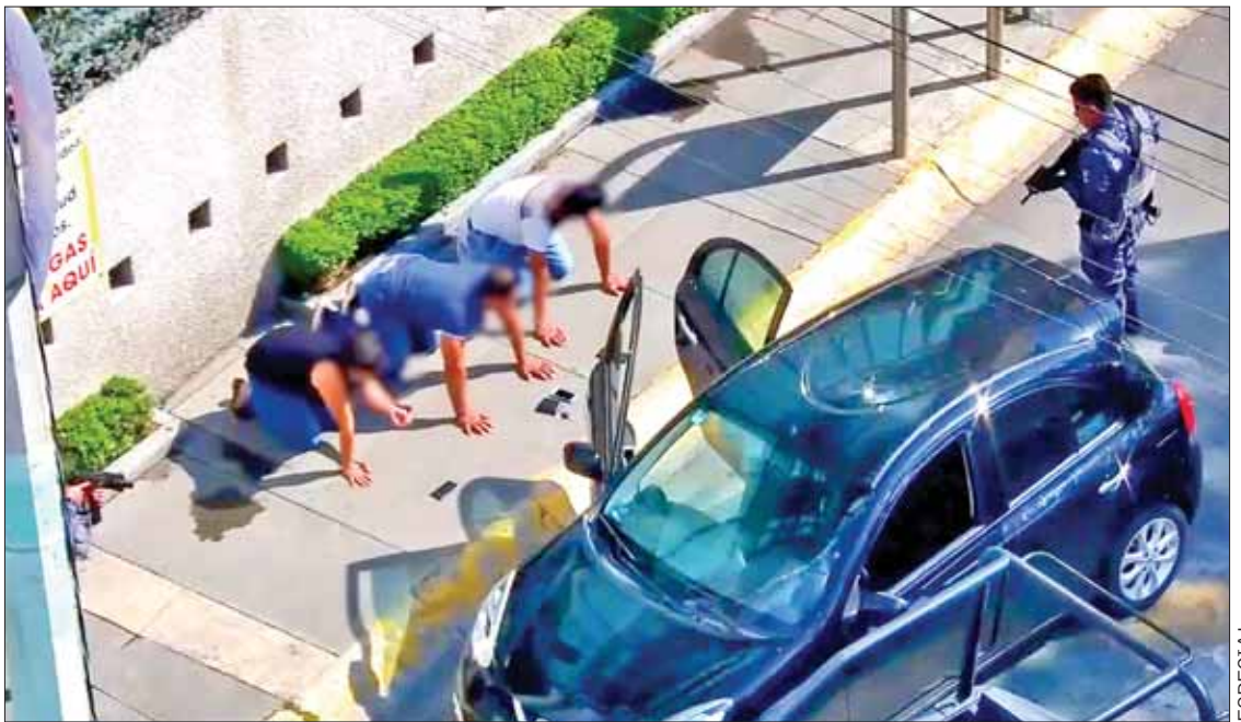
REPORTERÍA AL 911. Presunto asalto en sucursal bancaria, ubicada en una plaza de Mineral de la Reforma; detención fue en San Javier, Pachuca.