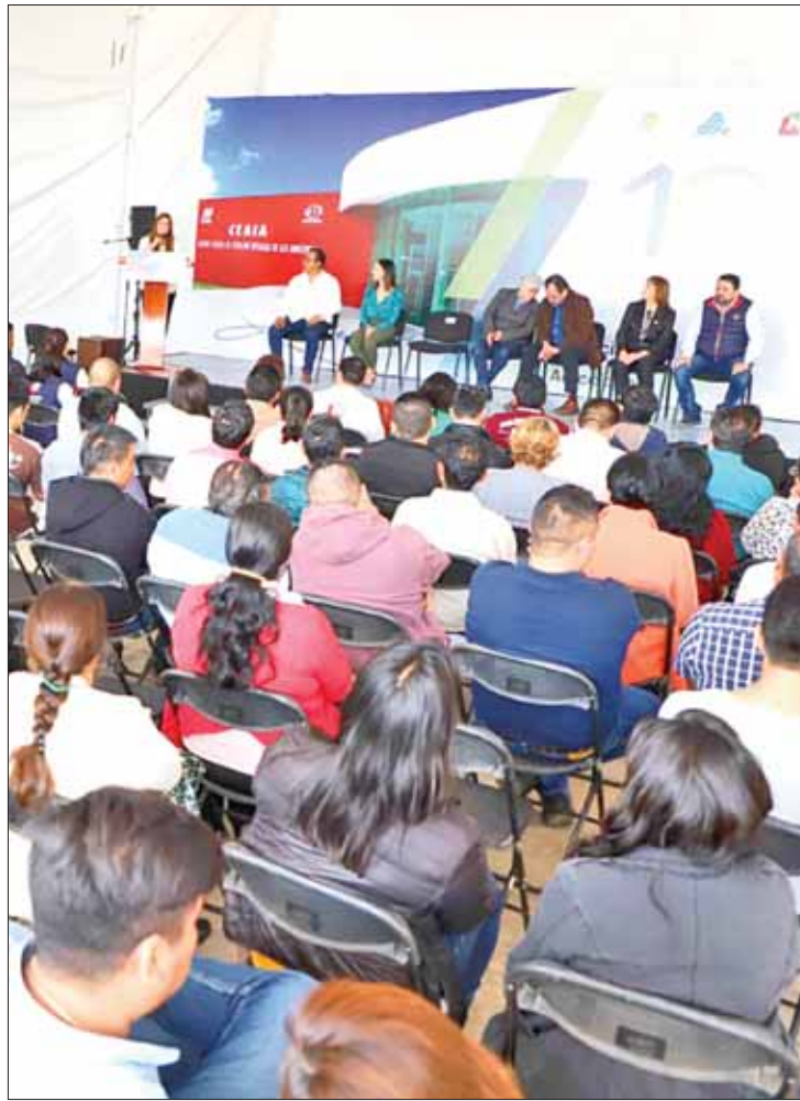
SSH. Trabaja de manera permanente para generar acciones preventivas y de atención.