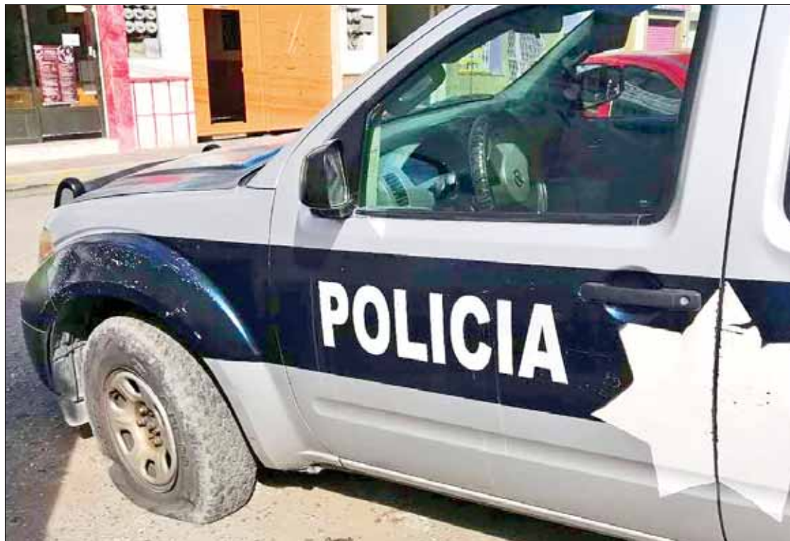
RETOS. Uno de los temas más relevantes es la discusión sobre las cifras destinadas al Fortaseg, hacia los ayuntamientos.

Vamos a esperar como viene el tema de la federación: Guerrero Trejo