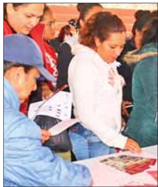
NOVIEMBRE 12. Estudio de colposcopia.