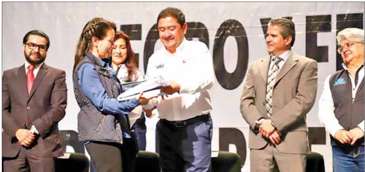
CIMIENTOS. Recordó Escamilla que estos planes comparten la visión del gobernador Omar Fayad.

Reiteró que a esta estrategia se suma la inclusión de Hidalgo al Movimiento Mundial de Seguridad por el Paciente, que lleva implícita la conjunción de acciones que permitan disminuir los eventos adversos y riesgos que un paciente corre al interior de los hospitales y que derivado de ellos podría culminar en muertes prevenibles.