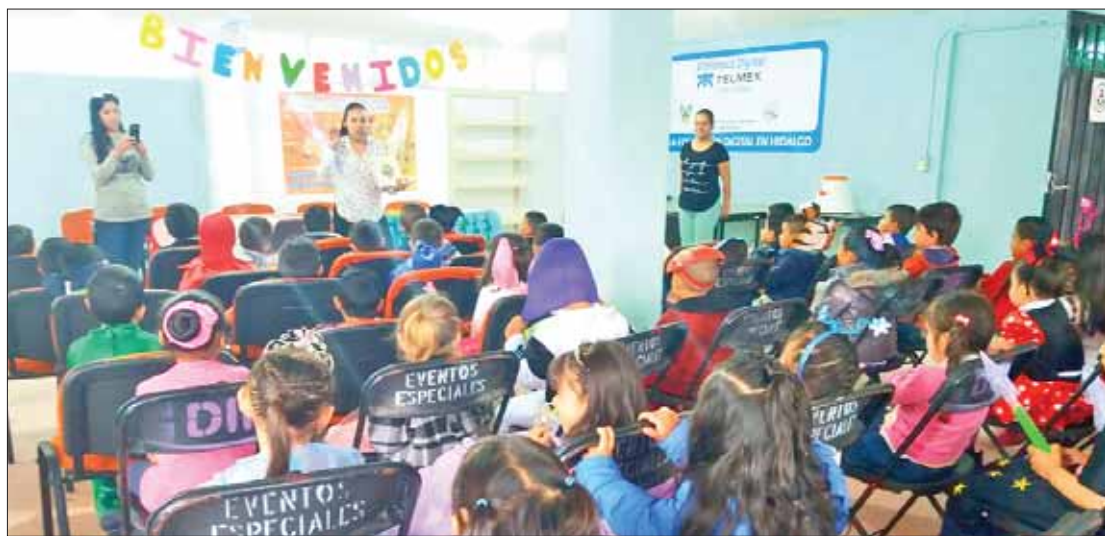
TULANTEPEC. Inversión será de 9 millones 329 mil 327.25 pesos.

Desde enero de 2018, las instalaciones del CAIC fueron adaptadas a un costado de la Junta Municipal para el Des-