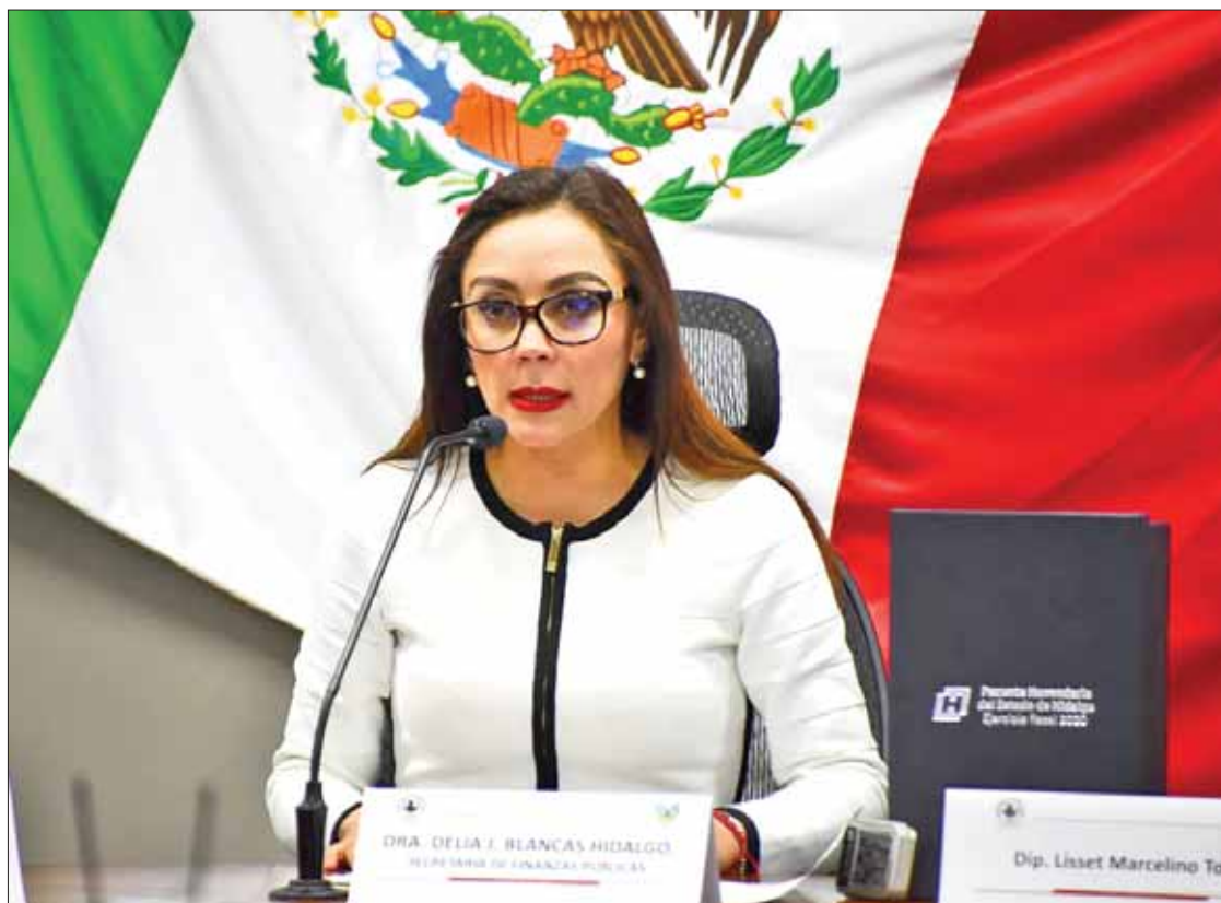
SOLIDARIDAD. Pormenorizó la titular del ramo en la entidad montos, además de descartar la creación de nuevos impuestos.

A entidades paraestatales y organismos, 29 mil 786 millones 024 mil 067 pesos, finalmente a ayuntamientos una cantidad etiquetada de 8 mil 682 millones 159 mil 775 pesos.