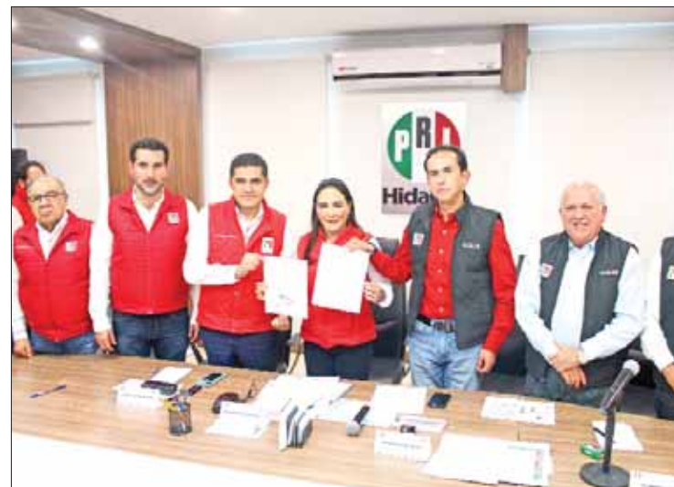
REUNIÓN. Adelantó posible visita de Alito para el 15 de diciembre.

la visita del presidente nacional, Alejandro Moreno Cárdenas, pormenorizaron que es posible su arribo a Hidalgo el próximo 15 de diciem-