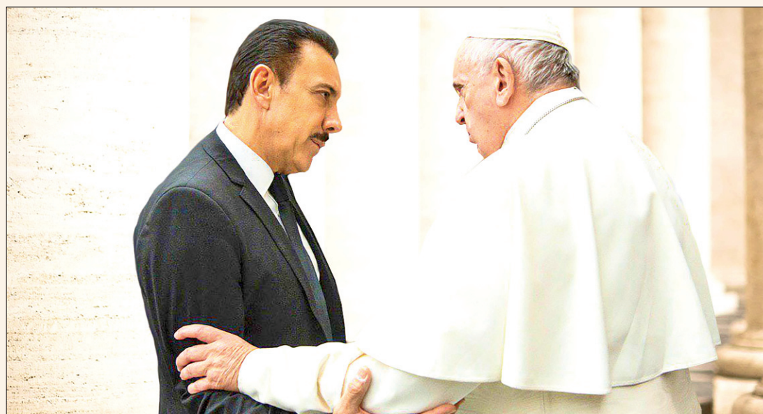
Fue recibido el gobernador Omar Fayad por el sumo pontífice de la Iglesia Católica, en el Vaticano.

Ante tal descarte en el pleno, nuevamente sometieron a votación si tal dictamen lo regresaban a comisiones para su posible reforma; sin embargo, por 16 sufragios en contra y 13 a favor desecharon el asunto. .4