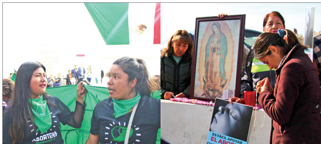
TIANGUIS. Discusión se dio entre gritos, presencia de grupos provida y defensores de derechos feministas.

► Rechazaron posibilidad de ILE pese a ser un tema de la agenda promovida por el partido a escala nacional