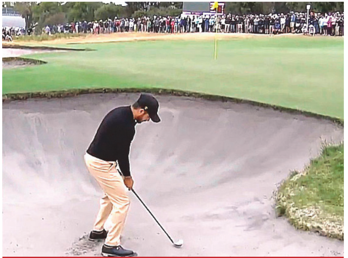
El mexicano Abraham Ancer hizo un gran tiro desde el banco de arena, pero la bola se quedó en la orilla del hoyo.

A ellos se sumaron Hideki Matsuyama y CT Pan, quienes tras un gran acierto del japonés en el hoyo 17, se pusieron arriba por uno para vencer a Patrick Reed y Webb Simpson.