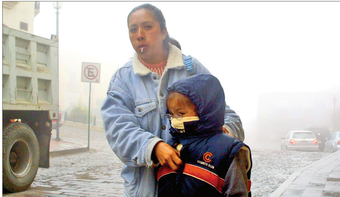
CONDICIONES. Permanece Frente Frío 22 estacionado sobre el Golfo de México.

El objetivo de este anuncio es reducir los gastos que hacen los padres de familia previo a agosto. (Adalid Vera)