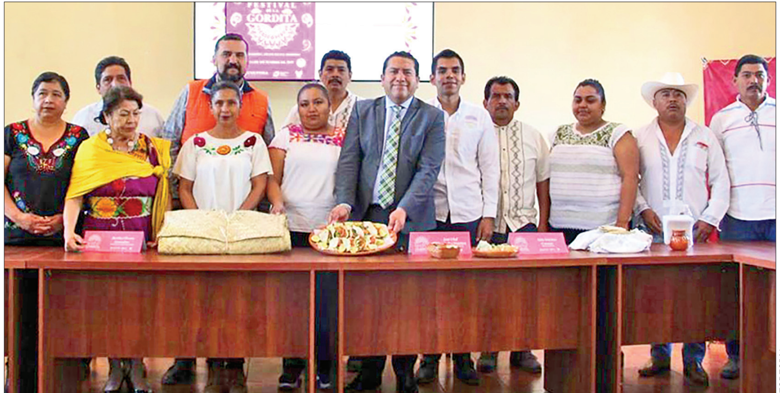
FÓRMULA. Apoya la actividad por medio del programa Pacmyc y grupos artísticos para enriquecer la edición 2019.