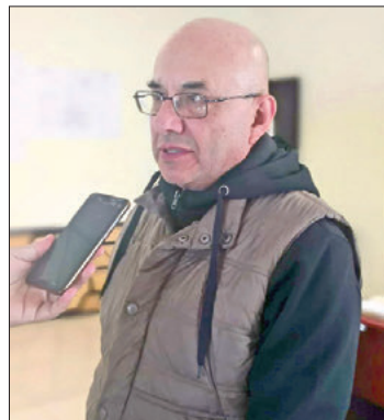
SERVICIOS. Detalló anomalías identificadas por organismo.

"Este tipo de actos nos cuestan a todos, sobre todo a quienes verdaderamente están siendo puntuales con el pago del servicio, ya que terminan subsidiando a quien no lo hace, además de que muchas tomas están conectadas a