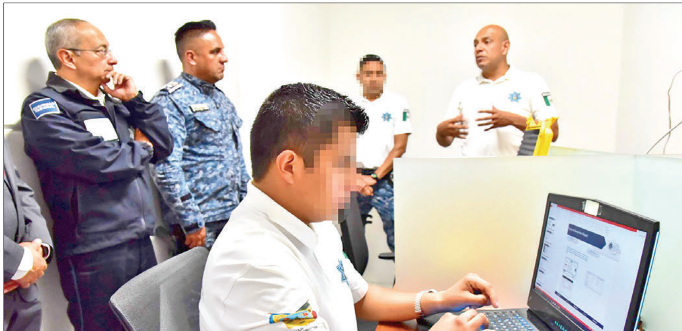
MODALIDAD. El comisario general de la Agencia de Seguridad Estatal, Uriel Moreno Castro, encabezó la entrega de constancias a los oficiales tras finalizar el Curso de Especialización de Unidades de la Policía Cibernética en su Fase Dos.

titular de la Policía Cibernética de Hidalgo, aseguró que la capacitación del personal permite complementar el trabajo operativo de la estrategia Hidalgo Seguro, mediante el uso efectivo de la tecnología e inteligencia que integra el Centro de Con-