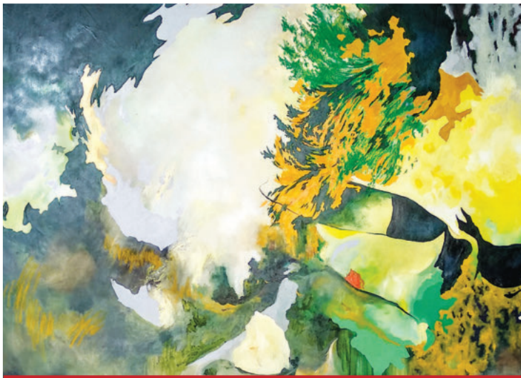
Al sur, Leonora Serra, una de las obras que se exhibe en el Foto Museo Cuatro Caminos.

“Esta exposición corona el esfuerzo de los jóvenes con respecto a las becas que ellos tienen; con esto dan cierre al proceso de realización de cada uno de los proyectos que se comprometie-