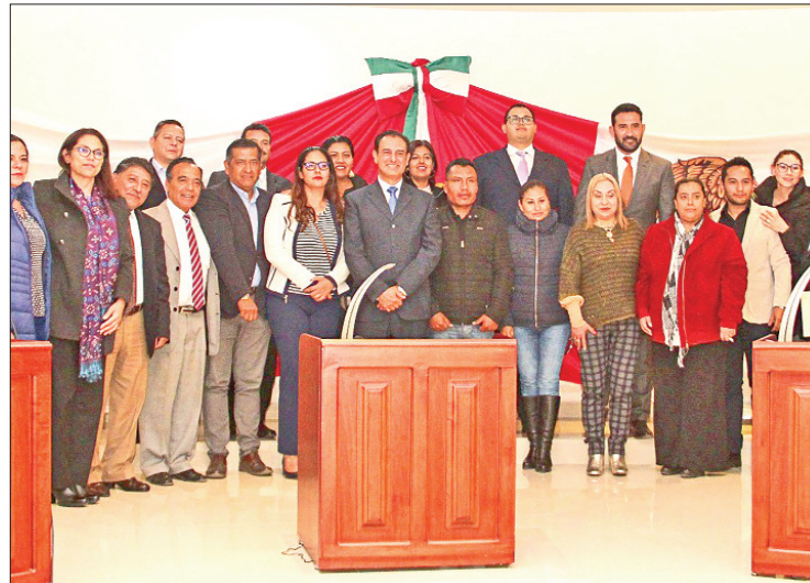
FORMATOS. El objetivo es que el presupuesto esté apegado a los requerimientos específicos por cada área, dependencia y organismo del gobierno municipal.

Para una atención particular, se estableció una calendarización de mesas de trabajo las cuales comenzaron el pasado 6 de diciem-