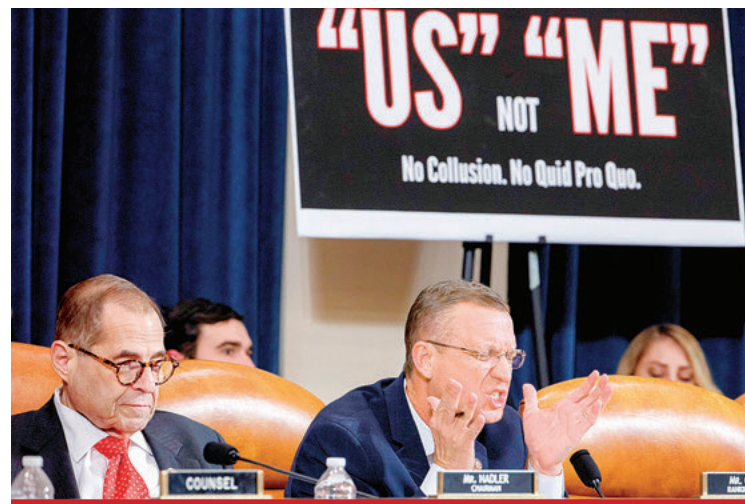
El presidente del Comité Judicial, Jerry Nadler (izq.), al lado del republicano Doug Collins, ayer.

Sin embargo, caída la noche, la enmienda fue descartada por la mayoría demócrata en el Comité, por 23 votos a 17. El presidente