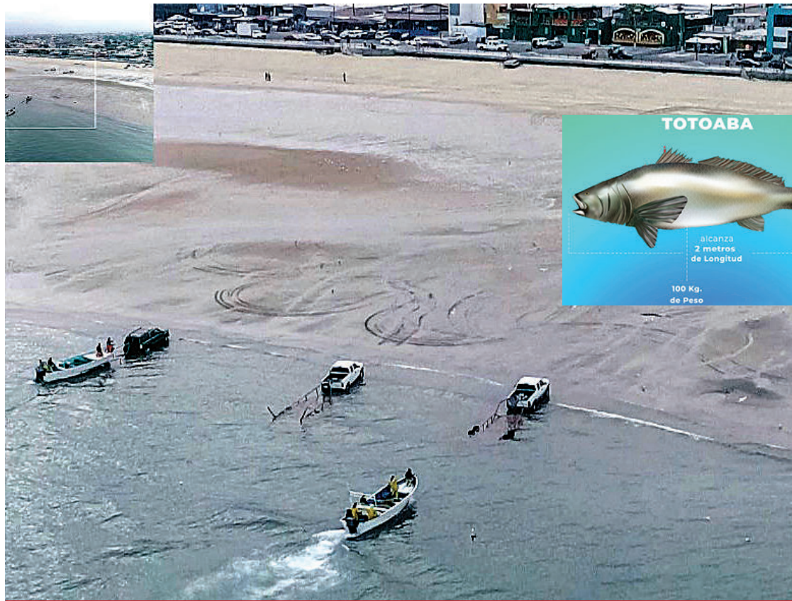
A plena luz del día camionetas arrastran a tierra embarcaciones de pescadores con totoaba, en el Alto Golfo de California.

Entra hasta la Secretaría de Relaciones Exteriores de Marcelo Ebrard, señaló, “porque el tema de la totoaba que se consume en Chi-