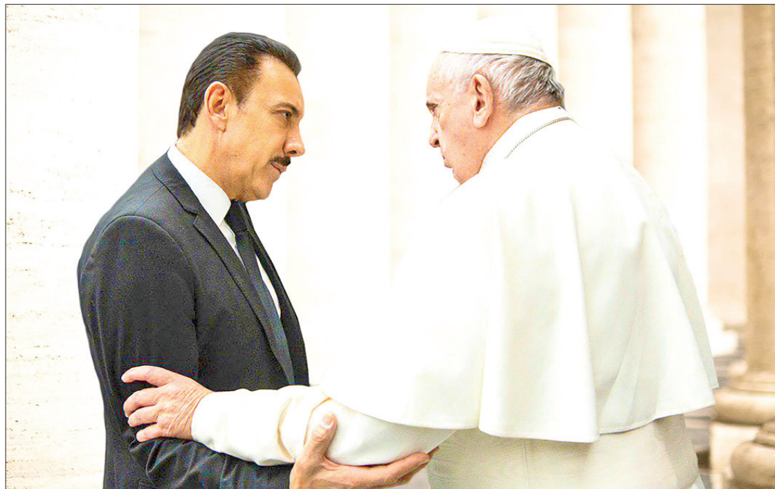
RIQUEZA. En la sede de la Iglesia Católica se presenta una muestra del trabajo artesanal hidalguense.

Esta plataforma de promoción, dijo el mandatario estatal, servirá para continuar posicionando la marca Hidalgo, que promueve la comercialización de productos con mayor valor y