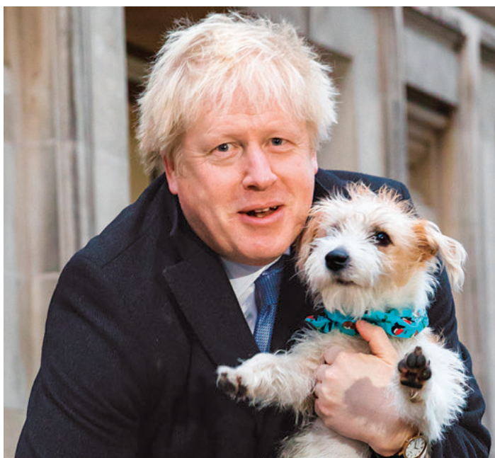
Boris Johnson votó acompañado de su mascota.

do nacional que pedía abiertamente la permanencia del Reino Unido en Europa. Los Liberal Demócratas (LibDem) apenas lograron un escaño y estarían representados en el Parlamento por 13 comunales.