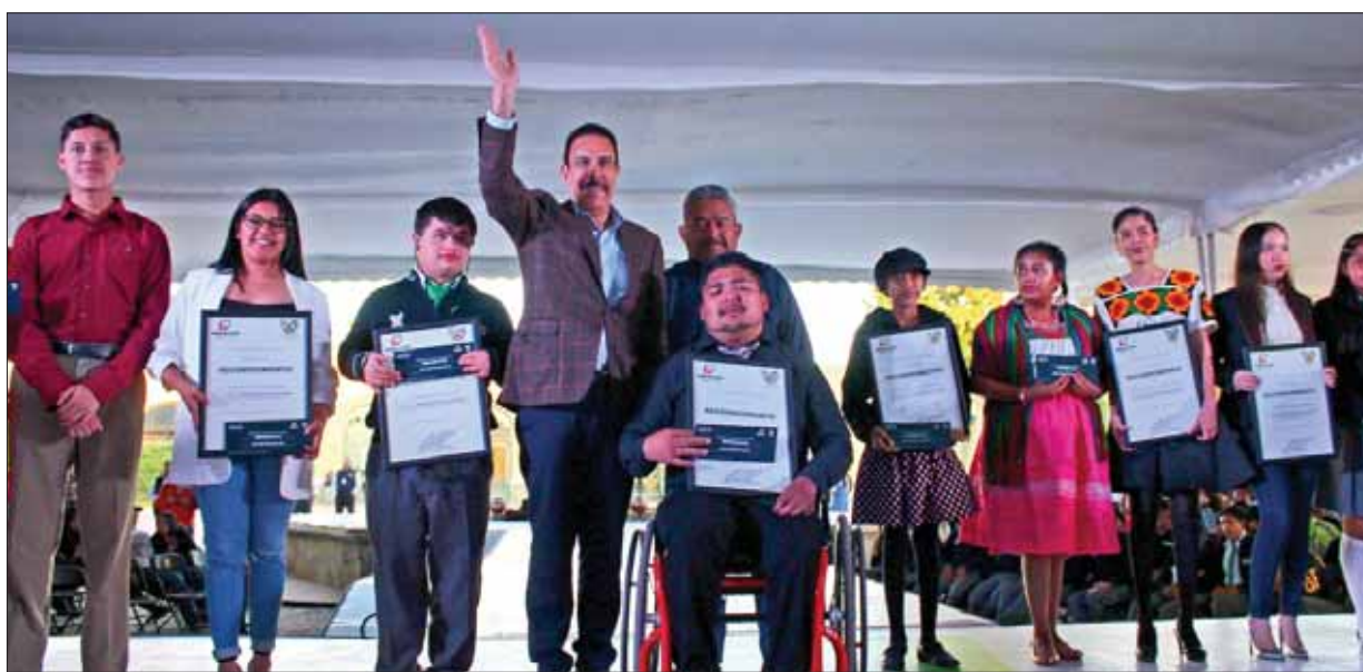
Entregó el gobernador de Hidalgo estímulos y diplomas a los ganadores del Premio Estatal de la Juventud 2019.