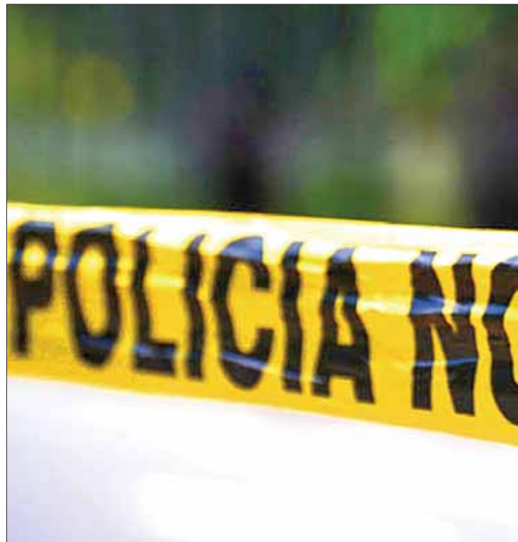
PROTOS. Acudieron elementos de la PGJEH para realizar pesquisas.

Los cuerpos fueron trasladados al Servicio Médico Forense