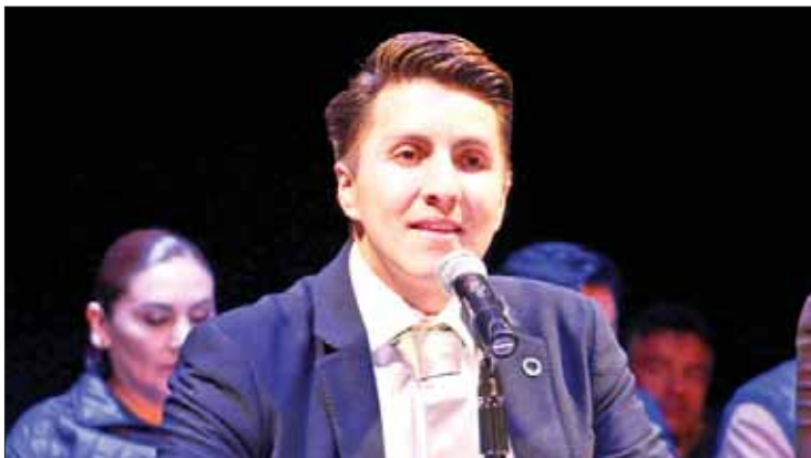
PRECISIÓN. Mayoría derivó de cuentas de las alcaldías.

Recordó que de los 54 millones de pesos que tenían publicados en la Función Pública de 2018, más del 60 por ciento ya fueron solventados y siguen en análisis por parte