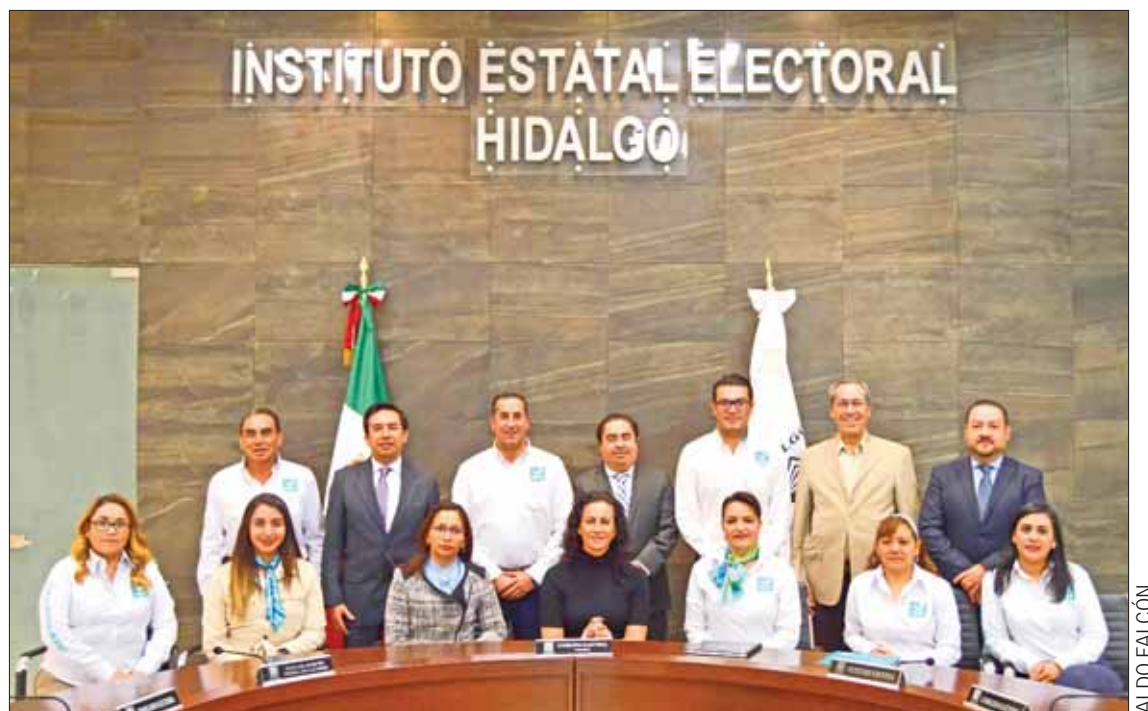
PARTICIPACIÓN. Fueron diversos temas los que ordenó el máximo órgano electoral restablecer para la próxima contienda.

1. "Se ordena al Consejo General del Instituto Electoral, hacer la corrección pertinente en materia de paridad de género, en cuanto hace a la mención textual de