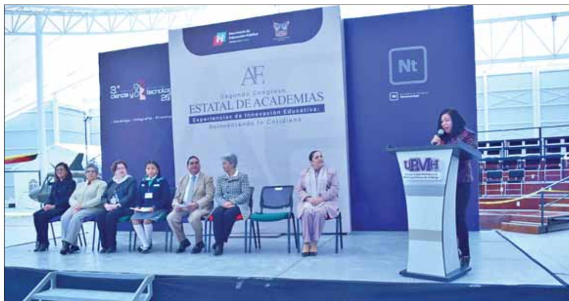
TRAYECTORIAS. Reunió a docentes y órganos colegiados para fomentar acciones y estrategias a favor de esta materia.

Los 660 mil estudiantes y más de 35 mil docentes pasarán dos semanas y media en casa con sus familias o aprovecharán para hacer paseos y actividades recreativas. (Adalid Vera)