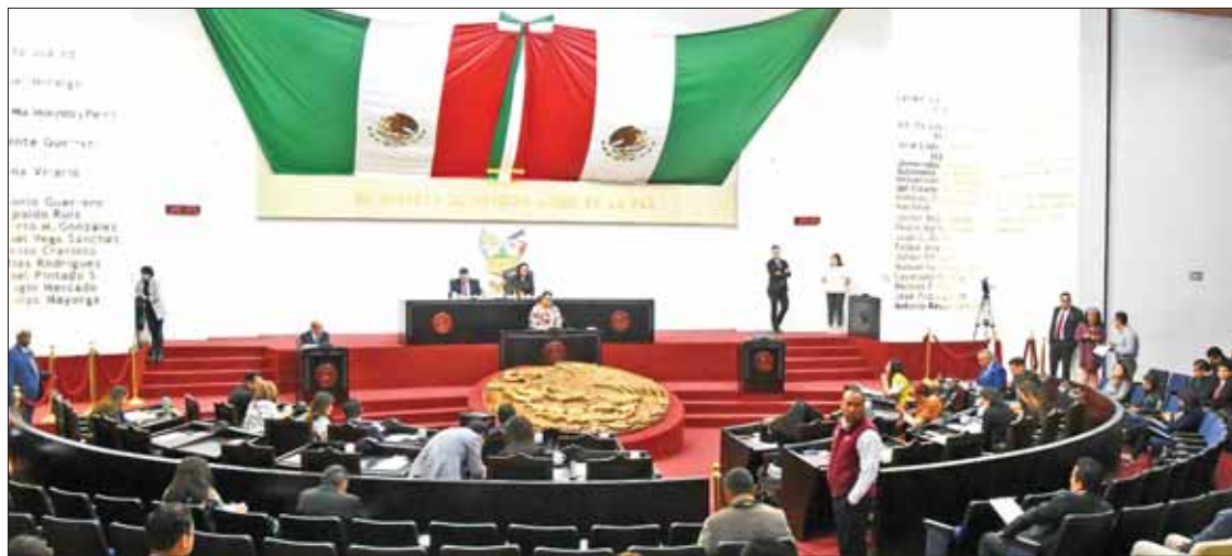
TAREAS. En próximas fechas someterán al pleno el mencionado dictamen en Comisión de Legislación y Puntos Constitucionales.

► Para que juez determine cuál es mejor opción sin prejuicios de género, para tema de patria potestad