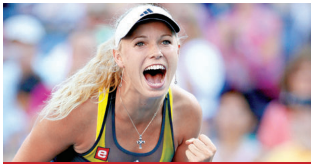
Aclara que no tiene problemas de salud.

«Siempre me dije, cuando llegue el momento, hay cosas fuera del tenis que quiero hacer, es la hora de