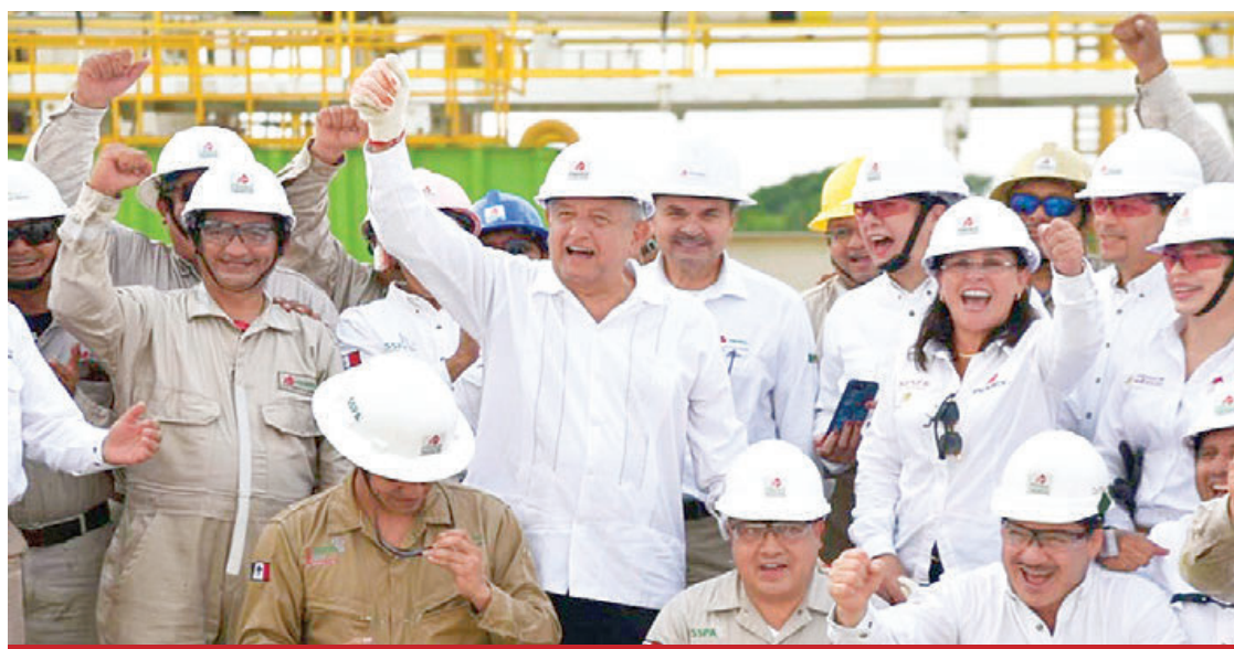
El presidente Andrés Manuel López Obrador celebró la noticia.

NUEVOS CAMPOS Y POZOS EN EL ESTADO. El director general de la empresa productiva del