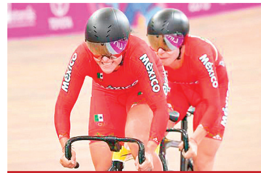
Se mantienen en el Top Ten.