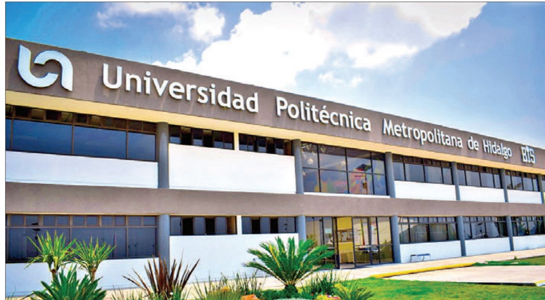
RAMOS. Representa una buena oportunidad para que juventud adquiera experiencia en diversas empresas.

miento mutuo entre los sectores privados en México y Estados Unidos y que el becario se familiarice con el ambiente empresarial de Estados Unidos.