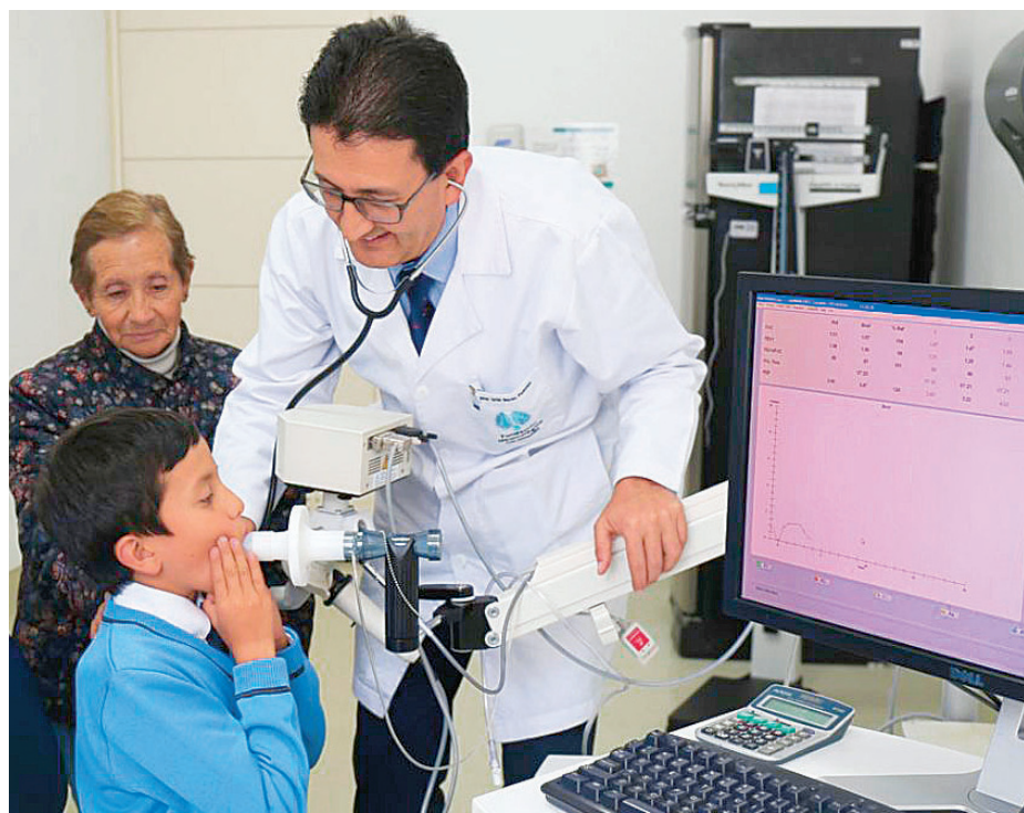
La nebulización permite administrar antiinflamatorios esteroideos y broncodilatadores.

MICROPARTÍCULAS. El uso de nebulizadores se justifica por la necesidad de llevar vapor de agua o micropartículas de medica-