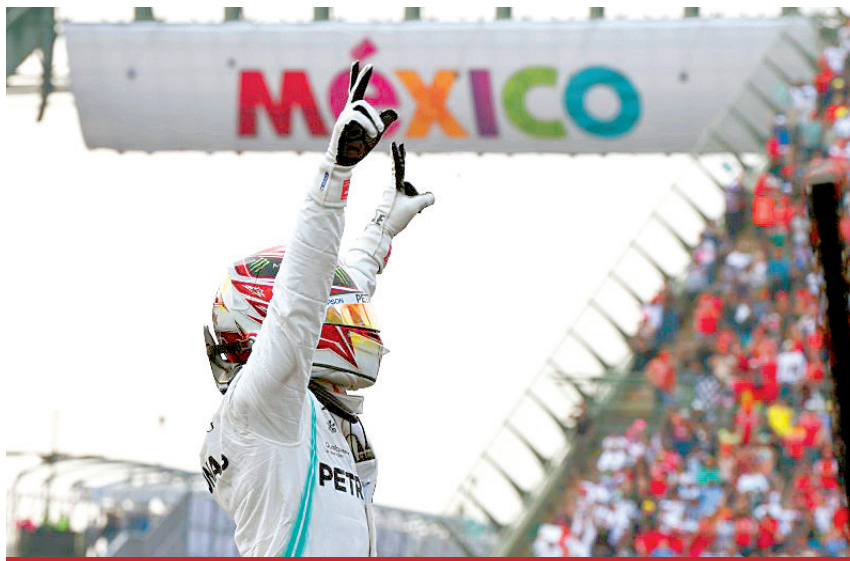
Gran reconocimiento para la organización del evento automovilístico en la Ciudad de México.

La carrera en el Autódromo Hermanos Rodríguez volvió a superarse