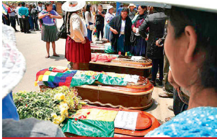
Familiares custodian fétros en Cochabamba, a mediados de noviembre.

El 15 de noviembre, un duro enfrentamiento ocurrió en Sacaba entre grupos cocaleros de Cochabamba, que intentaron en-