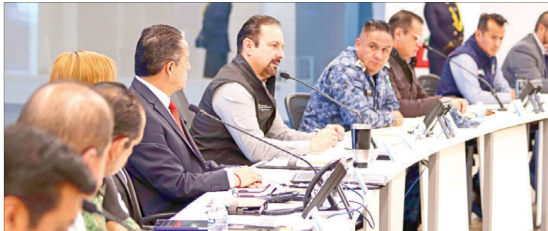
C5i. Acudieron representantes de diversos organismos, quienes reconocieron estos esfuerzos.

El apoyo económico va de 62 mil hasta 300 mil pesos por proyecto, "los cuales requieren de tres personas interesadas como mínimo". (Ángel Hernández)