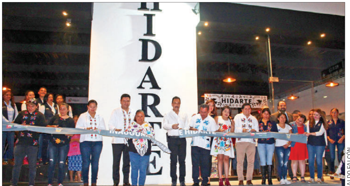
Inauguró Omar Fayad un nuevo espacio para venta de productos hidalguenses.

Consideró que es necesario darle la difusión que merecen las artesanías hidalguenses, porque las grandes marcas de empresas transnacionales utilizan la belleza del bordado sin darle el reconocimiento a la gente que lo realiza. .3