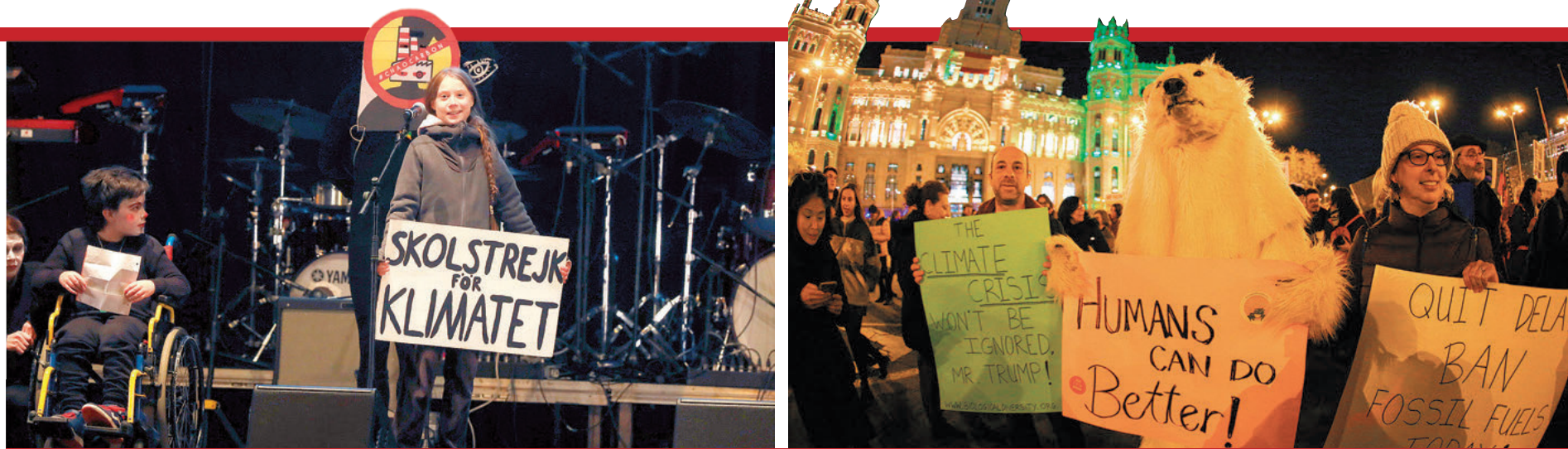
Greta Thunberg lideró la manifestación por la acción contra la emergencia climática, ayer, en Madrid.