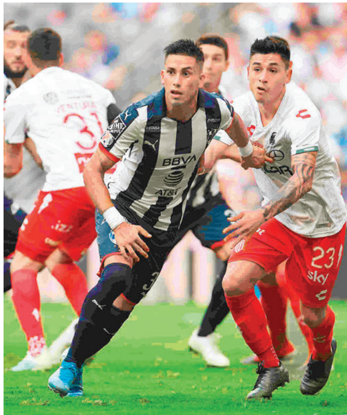
Monterrey llega con sólo un gol de ventaja a la casa del Necaxa.

Monterrey estará en la final si gana o empatar o incluso pierde por diferencia de un gol siempre y cuando los resultados no sean 1-0 y 2-1, estarán en la final si caen 3-2, 4-3, por decir algo.