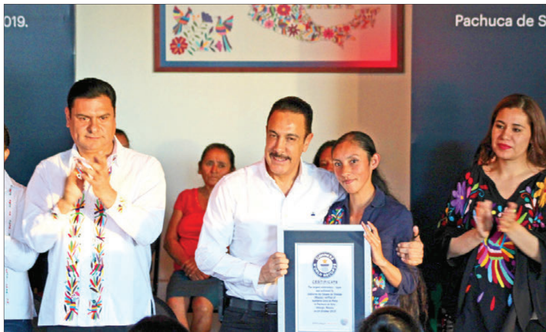
BORDADO. En este marco entregó reconocimiento del Récord Guinness por el tenango más grande del mundo.

Para hacer posible que Hidarte recupere vida y sea apto para los artesanos, más allá de la inversión que se hizo, significó