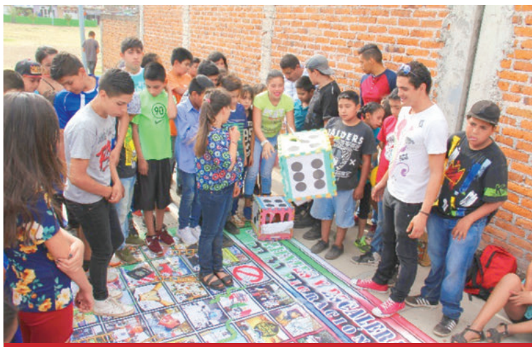
Serpientes y escaleras de la migración.

tan una mejor y no conflictiva reinserción de los migrantes de retorno. “Comuniquémonos con la familia cercana y lejana” es un taller que se orienta a respetar la diversidad cultural; mostrar cómo grupos con distintas tradiciones y creencias pueden convivir armoniosamente en mismos escenarios; enfatizar en la importancia de mantener la comunicación con el pasado, comunidad y familia, valorando costumbres y tradiciones.