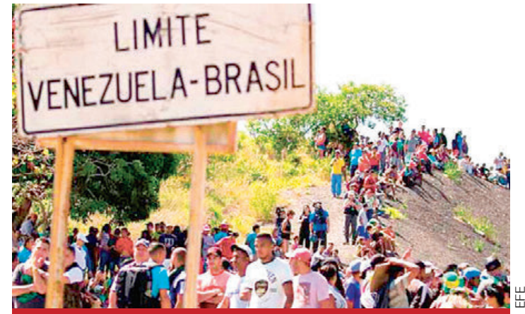
Migrantes en Pacaraima, en la frontera entre Brasil y Venezuela.

Desde las Naciones Unidas indicaron que la misión de observación abogó de nuevo por investigar los hechos de violencia de manera rápida, transparente e imparcial.