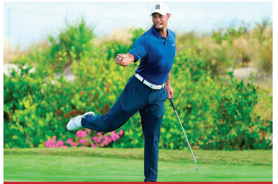
Tiger Woods ha mantenido el ritmo en el último torneo del año.

ANCER SE METE AL TOP 25. Tras un regular inicio el jueves, Abraham Ancer retomó su nivel en la segunda ronda del Australian Open 2019, evento en el que defiende título, y con un recorrido de 66 tiros (-5) ascendió a la