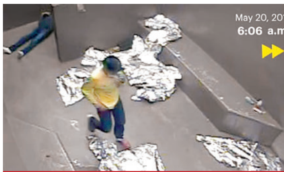
La organización ProPublica obtuvo las imágenes y las difundió ayer.

Pero las imágenes revelan que el joven colapsó junto al inodoro a la 1:39 de la mañana. Las imágenes se cortan entonces, pero cuando regresan, a las 5:48 de la ma-