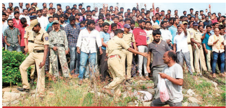
La policía contiene a vecinos que se acercaron al lugar para celebrar las muertes.

La Conare dijo que da "por hecho que en Venezuela hay una violación masiva, grave y generalizada de los derechos humanos".