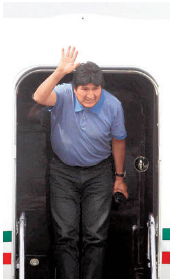
Evo Morales, a su llegada a México el 12 de noviembre.

Aunque por el momento no han surgido informaciones oficiales al respecto, Morales había expresado su deseo de poder