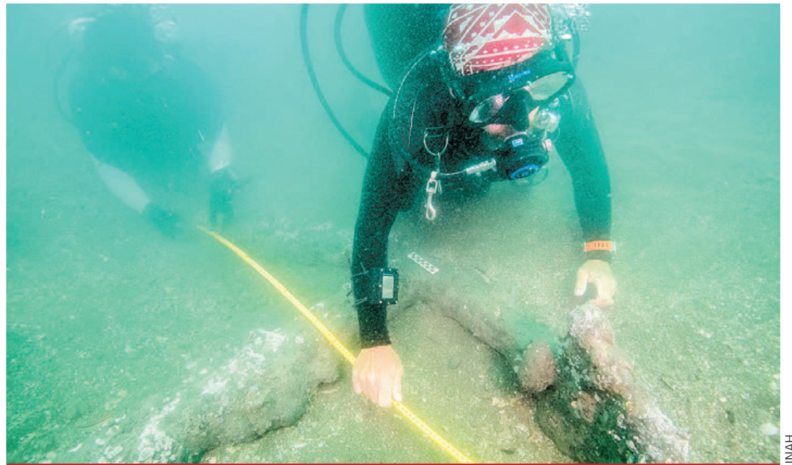
Las anclas fueron descubiertas en la segunda temporada del proyecto Arqueología Subacuática en la Villa Rica de Veracruz.

Para los investigadores es valioso saber que siguen la ruta correcta para ubicar restos vinculados con la llegada de los europeos a Mesoamérica,