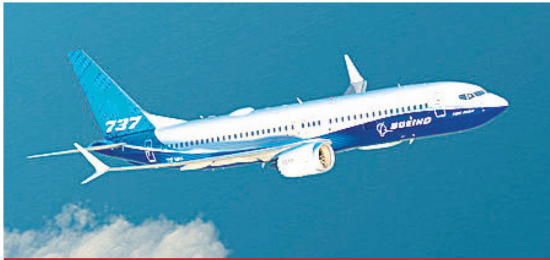
El software del 737 MAX, detrás de la causa de que se cayeran este año dos aparatos, matando a más de 300 personas.

400 AVIONES EN STOCK. “Anteriormente habíamos declarado que evaluaríamos continuamente nuestros planes de producción si la puesta en tierra del Max continuaba más de lo esperado”, recordó en un comu-