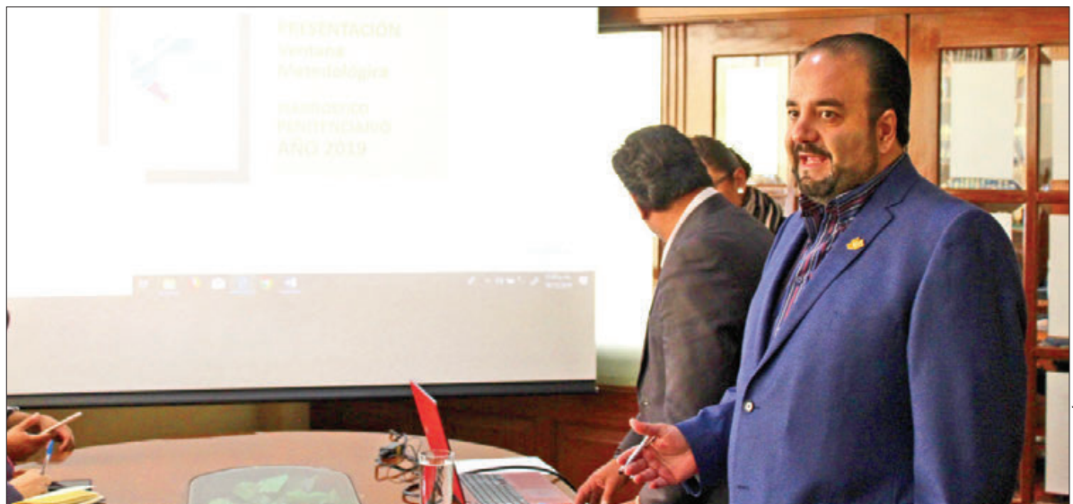
SENTENCIAS. Expuso Habib problemas de cárceles como la sobrepoblación, situación que no cambia.

Explicó que a partir del presente año la CDHEH sólo elaborará un diagnóstico de forma anual.