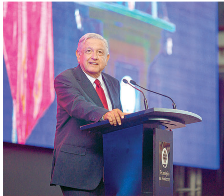
El presidente Andrés Manuel López Obrador informó que el gobierno firmará convenio con el Tec de Monterrey para becar a estudiantes talentosos de bajos recursos.

“No puede haber un Estado que asfixie las iniciativas de la sociedad civil, un Estado autoritario. Pero tampoco se puede pensar que sólo participe en el desarrollo el mercado. Se llegó a decir, de manera falsa, que si se produ-