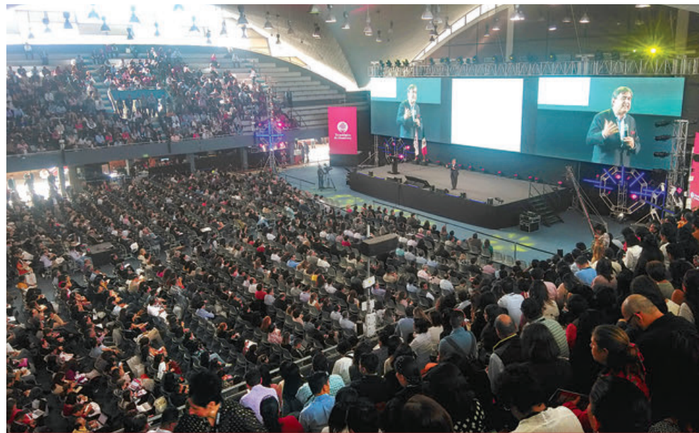
Al menos 3 mil personas participan en las conferencias plenarios del CIIE en el Tec de Monterrey.

La respuesta a este diario, se realizó en un encuentro previo a la in-