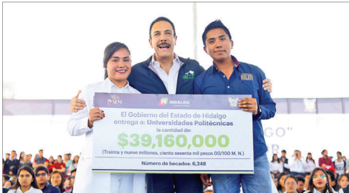
BECAS. Sostuvo que los esfuerzos realizados son para garantizar un óptimo futuro para este sector de la sociedad.

Sustentado en la política de apoyo total en todos los niveles educativos, en el Presupuesto de Egresos 2020 que envió al Congreso (que está semana se discute), "estoy incluyendo por