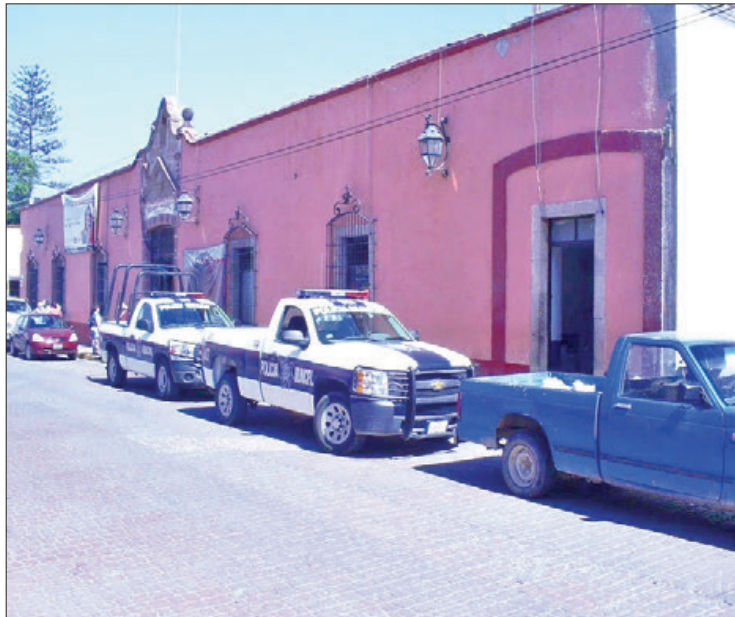
DESLINDES. Comenzaron las indagatorias por parte de la PGJEH dentro de esta cárcel.

cidos se mencionó que el ahora occiso se trata de un hombre que se identificaba con las iniciales J.A.M.E., de 37 años de edad, quien se encontraba preso desde hace varios meses por el delito de robo y asalto.