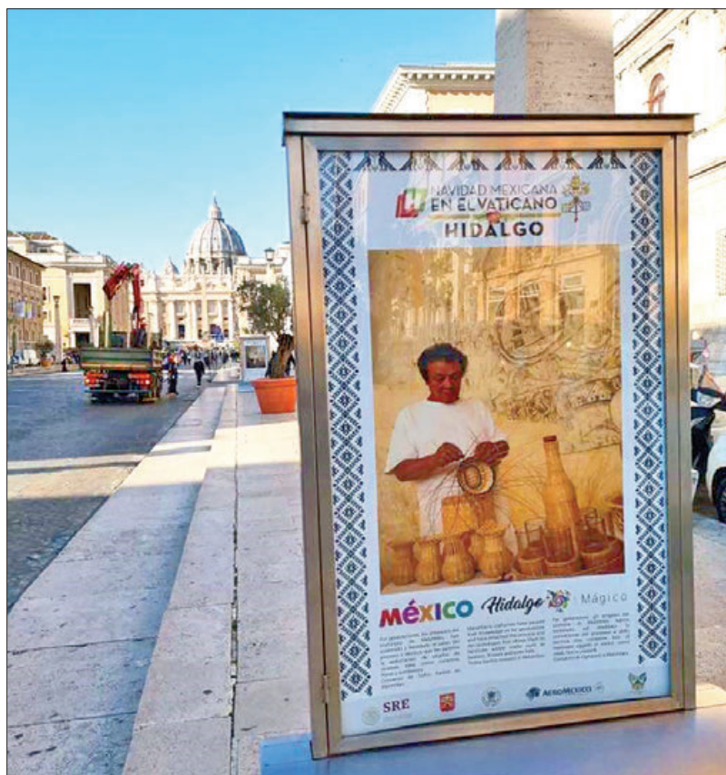
Algunos puntos del Vaticano lucen propaganda relativa al trabajo de artesanos hidalguenses, que acudieron a esa nación para demostrar la riqueza del estado.