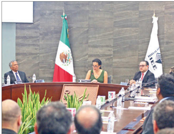
FECHAS. Espera Vázquez nueva reunión con legisladores.

En caso de que el Congreso reduzca el monto que se apro-