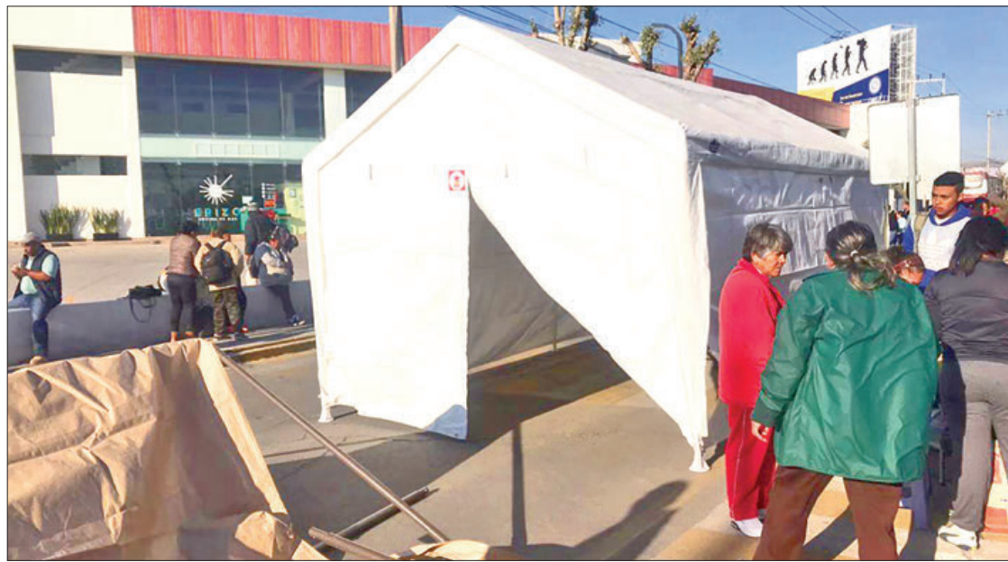
SIGLAS. Liderazgos de CODUC, UNTA, CIOAC, entre otras asociaciones, acudieron la mañana de ayer.

Por ello adeptos de la Unión Nacional de Trabajadores Agrícolas (UNTA), Coalición de Organizaciones Democráticas, Urbanas y Cam-