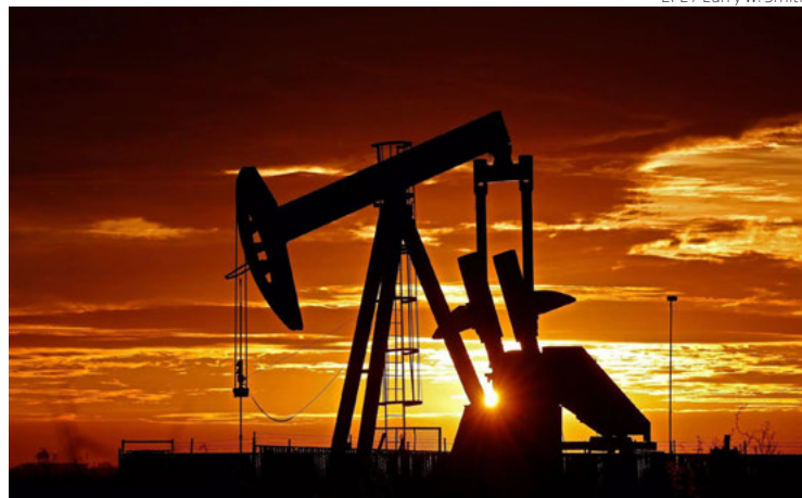
Imagen de archivo de una refinera de petróleo en Estados Unidos.

Según datos al final de las operaciones en la Bolsa Mercantil de Nueva York (Nymex), los contratos de futuros del WTI para entrega en marzo sumaron 2.01 dólares respecto al cierre de la sesión anterior.