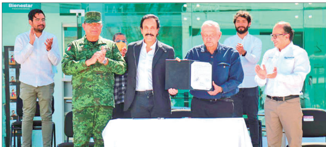
El presidente de México, Andrés Manuel López Obrador, así como el gobernador Omar Fayad, realizaron una gira de trabajo por Zapotlán de Juárez, Cuauatepec de Hinojosa y Tepeapulco.

El primer punto de reunión fue en las instalaciones del C5i, ubicado sobre la carretera federal México-Pachuca, donde el primer mandatario mexicano, realizó su conferencia matutina y aplaudió las acciones en materia de seguridad, desarrollo económico, educación y salud, que se realizan en el estado. .3