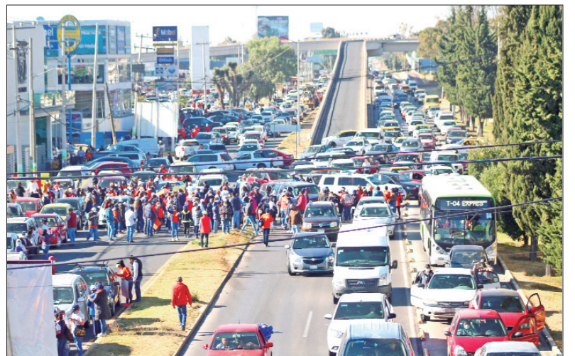
Por varias horas, los agremiados a la sección XV del SNTE colapsaron los principales accesos de Pachuca.