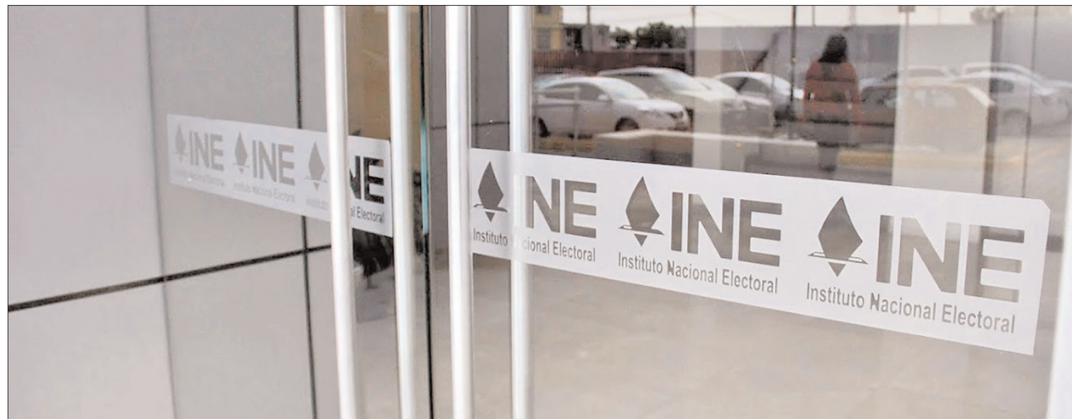
OBJETIVO. La intención de esta veda es para que las dependencias y paraestatales eviten la publicidad oficial a fin de que no incidan en la decisión ciudadana.

otras particularidades, pues ante el recorte presupuestal que padeció el INE, ajustaron algunas diligencias.