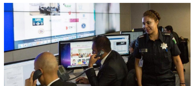
Entre enero a noviembre del 2021 se registraron 17 mil 118 casos por el delito de fraude en línea en la CDMX.

Las ventas Online en México crecieron 81% tan sólo en 2020 y alcanzaron un valor de 316 mil millones de pesos, lo que equivale al 9% de las actividades económicas en el país, refirió. (Ana Espinosa Rosete)