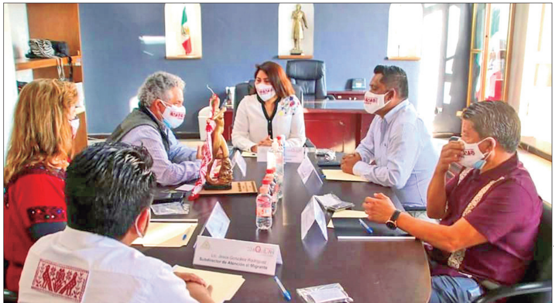
LABOR. Como una primera acción se pretende realizará la "Primera Muestra Gastronómica Ixmiquilpense".

Aprovechando la presencia del cónsul, ayer se realizó la inauguración de la primera oficina de Atención al Migrante en esta entidad, misma que se ubicará en la parte posterior del Ayuntamiento (antes CEDEX) donde se realizarán trámites como citas para pasaporte mexicano y americano, traslado de restos, actas de doble nacionalidad, formatos para salida de menores, visas de turista y humanitarias, entre otros documentos.