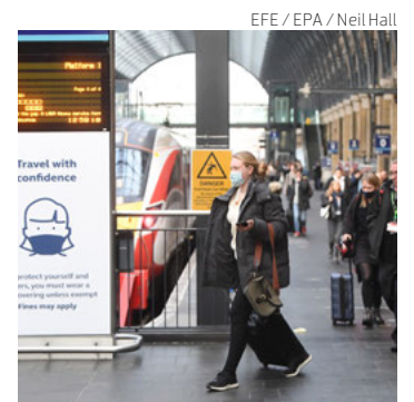
Una estación de tren en Londres, en una imagen de archivo.

“Este contexto, que no habíamos vivido hasta ahora en la pandemia, nos deja con la posibilidad de un largo período de tranquilidad y un mayor nivel de defensa de la población contra cualquiera recrudescimiento de la transmisión, incluso contra una variante más virulenta”, dijo Kluge.