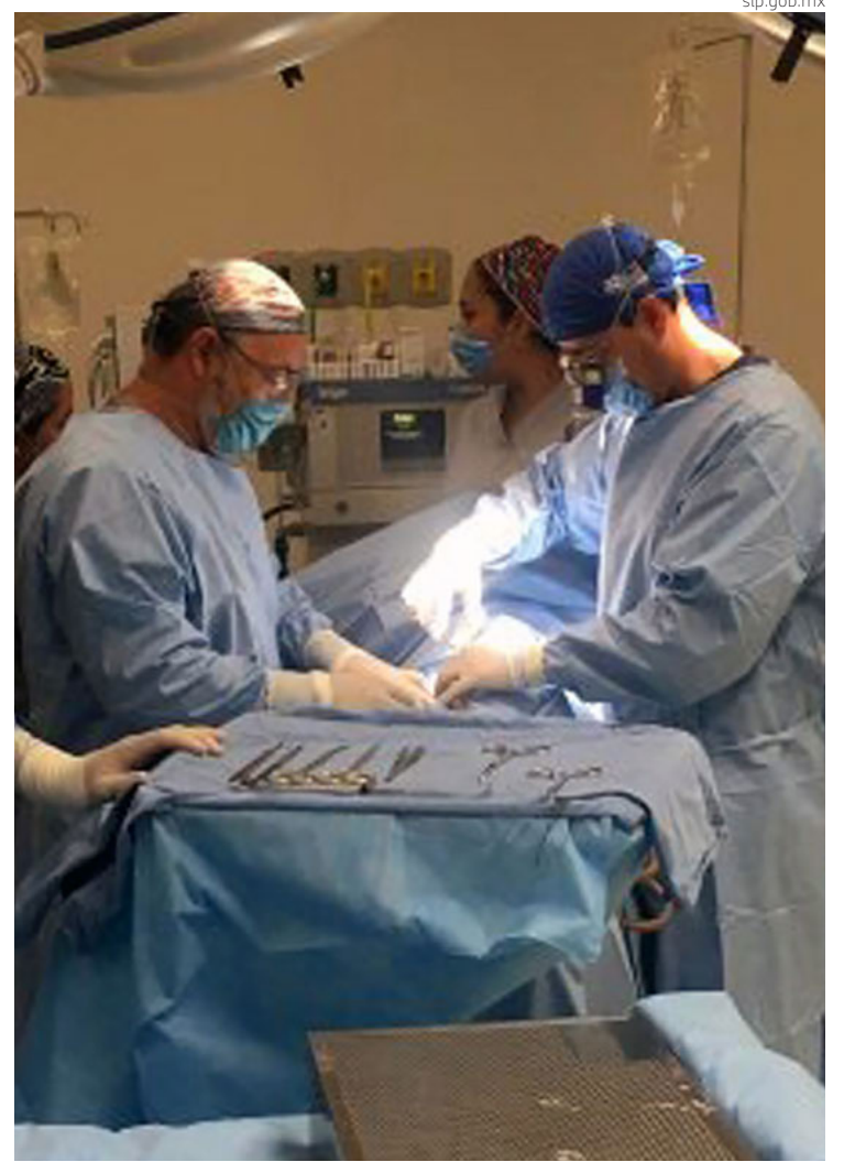
En 2021 se benefició a 80 pacientes con trasplantes.

En 2021 se benefició a 80 pacientes con trasplantes: 31 de