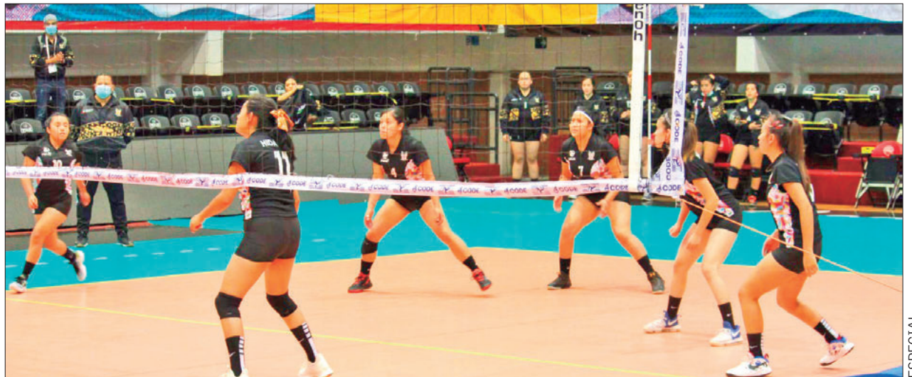
ASISTENCIA. Se espera la participación de más de 200 deportistas.

Esperando la participación de más de 200 deportistas provenientes de municipios como: Tulancingo, Huejutla, Pachuca, Actopan, Mixquiahuala, Tula, San Salvador y Chilcuautla, los partidos se jugarán en las categorías 2007-2008, 2005-2006 y 2003-2004 de la rama femenil, mientras que la varonil será en 2006-2007, 2004-2005 y 2002-2003.