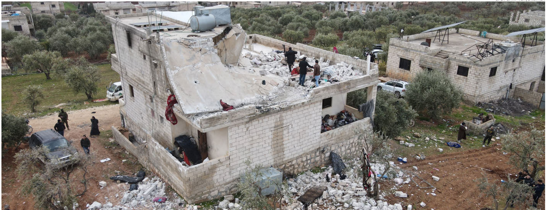
Así quedó el edificio donde residía el líder de Estado Islámico, Al Qurashi, tras el operativo de EU en el que este se inmoló, ayer en Idlib, Siria.