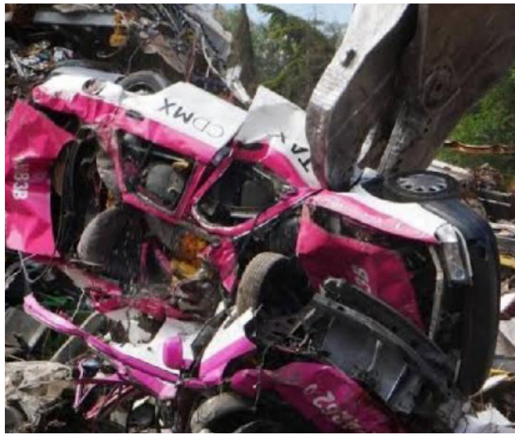
Chatarrización de taxis.