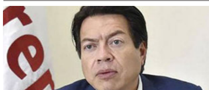
↓ Mario Delgado Presidente de Morena

El profesor pidió a la Cámara de Diputados mediar y coadyuvar en la búsqueda de un diálogo con las autoridades federales del Conacyt, la SEP y Gobernación para resolver el conflicto en el CIDE.