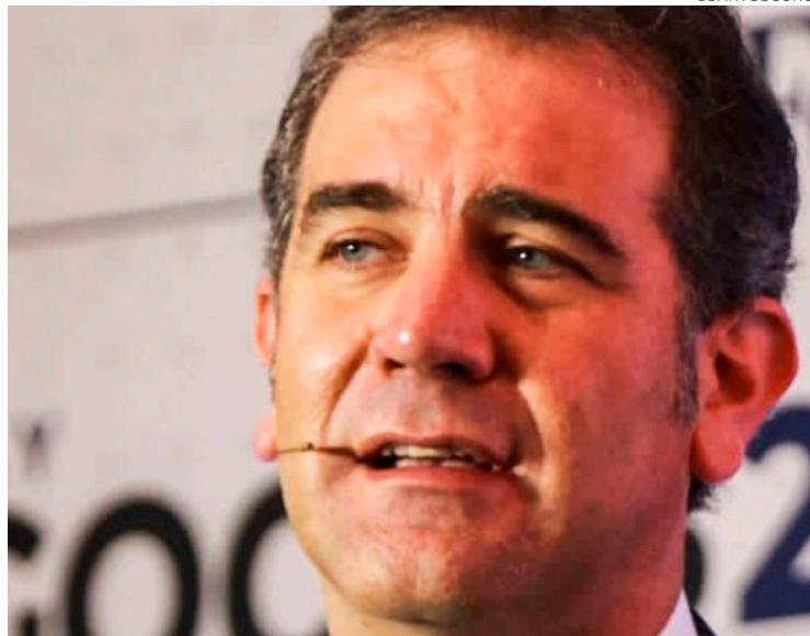
Lorenzo Córdova, en foto de archivo, advierte ambiente perturbador.

“Es particularmente perturbador que estos ataques escalen de nivel hasta amenazar la integridad personal de los funcionarios públicos a cargo de las instituciones electorales como está pasando en Perú, pero también en México”, dijo Córdova durante su participación en la Cumbre Mundial del Día de las Elecciones 2022, organizada por la