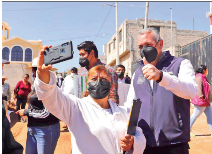
TRABAJO. Se mantendrá esa intensión de generar estrategias que redunden en oportunidades laborales.

En el marco del programa "Un Día por el Empleo", el edil sostuvo que la relación entre gobierno y la iniciativa privada ha sido productiva durante la presente administración, de tal forma que ha crecido el número de integrantes de este sector que han iniciado una sinergia con el municipio.