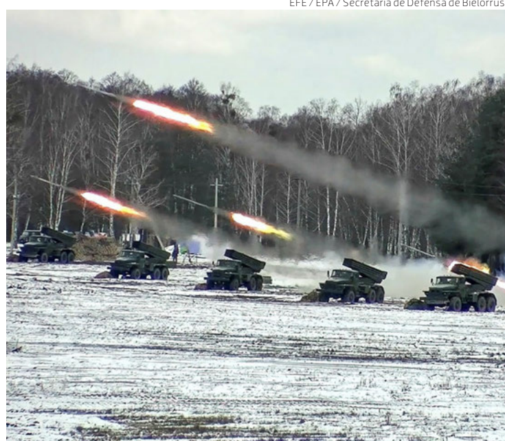
Vehículos híbridos disparan misiles durante los ejercicios conjuntos entre Rusia y Bielorrusia, ayer, en la provincia de Brest.

Entre tanto, Estados Unidos advirtió ayer que trabajará para “prevenir” cualquier acción por parte de Rusia de “desestabilizar”