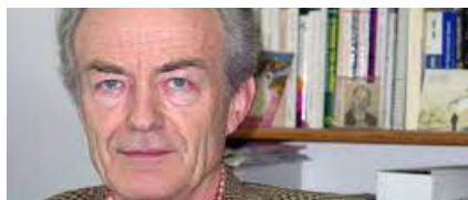
↑ Jean Meyer Historiador

El profesor pidió a la Cámara de Diputados mediar y coadyuvar en la búsqueda de un diálogo con las autoridades federales del Conacyt, la SEP y Gobernación para resolver el conflicto en el CIDE.