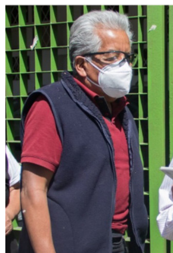
Los recursos destinados al pago de pensiones y jubilaciones ascendió a un billón 48 mil millones de pesos.