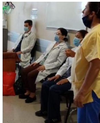
Atención psicológica a personal que atendió COVID.

Cabe resaltar que el protocolo está disponible para la plantilla de 18 mil 43 de trabajadores, mismo que actualmente opera en 11 hospitales: Hospital de Especialidades “Dr. Belisario Domínguez”; Hospital General “Dr. Enrique Cabrera”; Hospital General “Rubén Leñero”; Hospital General