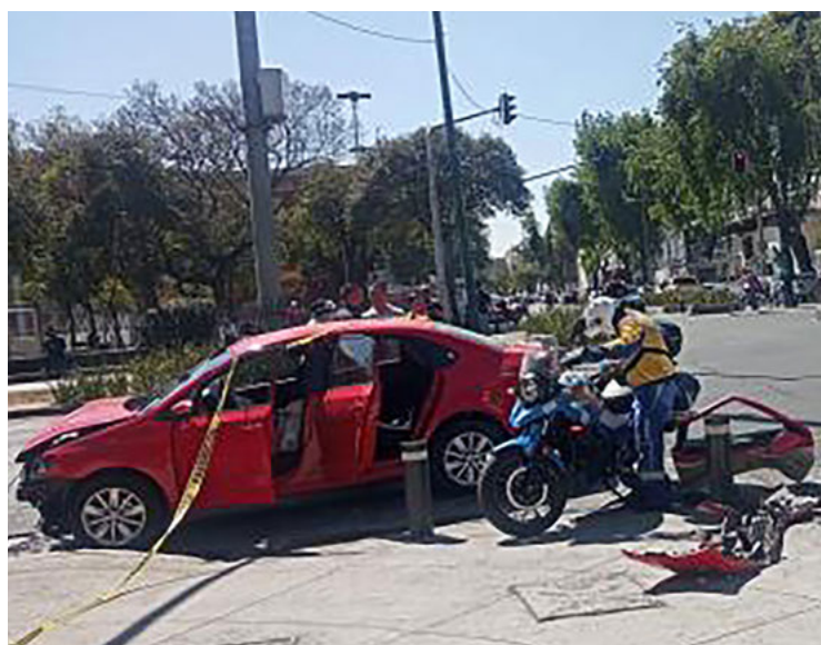
El auto rojo, en el que viajaba la bebé, luego del impacto.

Gracias a la decisión del papá, la pequeñita fue objeto de