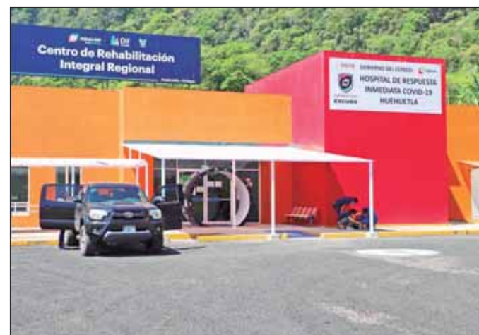
RAPIDEZ. Derivado de la declaratoria de emergencia, adelantaron las acciones instruidas por el gobernador Omar Fayad que dieron paso al desarrollo de acciones y preparativos ante la contingencia.

Por ello, al Hospital Inflable se sumaron tres hospitales más de respuesta inmediata en Actopan, Huejutla y Huehuetla y la instalación de otro tomógrafo de 128 cortes en el hospital de Actopan, que permitió obtener imágenes de alta calidad en tercera dimensión.