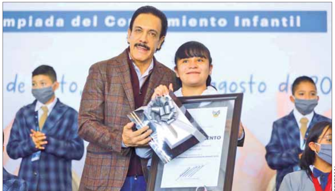
MENSAJE. Reconocemos su capacidad y talento, ya que fueron los ganadores entre más de 58 mil alumnos de primaria evaluados en Hidalgo, el 18 de mayo pasado y eso es digno de reconocerles.

SEPH Los 33 niñas y niños que triunfaron provienen de 25 municipios: 17 son mujeres y 16, hombres