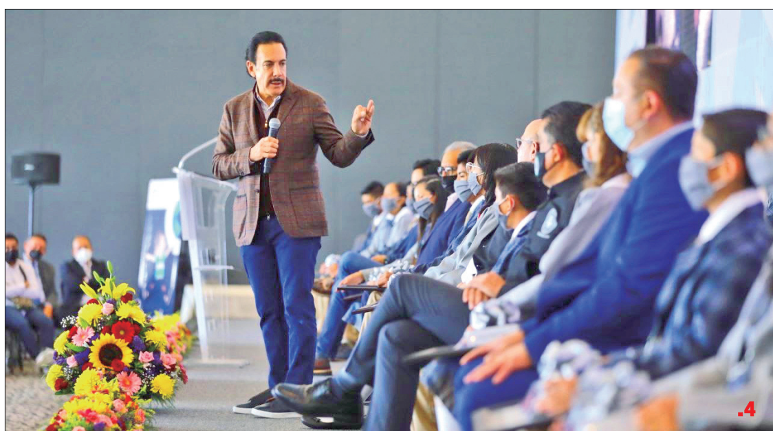
OMAR FAYAD. Gobernador entregó reconocimientos a los ganadores de la olimpiada del conocimiento infantil 2022, OCI Por la Paz. .4