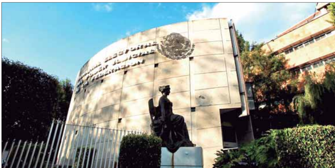
LÍMITES DE LA LIBERTAD DE EXPRESIÓN. Magistrados federales refirieron que la citada expresión era en sentido figurado.

► Sala Superior quita multas al PRI, pues consideró que publicaciones denunciadas exponían temas de interés y críticas hacia actual Gobierno Federal; procedimientos