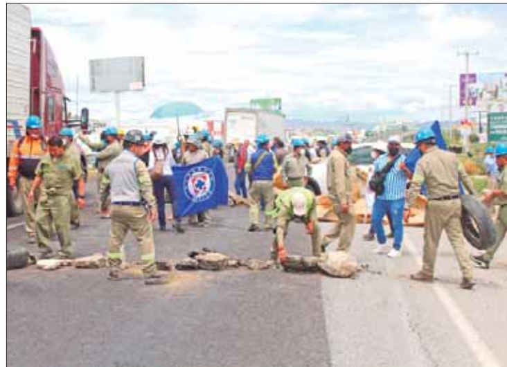
ESTRAGOS. Al estar impedidos para continuar con la producción de cemento, las pérdidas por la inactividad fueron millonarias.

Expusieron que la situación dejó sin posibilidad de laborar a mil de trabajadores que se trasladaron hacia estos dos puntos para realizar el bloqueo y soli-