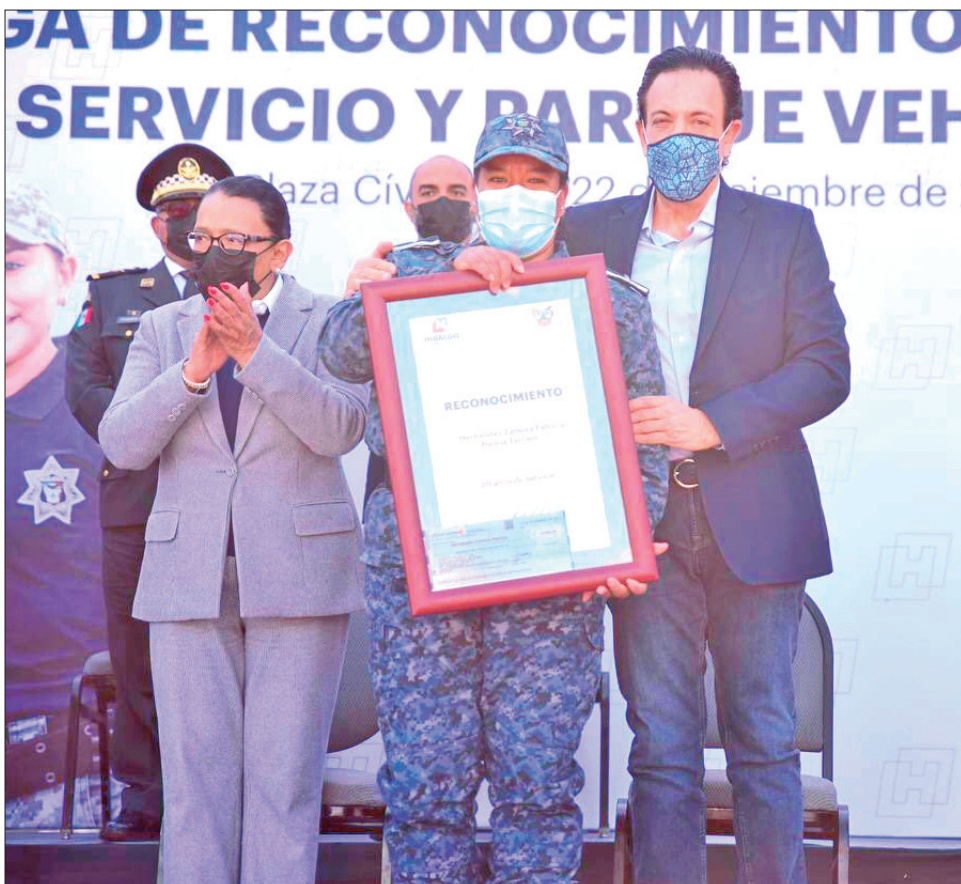
Ante la transición democrática del Poder Ejecutivo de la entidad, la administración de Omar Fayad dejará una Policía Estatal fortalecida en infraestructura, equipamiento y mejoras en condiciones laborales.

■ En sexenio actual fortaleció infraestructura, equipamiento y mejoró condiciones laborales, además de sumar a nuevos elementos con profesionalización y estudios universitarios en seguridad pública e investigación policial; temas principales