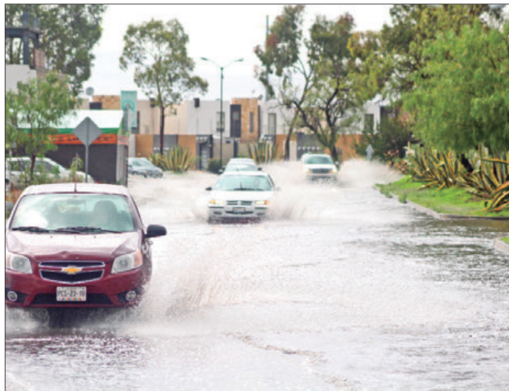
COORDINACIÓN. En cada una de las regiones se mantienen reuniones con las autoridades de protección civil y presidentes municipales para proporcionar información de los riesgos.

se mantienen reuniones con las autoridades de protección civil y presidentes municipales para proporcionar información de los riesgos que tienen cada uno de los municipios.