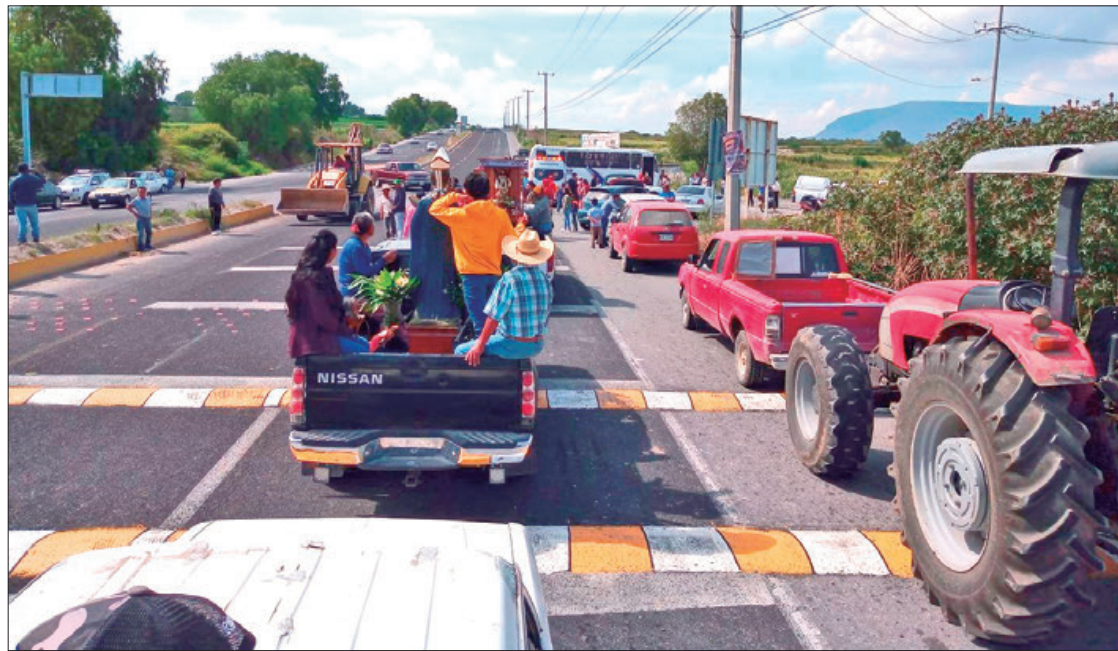
MOLESTIA. Los reductores de velocidad fueron colocados en una pendiente sin señalamientos.

► Sobre la carretera Progreso-Ixmiquilpan, esto a la altura de la comunidad El Jardín