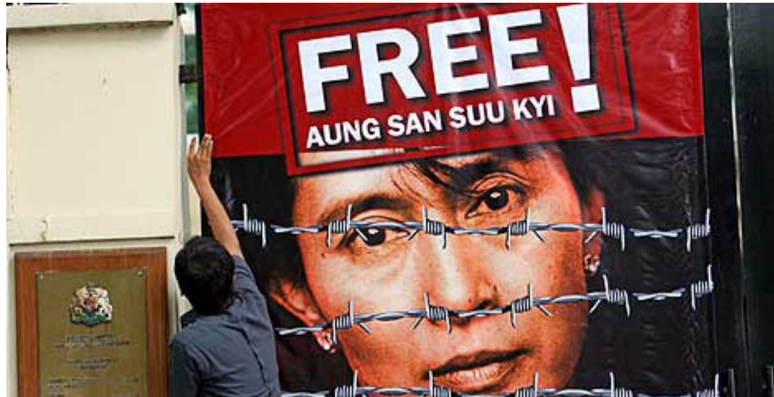
Partidario de la líder birmana pide su liberación desde Tailandia, refugio de muchos exiliados.

Suu Kyi recibió tres años de condena al ser declarada culpable de abusar de su posición para rentar unas tierras por debajo del precio de mercado y otros tres por construir una vivienda con donaciones que debían ser destinadas a obras caritativas en una fundación que ella presidía, detalló el medio local Myanmar Now.