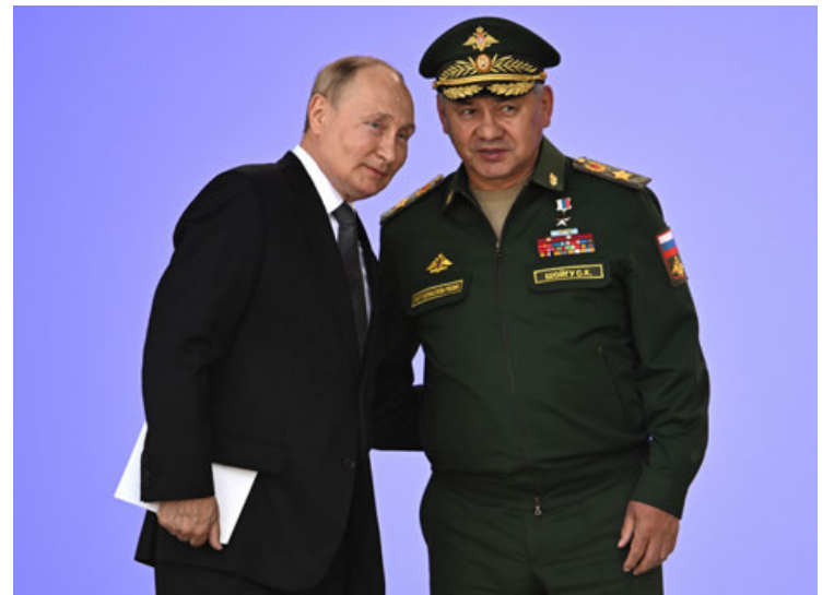
Putin llega a la feria de armamento de Moscú junto al ministro de Defensa, Serguéi Shoigú.