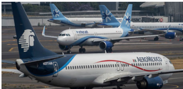
La degradación a categoría 2 de la autoridad aeronáutica mexicana fue desde mayo de 2021.

Además, se debe investigar y hacer justicia en el caso de Mexicana de Aviación: anular las irregularidades, castigar a los responsables y resarcir a los trabajadores su patrimonio ●