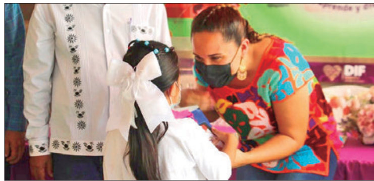
TRABAJO. Del primero al 12 de agosto, 77 niñas y niños pudieron aprender y desarrollar nuevas habilidades y talentos.

Para cerrar con broche de oro, los niños y niñas recibieron un especial reconocimiento a su esfuerzo y dedicación, se divirtieron con un show a cargo del payaso "Felipín" y participaron en la rifa de 12 tabletas electrónicas que serán de gran ayuda para sus tareas escolares.