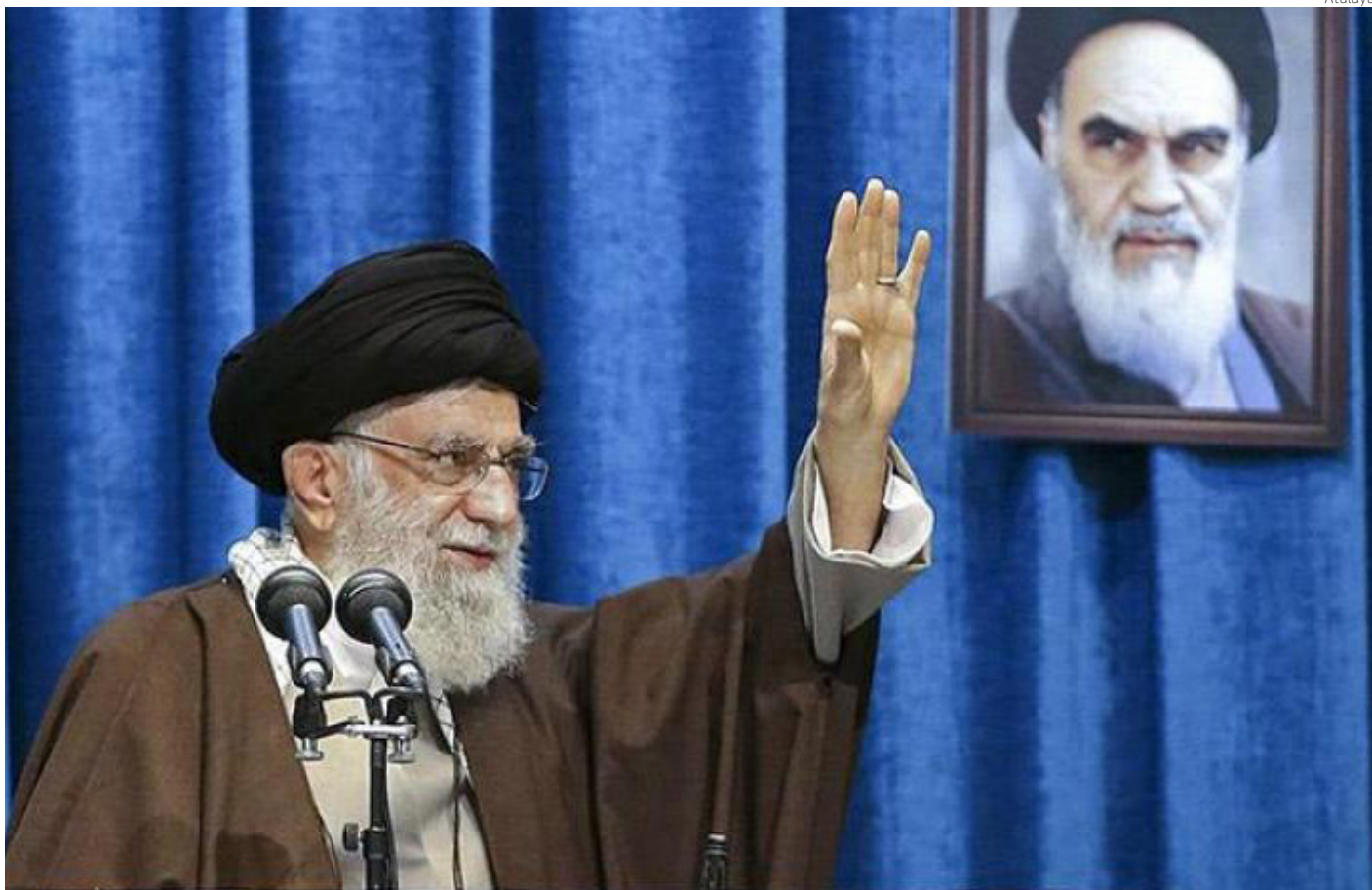
El líder espiritual iraní y representante del ala más radical religiosa, Ali Jomenei, junto a un retrato del ayatolá Jomeini.