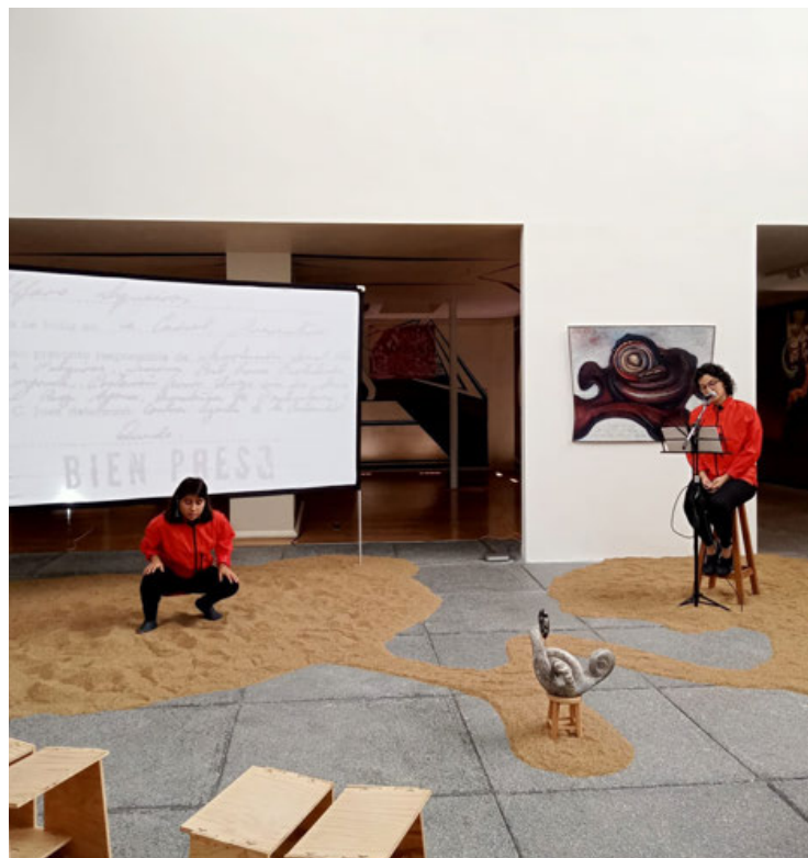
Los ensayos de “La travesía” que se presentará en el patio de murales de la Sala de Arte Público Siqueiros.

Asegura que Siqueiros escribió la obra durante su reclusión en Lecumberri (1960-1964), aunque la firmó en otra fecha (1965). El cuadro que escribió muestra personajes alegóricos que atraviesan una tem-