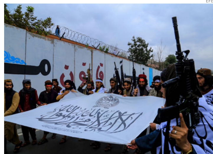
Talibanes desfilan frente al muro de la clausurada embajada de EU en Kabul.

Cientos de talibanes con fusiles y la bandera del Emirato Islámico festejaron la caída de Kabul y su regreso al poder en Afganistán con un desfile ante la clausurada embajada de Estados Unidos en el país cen-