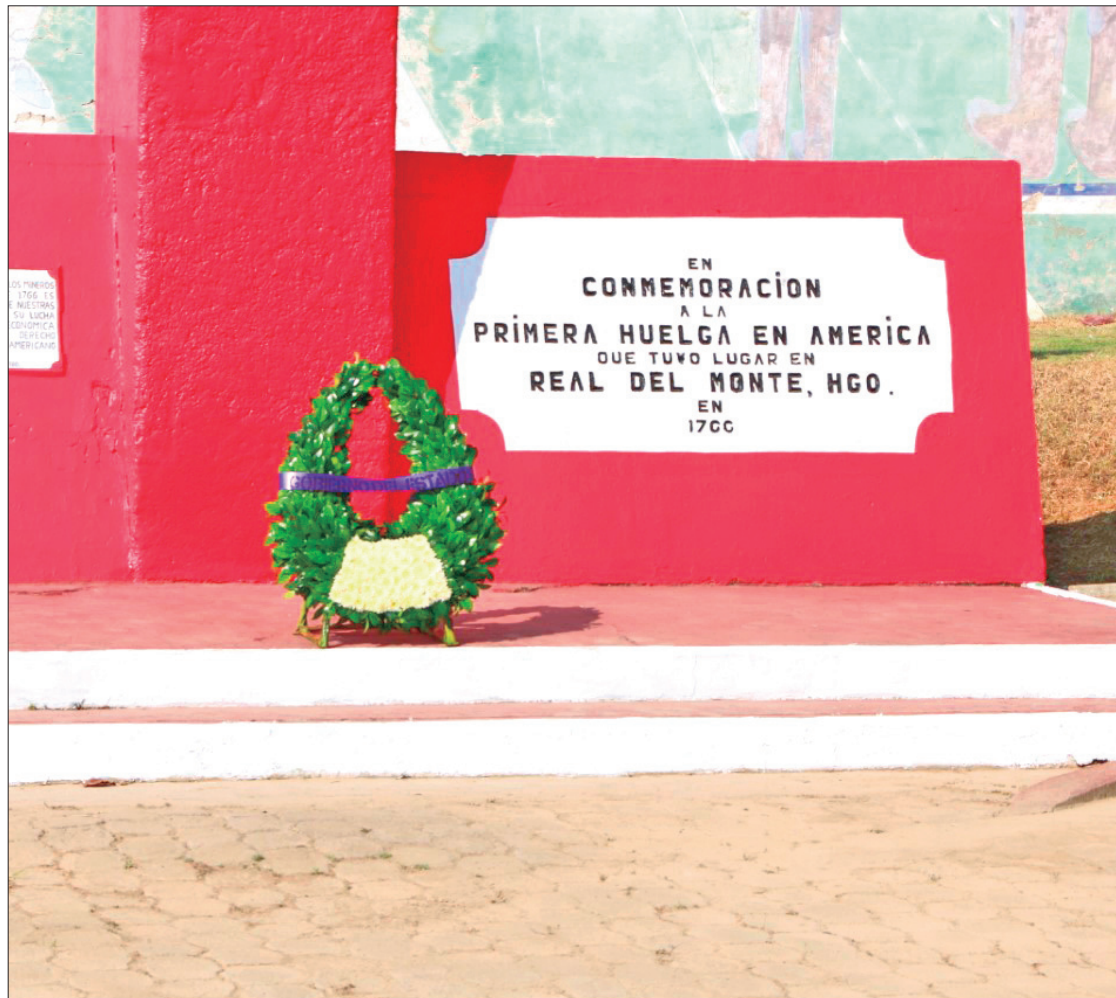
PASOS. Rememora STPSH hecho histórico que marcó tendencia en la vida laboral del país y del mundo.

El movimiento obrero de entonces, ahondó, hace referencia a la necesidad de que los mineros de aquella época lograran obtener la restitución íntegra de una tradicional forma de pago extra conocida con el nombre de partido. Esta consistía en que, al concluir con su cuota del día, los mineros tenían libertad de sacar