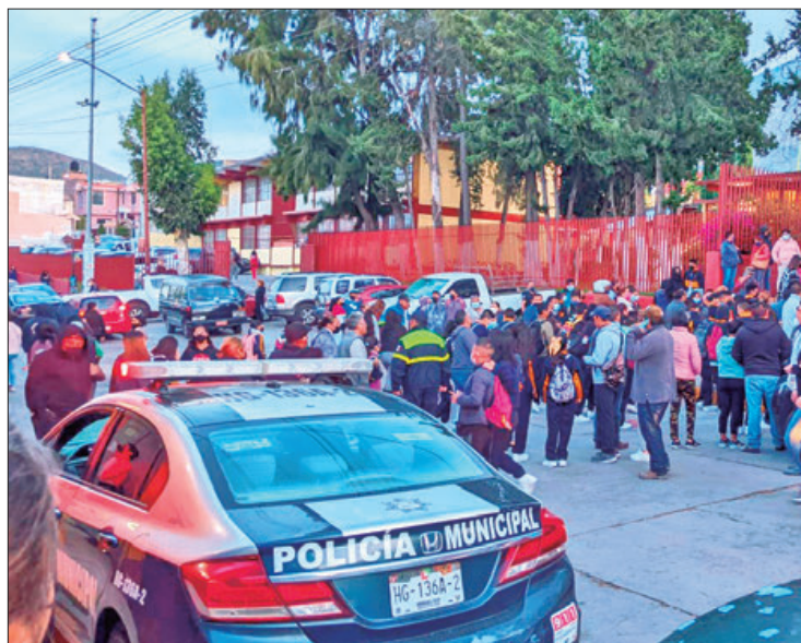
CALENDARIO. Este lunes dio inicio el ciclo escolar 2022-2023 en la geografía estatal.