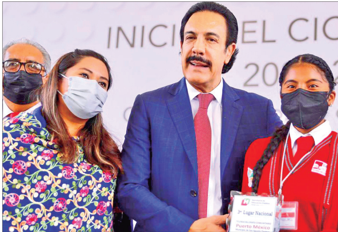
FUERZA. Inició el ciclo escolar 2022-2023, gobernador evento en la Escuela Secundaria Técnica número 6, de Chilcuautla.

Subrayó que pese al complejo panorama que se vivió durante la pandemia ningún indicador en materia educativa retrocedió en los últimos seis años, lo que habla del esfuerzo y compromiso que docentes, autoridades y alumnos han puesto para que Hidalgo se consolide como el segun-