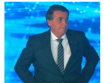
Bolsonaro en el debate del domingo.

El expresidente brasileño Luiz Inácio Lula da Silva se mantiene como el máximo favorito para vencer en las elecciones presidenciales del 2 de octubre en Brasil, con una ventaja de 12 puntos porcentuales que no varió en las dos últimas semanas sobre el actual mandatario, Jair Bolsonaro.