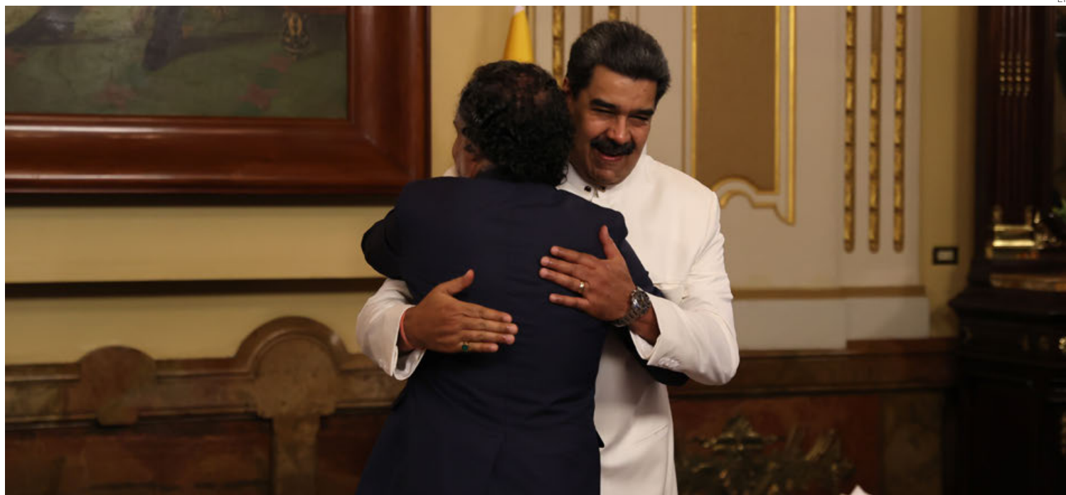
Maduro recibió con un cariñoso abrazo al nuevo embajador colombiano, Armando Benedetti..