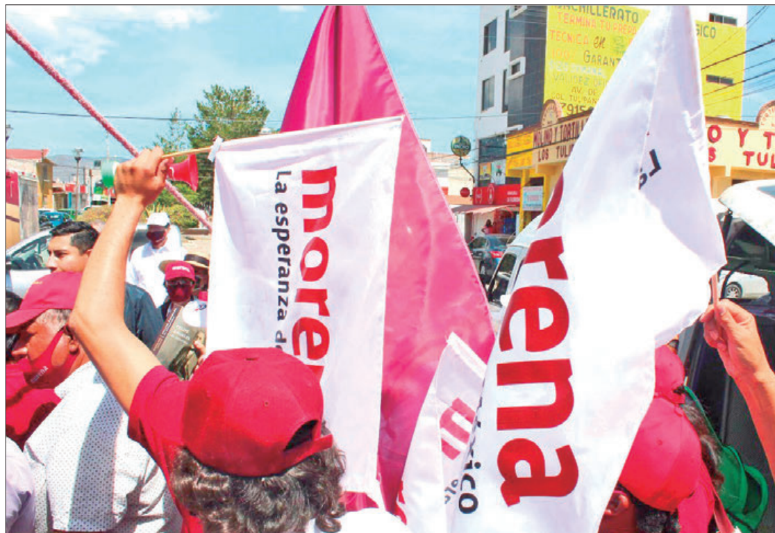
ARCHIVO. Desde el 29 de julio hasta el 25 de agosto prevalecen más de 20 asuntos que formalizaron militantes o aspirantes a consejerías estatales.

de Morena, desde el 29 de julio hasta el 25 de agosto prevalecen más de 20 asuntos que formalizaron militantes o aspirantes a consejerías estatales, la mayoría están en trámite de prevención o admisión, además de cierres de instrucción.