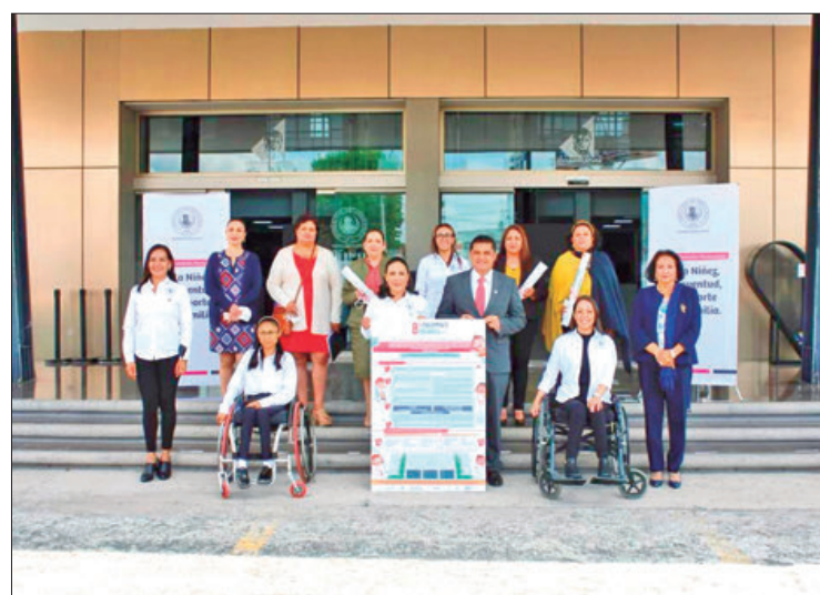
ACCIONES. La Comisión de la Niñez, la Juventud, el Deporte y la Familia presentaron el cronograma de actividades rumbo a la sesión del Parlamento Infantil 2022.

De esta manera, precisó, se elegirán a las y los niños que representarán a los 18 distritos electorales de la entidad; a los cuales, por su participación, el Instituto Estatal Electoral de Hi-