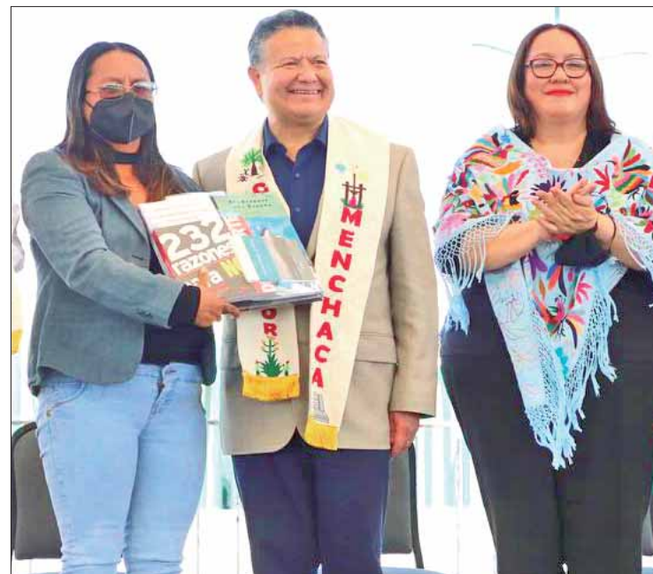
EL LLAMADO. El gobernador Julio Menchaca exhortó al Congreso local a garantizar un Presupuesto que fortalezca la transformación de Hidalgo

Tras superar la crisis sanitaria y el rezago generado por la pandemia, el director nacional del IMSS detalló que se recuperó la Unidad de Medicina de Mixquiahuala, con una inversión federal superior a 74 millones de pesos en beneficio de 27 mil 952 habitantes y en el que se proporcionarán servicios de medicina familiar, enfermería especializada, estomatología, atención médica continúa, farmacia, almacén y soporte técnico.