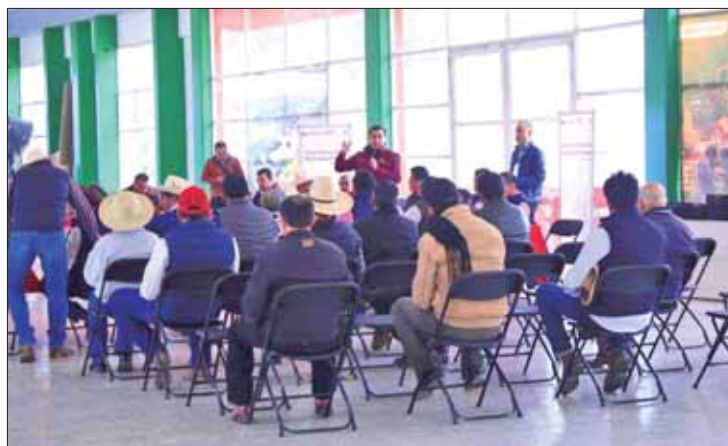
ACCIONES. El compromiso es que cada uno de las peticiones se incluya.

En las reuniones se escuchó cada uno de los planteamientos