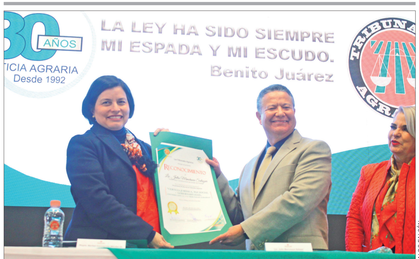
El gobernador de Hidalgo, Julio Ramón Menchaca Salazar, reconoció el trabajo de los Tribunales Agrarios en su 30 aniversario, al destacar el trabajo que realizan en la conciliación e impartición de justicia en la materia.

Ante Zoé Robledo Aburto, director general del Instituto Mexicano del Seguro Social (IMSS), el mandatario aseguró que los hidalguenses trabajan con determinación para alcanzar el México que se ha proyectado como nación en el que cada vez más personas alcancen un mayor bienestar y como en esta ocasión, garantizar mejores servicios de salud.