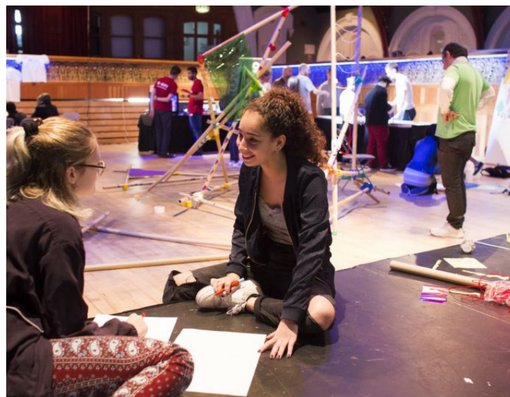
Desde el inicio de la beca hasta la fecha han existido severos retrasos en el cumplimiento del apoyo mensual de los becarios.

"Desde el inicio de la beca hasta la fecha han existido severos retrasos en el cumplimiento del apoyo mensual de los becarios, primero con esperas mayores a los 15 días y posteriormente con atrasos en los depósitos de casi o más de un mes. Esto ha repercutido en el proceso de nuestros proyectos ya que dependemos de dicho ingreso para concluir las actividades propuestas en tiempo y