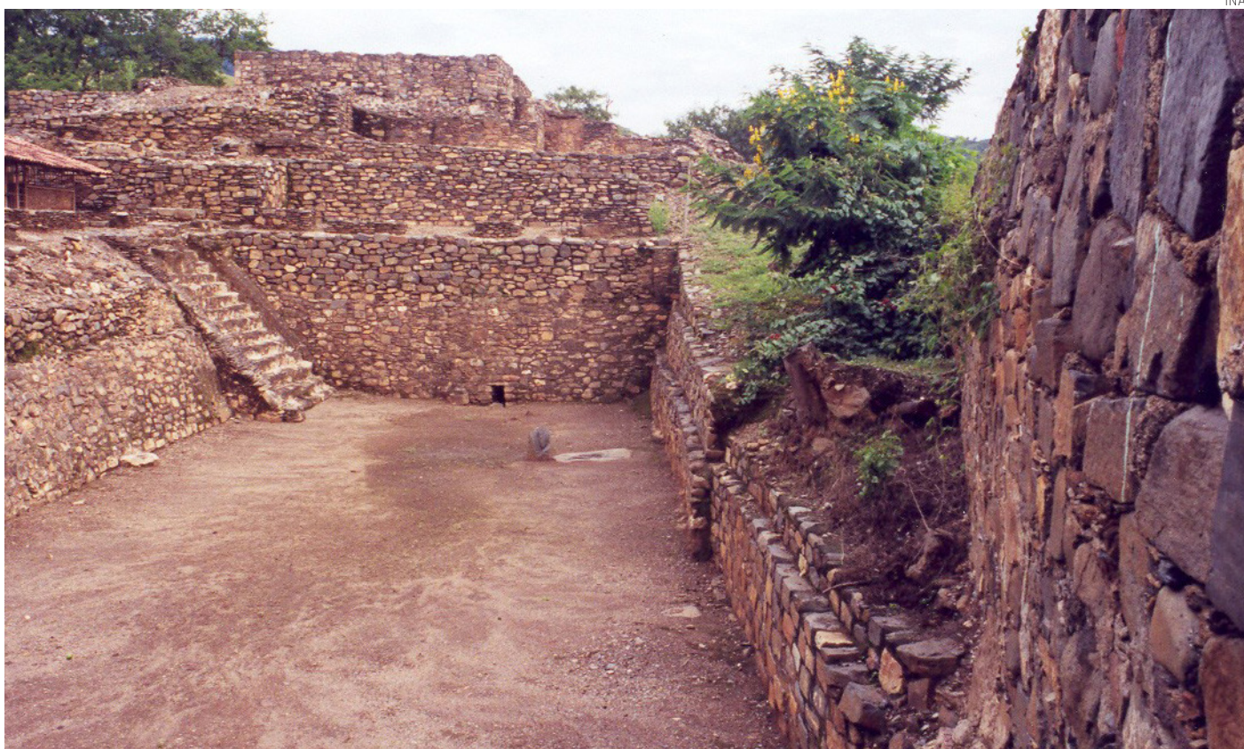
Una vista de la zona arqueológica de la zona arqueológica de San Miguel Ixtapan.

En Tierra Caliente, con Michoacán y Guerrero, hay una riqueza oculta y espera proyectos de investigación, añade Rubén Nieto