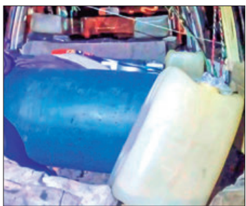
SSPH. Prevención y combate al trasiego ilegal de hidrocarburos.

► Persiste Policía Estatal en combate al trasiego ilegal de combustible; tres detenidos