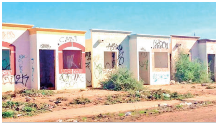
ÍNDICE. Tizayuca registra el mayor número de viviendas abandonadas del estado.

En estos lugares las viviendas son ocupadas por familias de manera ilegal que carecen de una casa y por necesidad las utilizan, otras que son vandalizadas y utilizadas para cometer delitos.