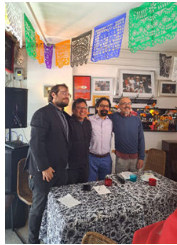
La presentación del Festival.