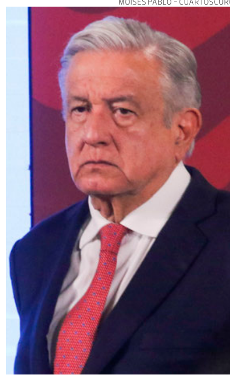
El Presidente en la mañana.

“Es una reacción normal porque se está llevando a cabo una transforma-