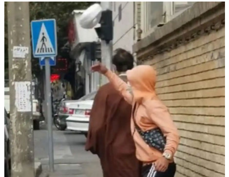
Joven es grabado mientras quita el turbante a un clérigo en una calle de Teherán.

Los jóvenes iraníes han improvisado diversas formas de protestar en Irán, desde mujeres que se cortan el cabello largo o caminan sin velo, desafiando al régimen de terror impuesto por los ayatolás. En los últimos días se ha impuesto un nuevo método: quitarle el turbante a los clérigos.