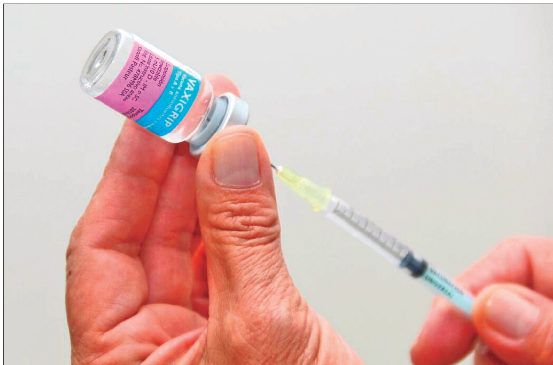
ACOTACIÓN. Hasta el momento sólo suministraron cerca de 100 mil vacunas, por lo que la tarea es intensificar las acciones de difusión entre la población objetivo.

Si se tiene sintomatología respiratoria acudir de inmediato a recibir atención médica en caso de presentar síntomas (fiebre o sentirse con escalofríos, tos, dolor de garganta, mucosidad nasal o nariz tapada, dolores musculares y corporales, dolor de cabeza, fatiga y cansancio, algunas personas pueden tener vómitos y diarrea); evitar automedicación y permanecer en casa.