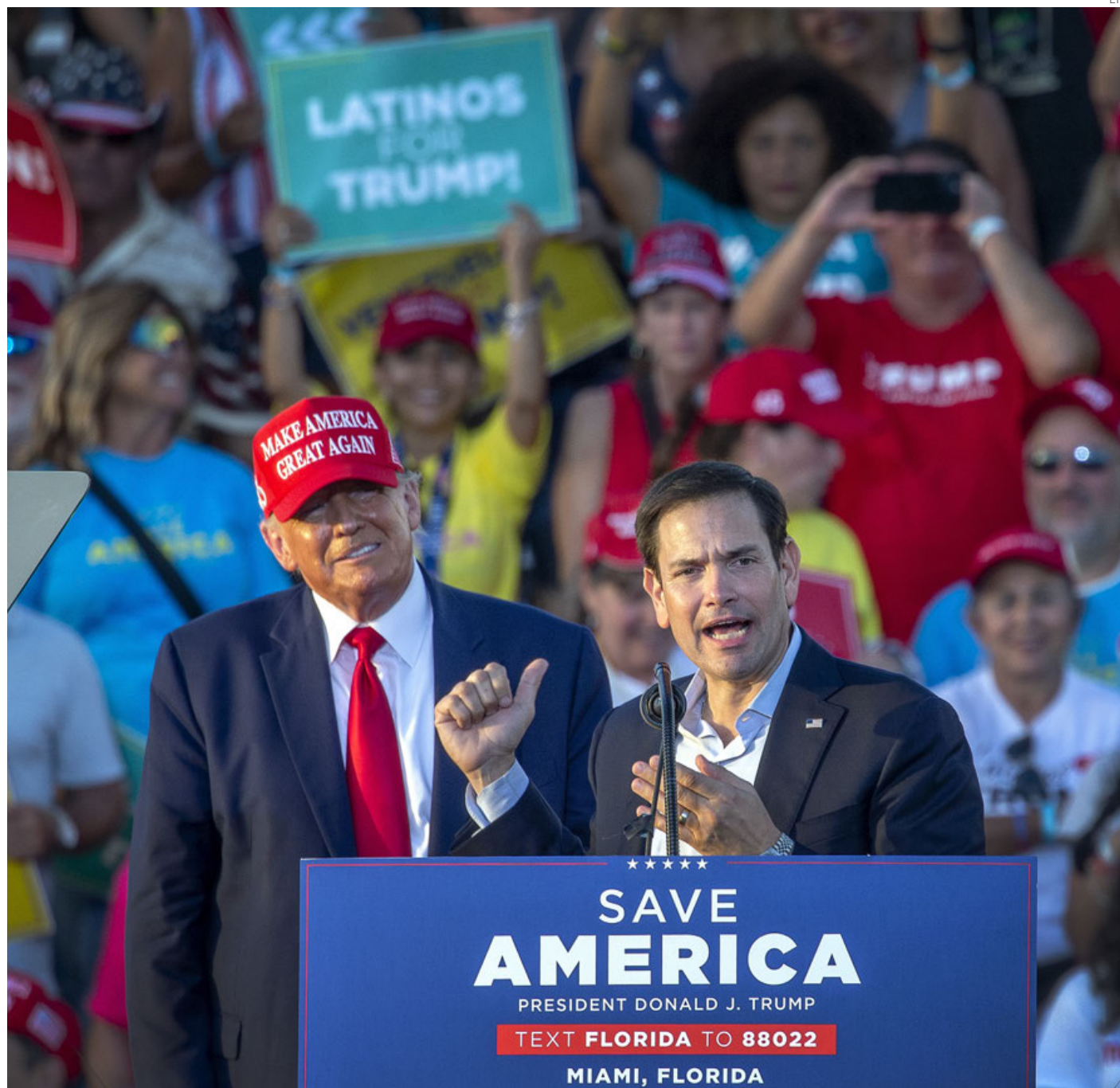
Marco Rubio, quien aspira a la reelección como senador republicano por Florida, ha pasado de ser un adversario de Trump a un admirador.