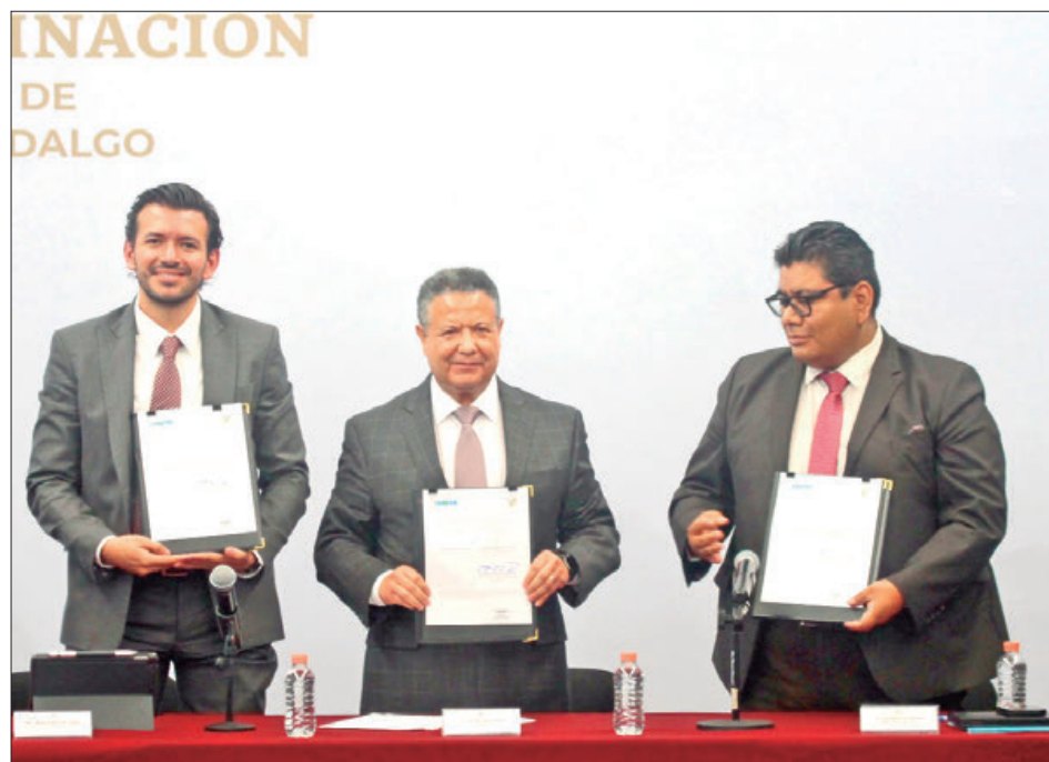
SINERGIÁ. Gobernador firma convenio de colaboración con el Consejo Nacional de Evaluación de la Política de Desarrollo Social.