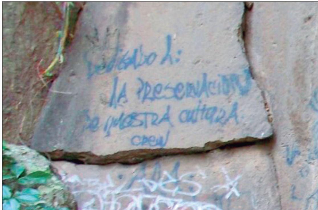
Lamenta alcalde que uno de los casos, en las recientes semanas, es el espacio de la colonia San Bartolo, intervenido para embellecerlo en dos ocasiones con el apoyo de la Iniciativa privada y posterior a ello fue devastado.

Durante la conferencia de prensa de este lunes, el presidente municipal de Pachuca, también manifestó que por parte del Sistema DIF de Pachuca, se realizará los días el 22 y 23 de noviembre en el salón Verabia de la