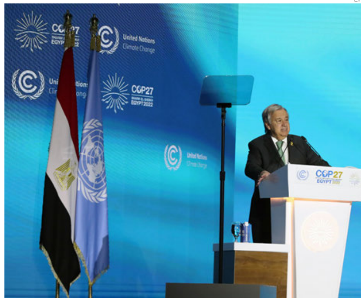
El secretario general de la ONU, Antonio Guterres, en su discurso de apertura de la Cumbre del Clima en Sharm el Sheij, Egipto.

El responsable de la ONU dijo en un discurso en la segunda jornada de la COP27 que, a pesar de los múltiples conflictos