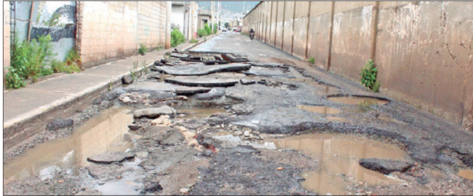
TEMAS. Propuestas para reconstruir caminos iniciarán este año, explica gobernador.

Además, de otras dos rehabilitaciones en Tlahuiltepa y Calnali con presupuesto del Fondo de Aportaciones a la Infraestructura Social Estatal (FAISE).