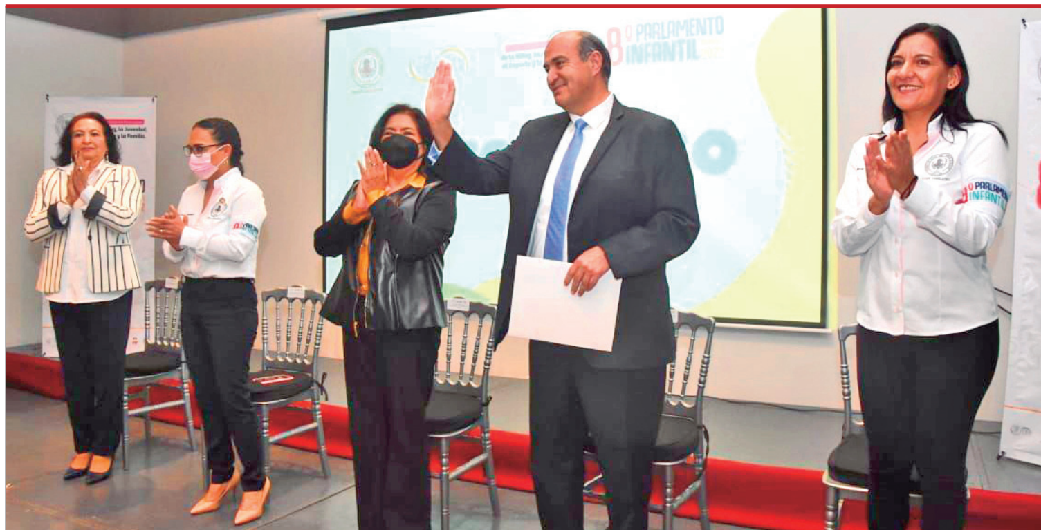
PARTICIPACIÓN. Comenzaron las actividades rumbo a la sesión en el Pleno del 8vo. Parlamento Infantil Hidalgo 2022.