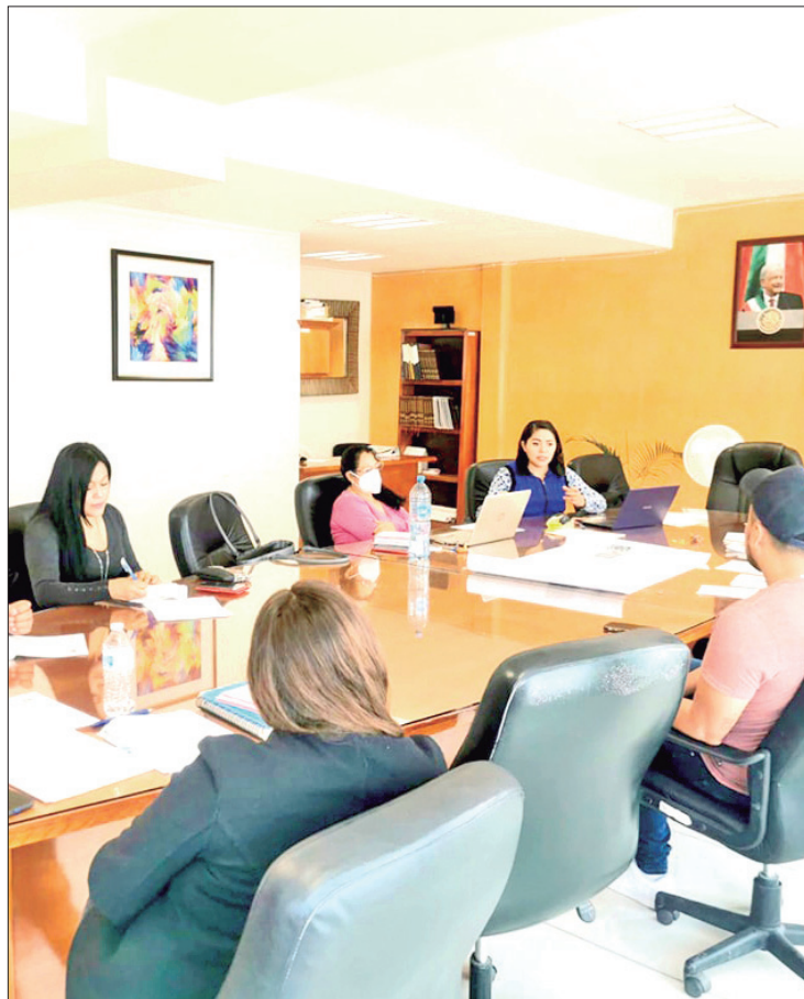
ANTECEDENTE. Desde el inicio de la gestión carecen de un mecanismo que regule el actuar de los asambleístas.

ORIGEN Iniciativa fue promovida debido a las faltas constantes que han tenido algunos regidores