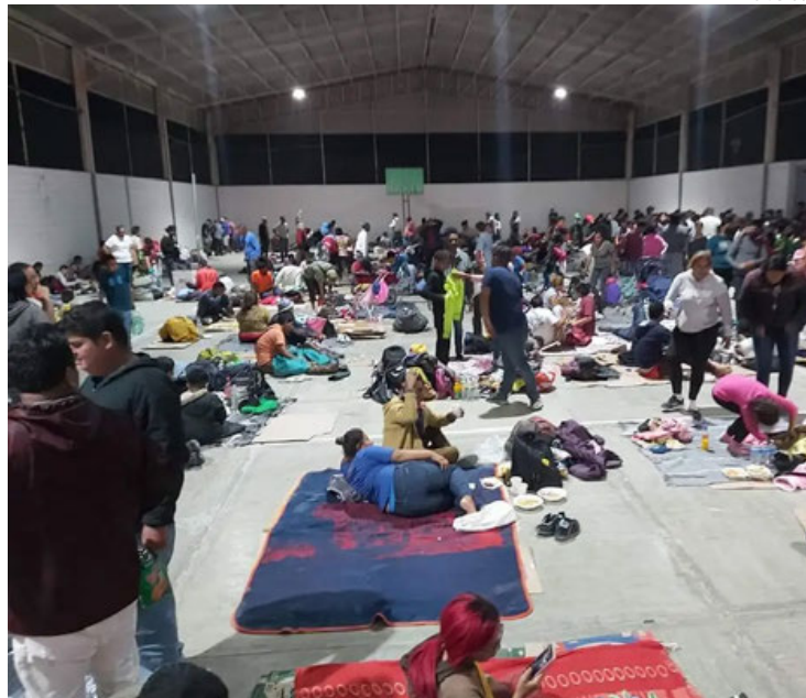
Migrantes en un albergue en El Paso.

go, las autoridades ya habían dejado en libertad a 1,744 migrantes porque ya no había camas disponibles en los albergues que operan grupos de voluntarios.