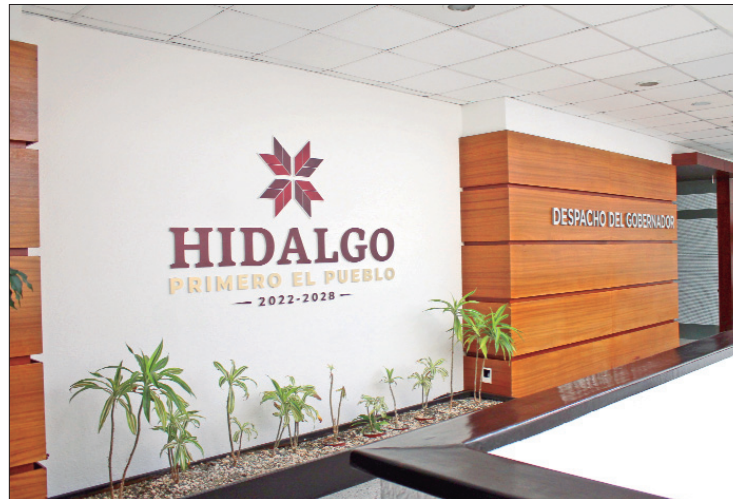
CERTEZAS. Dirigente del Sindicato Único de Trabajadores al Servicio del Poder Ejecutivo indica que reconocen en el gobernador la disponibilidad para resolver cada uno de los temas laborales de los trabajadores del estado.

Licona Cervantes manifestó que está pendiente lo que corres-