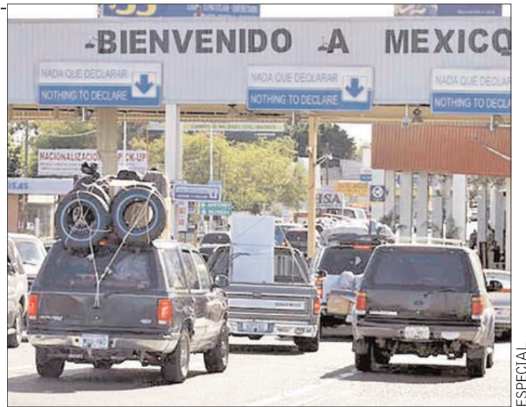
EJE. Exhorto a las autoridades de seguridad estatales y municipales es que cuiden a los migrantes hidalguenses.

La meta es proteger a los connacionales que después de varios años visitan a sus familias que dejaron en sus localidades, para mejorar sus condiciones económicas.