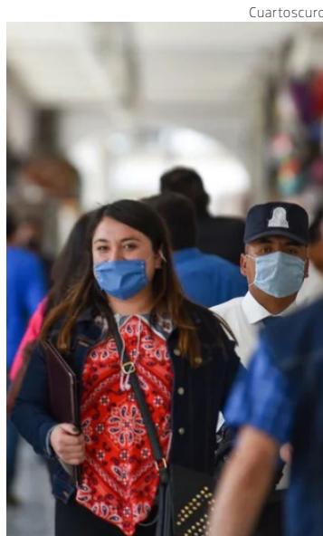
Los casos de COVID van en aumento en el estado.

Se detalló que en la actualidad la variante que predomina es la BQX con un 81.8 por ciento, lo cual se suma a la alta incidencia de casos de influenza y de sincitial respiratorio.