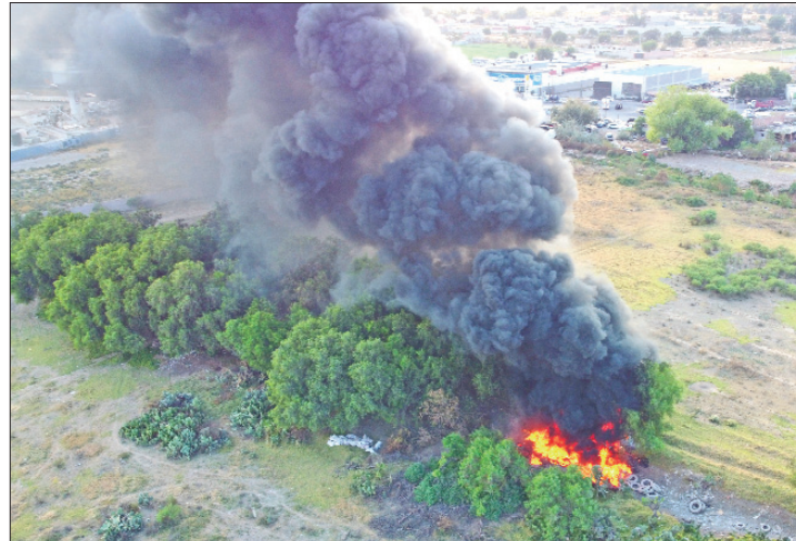
ALERTA. De noviembre a febrero, que corresponde a la temporada invernal, destaca la falta de lluvia, cielo despejado y disminución de temperaturas, por lo que estas condiciones contribuyen a la formación de inversiones térmicas durante las mañanas, así como partículas suspendidas.

A corto plazo este tipo de polución provoca dolores de cabeza, inflamación de la garganta y nariz, neumonía o bronquitis, tos y dificultad para respirar; a