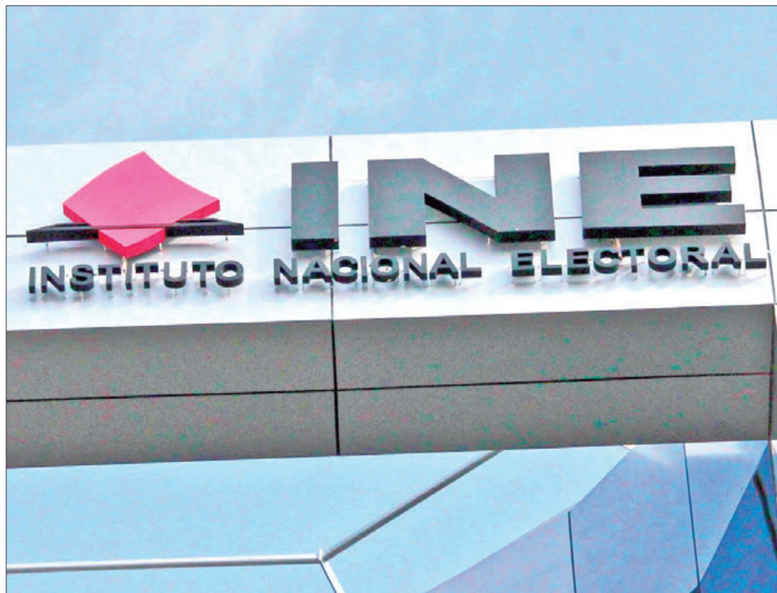
POR AHORA. Sólo PVEM y PAN controvirtieron los castigos que validó el Consejo General del INE.

► En el caso de Hidalgo son más de 23 millones, por eso algunas cúpulas recurrieron hasta Sala Superior para revocar las sanciones económicas