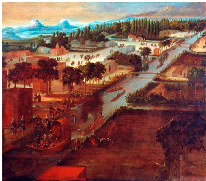
Paseo de la Viga, pintura de Pedro Villegas con fecha de 1706. Una de las primeras representaciones gráficas del pueblo de Iztacalco.