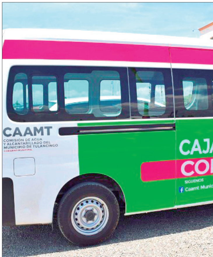
SENDA. Las poblaciones visitadas son notificadas por personal del organismo operador, con un aviso por no presentar su pago y si en menos de 24 horas el usuario no acude al ente público, se procede a realizar la suspensión del hídrico.

MARGEN También trabajan para detectar conexiones a la red, de manera irregular