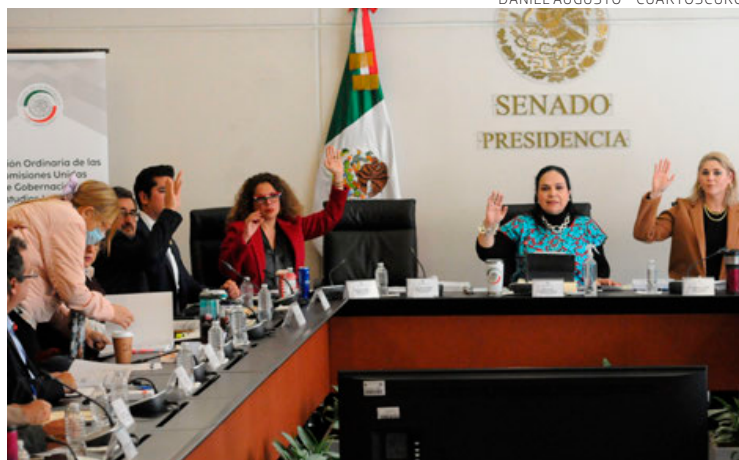
Morenistas de la Comisión de Gobernación dan su aprobación.

Mmm no lo sé, eso luego lo constataré, evadió •