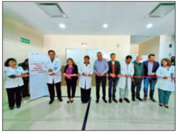
SSH. Evento en el Hospital General de Tulancingo.

► Hidalgo digitaliza modelo de triage hospitalario para reducir tiempos de espera ante urgencias médicas