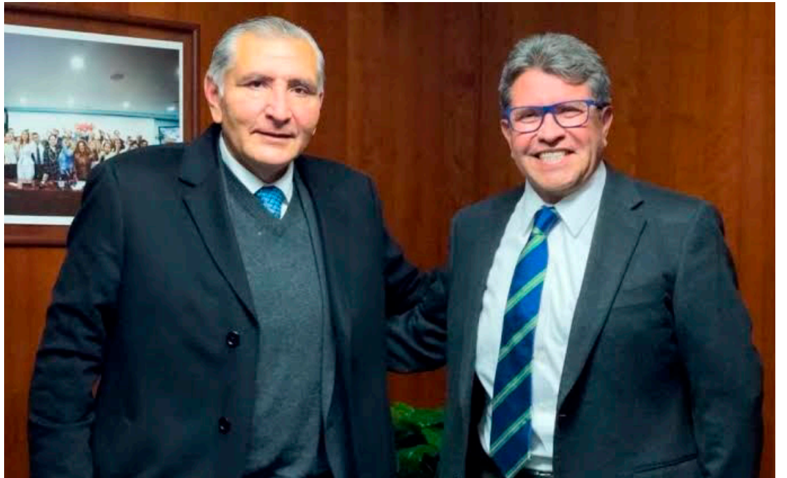
Adán Augusto López, secretario de Gobernación, con Ricardo Monreal, ayer en el Senado.

En tanto que durante la discusión de la Comisión de Estudios Legislativos Segunda, el senador Germán Martínez Cá-