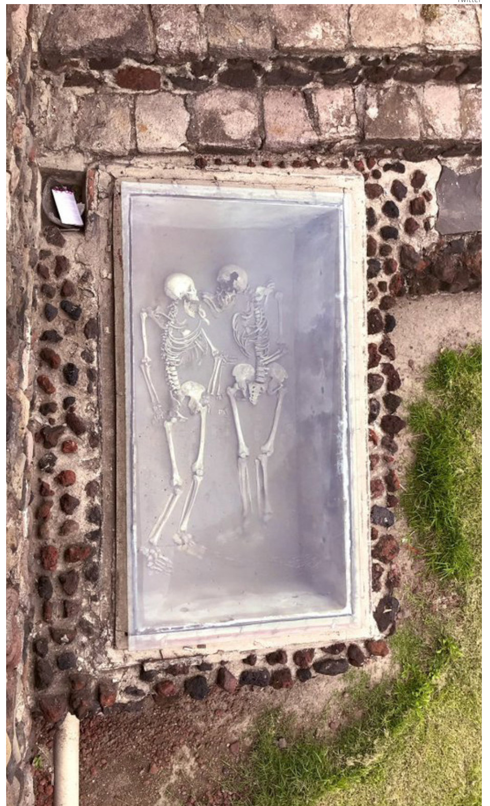
La pareja posiblemente murió en 1473 en Tlatelolco cuando esa ciudad enfrentó una guerra con Tenochtitlan.

“Cuando nosotros empezamos excavar en 1987, Paco Roldán, uno de los vigilantes nos contó cómo en los años 70 se taparon los trabajos de los arqueólogos y nos dijo dónde estaban los aman-