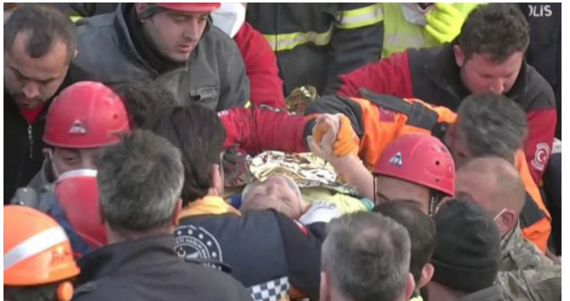
Captura de pantalla del niño rescatado en la provincia de Hatay, tras pasar 182 horas atrapado.

“Se dice que las personas pueden estar un día sin beber y una semana sin comer, pero la probabilidad de encontrar a las víctimas sepultadas con vida disminuye notablemente a partir de las 72 horas, aunque Naciones Unidas argumenta que factores como el acceso a hidratación de la persona sepultada o el material de la construcción de las viviendas pueden prolongar el período hasta los cinco o siete días”, subraya el especialista.