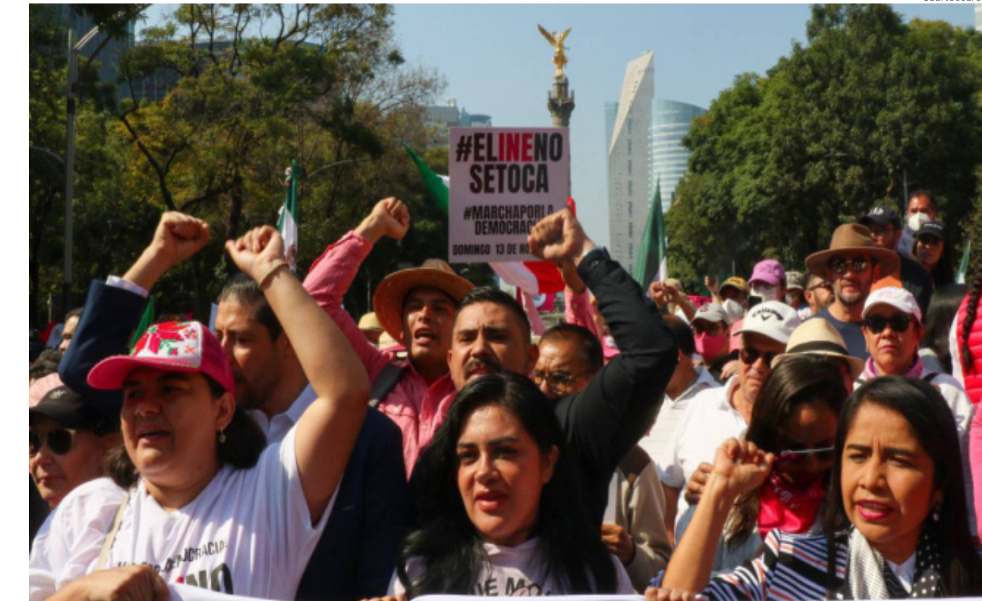
AMLO ya ha distorsionado la democracia mexicana, y la quisiera convertir en una entelequia, una mera fachada.

las frases de “yo sí pago impuestos”, como si no existiera el IVA y los asalariados formales no fueran causantes cautelosos. La idea de que el gobierno subsidia a “ninis”, quitándole el dinero a la clase media-alta. La de que ahora hay racismo inverso y llegó pura gente mal vestida y de pésimo gusto al poder.