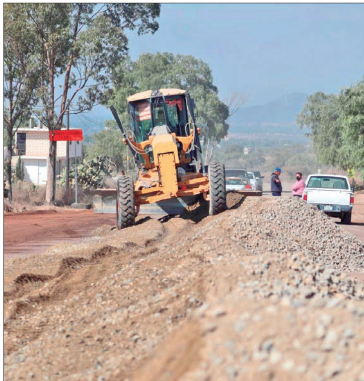
PROCESO. Los trabajos consisten en aplicar 23 mil 910 metros cuadrados de riego de sello, la construcción de 4 mil 166 metros cúbicos de base hidráulica y 20 mil 830 metros cuadrados de carpeta asfáltica.

De acuerdo con el contrato de ejecución, esta obra será concluida el 28 de febrero, para beneficiar a la población, gracias a la planeación y correcta