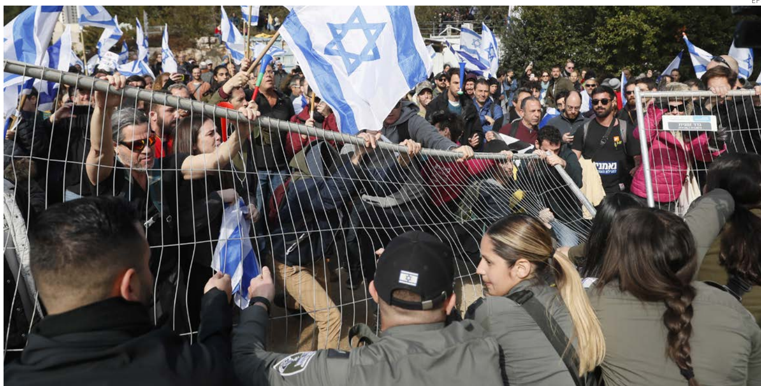
Manifesteros progresistas protestan con banderas israelíes frente al parlamento de Jerusalén contra el gobierno de extrema derecha de Netanyahu.