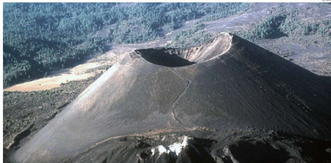
El congreso por el 80 aniversario del Parícutín es interdisciplinario gracias a la colaboración de tres instituciones de profundo arraigo en México.

El encuentro abarcará un abanico amplio de temas, de diferentes disciplinas, pues en los días de conmemoración tendrán la palabra 160 conferencistas que analizarán temas de geofísica como la aparición reciente de enjambres sísmicos en el occidente de México, pero también análisis sobre el patrimonio geológico e histórico las regiones volcánicas de Michoacán y reflexiones de artistas y antropólogos sobre la relación