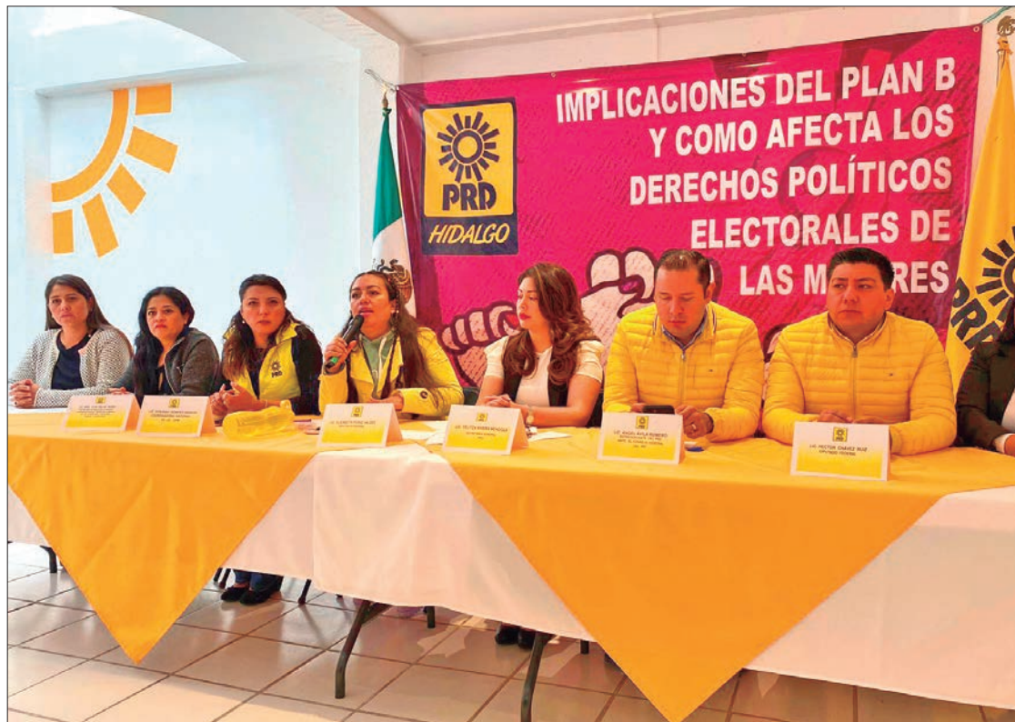
CONSIDERACIÓN. Además, algo muy grave como lo relacionado a la promoción de funcionarios públicos, lo cual permite que ahora las "corcholatas" o candidatos presidenciales de Morena utilicen recursos propios para difusión personalizada.

Recordó que inicialmente el gobierno de Andrés Manuel López Obrador con diputados y senadores de Morena, Partido del Trabajo (PT) y Verde Ecologista de México (PVEM), pretendían cambios constitucionales en la