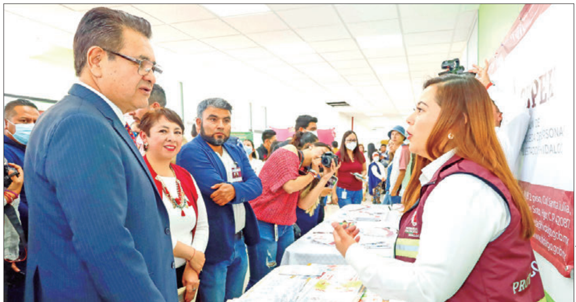
ESQUEMA. Relación de igualdad debe manifestarse en todos los órdenes, no nada más de palabra, no nada más porque así lo dice un ordenamiento: secretario de Gobierno.

El objetivo de la jornada es proporcionar información cla-