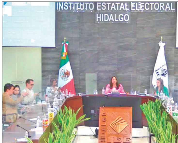
Representantes de PAN, PRI, PRD y Morena reconocieron el trabajo de los colaboradores del instituto, aunque señalaron algunos temas que son necesarios de revisar de cara al próximo año.