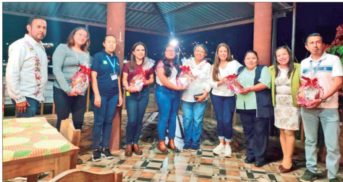
ACCIONES. Se llevó a cabo la primera mesa de trabajo multidisciplinaria organizada en la zona.

En particular, agregó, con grupos vulnerables como son las mujeres que se encuentran en zonas marginadas y que,