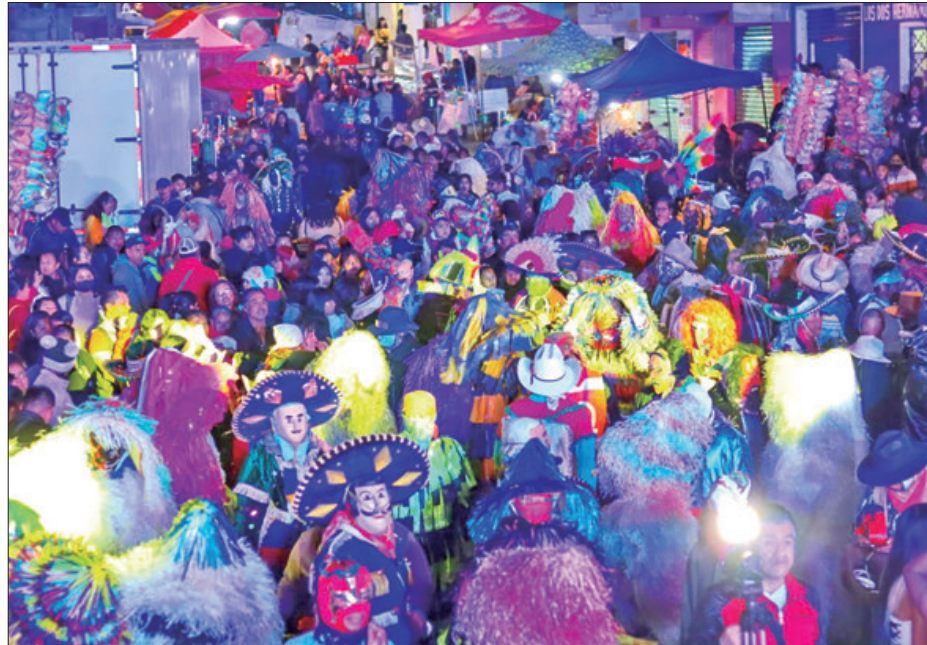
MOMENTOS. Lo principal fue que logramos un evento donde las familias y los visitantes pudimos disfrutar de las tradiciones de la ciudad, somos de los pocos barrios y colonias donde prevalece esta tradición y en ese sentido, esperamos que cada año se realice de forma más organizada.

"Lo principal fue que logramos un carnaval donde las familias y los visi-