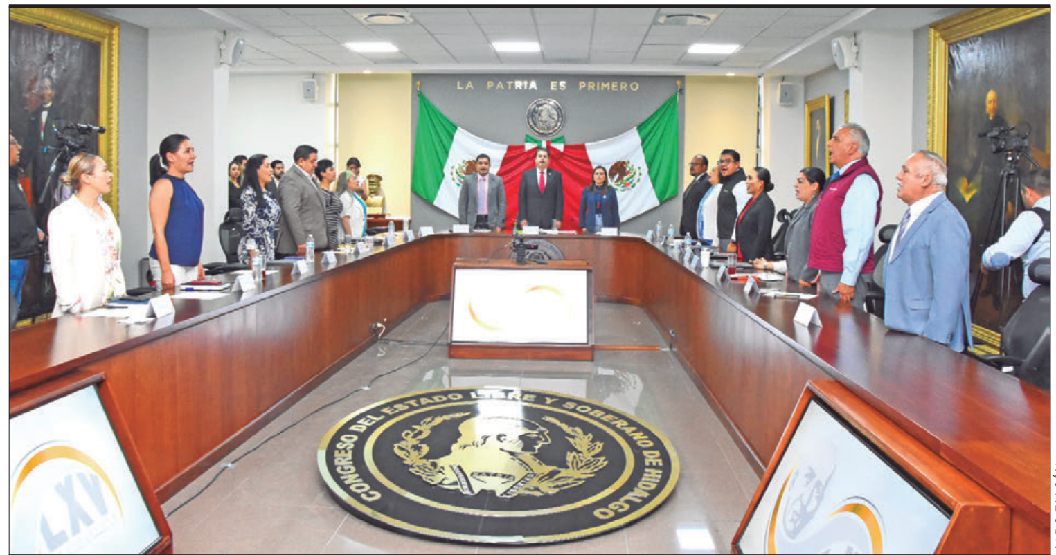
ACTIVIDADES Este martes se llevó a cabo la clausura de la Diputación Permanente que fungió en el periodo de receso de la LXV Legislatura de Hidalgo

Leines Medécigo retomó la palabra para proponer modificacio-