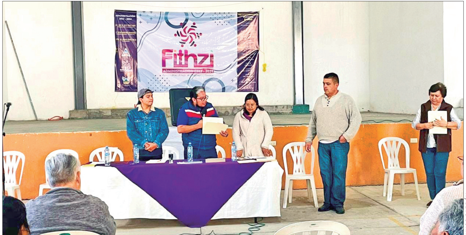
CLAVES. En ningún momento ésta ha solicitado esa clase de apoyo, por lo que pide no dejarse sorprender.

Hoy Nxutsi nace en el corazón del Valle del Mezquital con el apoyo de varias personas quienes pusieron su toque especial, pues esta muñeca busca también ser icono de una región. (Hugo Cardón Martínez)