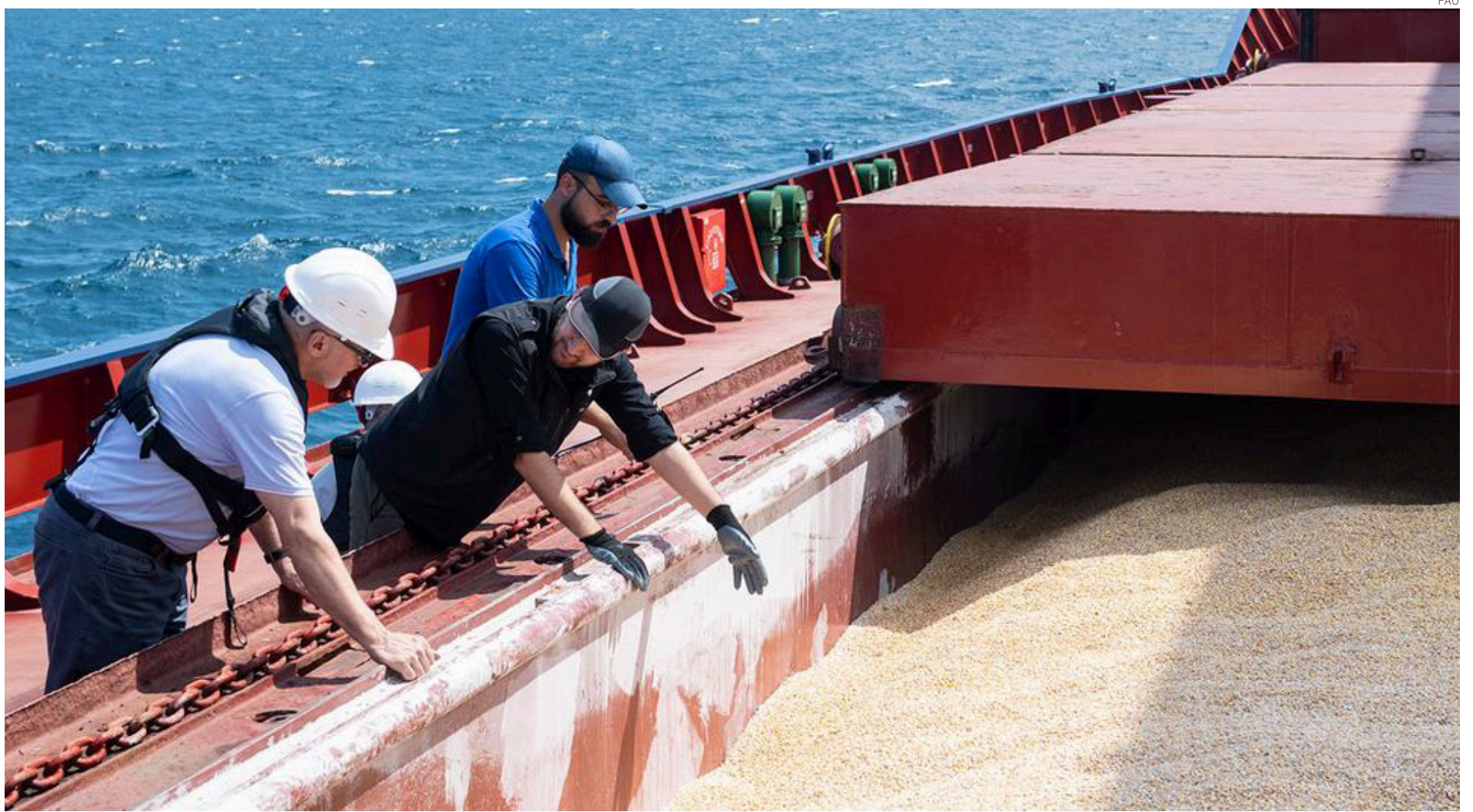
Una rara imagen de tregua bélica: funcionarios de Rusia, Ucrania, Turquía y la FAO inspeccionan un buque cargado con cereal ucraniano a su paso por Turquía en agosto de 2022.