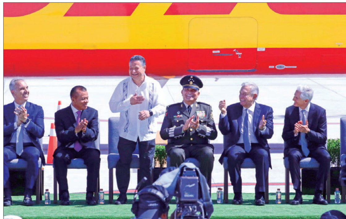
RUTA. Al finalizar el acto protocolario, Julio Menchaca Salazar acompañó a Andrés Manuel López Obrador al recorrido por el Centro de Distribución de DHL en el AIFA y a la inauguración del hangar de transferencia de Nexen E-Logistics.

El Presidente de México celebró que DHL superara la inversión inicial para ampliar sus operaciones en México de 6 mil millones de pesos y anunciara