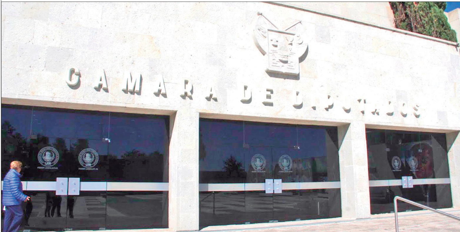
CONSTITUCIONAL. Este 1 de marzo inicia el segundo periodo ordinario de sesiones correspondiente al segundo año de ejercicio de la LXV Legislatura local.

La Constitución Política del Estado de Hidalgo señala que, durante el Segundo Período Ordinario de Sesiones, el Congreso se ocupará preferentemente de conocer el Informe del Resultado de la Revisión de la Cuenta Pública del Estado, las de los Municipios, las de los Organismos Autónomos y de cualquier persona física o moral que reciba por cualquier título recursos públicos.