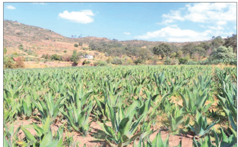
SEQUÍA. La falta de este fenómeno atmosférico afecta la producción agraria.

Añadieron que también se pretende lograr que el campesino siga apostando por la siembra de temporal en la intención de disminuir el interés del trabajador del campo por inclinarse por el trabajo en invernaderos el cual, a su consideración, ya no representa una plena labor del campo.