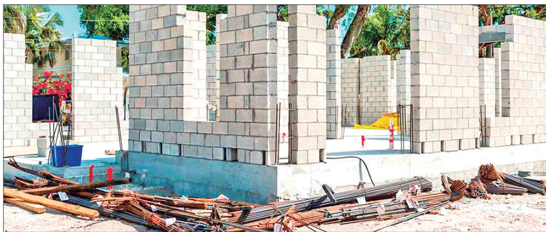
PANORAMA. Es Pachuca una ciudad en constante crecimiento urbano.

► Opinan colonos que alcaldía debe considerar escasez de agua antes de que sean otorgados