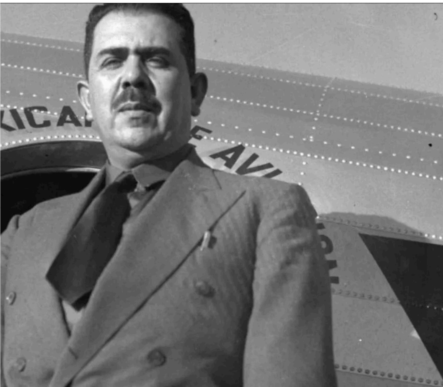
Lázaro Cárdenas del Río.

la CTM que dirigía el sovieta Vicente Lombardo Toledano, molesto con Múgica por varios asuntos, uno de los cuales era su apoyo al exilio en México de León Trotsky. Tampoco contaba con el respaldo de los campesinos, encuadrados en la CNC, y a través de ésta en el nuevo partido cardenista. Por lo que se refiere a las clases medias, éstas repudiaban a Múgica, igual que la Iglesia Católica y el empresariado. Alegaban que había sido un diputado constituyente muy jacobino y radical —ambas características ciertas—, en particular en los artículos 3° y 130, de educación y culto respectivamente; también se le reconocía como uno de los mayores impulsores de la Ley de Expropiación, de 1936.