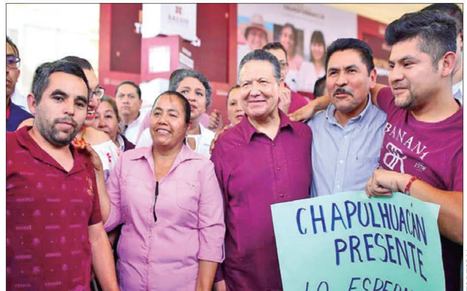
JMS. Antes, quién sabe en qué se gastaban los recursos, eso se terminó, estamos rindiendo cuentas y combatiendo a la corrupción para estar a la altura de la ciudadanía, que cada vez es más consciente y más crítica.

Por la tarde, en Nicolás Flores, Menchaca Salazar, recalcó: "He asumido el compromiso de trabajar con ustedes para impulsar a Hidalgo, combatir la corrupción, enfocar los recursos para el campo y evitar que grandes profesionistas migren a otros lugares".