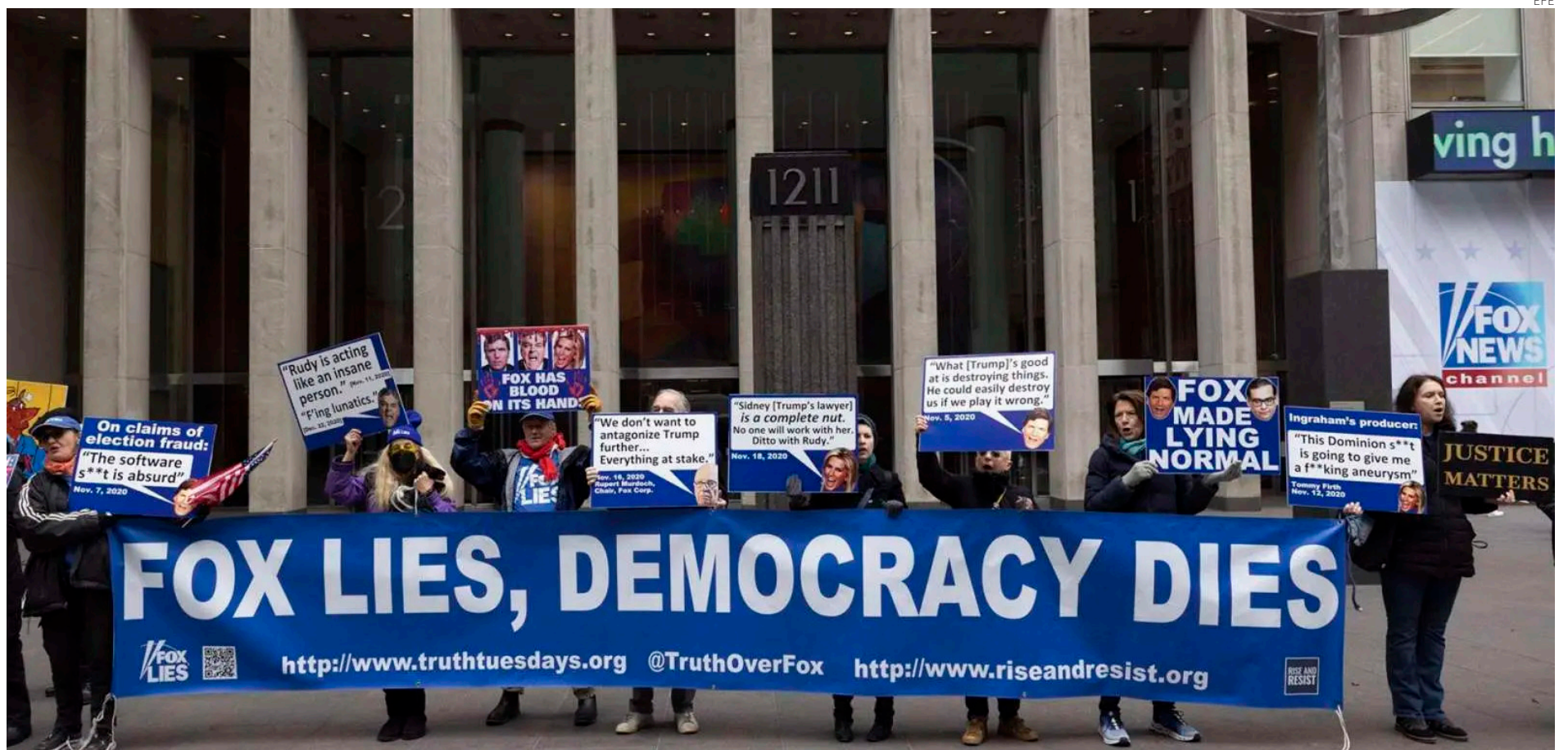
Manifestantes denuncian las mentiras de Fox y su complicidad con Trump frente a la sede del canal en Nueva York.