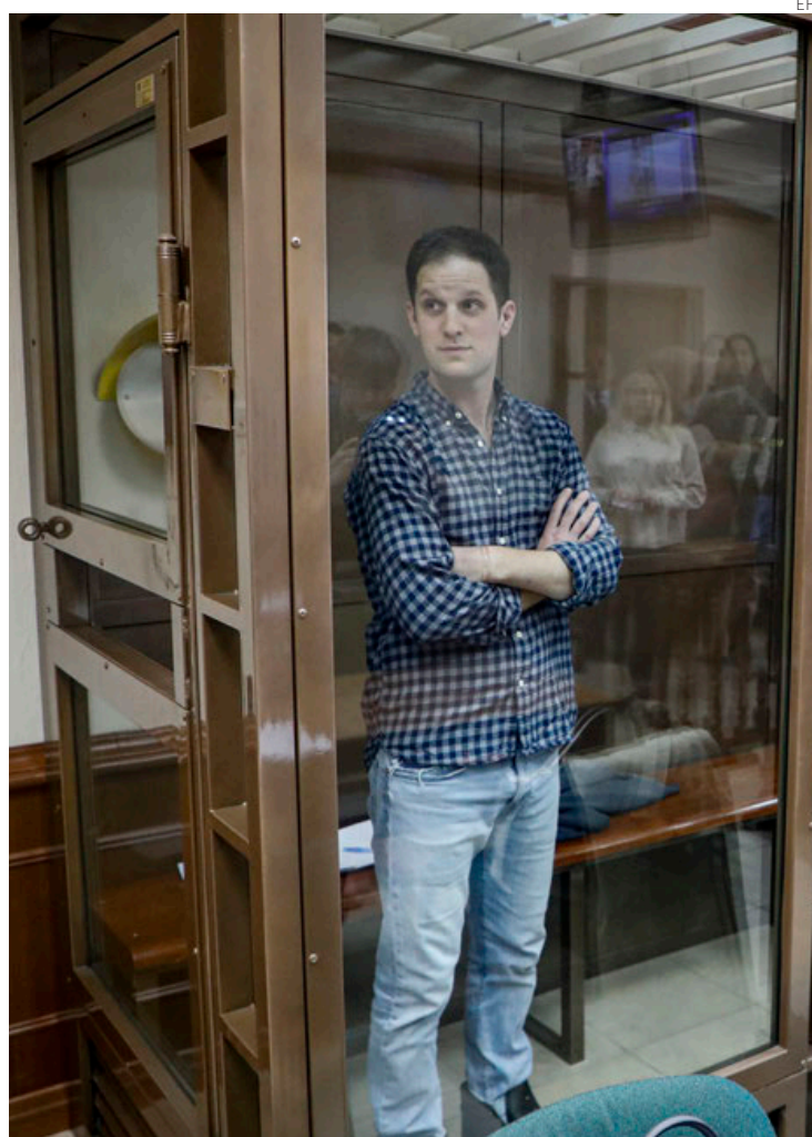
El corresponsal estadounidense Evan Gershkovich siguió el juicio en un tribunal de Moscú desde una cámara de cristal.

“La acusación no se basa en nada y seguiremos exigiendo a