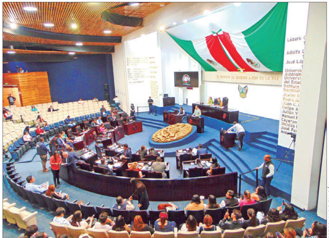
LABOR. Este martes sesionaron las y los integrantes de la LXV Legislatura del Congreso de Hidalgo.