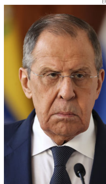
Lavrov en Caracas.

44 MIL MDD ANUALES PERDIDOS Además, desde 2015, “Venezuela perdió en promedio 44,000 millones de dólares” anuales