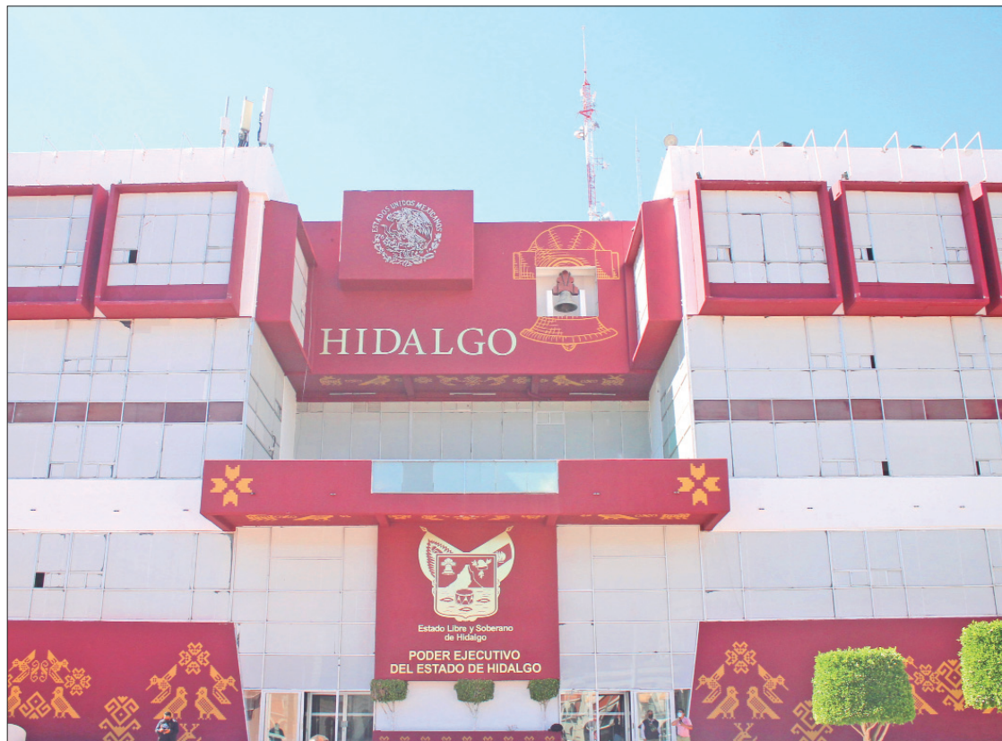
MARGEN. Tendrá diferentes objetivos, tales como contribuir al cumplimiento oportuno de metas y objetivos institucionales con enfoque a resultados, mejora de programas presupuestarios; administrar riesgos con el análisis y seguimiento de estrategias y acciones de control determinadas en el Programa de Trabajo de Administración de Riesgos.

Evaluación de variaciones y resultados operativos, financieros, presupuestarios y administrativos, proponer acuerdos con medidas correctivas para subsanarlas; identificar acciones preventivas en la ejecución de pro-