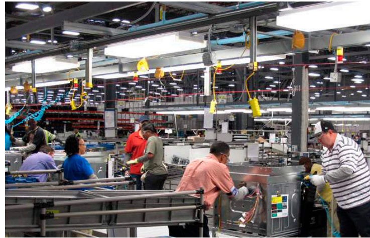
El sector industrial creció 3.5% anual en febrero y 3.0% anual en el tercer mes del año.

La economía medida a través del IOAE subió 0.7% en febrero con respecto a enero y 0.1% en marzo con respecto al segundo mes del año