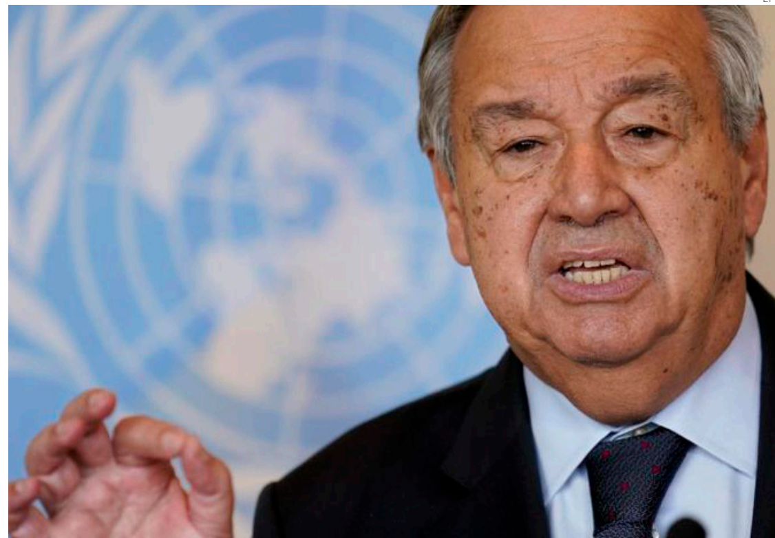
António Guterres, secretario general de la ONU

Guterres se suma a la queja del gobierno mexicano, que denuncia que está “bajo asedio”