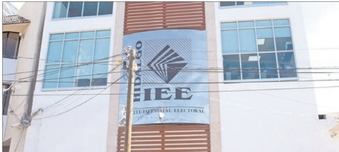
CAMINOS. Ahora recurrieron ante Sala Regional Toluca para impugnar las sentencias del Tribunal Electoral del Estado.

Entonces, varias recurrieron al tribunal hidalguense para invalidar lo establecido por el Consejo