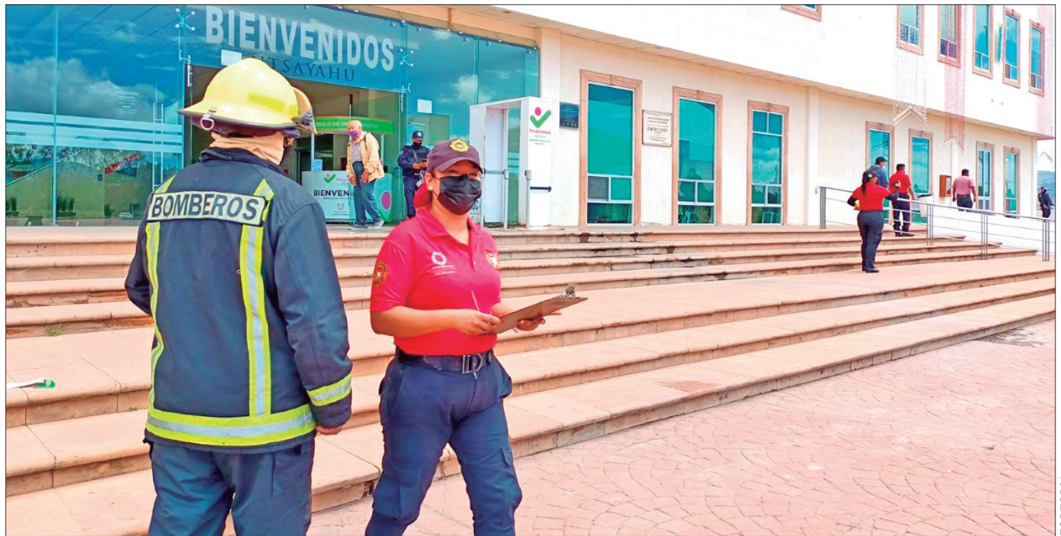
ESLABONES. Ayuntamiento de Tulancingo y la Dirección de Bomberos y Protección Civil suman a las actividades de este ejercicio, que impulsa la Coordinación Nacional de Protección Civil.

Para mayor información, se debe acudir a las oficinas de la dirección de Desarrollo Comercial ubicadas en la planta baja de la Presidencia Municipal. (Staff Crónica Hidalgo)