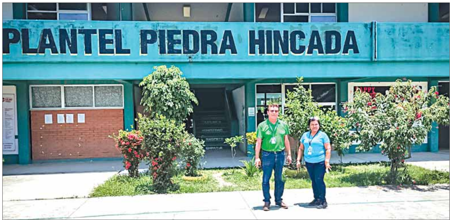
ESTADÍSTICA. Estos planteles forman parte de una muestra del 10 por ciento de 132 centros educativos.

Asimismo, exhortó a los elementos de la Policía Industrial Bancaria a que participen, que pregunten, que analicen, y que no se queden con dudas, pues es muy importante ir avanzando en su adiestramiento, capacitación, actualización y profesionalización. (Staff Crónica Hidalgo)