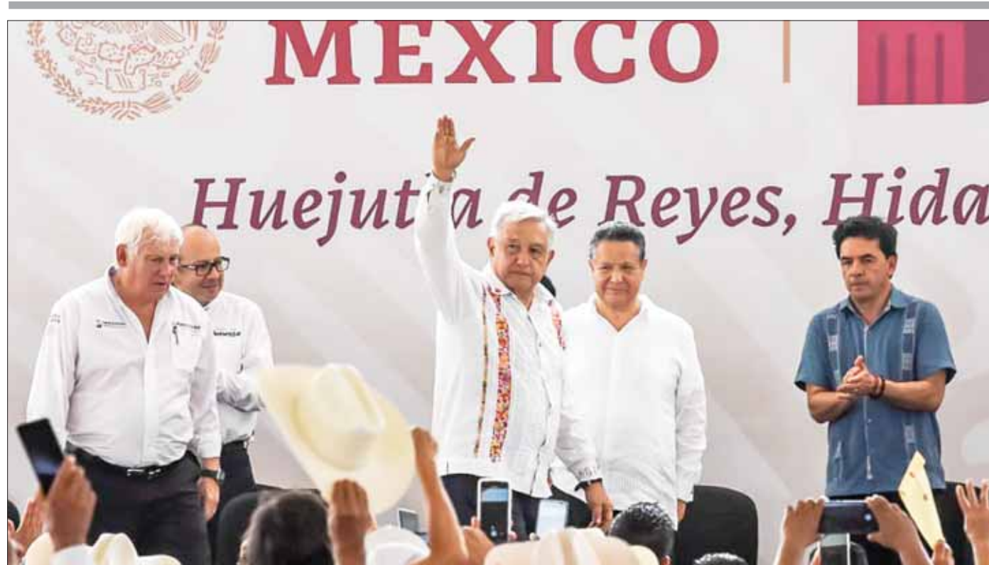
En el marco de la visita del presidente Andrés Manuel López Obrador, el gobernador Julio Ramón Menchaca Salazar reconoció en sus redes sociales que, "sus reiteradas visitas a Hidalgo y su ejemplo de servicio al pueblo con una entrega total, nos motivan, nos impulsan y nos comprometen a redoblar esfuerzos para que las y los hidalguenses tengan esperanza y la certeza que transformar al estado significa una vida mejor, con justicia, con dignidad y sobre todo, con un legado de bienestar para las nuevas generaciones".

"Señor presidente, en Hidalgo somos beneficiarios de su política: aquí pensamos primero en las y los más pobres. En Hidalgo le acompañamos, pues este año destinamos más de 2 mil 100 millones de pesos en 6 programas sociales, esa es nuestra obligación y nuestro compromiso". 3