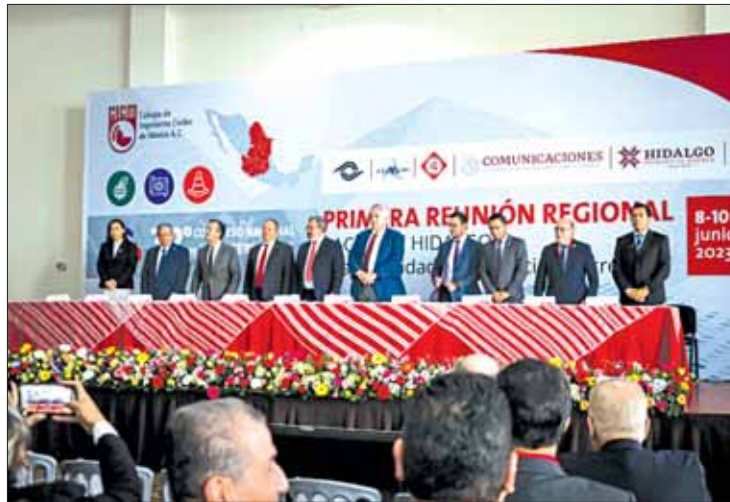
PROYECTO. Hidalgo aprovecha su posición privilegiada, así como su cercanía con el nuevo Aeropuerto Internacional Felipe Ángeles.

De igual manera, manifestó que Hidalgo aprovecha su posición privilegiada, así como su