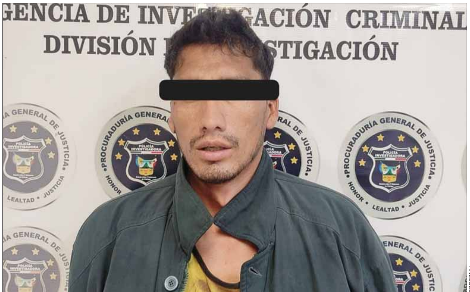
COLABORACIÓN. La Fiscalía de Edomex detuvo mediante orden de aprehensión a quien es identificado como D.A.H.C.

El Estado de derecho y el combate a la corrupción son prioridad para transformar a Hidalgo, al igual que garantizar a la población sus derechos humanos, por lo que continuarán los operativos en toda la entidad, con participación interestatal y federal.