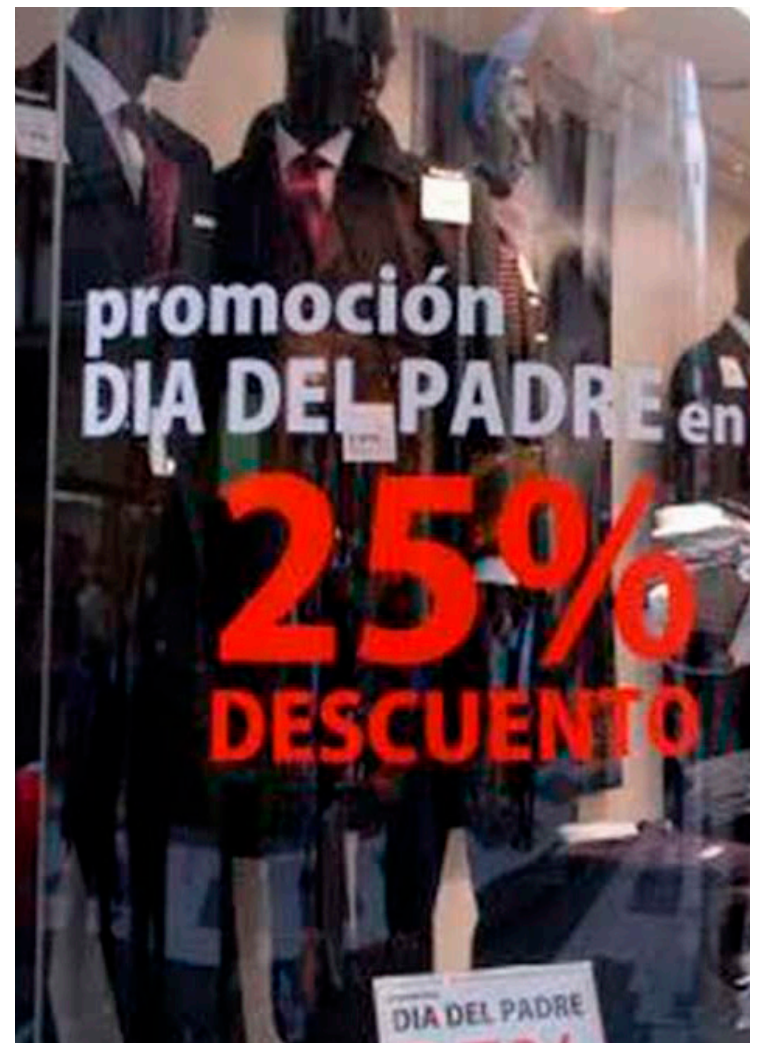
Un festejo para el comercio, servicios y turismo.

“Sabemos que, tanto de manera física como a través del comercio electrónico, existe una tendencia al alza en las com-