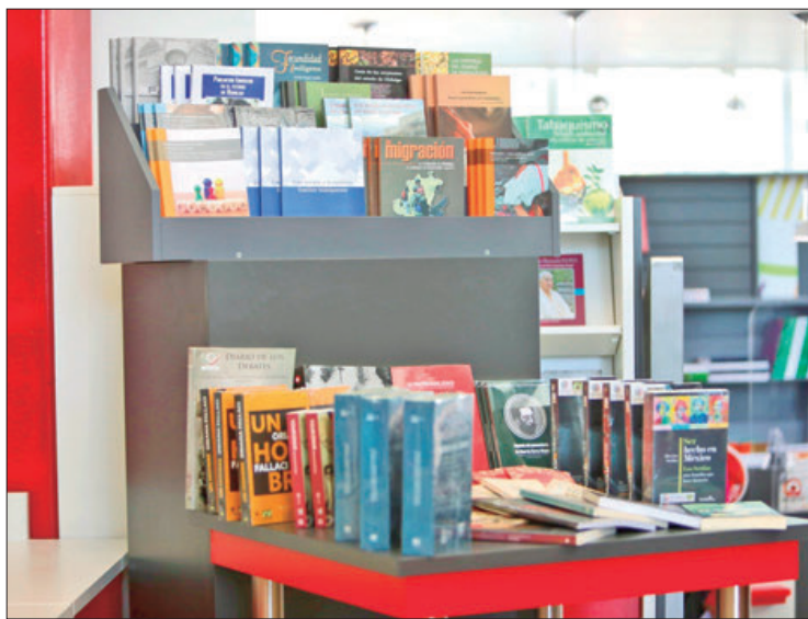
PASOS. La Coordinación Estatal de Bibliotecas de la dependencia estatal será la encargada de la distribución de las publicaciones.