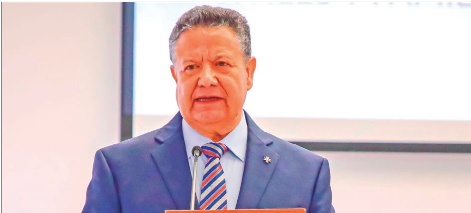
ARTÍFICES. Primer mandatario de Hidalgo resaltó el compromiso que guarda con el acceso a la justicia pronta y expedita.

► Gobernador recordó que durante su paso por el Senado de la República presentó junto a Ricardo Monreal Ávila la iniciativa para expedir el Código Nacional de Procedimientos Civiles y Familiares