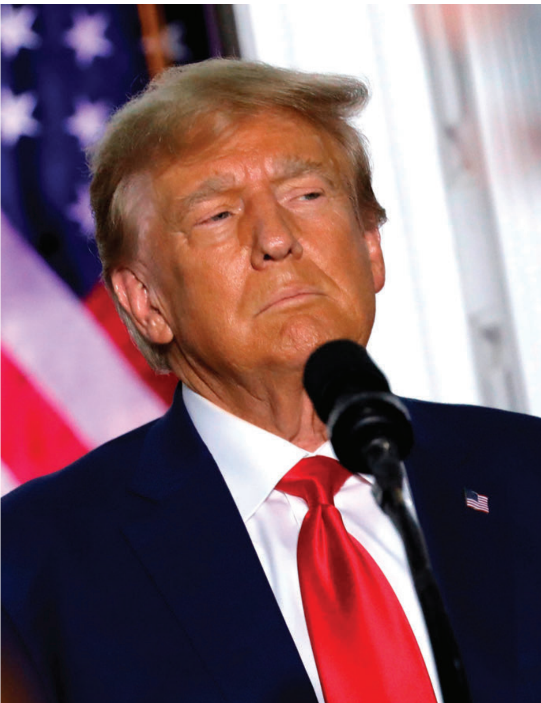
Como Trump se presentó voluntariamente, se libró de la humillación de ser fotografiado mientras era arrestado por la fuerza.

niels, y nuevamente después de que un jurado federal lo encontrara responsable de agredir y difamar a la escritora E. Jean Carroll.