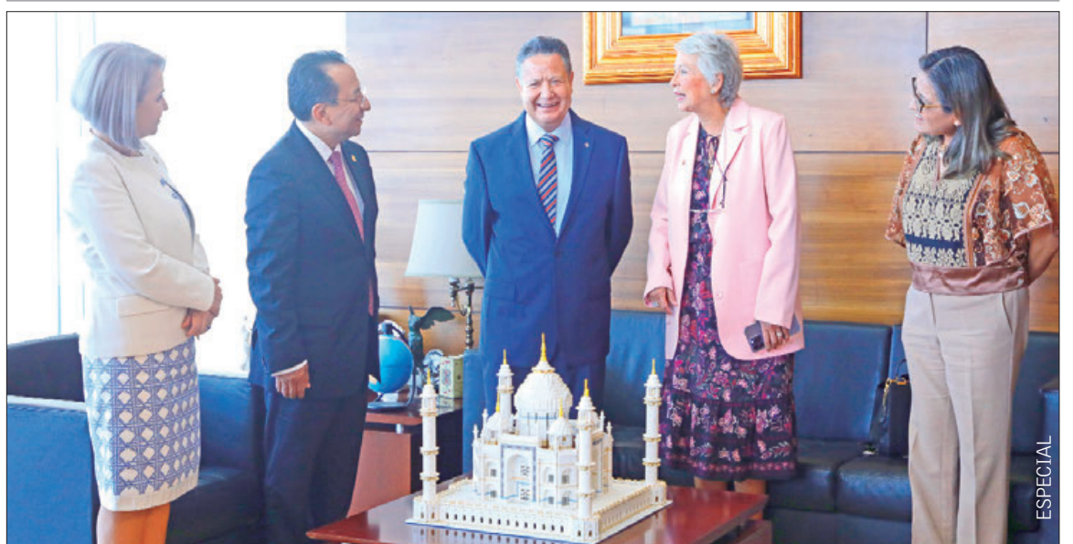
JULIO MENCHACA. Desde el Senado de la República, tuvo la oportunidad de trabajar en iniciativas que impulsan el bienestar de Hidalgo y de todo México. Me dio gusto asistir a la implementación del Código Nacional de Procedimientos Civiles y Familiares, que consolida un proyecto de justicia social para las y los mexicanos. Agradezco las atenciones del magistrado Rafael Guerra y de mi amiga Olga Sánchez Cordero.

"Con la disparidad en los códigos, la justicia está muy alejada de las y los mexicanos. El reto es muy grande, pues la actualización debe involucrar a todos los actores sociales y políticos"; el proceso de implementación de estas nuevas disposiciones deberá concluir el 1 de abril de 2027. 3