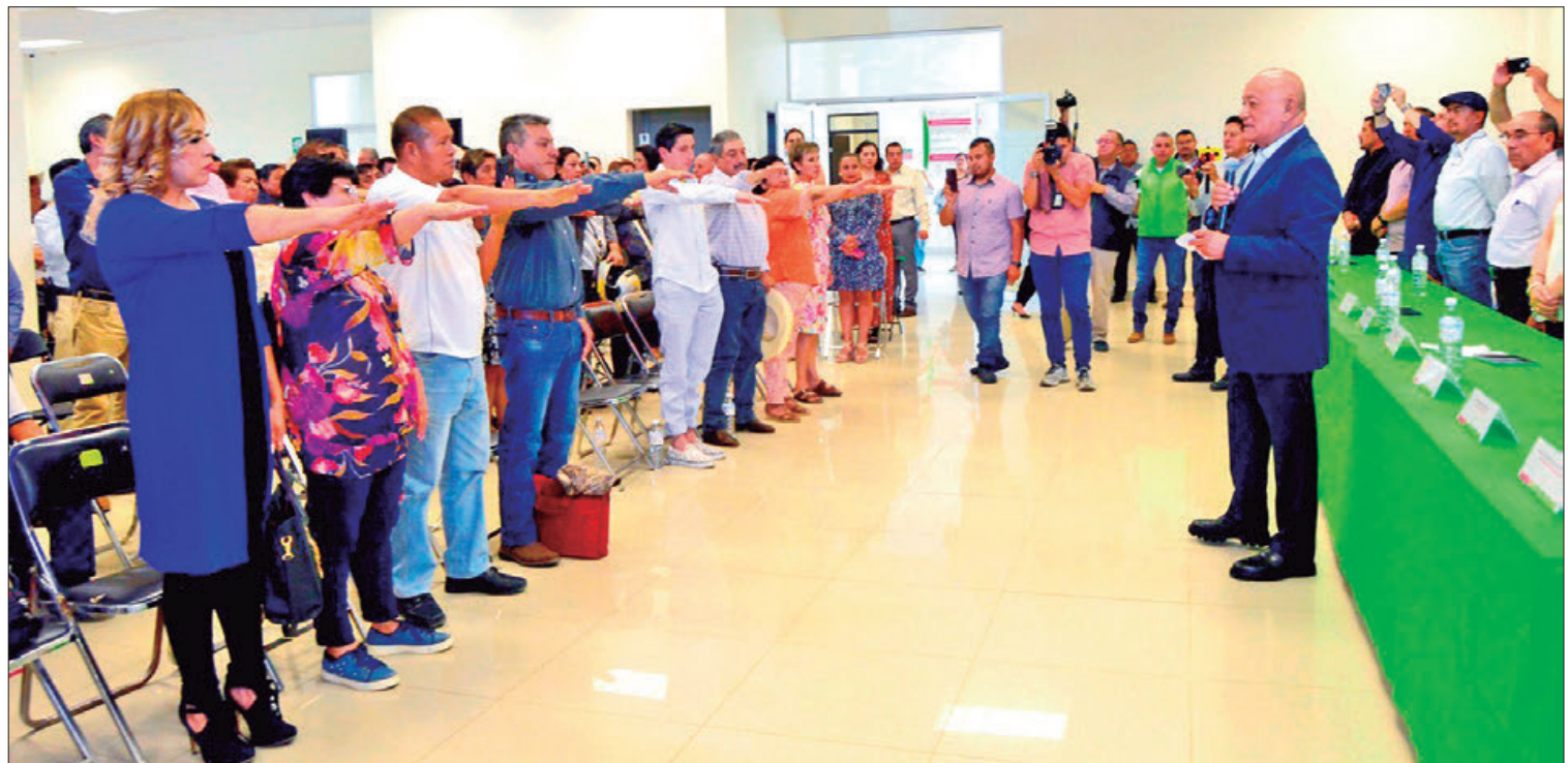
ACTO. El primer mandatario municipal pidió a los nuevos enlaces vecinales a conducirse con honorabilidad, respeto y con apego a las leyes locales.