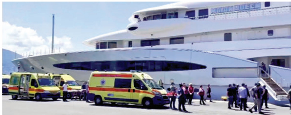
El Mayan Queen IV fue una de tres embarcaciones que asistieron al rescate.

El Mayan Queen IV, de la familia Baillères, acudió al auxilio en el Mar Jónico. Hay al menos 79 muertos