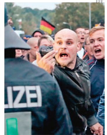
Neonazis en Alemania.

Lamentó que las “mentiras descaradas” ganen credibilidad al mismo nivel que los hechos y la ciencia, y señaló que a menudo son promovidas