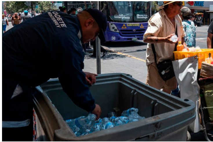
En Monterrey regalan agua para que la población se hidrate.

“La gente empieza a consumir más energía eléctrica para poder sobrevivir a las olas de calor, las personas utilizan más por