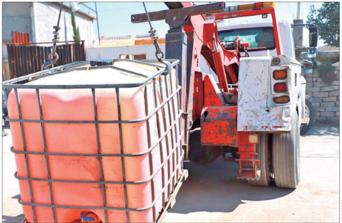
ACCIONES. Los hechos se registraron en la colonia Plutarco Elías Calles de Pachuca y en la localidad de El Mercillero, Epazoyucan.

Se informó que la Secretaría de Seguridad Pública de Hidalgo, que encabeza Salvador Cruz Neri, continúa con despliegues operativos para el combate contra la delincuencia, por lo que reitera el llamado a la ciudadanía para contribuir con estas acciones, realizando reportes mediante el 911 de Emergencias y/o al 089 de Denuncia Anónima.