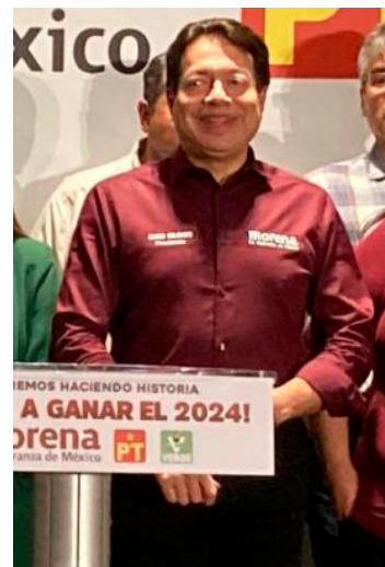
El dirigente nacional de Morena, Mario Delgado.

Morena, PT y PVEM anunciaron su alianza electoral y legislativa rumbo a las elecciones del 2024 donde se coaligarán para la presidencia de la República, Senado, Cámara de Diputados y las 9 gubernaturas que estarán en disputa el próximo año y que pretenden ganar la mayoría calificada en el Legislativo.