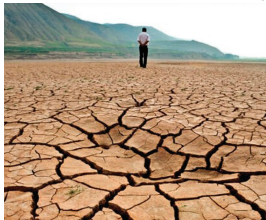
Francia pidió que el sector privado se ponga al servicio del planeta.

El presidente colombiano, Gustavo Petro, demandó un “plan Marshall” para financiar la lucha contra la crisis climática y cuestionó la capacidad del mercado para resolver los problemas que ha generado. (Alan Rodríguez, con información de EFE)