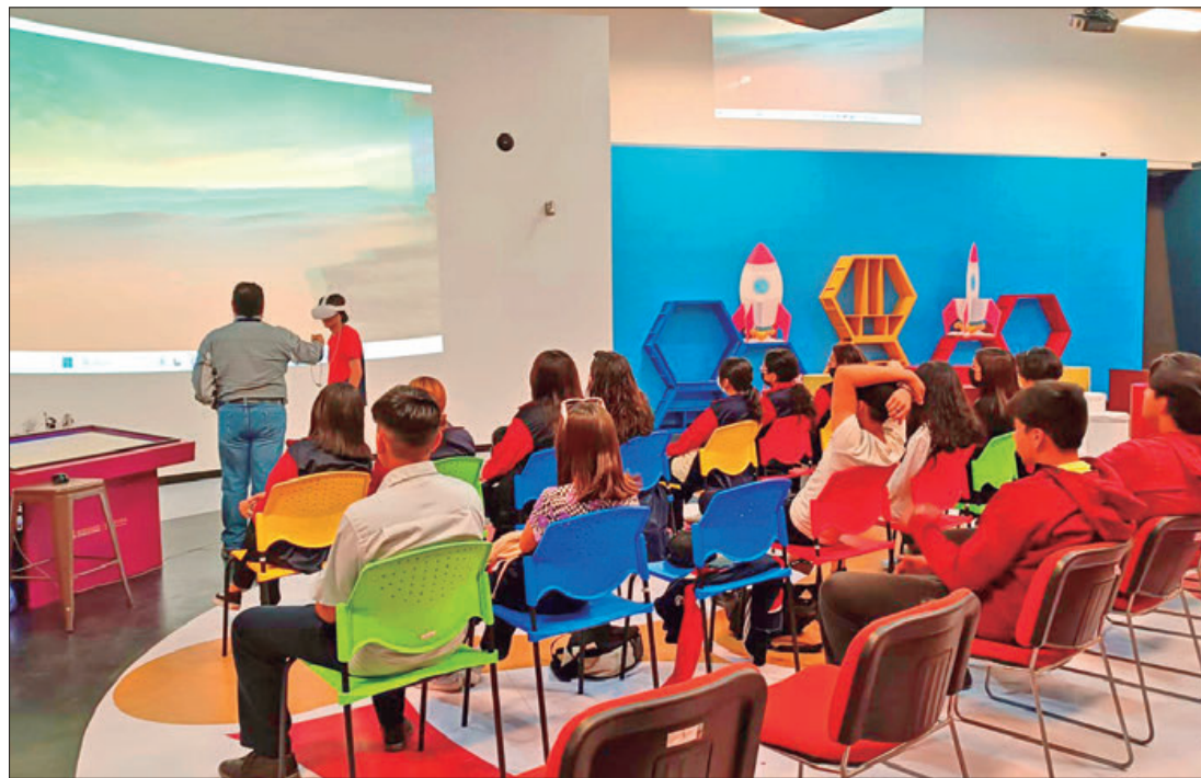
OBJETIVO. Fomentar la exploración, la experimentación y la innovación en la convergencia entre cultura y tecnología.

guense podrá disfrutar este viernes de El sueño de los elefantes , considerado el primer cortometraje de animación realizado con software libre distribuido bajo licencias de conocimiento.