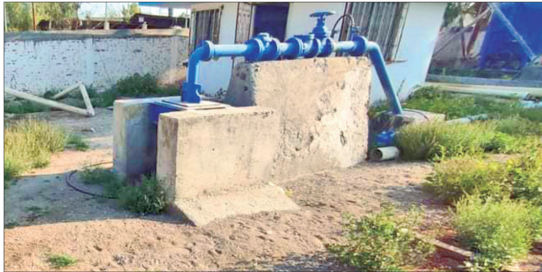
CLAVES. Deuda superior a los 40 mil pesos, con CFE.

A través de un comunicado, el Ayuntamiento informó que la Comisión de Agua y Alcantarillado de Actopan ya trabaja en restablecer el servicio a la brevedad. (Hugo Cardón Martínez)