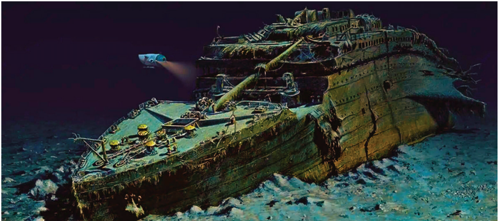
Simulación de una visita del Titán al Titanic.