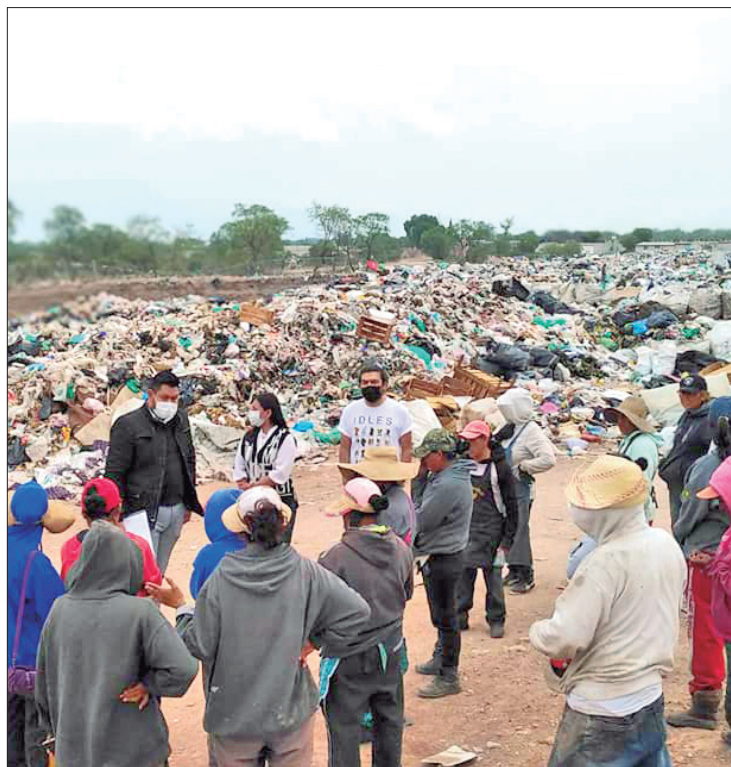
FRANCISCO I. MADERO. Pobladores obligaron a alcalde a retractarse de un convenio de un relleno sanitario regional.

El único Relleno Sanitario Regional que ha llegado a concretarse ha sido el de Alfajayu-