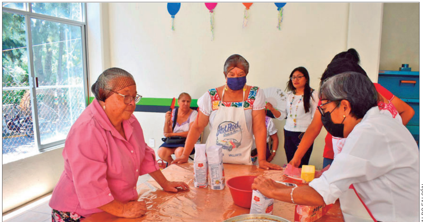
SEDES. El IAAMEH desarrolla talleres de panadería en los municipios de Tepeapulco, Zacualtipán, Tulancingo e Ixmiquilpan.

Del mismo modo, se capacita a usuarias y usuarios en materia de repostería, donde se enfocan principalmente en cocinar galletas y pastes. Este taller se realiza en los Centros Gerontológicos de Pachuca, Acaxochitlán y Apan, así como en las Casas de Día de Tlaxcoapan y Almoloya, con una participación de entre 25 y 30 personas mayores por grupo en cada municipio.