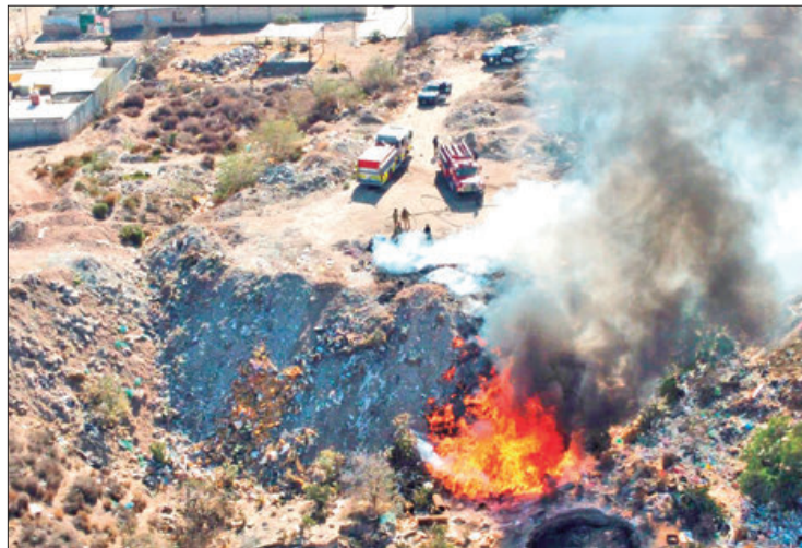
ESTADÍSTICAS. Campo de Tiro, Colosio, Renacimiento, Pitahayas, así como en El Huixmí, lugares más señalados.

desechos en espacios cercanos a zonas urbanas representa también un alto riesgo, ya que son prácticas que no se pueden controlar fácilmente y ponen en riesgo el patrimonio de los habitantes.