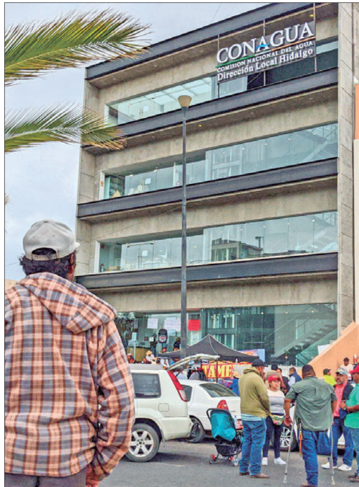
DESATENCIÓN. La Conagua tampoco ha pagado a los campesinos los daños ocasionados tanto por inundaciones.

Los inconformes también exigieron que personal de la Conagua en el estado realicen su trabajo en favor de la población o en determinado caso, afirmaron que su existe incapacidad para desempeñarse que abandonen