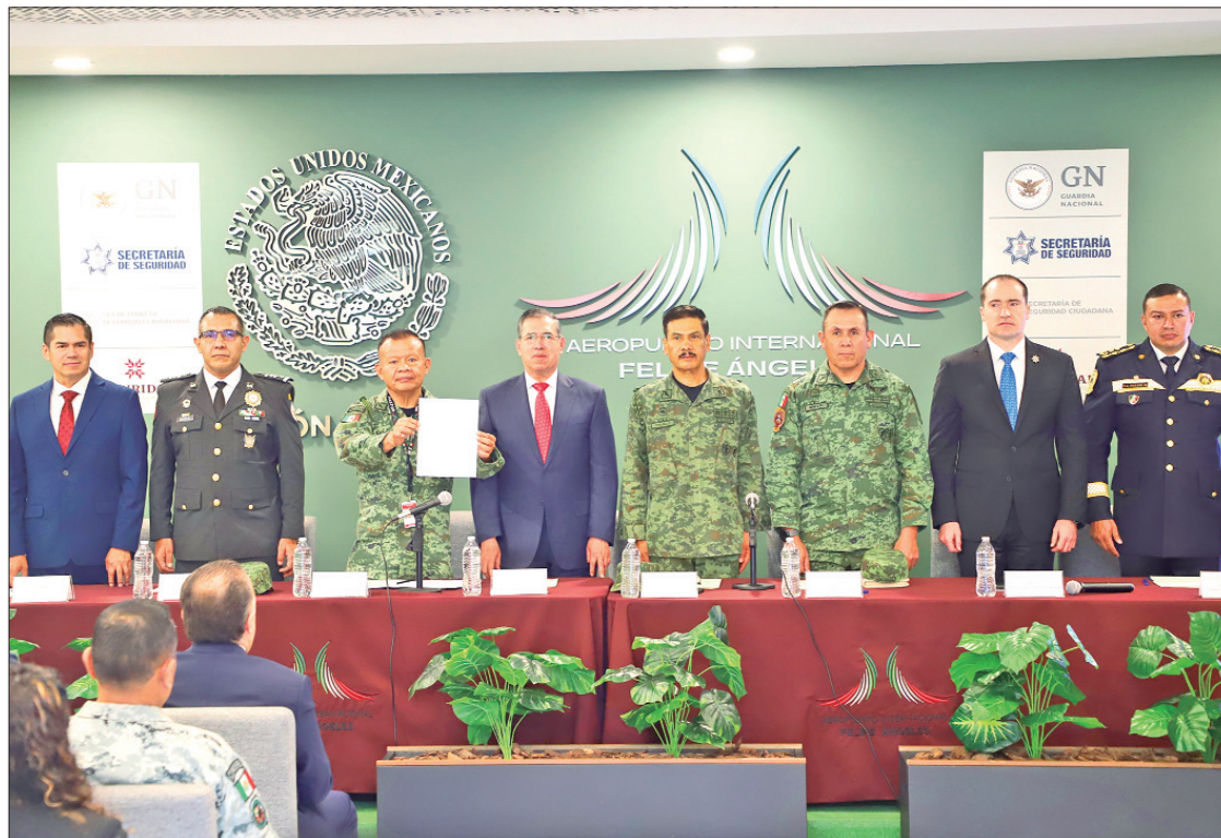
COORDINACIÓN. El convenio establece el desarrollo de estrategias, instrumentos y acciones destinadas a la seguridad de los viajeros y en las carreteras por donde transitan.

mentación de infraestructura y herramientas tecnológicas, tales como arcos carreteros, cámaras de videovigilancia, además del intercambio de información estratégica que contribuya en actividades preventivas o rastreo de delitos relacionados con el robo al autotransporte de carga, así como el desarrollo de operativos conjuntos entre las instancias de seguridad participantes.