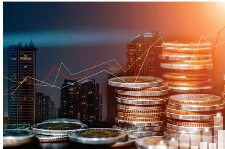
La tendencia de apreciación del peso, signo de estabilidad.

sisten riesgos globales para la estabilidad financiera. Por un lado, el proceso de recuperación de la economía mundial podría verse rezagado por una desaceleración mayor a la anticipada, y persiste la posibilidad de que las presiones inflacionarias se extiendan, que se presente un agravamiento de las tensiones geopolíticas, o que las condiciones financieras se aprieten.