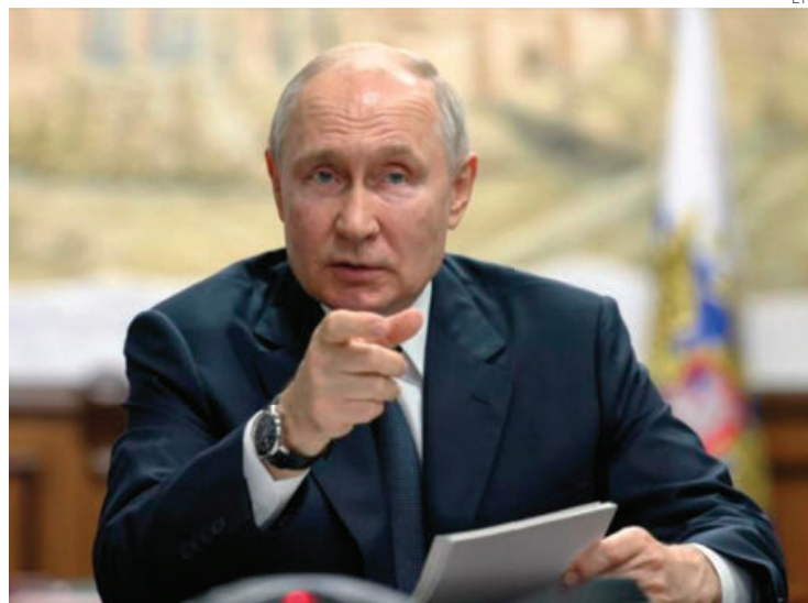
Putin hace diplomacia en países como Siria, la República Centroafricana y Mali.

Asimismo, altos funcionarios del Ministerio de Asuntos Exteriores se comunicaron telefónicamente con el presidente de la República Centroafricana, Faustin Archange Touadéra,