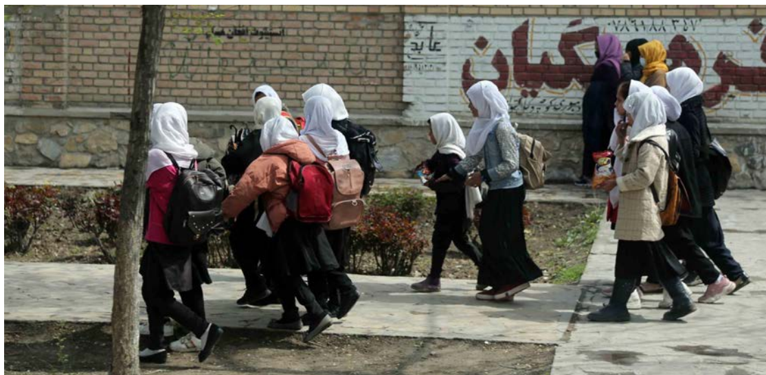
Niñas se dirigen a una escuela en Kabul; donde sólo tienen derecho a cursar primaria, por orden del régimen talibán.

Hasta 56 de las alumnas de primaria fueron envenenadas el pasado sábado, además de 3 maestras, un maestro, dos conserjes y un padre en una escuela de la provincia norteña de Sar-