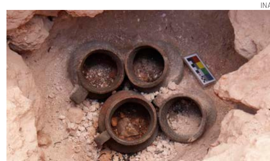
La ofrenda tiene un cajete trípode y cuatro vasijas.

La ofrenda fue retirada para realizar microexcavaciones y determinar si al ser depositada contenía algún alimento o materiales orgánicos y mine-