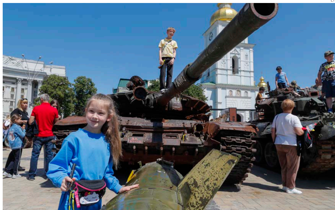
Niños juegan este lunes en un tanque en Kiev en el día en que se recuerdan los niños ucranianos secuestrados por los invasores rusos.

“La ofensiva del enemigo es contenida exitosamente por las acciones de las unidades, el fue-