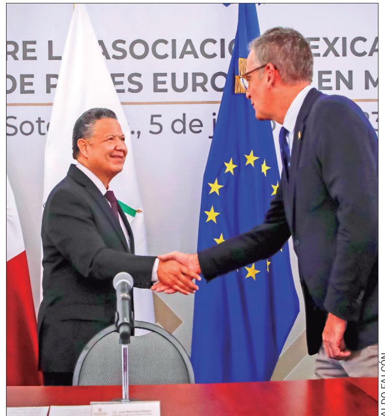
DIRECTRIZ. Hidalgo consolida lazos comerciales con la Unión Europea.

"Derivado de nuestra ubicación geográfica, tenemos un potencial logístico muy importante", señaló el servidor público al apuntar que, gracias a las vías ferroviarias y carreteras, así como proyectos prioritarios del Gobierno de México, el estado es una plataforma ideal para importaciones y exportaciones.