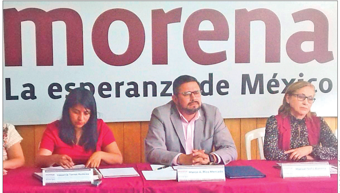
SEGURIDAD. Descartan división entre la militancia por definición de ungido presidencial.