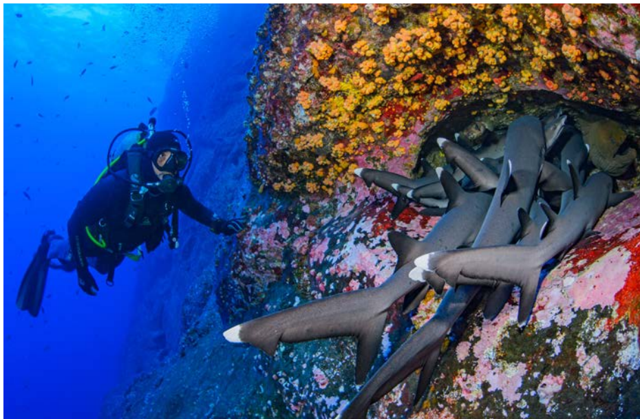
Expediciones científicas a las Islas Revillagigedo han demostrado que son refugio y guardería de especies marinas que habitan profundidades medias y cerca de la superficie.