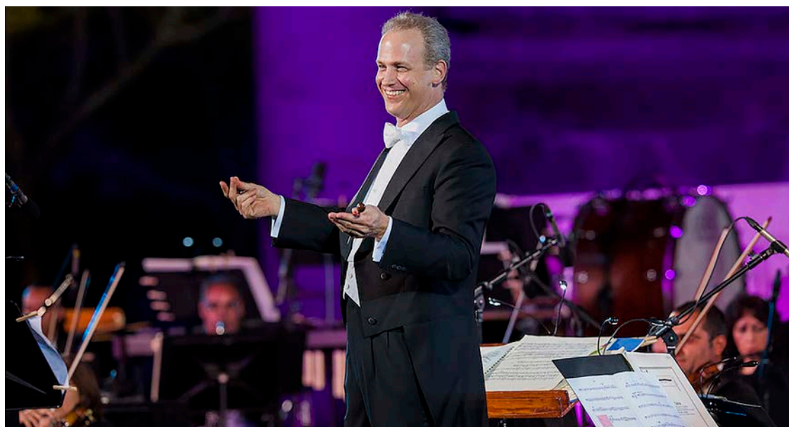
El primer concierto de la OSM, dirigida por Carlos Miguel Prieto, se realiza el miércoles 21 de junio, a las 20:00 horas, en la Sala Nezahualcóyotl del Centro Cultural Universitario de la UNAM.