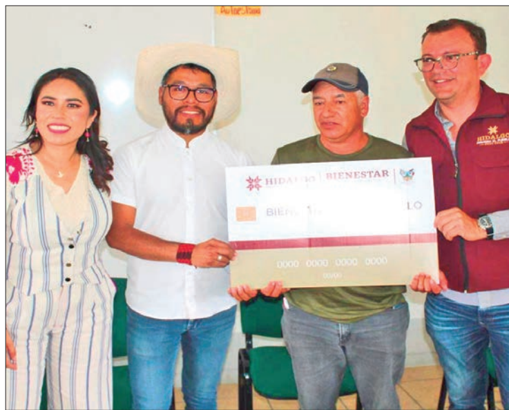
CANALES. Será a través del programa Fomento al Desarrollo de la Participación Social para el Bienestar con el que agrupaciones de mínimo 2 y hasta 20 personas podrán inscribir sus proyectos.

Será a través del programa Fomento al Desarrollo de la Participación Social para el Bienestar con el que agrupaciones de mínimo 2 y hasta 20 personas podrán inscribir sus proyectos en las siguientes vertientes: difusión y venta de artesanías; equipamiento y mantenimiento de talleres artesanales; y preservación del patrimonio artesanal.