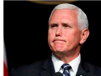
El exvicepresidente Pence.

También están, pero con nulas posibilidades, la exembajadora de EU ante la ONU Nikki Haley; el exgobernador de Arkansas Asa Hutchinson y el senador por Carolina del Sur, Tim Scott. Jun-