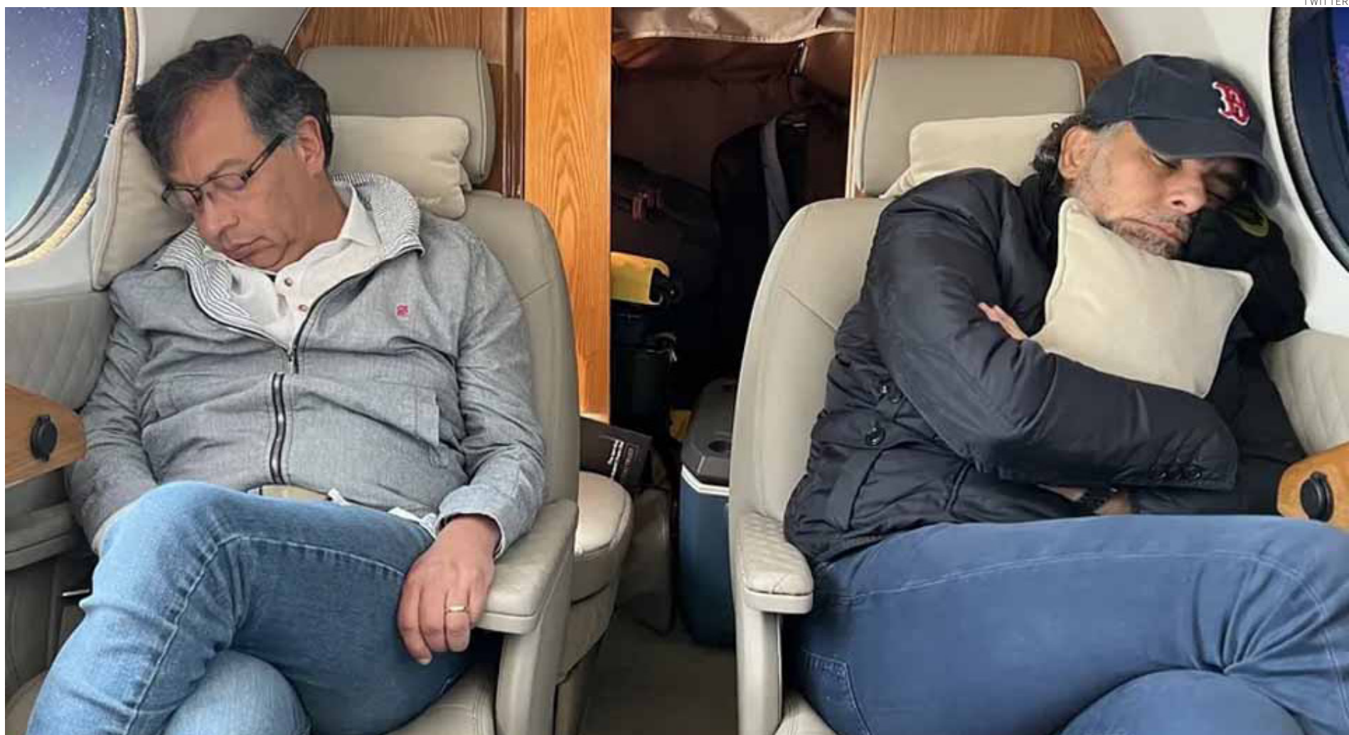
El presidente de Colombia, Gustavo Petro, y quien fuera hasta la semana pasada el embajador de Colombia en Venezuela, Armando Benedetti.