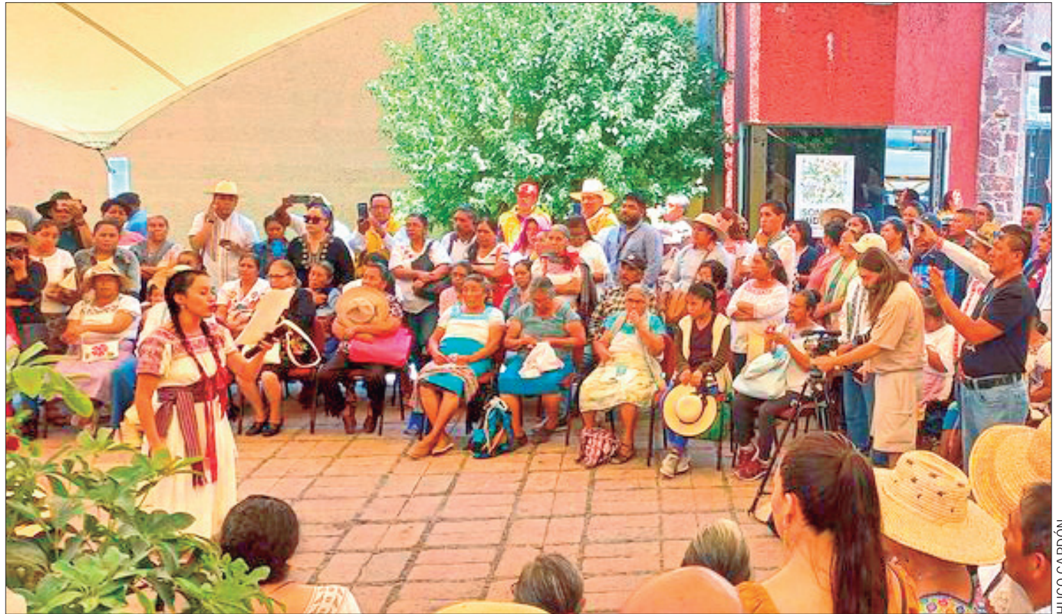
LAMENTABLE. Reunión tenían un "presunto orden del día"; sin embargo, éste se rompió por las constantes interrupciones y arrebatos entre los mismos artesanos.

Pidió a las autoridades competentes que retiren los sellos de suspensión para continuar con el traspaleo de basura, a fin de que las pepenadoras puedan hacer su trabajo. (Hugo Cardón Martínez)