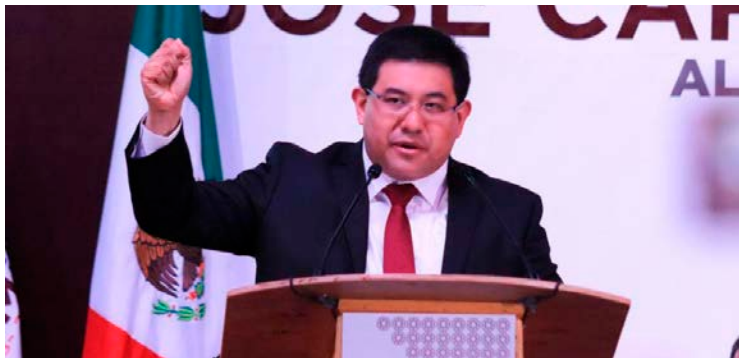
José Carlos Acosta, alcalde de Xochimilco.

De acuerdo con Massive Caller, poco más del 70 por ciento de los habitantes reprueba la gestión de José Carlos Acosta; aún así falló su revocación