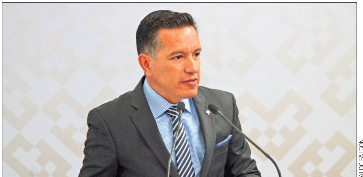
CAPITAL. Durante todo el sexenio lograron 66 mil millones de pesos.

Comentó que con las nuevas inversiones se demuestra que el estado de Hidalgo está en el camino correcto para lograr el máximo objetivo en los próximos años que la entidad sea una potencia económica a escala nacional.