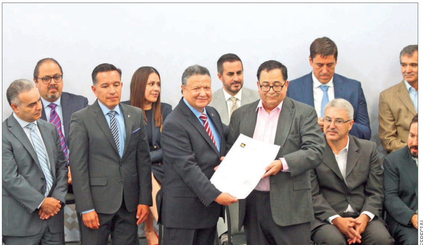
El mandatario hidalguense, Julio Ramón Menchaca Salazar, afirmó que con estas inversiones se tendrá la generación de 4 mil 317 empleos directos y más de 9 mil indirectos que fortalecerán las estrategias de combate a la pobreza y migración.

En su intervención, el titular del Ejecutivo estatal recordó que con este anuncio, su administración ha logrado la atracción de 30 mil 743 millones de pesos, pues en noviembre del año pasado se concretó la llegada de 10 mil 600 millones de pesos provenientes del sector empresarial, por lo que refrendó el compromiso de convertir a Hidalgo en una potencia de la mano de todos los sectores.