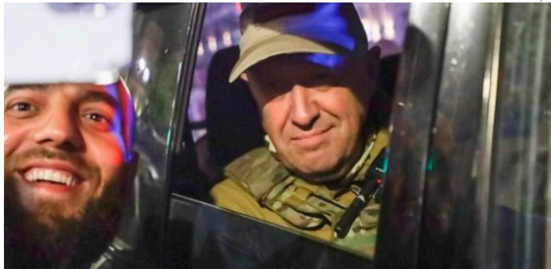
Ruso residente en Rostov, la ciudad que tomaron los hombre del grupo Wagner, se hace un selfi con Prigozhin.

A cambio se le dieron garantías de que no sería juzgado por organización de rebelión armada, un cargo por el que podría haber sido condenado hasta a 20