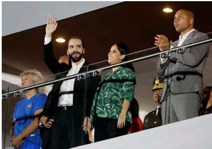
Nayib Bukele junto a su esposa y el presidente de los Juegos Centroamericanos, Yamil Bukele, en el estado de San Salvador, el 24 de junio.

Desde hace un año, Bukele mantiene un estado de excepción en El Salvador y la suspensión de las garantías constitucionales, además de impulsar una fuerte reforma en las cárceles y de apresar a más de 68,000 personas, acusadas de pertenecer a agrupaciones criminales. El joven mandatario ha reaccionado con burlas a las críticas de organizaciones de derechos humanos que denuncian sistemáticas vejaciones contra los detenidos, y les lanza en las redes estadísticas que muestran el desplome de la violencia en el que fuera uno de los países más