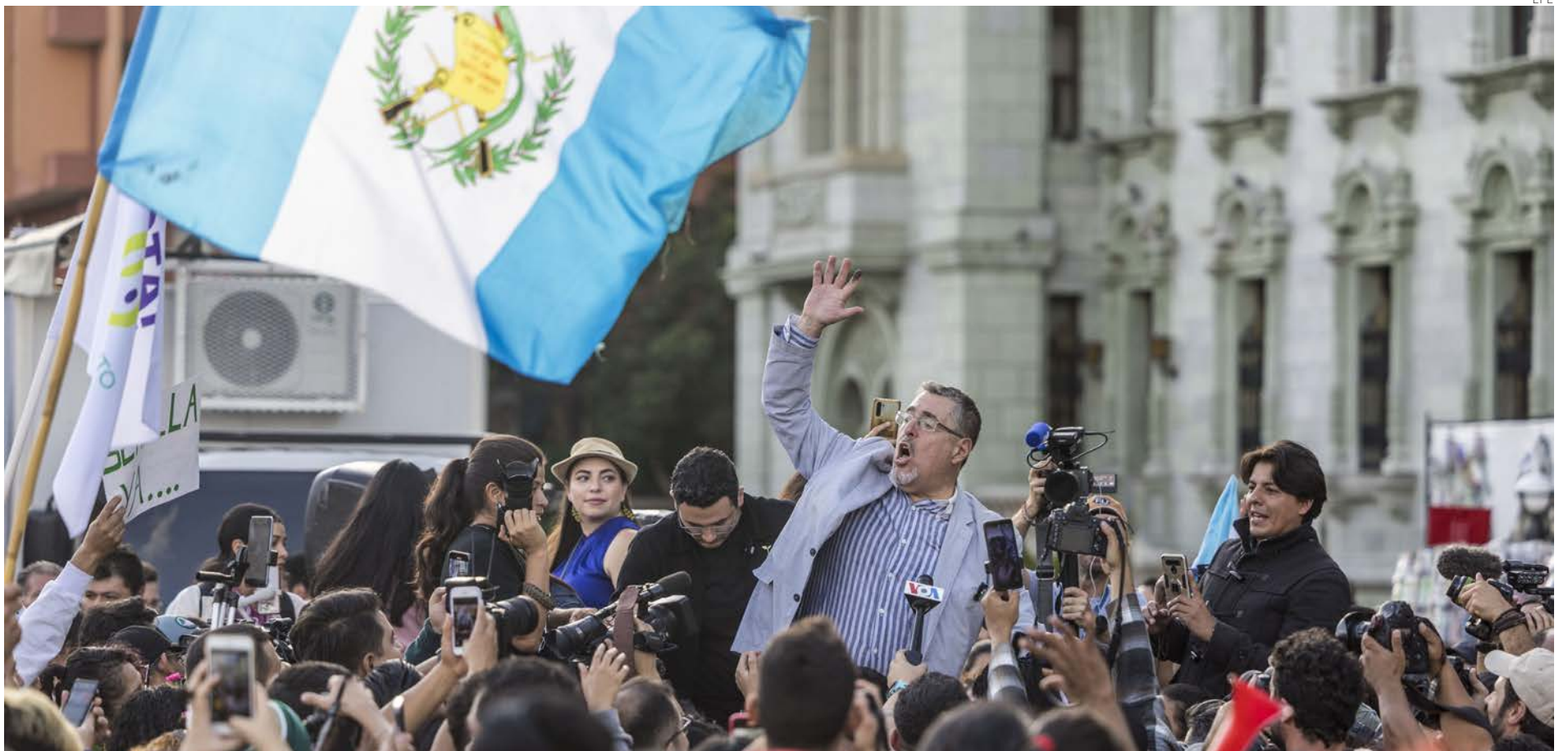
El candidato de la izquierda, Bernardo Arévalo, festeja con miles de simpatizantes en el centro de Ciudad de Guatemala.