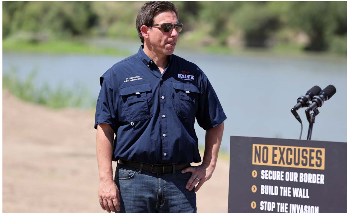
Ron DeSantis presenta su plan antiinmigrante en Eagle Pass (Texas).

“Como presidente, declararé una emergencia nacional desde el primer día y no descansaré hasta que construyamos el muro, cerremos la entrada ilegal y ganemos la guerra contra los carteles de la dro-