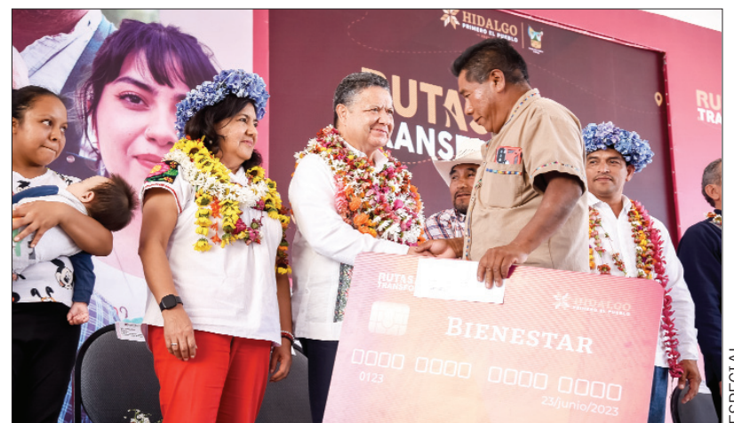
ESCALAS. Gobernador anuncia infraestructura y apoyos para Tlanchinol y Lolotla.

ESPECIFICACIÓN. Desbandada no obedece a posturas de revanchismo ni ánimos de berrinche, sino al interés de construir causas desde cualquier trinchera para que Hidalgo crezca.