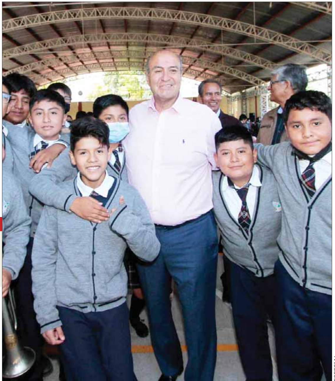
SITUACIONES. Los cambios de maestros son cotidianos y durante la pandemia se presentó esta situación en varias escuelas del estado de Hidalgo.

Respecto a la deserción escolar que se presentó durante la pandemia y el regreso de clases, se recuperó la mayoría de los alumnos, los