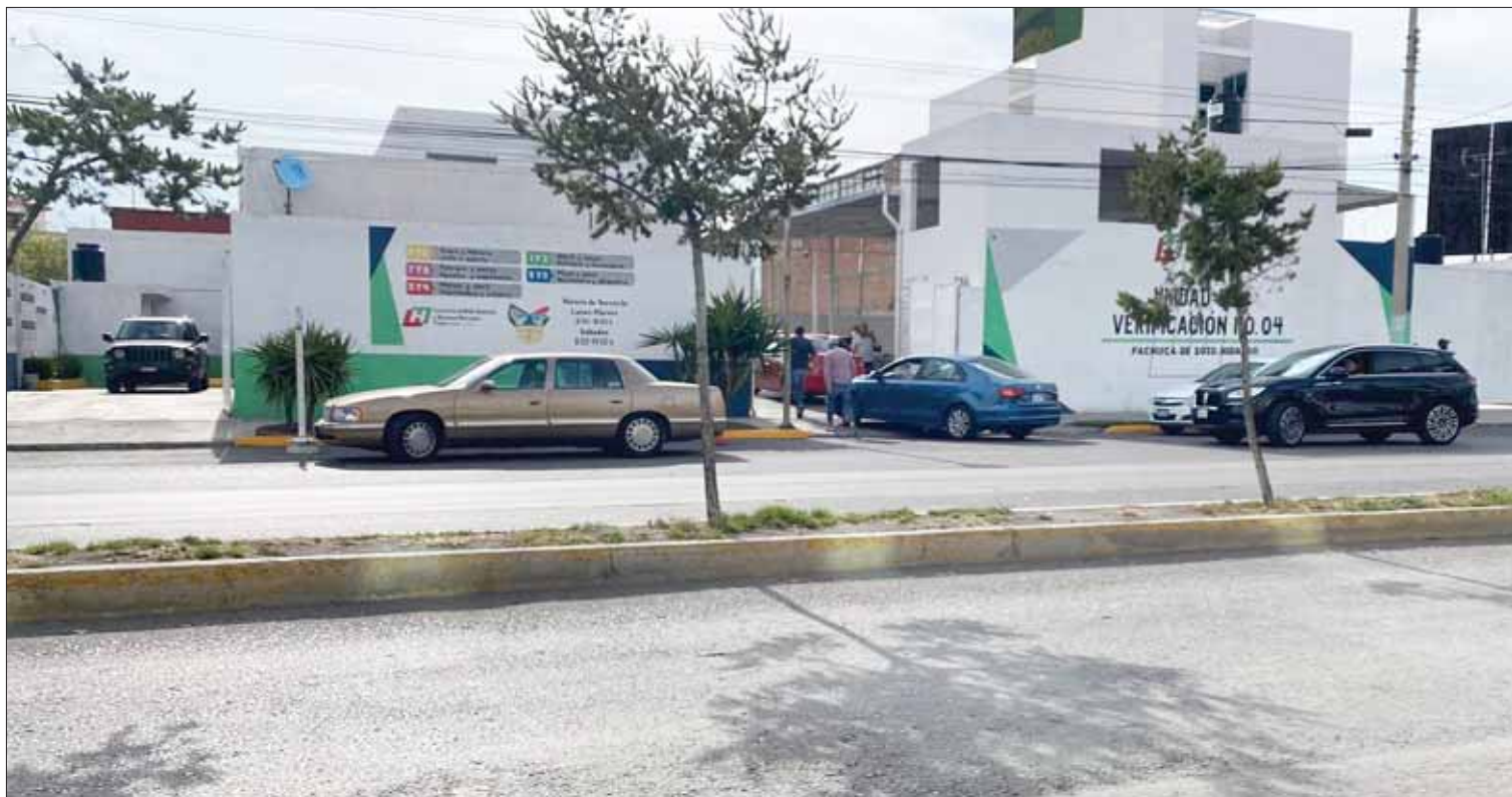
PANORAMA. Reformas a la Ley para la Protección al Ambiente del Estado de Hidalgo provocaron diversos administrativos.

En el segundo artículo transitorio especifica que al entrar en