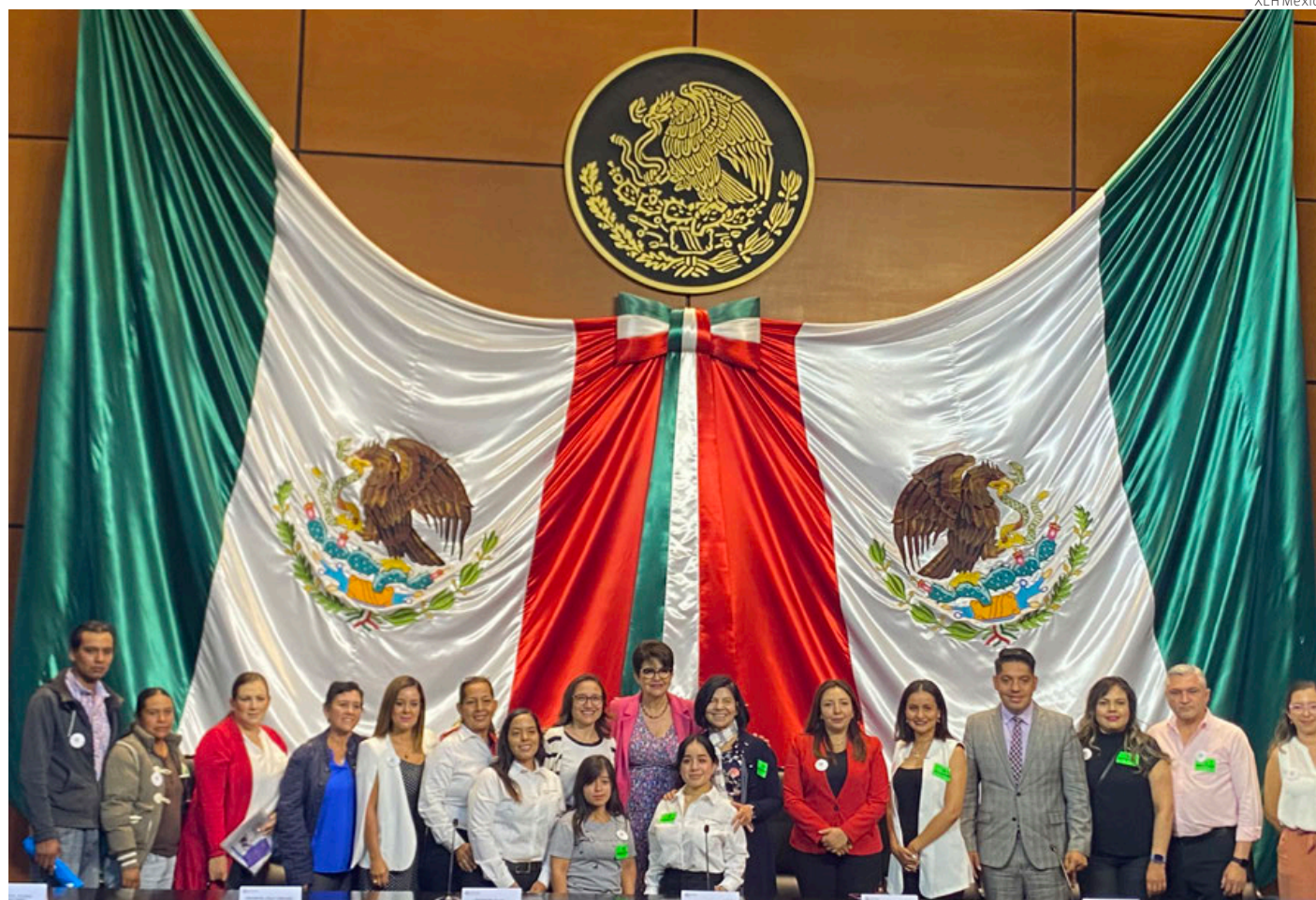
La Cámara de Diputados albergó el foro "En pro de la inclusión de la materia de genética en los programas universitarios".

Sociedad civil expone ante diputados que este déficit impide la detección temprana de enfermedades raras como la XLH