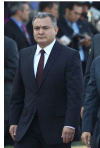
García Luna fue declarado culpable en febrero.

El jurado declaró culpable García Luna de participar en la dirección de una empresa criminal; conspiración para la distribución de cinco kilogramos o más de cocaína, con la intención de distribuirla en EU y conspiración para la importación de la misma cantidad o más