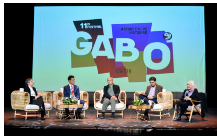
Epígrafe. Lorem ipsum dolor sit amet, consectetur adipiscing e enas

De manera simultánea fue allanada la sede de "el Periódico" y embargadas sus cuentas bancarias. El pasado 14 de junio, el periodista fue condenado a seis años de prisión en un juicio lleno de irregularidades y ampliamente criticado por asociaciones de defensa de la libertad de prensa y de derechos humanos.