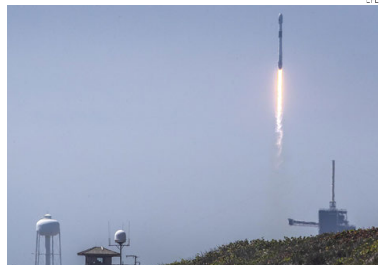
La nave fue lanzada a bordo de un cohete Falcon 9, de Space X.

La situación se debe, además de los retrasos del Ariane 6, a la invasión rusa de Ucrania, tras la que Europa dejó de servirse de los cohetes rusos Soyuz, y al accidente de uno de sus nuevos lanzadores Vega el pasado •