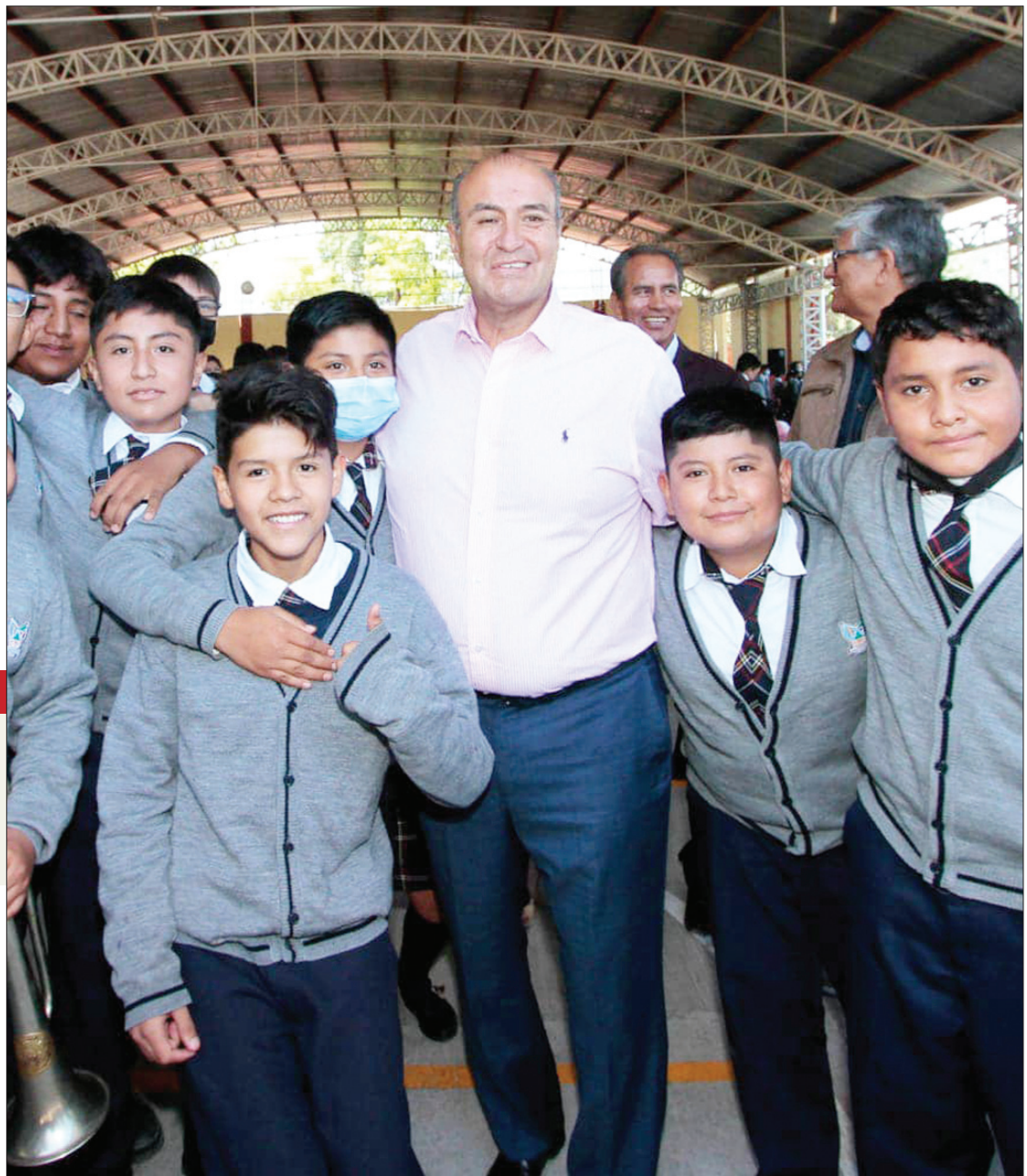
SITUACIONES. Los cambios de maestros son cotidianos y durante la pandemia se presentó esta situación en varias escuelas del estado de Hidalgo.

Respecto a la deserción escolar que se presentó durante la pandemia y el regreso de clases, se recuperó la mayoría de los alumnos, el