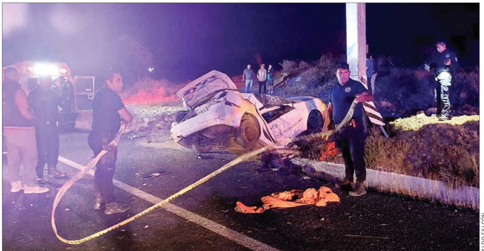
Un sujeto sin vida y un lesionado, fue el saldo que dejó un accidente vial, en la carretera Pachuca-Actopan, a la altura de San Agustín Tlaxiaca. De acuerdo con el personal de bomberos de Actopan, un vehículo particular impactó contra un objeto fijo