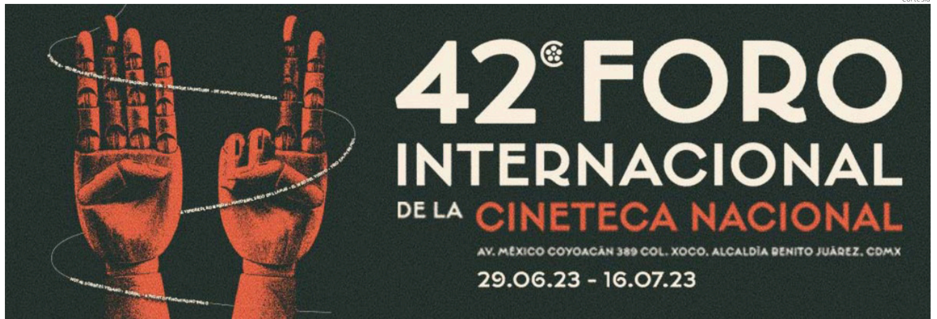
Arte promocional y oficial de este año.

Está conformado por 14 filmes que han triunfado en prestigiosos eventos internacionales como la Berlinale, el Festival Internacional de Cine de San Sebastián y el Festival de Cine de Venecia