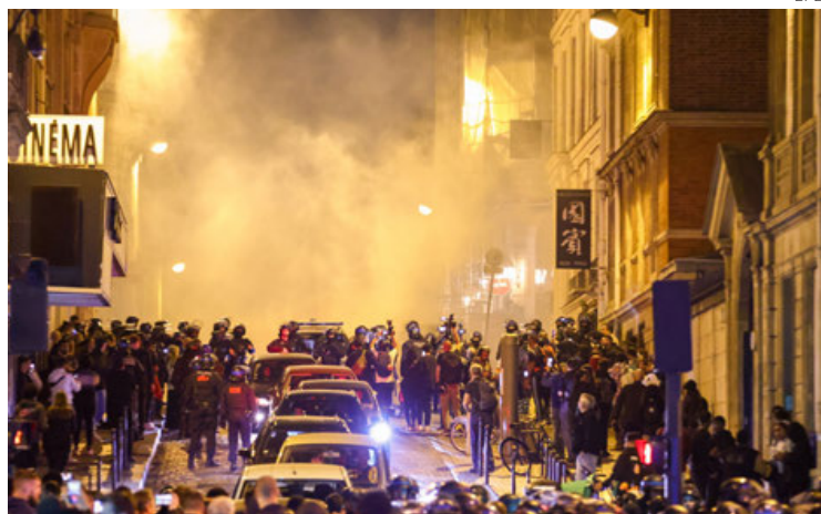
Policia se enfrentan a manifestantes cerca del Arco del Triunfo.

Luego de otras 1,311 detenciones, el Gobierno movilizó este sábado a 45,000 policías