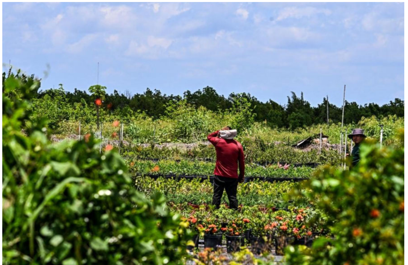
La ley migratoria SB1718 afecta gravemente a los inmigrantes que laboran en el campo.

Los demandantes sostienen que la ley no solo atenta contra los derechos fundamentales de las personas en el estado, sino que también afecta negativa-