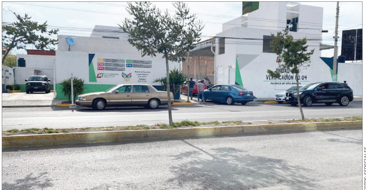
PANORAMA. Reformas a la Ley para la Protección al Ambiente del Estado de Hidalgo provocaron diversos administrativos.

En el segundo artículo transitorio especifica que al entrar en