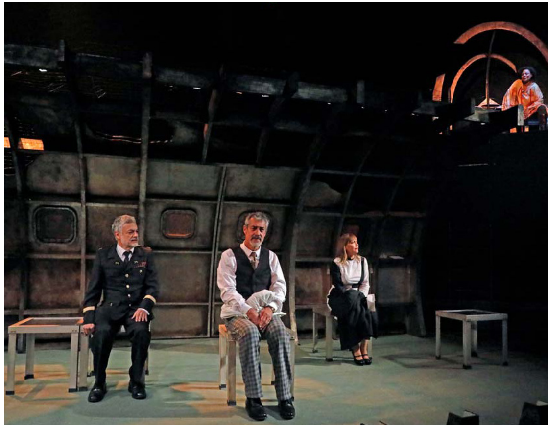
La nueva temporada de “Sepulturas será del 20 de julio al 13 de agosto en el Teatro Julio Castillo.

La historia cuenta cómo Robert, veterano mexicano de la guerra de Vietnam, pasa los días de su vejez afectado por los