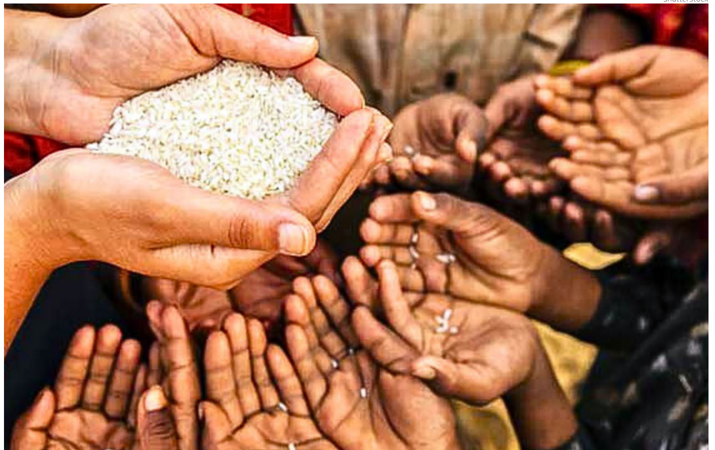
La inseguridad alimentaria tiene relación con el impacto de las crisis climáticas en Latinoamérica.

Las poblaciones más afectadas por la inseguridad alimentaria son las comunidades indígenas y afrodescendientes, que suelen estar alejadas y carecen de acceso a servicios sociales adecuados.