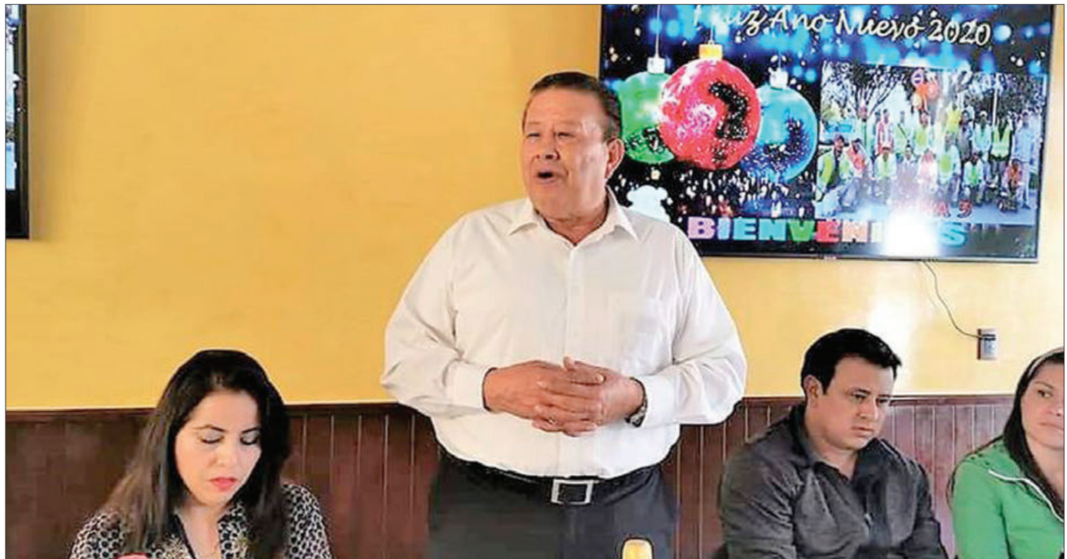
POSTURA. Los mil 370 trabajadores que integran el sindicato del ayuntamiento de Pachuca, en sus distintas áreas, seguirán trabajando bajo protesta.

Señaló que el municipio de Pachuca tiene dinero para cubrir las necesidades que tiene el sindicato y argumentó que la nómina de los trabajadores sindicalizados sin problema se puede cubrir con el concepto de ingresos propios al municipio.