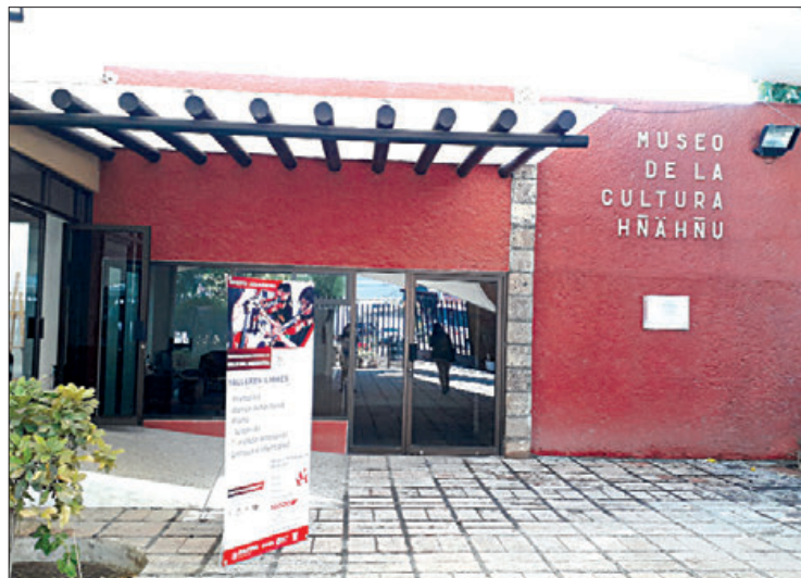
SEDE. Está ubicado en el Valle del Mezquital.

El recinto ofrecerá a niñas y niños un taller de títeres, del 17 al 20 de julio, de 15:00 a 17:00 horas, así como una muestra de teatro guiñol el 21 de julio, a las 16:30 horas.