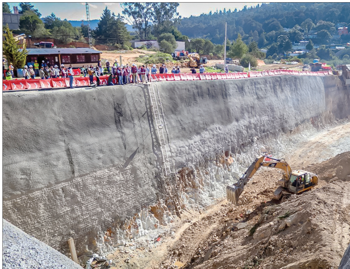
COORDIANCIÓN. Respuesta al compromiso del gobierno del presidente Andrés Manuel López Obrador por impulsar el desarrollo económico de las comunidades hidalguenses.

Por su parte, Jorge Nuño Lara, de Infraestructura, Comunicaciones y Transportes, llevó a cabo un recorrido bajo la premisa de dotar a la población de ca-