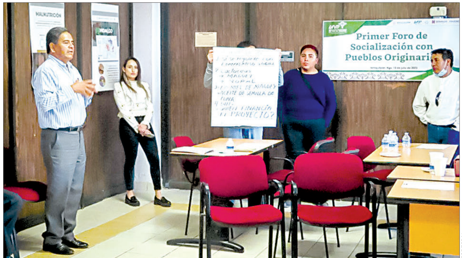
ACTIVIDADES. Realizan Primer Foro de Socialización con Pueblos Originarios para sentar las bases del Laboratorio de Nuevos Alimentos.