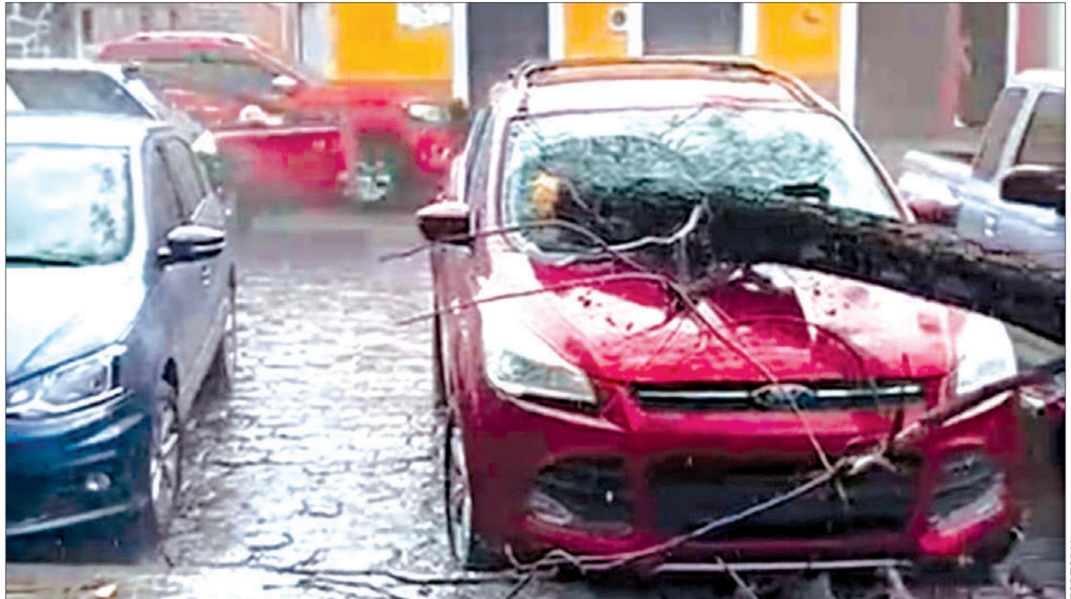
PREVENCIÓN. Vecinos de esta localidad ya solicitaron se revisen algunos de los árboles debido a que se encuentran secos.

Durante la intervención de Falcón Lucario dijo que tradicionalmente el campo es un ámbito dominado por hombres, ahora, las mujeres juegan un papel vital en la agricultura y la producción de alimentos. (Hugo Cardón Martínez)