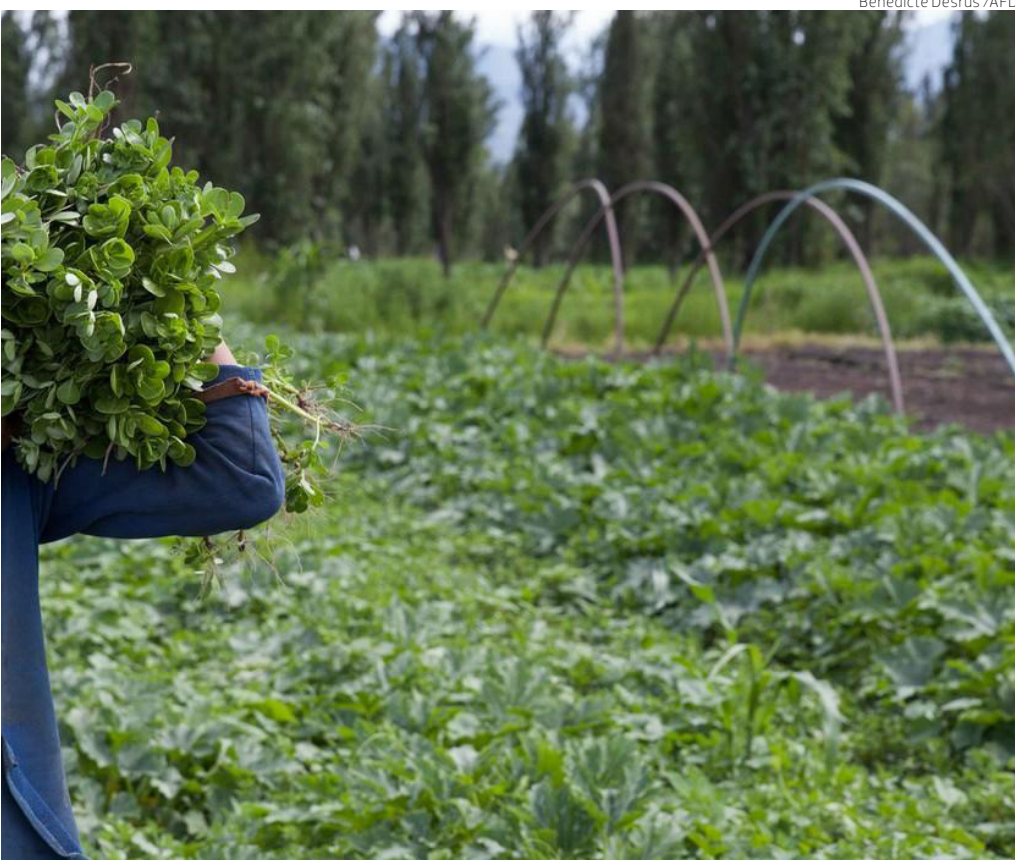
Bénédicte Desrus /AFD