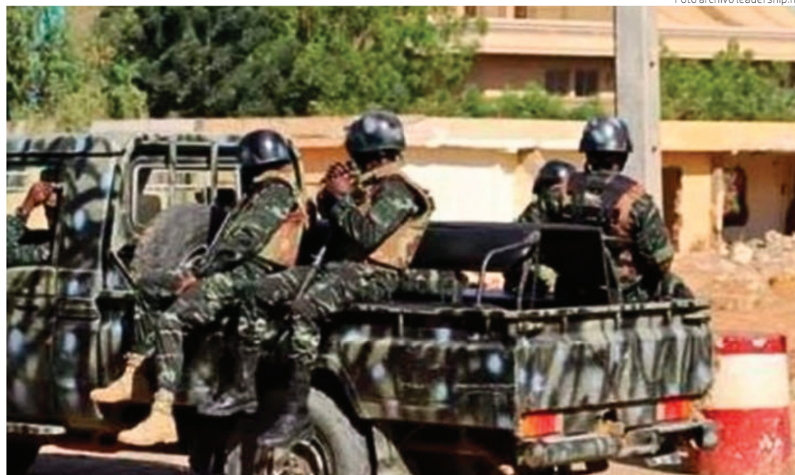
La intentona se inició con el cierre de los accesos del Palacio Presidencial.

“Se pide a todos los socios exteriores que no se inmiscuyan”, añaden para decretar el cierre de las fronteras terrestres