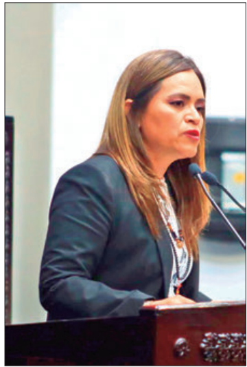
NÚMEROS. Con 24 votos a favor, este decreto fue aprobado.