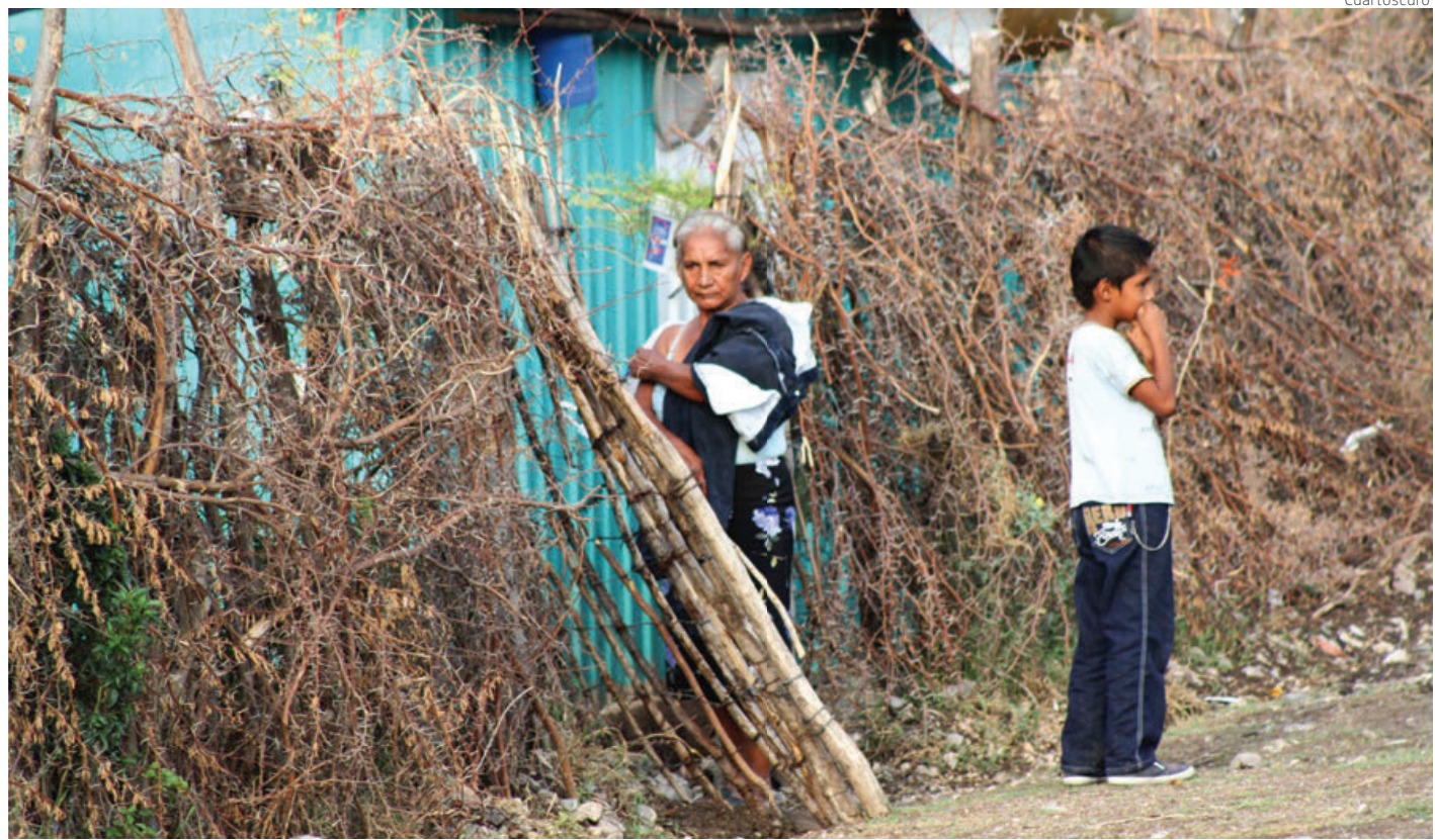
Alrededor de 9.24 millones de hogares donde hay niñas y niños tuvieron dificultades para satisfacer las necesidades alimentarias de las y los menores, estima el INEGI.

De este modo, si la pobreza se ubica en el orden del 39% de la población nacional, considerando que el INEGI estimó para el año 2022 una pobla-