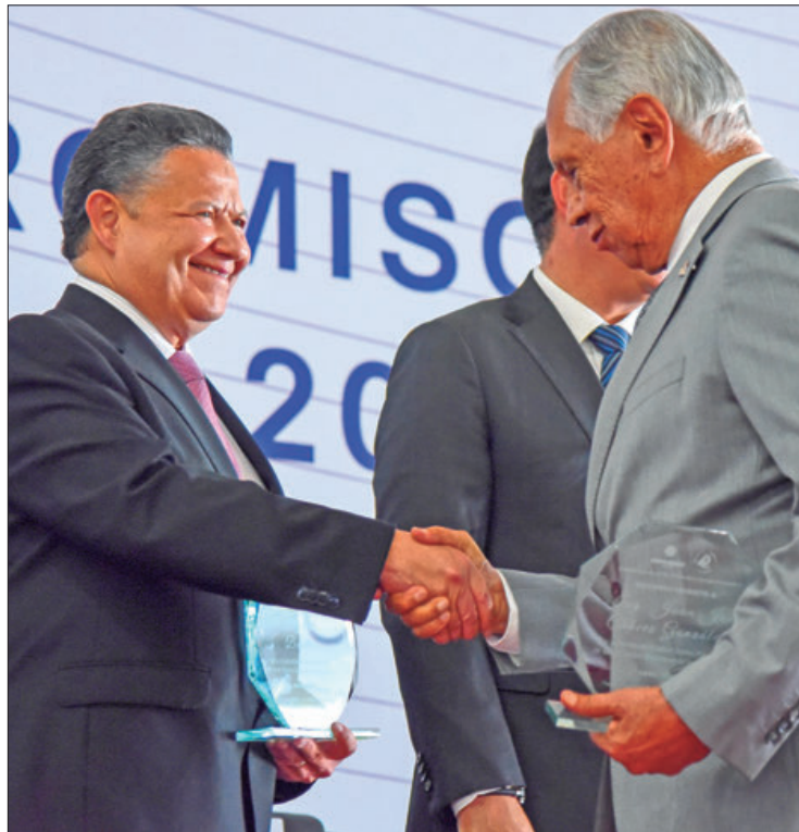
MENSAJE. Julio Menchaca reconoció que el sector empresarial representa un aliado para la transformación estatal.

En ese tenor, explicó que dicho modelo propone combatir el rezago a través de educación de calidad, la generación de economía circular en un contexto de sustentabilidad, además del fortalecimiento del Estado de Derecho.