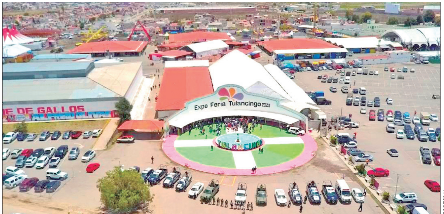
LLAMADO. Es importante no llevar mochilas, objetos pesados y voluminosos, ni punzocortantes, utilizar vestimenta adecuada a las condiciones climáticas.

Al concluir el evento, es mejor esperar unos minutos a que se despejen las rutas de evacuación, a fin de salir tranquilamente y sin empujones, y en caso de extravió de un familiar o amigo, reportarlo de inmediato al personal de seguridad, buscar a las autoridades para que avisen a sus parientes, así como acudir al punto de reunión previamente acordado, en caso de un accidente, solicitar auxilio inmediatamente.