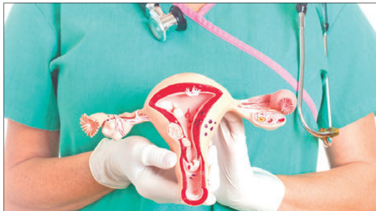
ALERTA. Hace un llamado a todas las mujeres que iniciaron con su vida sexual o tengan 25 años de edad o más.

Islas Téllez detalló que el IMSS Hidalgo cuenta con el programa Chequeo PrevenIMSS en donde