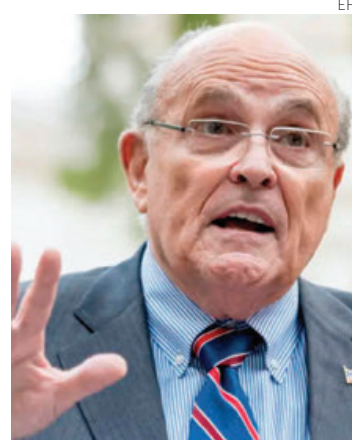
El exabogado de Donald Trump, Rudy Giuliani.