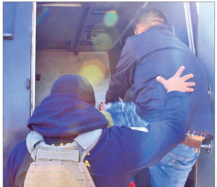
COORDINACIÓN. Las acciones se llevaron a cabo en las localidades de San Juan Hueyapan y Santa María Nativitas.

Recordó que en los últimos 10 meses se tienen resultados positivos en materia de seguridad pública, gracias a la participación de la población hidalguense para denunciar los delitos registrados.