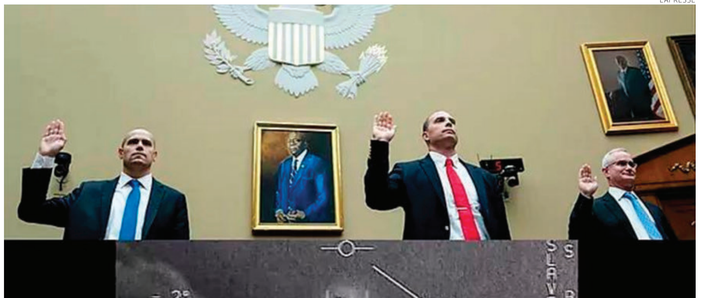
Los exmiembros del Ejército consideran que los ovnis son una amenaza para la seguridad nacional.

enfaticó que, si EU posee tecnología similar, su supervisión debe recaer en los legisladores para salvaguardar los intereses del país.