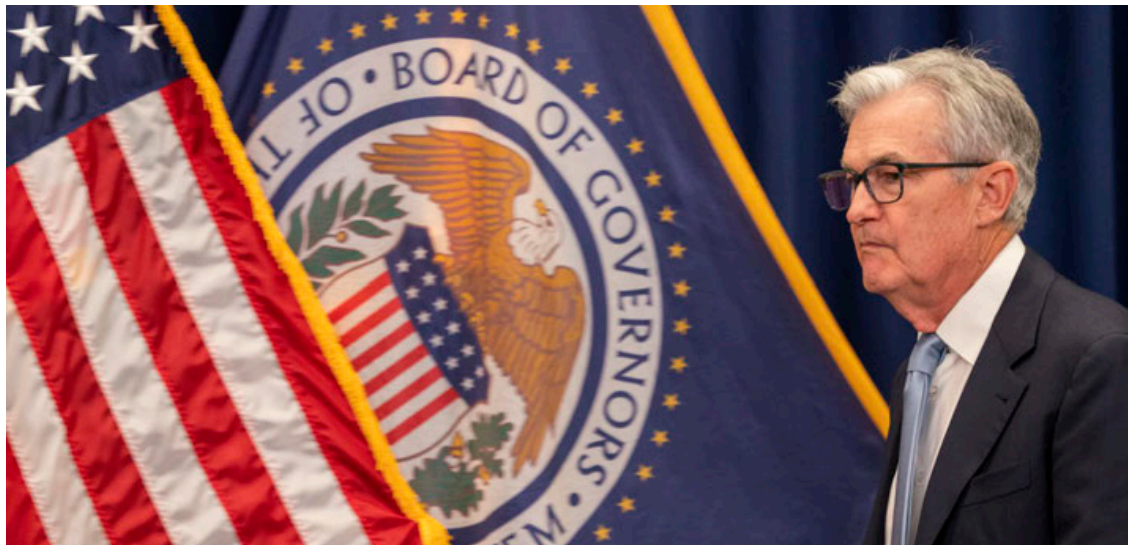
La Fed elevó las tasas de interés a un máximo de 22 años, lo que aumentará los costos para los prestatarios.

La entidad también hizo hincapié en que el sistema bancario es fuerte y resistente, pero advirtió que las condiciones de crédito ajustadas para familias y empresas podrían “pesar” sobre la actividad económica, el