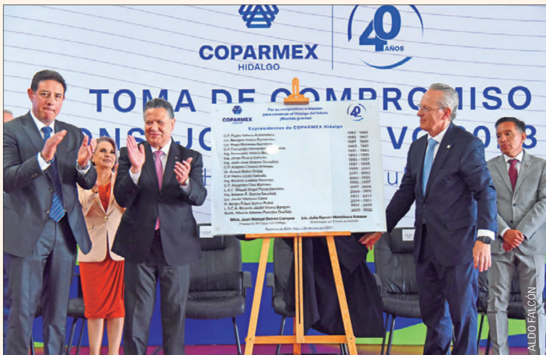
Gobernador atestiguó toma de compromiso del Consejo Directivo de la Coparmex Hidalgo, esto en el marco de su aniversario 40.