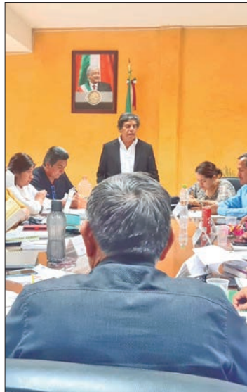
OBJETIVO. Para tratar lo referente a la ampliación de recurso para obra pública.

Tras la irrupción, el grupo de pobladores exigieron ser atendido por los asambleístas para tratar lo referente a la ampliación de recurso para obra pública, asimismo asegurando que arribaron en representación de su Asamblea Comunitaria.