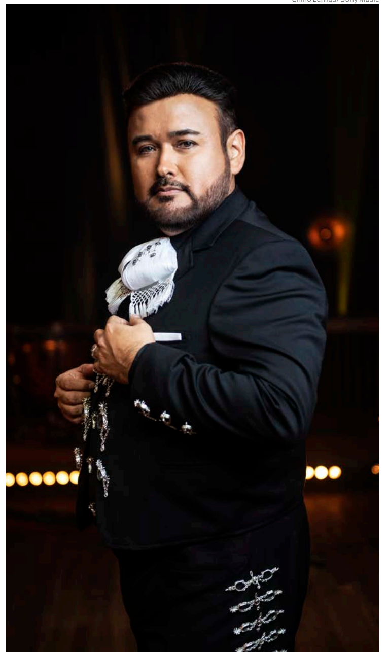
El propósito del disco es hacer una pintura maravillosa de la variedad musical que tenemos en nuestro país, dice Javier Camarena en entrevista.

“En septiembre iniciará la Ópera Estatal de Viena donde haré ‘La sonnambula’, de Bellini, después ofreceré un par de conciertos en Sudamérica pa-