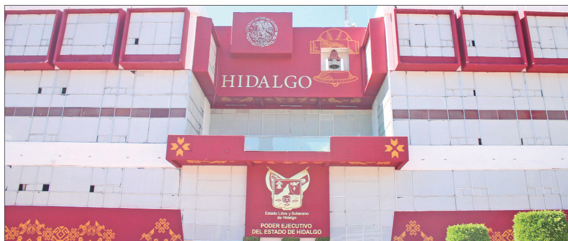
A diez meses de comenzar la administración estatal, celebran la primera mesa de trabajo formal entre el Poder Ejecutivo y el Legislativo de la entidad.

La mesa de trabajo tuvo lugar en las oficinas centrales del Sistema Nacional ubicado en la Ciudad de México. 7