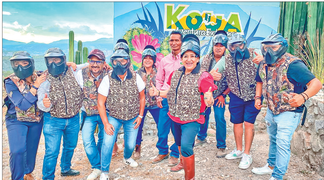
RECORRIDOS. La gira laboral contempló dos días en diferentes comunidades de la región.

En la parte alta de Ixmiquilpan, se trasladó a "La Lagunita", donde se pueden realizar actividades de montaña.