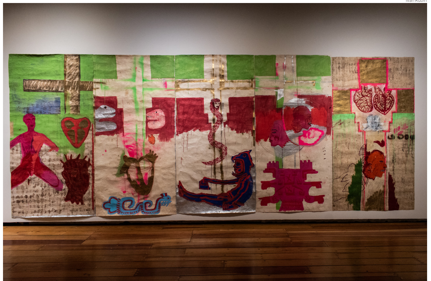
La muestra se exhibe en el Museo de la Ciudad de México.

En esos ensayos, Tarcisio vio el comportamiento de los materiales: se degradaban, perdían su color, pero su esencia quedaba impregnada. “De tal manera