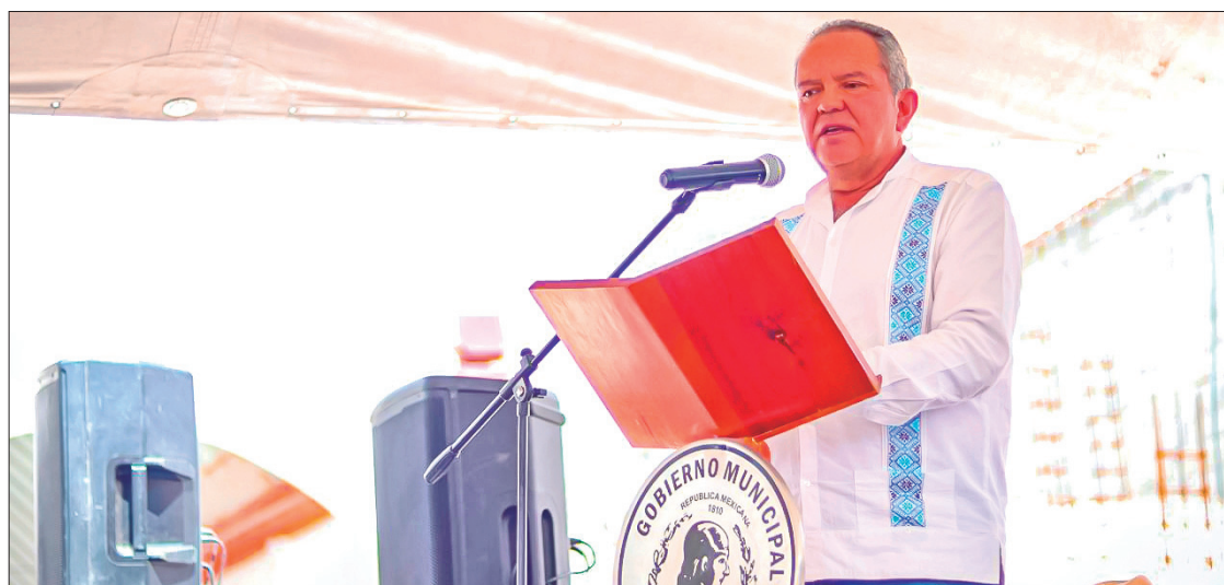
ACTOS. La gestión de esta obra fue hecha directamente al gobernador Julio Menchaca.

Cabe recordar que la totalidad de estos recursos serán destinados a la ejecución de obras que mejoren la infraestructura de los 84 municipios, gracias a que el compromiso del gobernador es