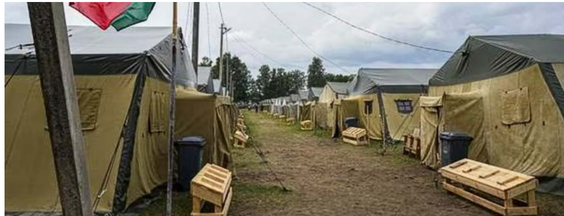
Campamento en Bielorrusia para albergar a milicianos de Wagner.

cifró en varios centenares a los wagneritas llegados a Bielorrusia, cantidad insuficiente para crear un grupo de asalto, dijo en declaraciones recogidas por la agencia UNIAN.