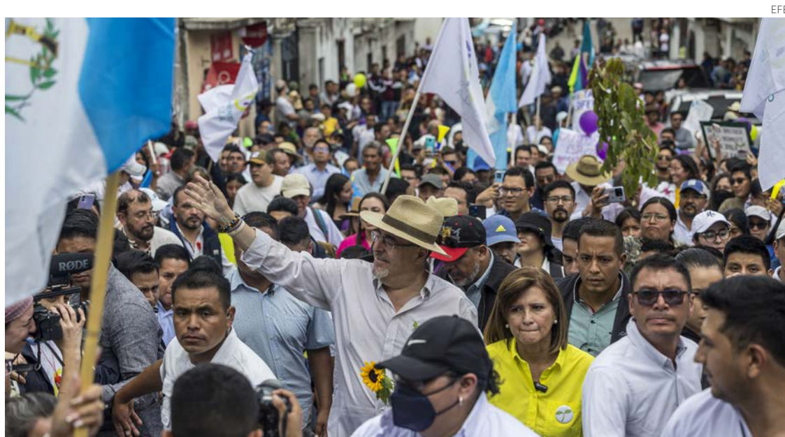
El candidato del Movimiento Semilla, Bernardo Arévalo, en un mitin con sus seguidores.