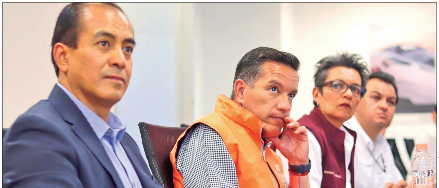
BALANCE. En tan sólo diez meses se registraron más de 30 mil millones de pesos y 22 mil nuevos empleos.

Se tiene una comunicación directa con cada una de las cámaras empresariales para conocer y darle seguimiento a sus peticiones y requerimientos para su desarrollo.