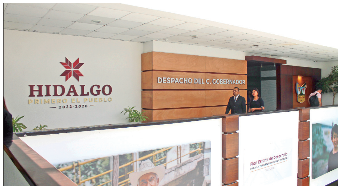
RIESGOS. Algunos partidos políticos expresaron su preocupación por la premura de presentar estas reformas y la pretensión de avalarlas antes del 31 de julio.

Apenas la semana pasada, el gobierno de Julio Menchaca Salazar, remitió al Poder Legislativo un segundo paquete de reformas