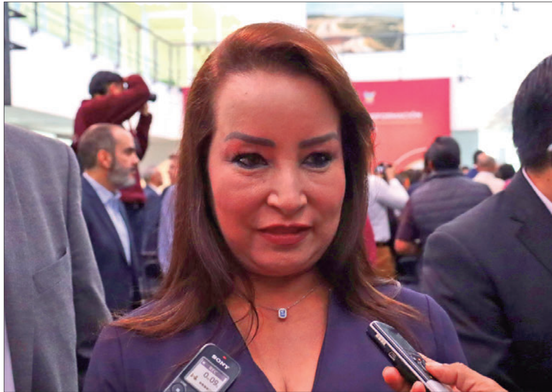
MERV. Todavía se está haciendo esa distribución, de tal forma que al cierre del ejercicio haremos un recuento de cuántas obras se han logrado distribuir, de hecho, tenemos algunas que anunciará el gobernador en sus recorridos.

"En las giras de trabajo que ha venido realizando el gobernador en las 'Rutas de la Transformación' ha venido anunciando las obras y montos que a cada una de ellas se ha asignado, finalmente tenemos una serie de peticiones, solicitudes, tenemos una cartera de proyectos y