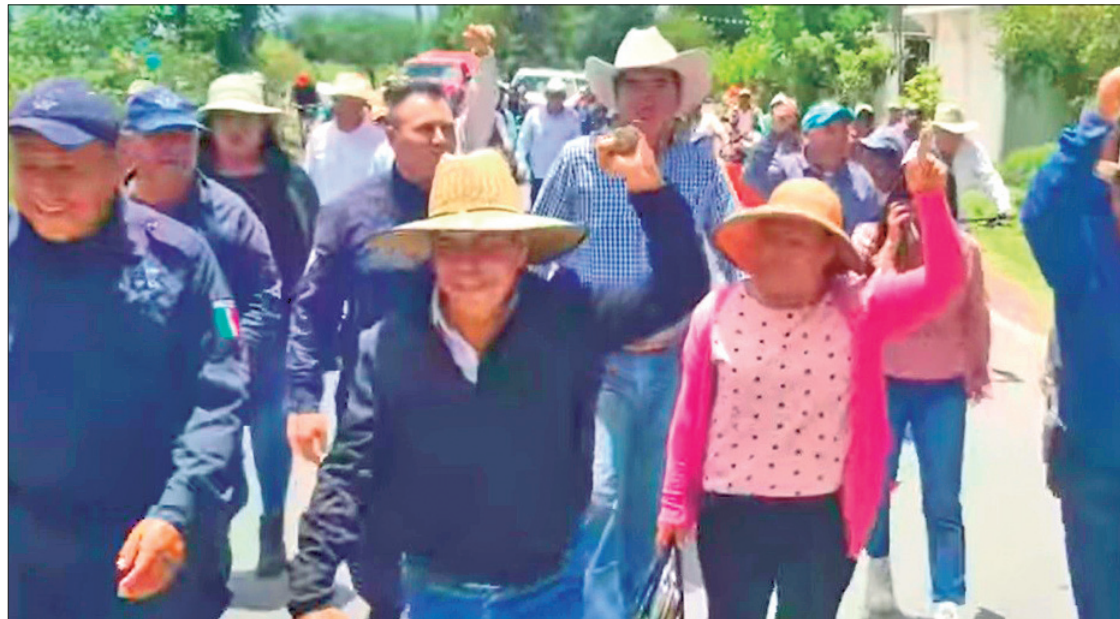
ACCIÓN. Extraoficialmente se supo que la reunión no estaba programada; sin embargo, el presidente municipal accedió por voluntad propia ir a la comunidad.

Extraoficialmente se supo que la reunión no estaba programada; sin embargo, el alcalde accedió por voluntad propia ir a la comunidad para mantener esta mesa de trabajo y escuchar algunas de las demandas que tienen en favor de la comunidad. En el comunicado emitido por los inte-