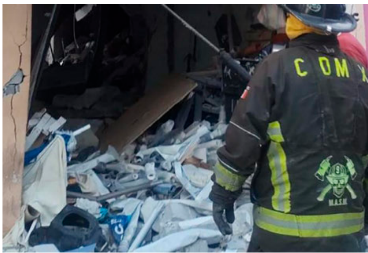
Elementos del Heróico Cuerpo de Bomberos acudieron al sitio para auxiliar a las víctimas tras la explosión.

Una mujer de 40 años falleció a causa de las quemaduras en el cuerpo