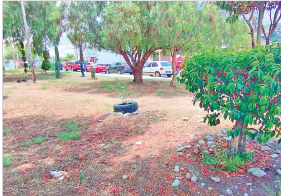
AGRAVANTE. Situación que arrastran desde la Administración Municipal pasada.

"El área verde que se encuentra en la intersección entre avenida Constitución y Alta Tensión, está bastante descuidada, a diario amanece con montones de basura que los propios vecinos