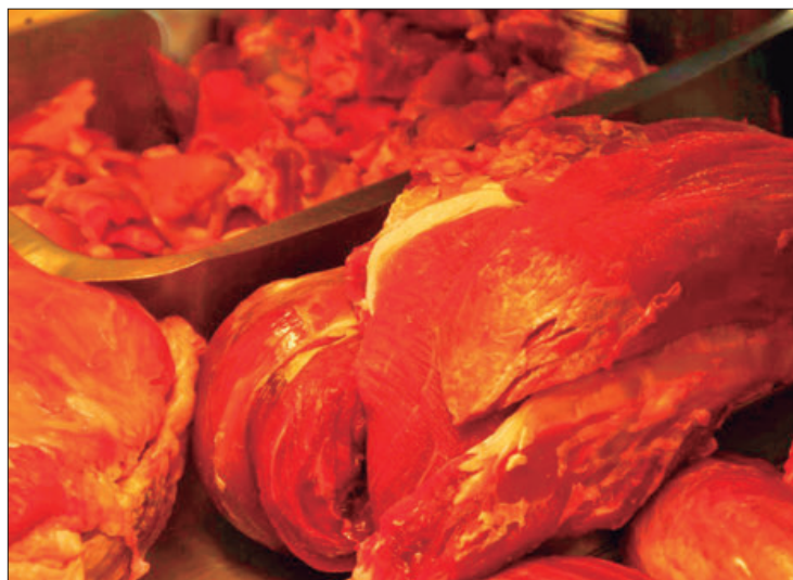
CONSIDERACIÓN. La situación es muy complicada para el sector cárnico, ya que se deben buscar otros mercados o puntos de venta.

Consideró que la situación es muy complicada para el sector cárnico, ya que se deben buscar otros mercados o puntos de venta, solo de esta forma se podrá trabajar en el estado.