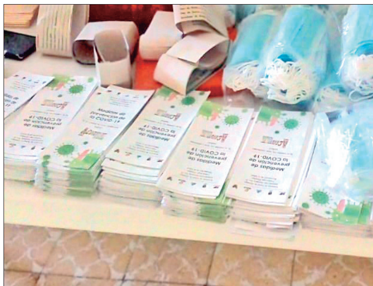
ACTUAL. Recuerda SSH medidas preventivas para prevención de enfermedades respiratorias y de otra índole.

Por lo anterior, la SSH recuerda que se recomiendan medidas generales de prevención e higiene en eventos de clausura de ciclos escolares, graduaciones y durante las próximas vacaciones de verano, como son: higiene de manos, ventilación de espacios, uso de cubrebocas, acudir al servicio médico en caso de presentar algún síntoma respiratorio, no automedicarse, mantener sana distancia y asegurar esquema de va-