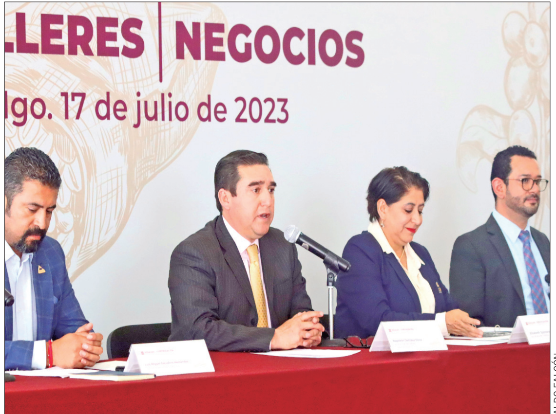
ANHELO. El reto es impulsar y reactivar la producción en las cuatro regiones de la entidad.

FECHAS La Segunda Expo Café Hidalgo se realizará estos 3, 4 y 5 de agosto