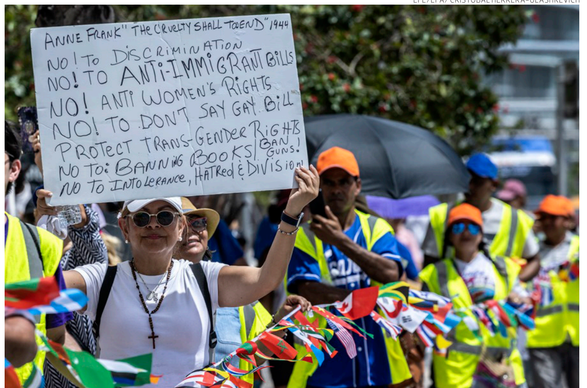
Activistas asisten a una marcha contra la ley SB 1718 en el centro de Miami.

Se centra en disposiciones de la Sección 10 de la ley, que penalizan el transporte de per-