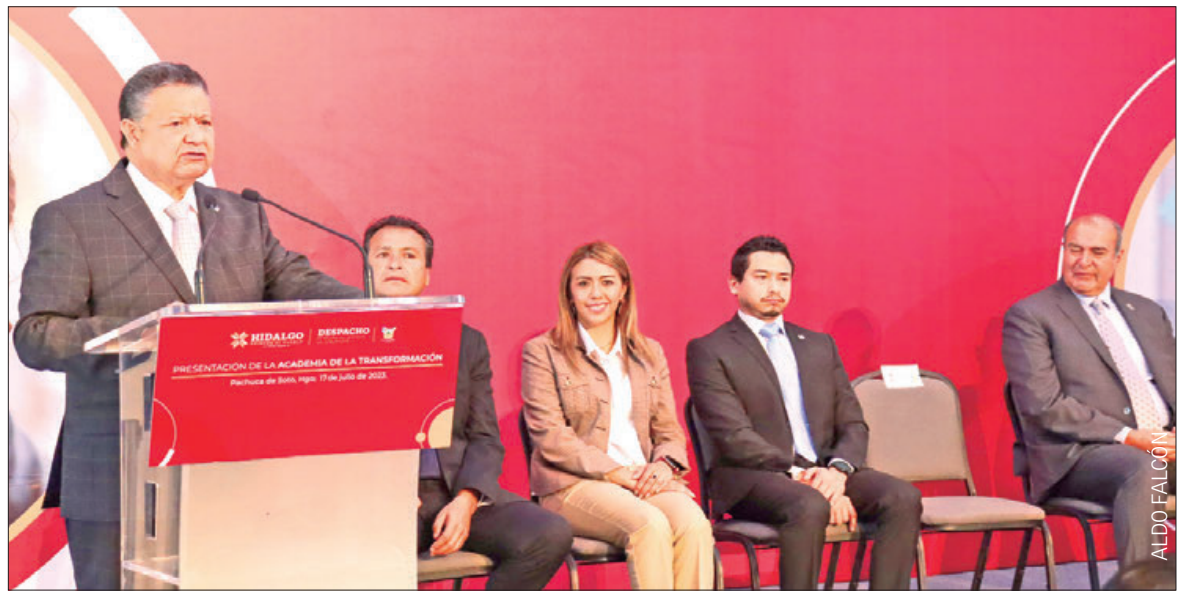
Encabezó jefe del Ejecutivo la presentación de la Academia de la Transformación.