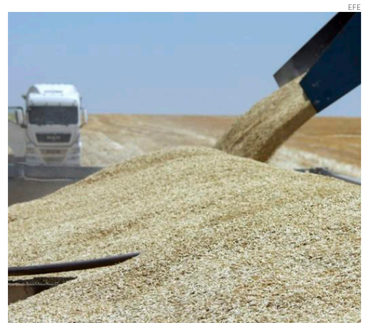
Moscú paró la exportación a través del mar Negro.

“En última instancia, la participación en estos acuerdos es una elección, pero las personas que lo pasan mal en todas partes y los países en desarrollo no tienen elección. Cientos de millones de personas se enfrentan al hambre y los consumidores se enfrentan a una crisis global del coste de la vida. Ellos pagarán el precio”, insistió. (EFE en Moscú)