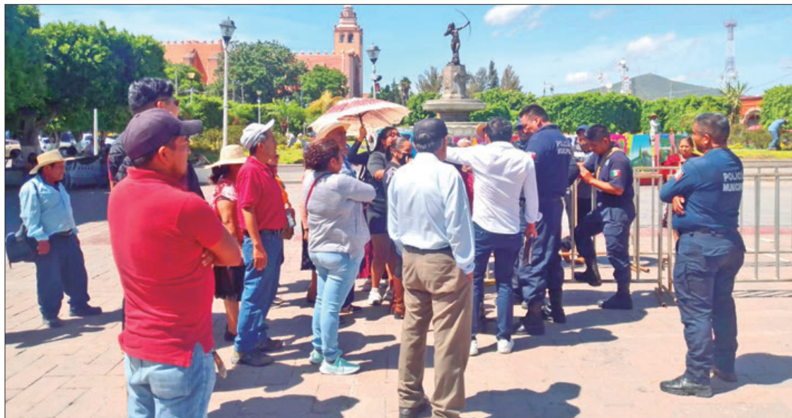
BASE. Los administradores del mercado son renovados con la llegada un nuevo Gobierno Municipal en Ixmiquilpan, pero para el periodo 2016 -2020 por primera vez un administrador buscaba perpetuarse en el cargo, lo que abrió una primera pugna entre comerciantes del recinto.