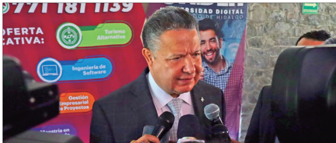
MANERA. Reconoció gobernador que encontraron el lugar vacío, sin muebles, ni obras de arte, electrodomésticos o material de oficina.

► Confirmó Menchaca que derrumbarán la casa para edificar oficinas gubernamentales destinadas a la atención de grupos prioritarios