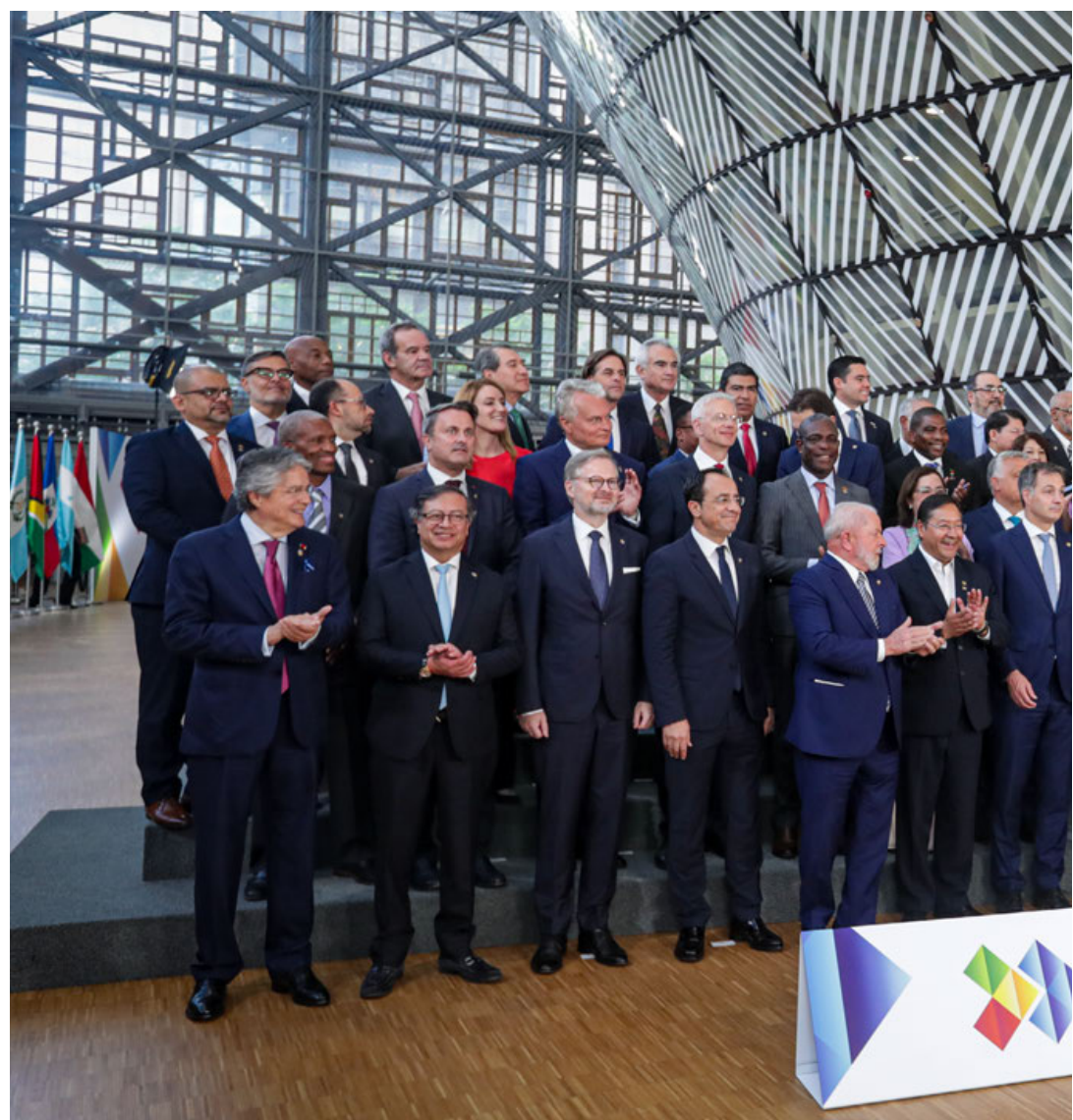
Líderes de la UE y la Celac se reencontraron tras ocho años con voluntad de potenciar la cooperación económica

La UE aspira a que la cumbre concluya con una condena de la invasión a Ucrania. “Lo más importante es que creemos en los mismos valores. Vemos el mundo con