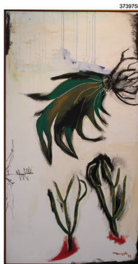
Sentido del tacto (1992), de Magali Lara, una de las obras que se exhiben.

para finalmente hacer una poetización con sus propias palabras. Él hace formas más agradables como producto final.