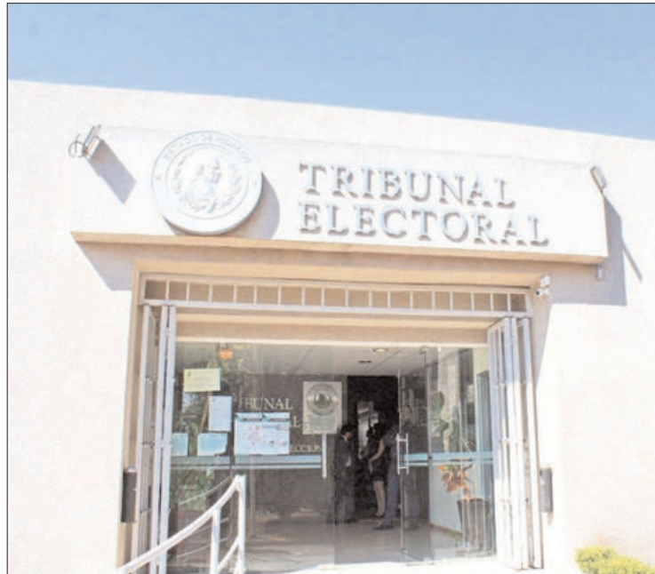
RESPONSABILIDAD. El titular de la Defensoría asumirá diversas atribuciones como administrar, dirigir, organizar y dar seguimiento a los asuntos y servicios; diseñar e implementar un programa anual de prestación de servicios; emitir dictámenes fundados y motivados en los que justifique la prestación o no de los mismos.

El o la titular de la Defensoría lo designará el pleno del TEEH, a propuesta de la presidencia y tendrá un nivel jerárquico igual al de director general o su equivalente en la estructura orgánica