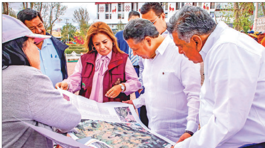
LAZOS. Trabaja el Gobierno de Hidalgo en la recuperación de las áreas verdes dañadas por plagas en Pachuca.