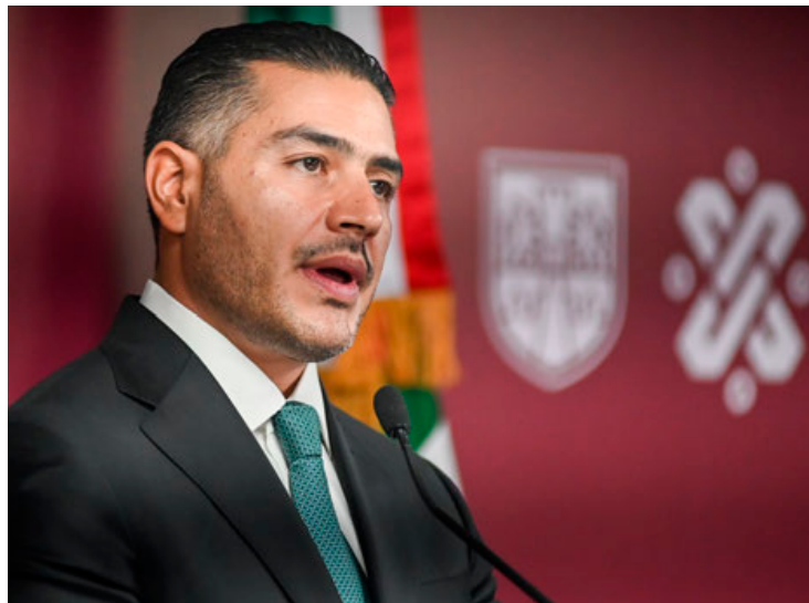
Omar García Harfuch, titular de SSC, dijo que en el cateo a tres inmuebles se aseguraron más de 500 mil pesos y 100 mil dólares, así como tres armas de fuego, 14 vehículos, una motocicleta y 16 teléfonos celulares.

Eunisse Karla "N", José Ricardo "N", Zamy "N" y Francisco Javier "N", colaboradores del cártel operaban en un sótano oculto de un predio en la alcaldía Xochimilco, lugar en el que ofrecían vía Whatsapp a vendedores capitali-