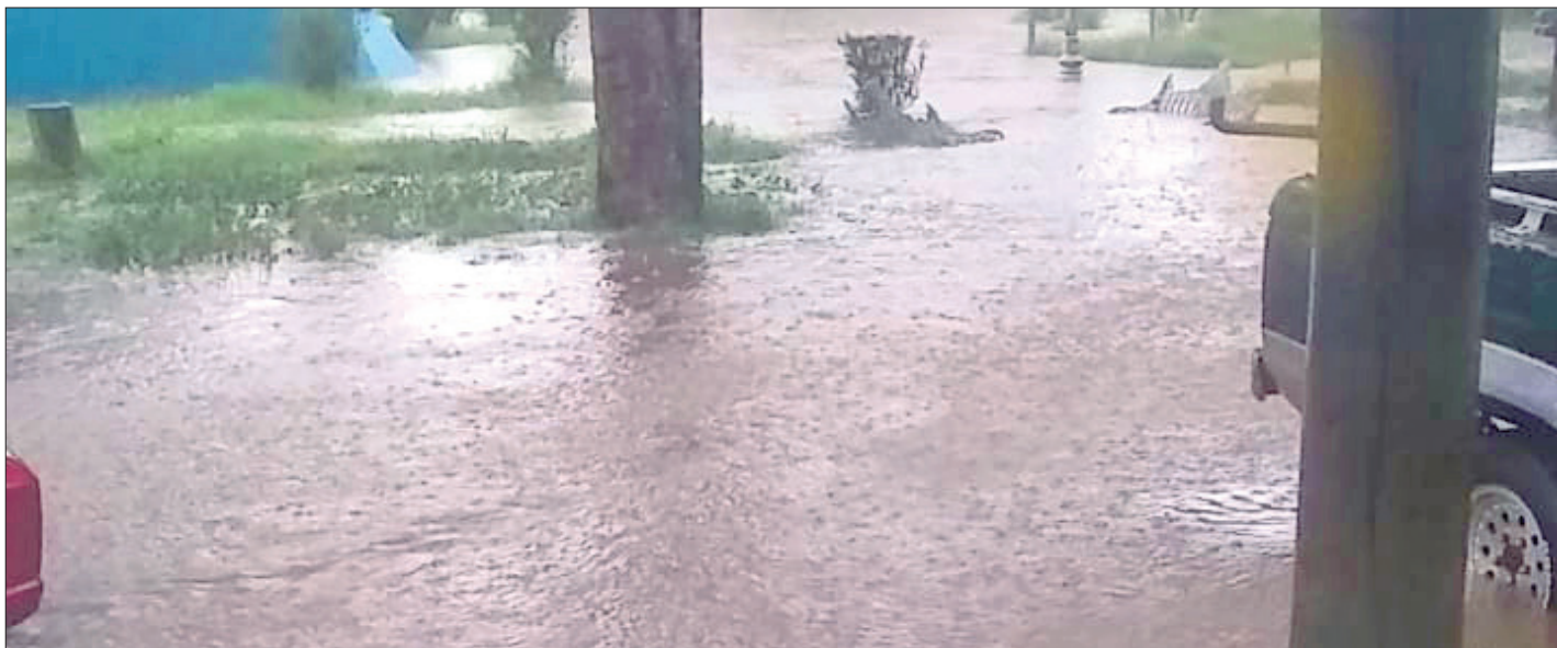
AUTORIDADES. Descartaron que derivado de la presencia de las recientes lluvias se tengan situaciones que lamentar.

De igual forma autoridades municipales descartaron que derivado de la presencia de las recientes lluvias se tengan situaciones que lamentar y confirmaron que hasta el reciente fin de semana no fueron reportados incidentes mayores que hayan afectado a la comunidad o infraestructura urbana.