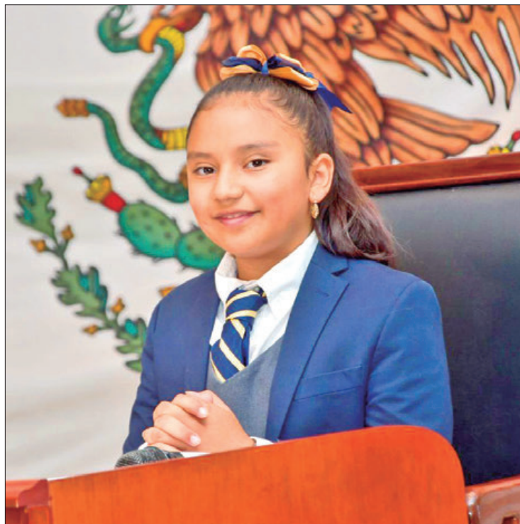
PROTOCOLO. Realizan toma de protesta y primera sesión ordinaria de Ayuntamientos Honorarios Infantil, Adolescente y Juvenil de Tulancingo.