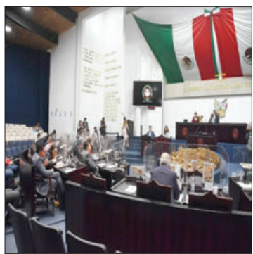
PAUTAS. Trabajo desde el Congreso.

Lo anterior durante la sesión ordinaria 151, este 24 de julio. Fueron puestos a consideración del Pleno los dictámenes emitidos por las Primeras Comisiones Permanentes de Legislación y