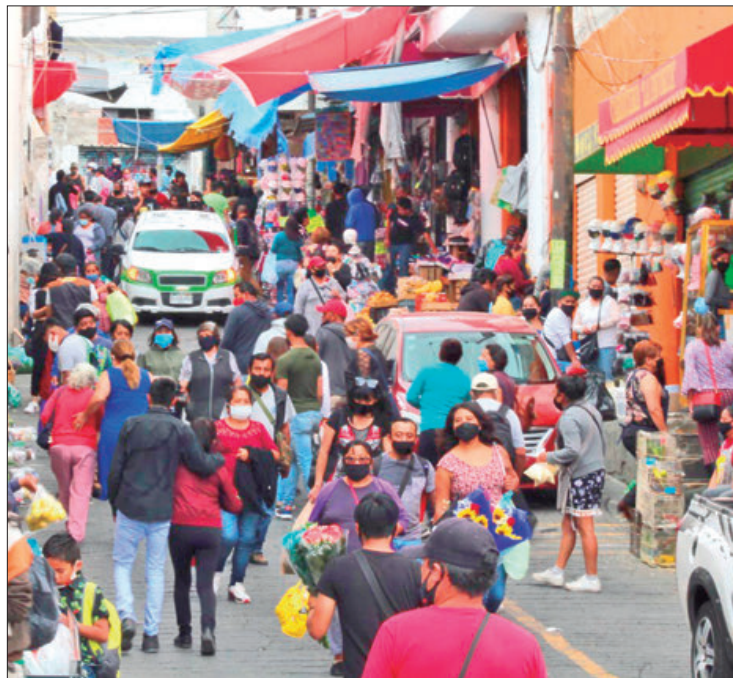
SINTONÍA. Explicaron que a partir del reciente año se buscó también la forma de que existiera un trabajo en conjunto entre los locatarios y las autoridades a fin de mejorar e incrementar los servicios en estos lugares

Buscan dañar la imagen de decenas de trabajadores de estos lugares