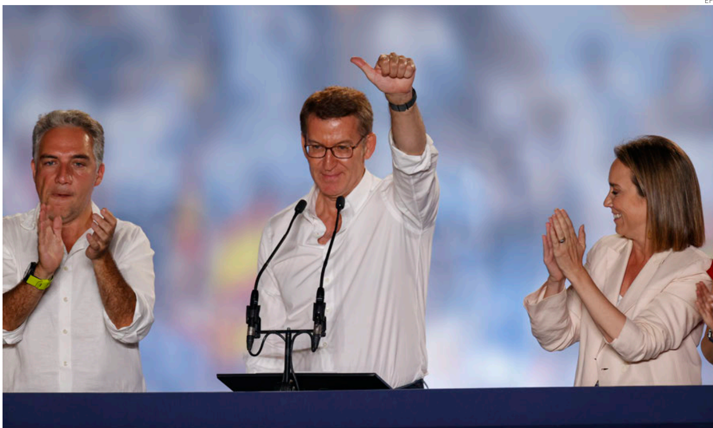
Alberto Núñez Feijóo, líder del Partido Popular y ganador de las elecciones generales.

Tras las elecciones generales, PP y PSOE buscan aliados para evitar otra elección