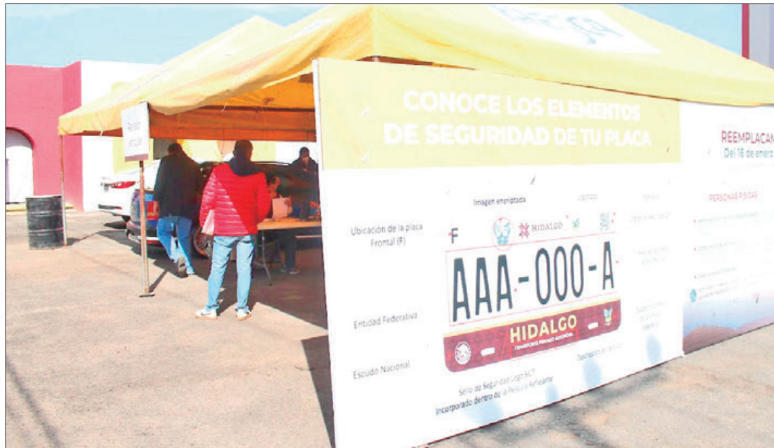
INTEGRACIÓN. Se pagó el refrendo anual y derecho por canje de placas de 2 mil 279 vehículos propiedad del gobierno del estado de Hidalgo.

"Se pagó el refrendo anual y derecho por canje de placas de un total de 2 mil 279 vehículos propiedad del gobierno del estado de Hidalgo", indicó la respuesta otorgada en el folio