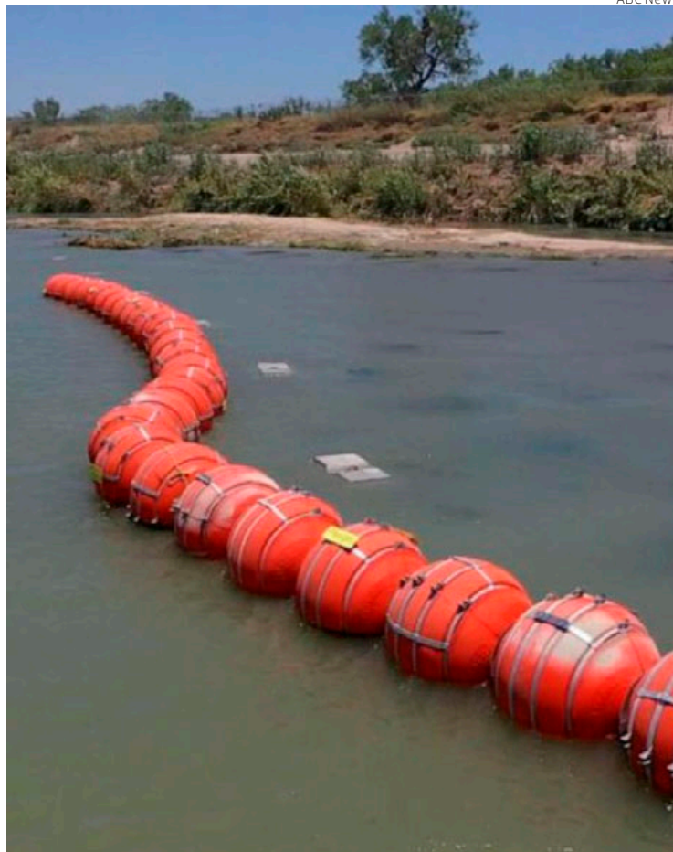
Barrera de boyas en el Río Bravo que colocó el gobernador de Texas Greg Abbott.

El 21 de julio Abbott fue notificado por el Departamento de Justicia de EU, respecto a que colocar una barrera de boyas del tamaño de una bola de demolición es una violación a la Ley Federal (Ley de ríos y puertos de 1899). La Fiscalía estadounidense había dado al gobernador de Texas, el republicano Gregg Abbott, un plazo que concluyó este lunes para que retirara las boyas por los riesgos ambientales y huma-