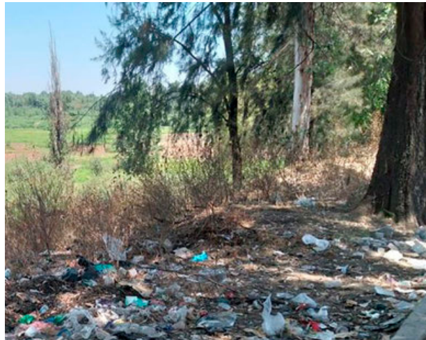
Presa de San Lucas en Xochimilco.

Xochimilco, conocido por sus icónicos canales y áreas verdes, es uno de los lugares más hermosos y emblemáticos de la Ciudad de México. Sin embargo, detrás de su encanto natural, se esconde una creciente problemática: la acumulación de basura en sus parques y la falta de suficientes contenedores para su disposición adecuada. La Presa de San Lucas en la Unidad Habitacional Nativitas, así como otras áreas como Xochitepec y Muyuguarda, han sido testigos de una alarmante proliferación de depósitos de cascajo y basura, generando preocupación entre los residentes y visitantes de la zona.