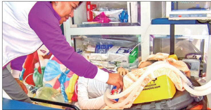
SSH. Instrucción precisa a la Coordinación Estatal de Prevención de Accidentes en Grupos Vulnerables para que enfatizen en las medidas de promoción y prevención entre la sociedad.

De acuerdo con los especialistas de la SSH, gran parte de la población permanece en casa realizando actividades recreativas, o bien, acude a lugares cercanos para pasar tiempo en familia. Sin embargo, durante estos periodos, las lesiones accidentales incrementan aproximadamente en un 15 por ciento (%).