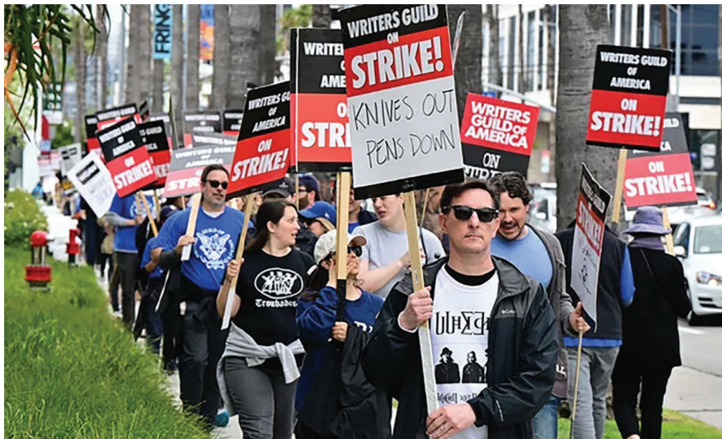
Huelga de guionistas y actores en Hollywood.

La historia nos dice que el movimiento ludista estaba condenado desde el principio, y se llevó a cabo una maquinización masiva, que ha pasado por varias fases en los dos últimos siglos. Al mismo tiempo, la historia no deja mentir en cuanto que, en algunos oficios, la producción se mantuvo por dos carriles: el industrial y el artesanal, dirigidos a mercados diferenciados y que la artesanía de alta gama alcanza precios muy altos y es, incluso, base para algunas de