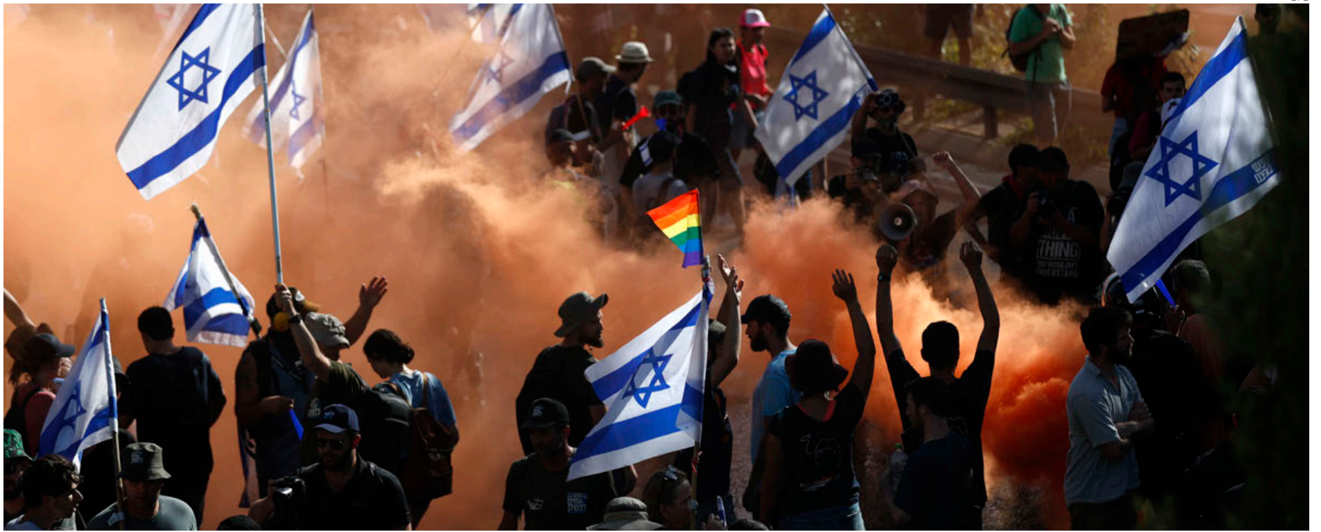
Manifesteros antigubernamentales en Israel bloquean la autopista 50.