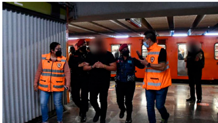
Los intentos suicidas fueron con mayor frecuencia en las Líneas 3, 2 y 1 del Metro.

El perfil de las personas en riesgo de acto suicida muestra un promedio de edad de 31.9 años. Las mujeres presentan un rango de 33.2 años, mientras que para