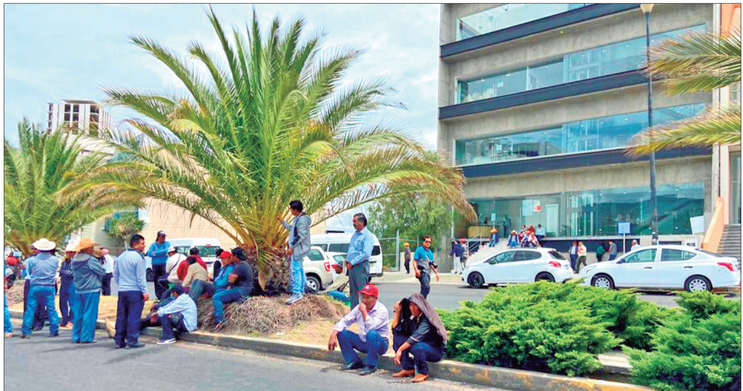
DESAIRE. Los empleados les informaron que el director general no se encontraba y que por tanto no se podría realizar la mesa de trabajo.

Los campesinos agregaron que solicitarán la intervención del Gobierno de Hidalgo para la solución al conflicto de la falta de agua en sus parcelas, ya que dependen miles de familias del campo.