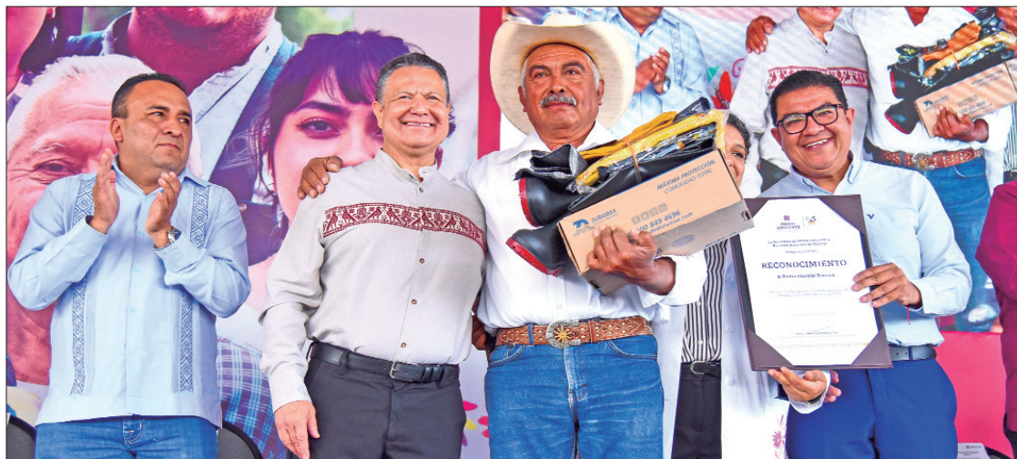
El gobernador Julio Menchaca informó que se canalizaron mil 400 millones de pesos en obras de rectificación y revestimiento del Río Tula, derivado del desbordamiento que hubo septiembre de 2021, lo que beneficiará a miles de habitantes.

vestimiento del Río Tula con la Comisión Nacional del Agua (Conagua) o la rehabilitación de la clínica 5 del Instituto Mexicano del Seguro Social (IMSS), esto durante las Rutas de la Transformación en Tula de Allende, Tlahuelilpan y Tetepango. .3