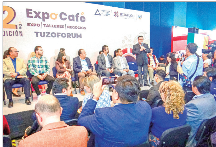
TUZOFORUM. Se estima una afluencia de visitantes de al menos 500 personas por día, se llevará a cabo los días 3, 4 y 5 de agosto.

El evento, para el cual se estima una afluencia de visitantes de al menos 500 personas por día, se llevará a cabo los días 3,