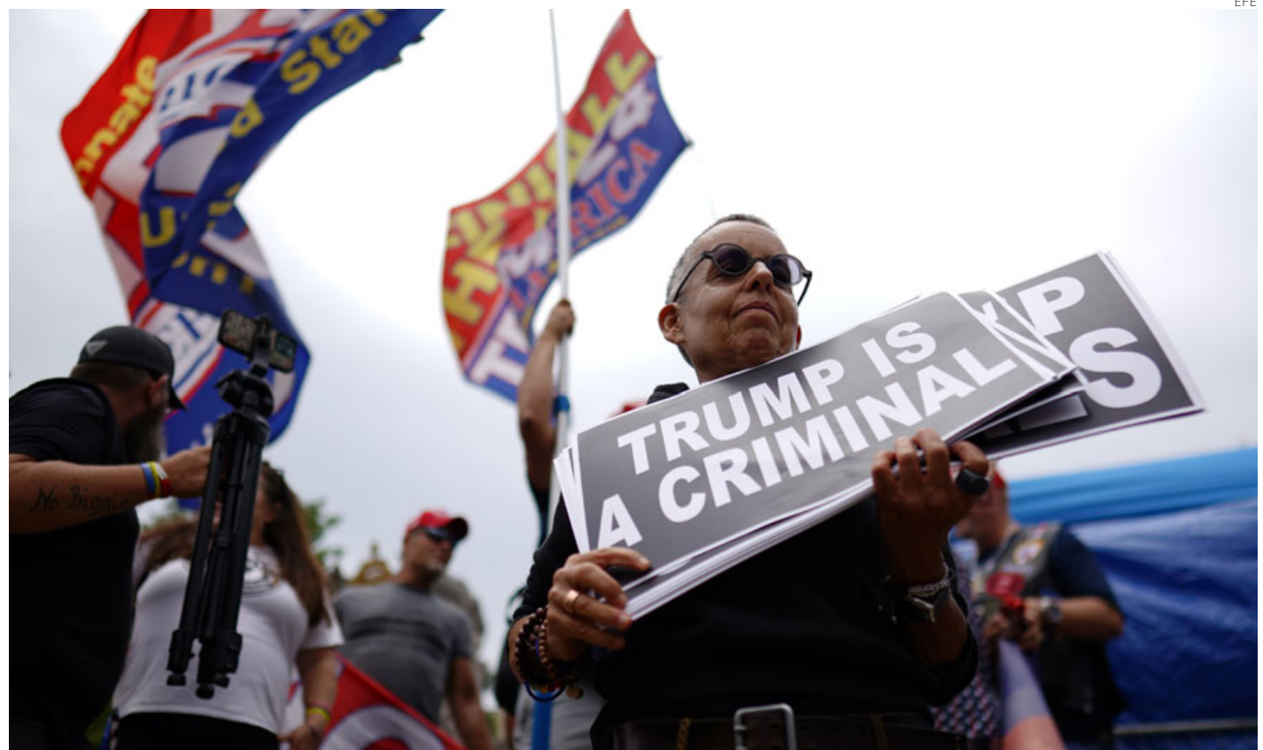
Manifestantes afuera del Palacio de Justicia, en Washington, donde se procesará a Trump.

La jueza ofreció tres fechas distintas y la defensa de Trump optó por la más tardía, en el marco de su estrategia para retrasar este proceso lo máximo posible, pese a la intención del fiscal especial Jack Smith de que sea un juicio rápido.