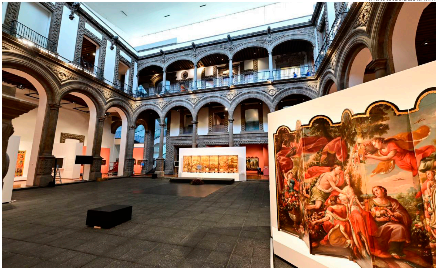
Una vista de la muestra "Biombos y castas. Pintura profana en la Nueva España".

La muestra con 9 biombos y 46 pinturas retrata lo que fueron esos tres siglos en México