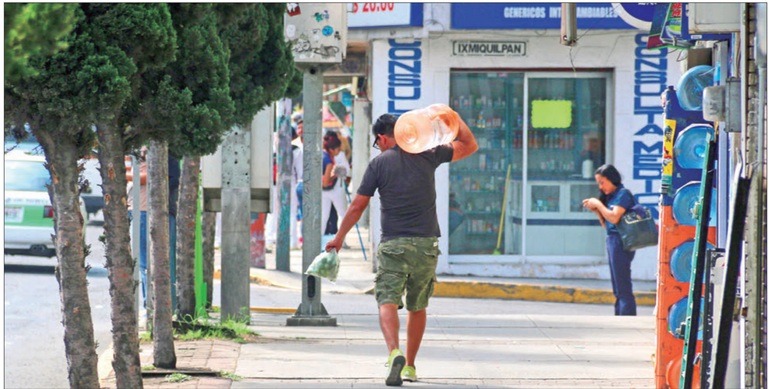
PREVISIÓN. El Servicio Meteorológico Nacional (SMN) informó que la canícula 2023 inició el pasado 21 de julio.