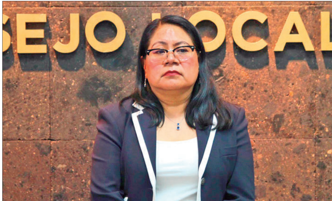
PROCESO. Los 32 Consejos Locales rendirán protesta en noviembre y para diciembre rendirán protesta los integrantes de los 300 consejos distritales.

"Siempre hay movimientos porque las personas se retiran, tienen algunos otros proyectos personales, sobre todo funcionarios que tienen larga trayectoria en el instituto, algunos de ellos fundadores del entonces Instituto Federal Electoral (IFE), es una decisión personal de quienes integran la estructura del SPEN y la rama administrativa,