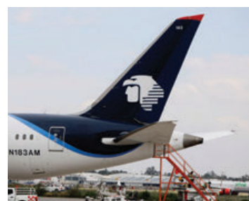
A partir de septiembre.

De acuerdo con los datos de Aeroméxico, en el AICM las principales rutas que opera son na-