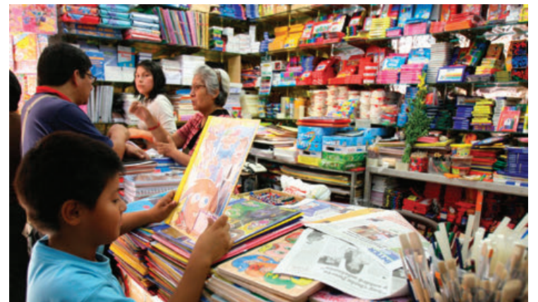
Se suma la carestía de útiles al tema de los libros de texto.

senta un gasto considerable para las familias mexicanas, por lo que recomendamos dividir este gasto a través de una planificación que se divida en dos quincenas”, explicó.