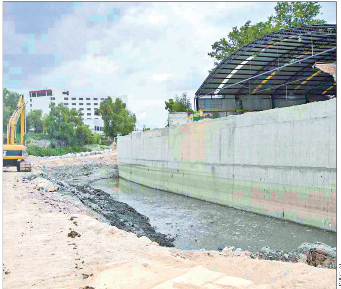
ACCIONES. El mejoramiento y la adecuación de la red de alcantarillado en el centro de Tula beneficiará a más de 115 mil habitantes.

En este mismo sentido, el mandatario refrendó el com-