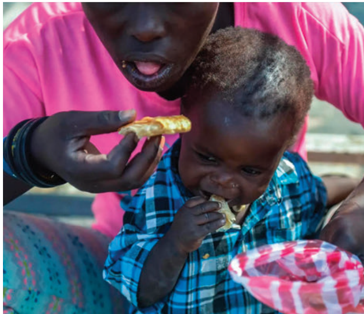
La vulnerabilidad de Haití lo hace susceptible a crisis alimentarias.

De los 10 países más afectados por el estrés climático, siete también enfrentan conflictos. Seis de ellos tienen misiones de paz de la ONU o misiones políticas especiales en su territorio, y cuatro de ellos tienen cerca de un millón de personas al borde de la hambruna.