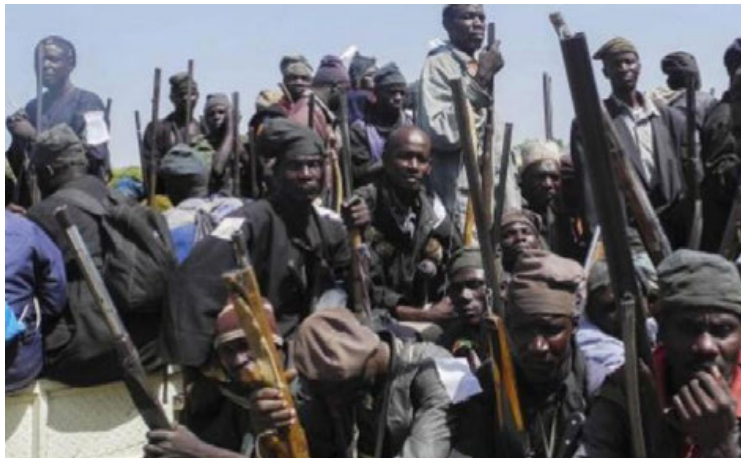
Imagen de archivo del grupo yihadista Boko Haram.

Interceptaron a jóvenes pescando y obligaron a uno de los amigos a llevar los cadáveres a familiares