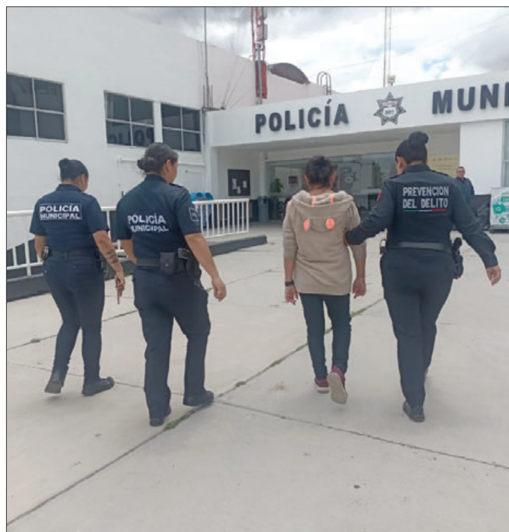
OPERATIVIDAD. Municipales confirmaron que era la persona desaparecida, misma que ya contaba con ficha de búsqueda.

De esta manera, "la Secretaría de Seguridad Pública, Tránsito y Vialidad de reiteró su compromiso para mantener a Pachuca Segura".