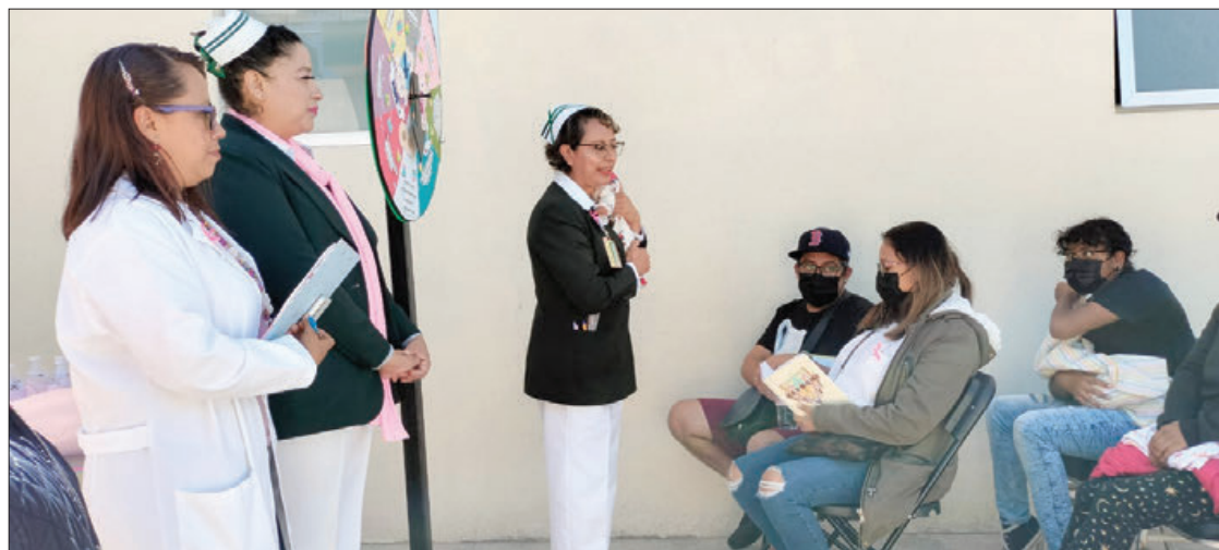
LEMA. Facilitar la lactancia materna: marcando la diferencia para las madres y padres que trabajan.

Es importante destacar que, durante estos encuentros, también se abordaron temas fundamentales relacionados con la salud sexual y reproductiva, en particular el manejo del VIH y la sífilis durante el embarazo, se proporcionó información crucial sobre los