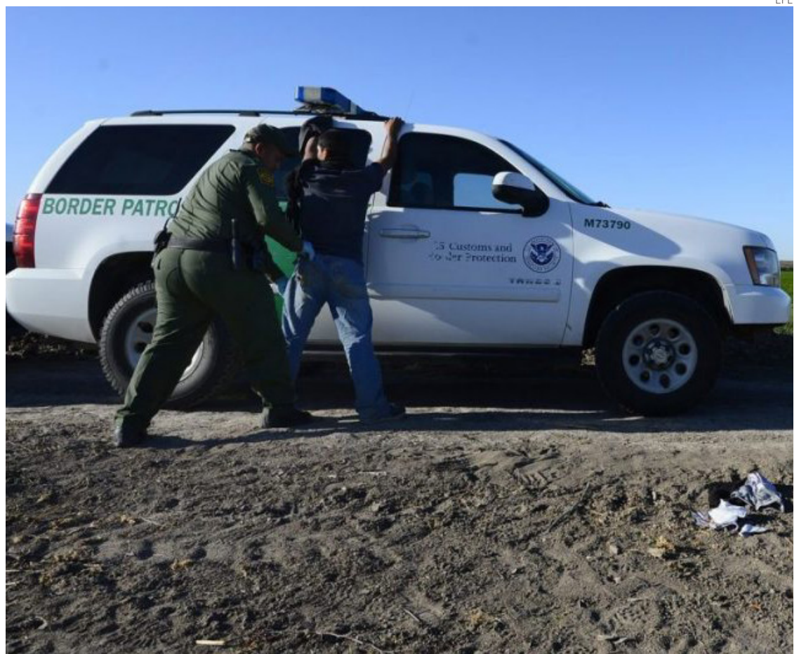
El aumento de detenciones sería de 30 por ciento.