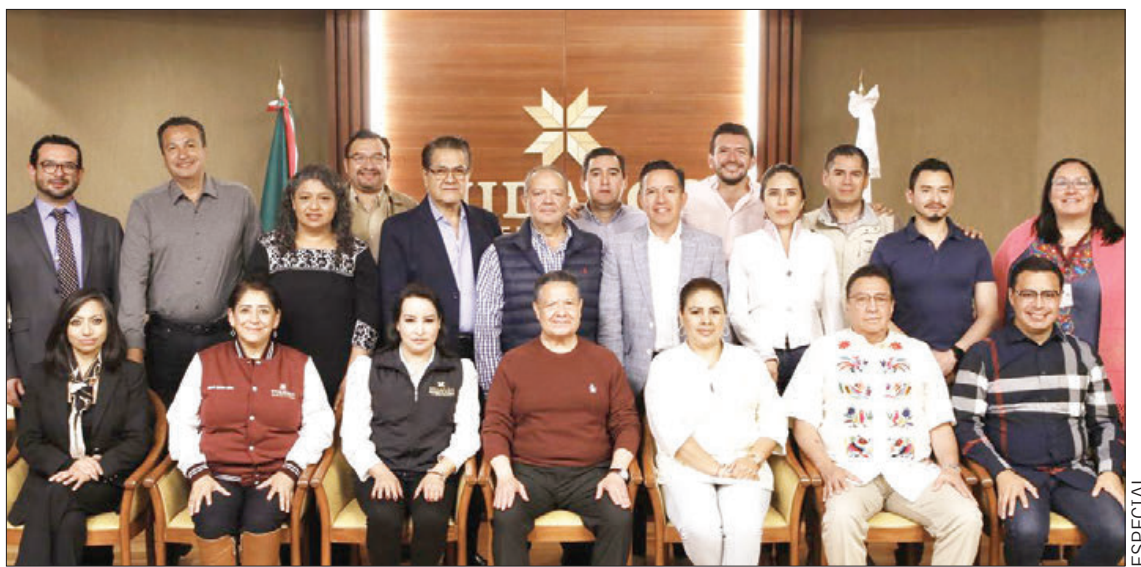
AGOSTO 5. Me reuní con las y los secretarios del Gobierno de Hidalgo para revisar el progreso de los proyectos en 11 meses de administración. Junto al pueblo, estamos avanzando en la transformación del estado entregando resultados que mejoran vidas: Julio Menchaca.

Resaltó la Secretaría de Salud de Hidalgo (SSH) que de acuerdo con estimaciones del Consejo Estatal para la Prevención de Accidentes (Coepra), durante los periodos vacacionales este tipo de sucesos se incrementan entre 5 y 10 por ciento, principalmente en playas sin vigilancia, por lo que hizo un llamado a padres de familia y a la ciudadanía en general para extremar precauciones. .3