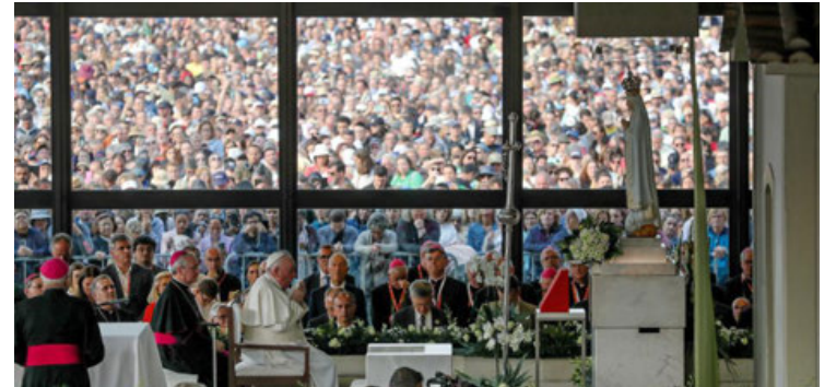
El Papa Francisco rezando en la Capilla de las Apariciones en Fátima en la Jornada Mundial de la Juventud.

Desde su llegada a Lisboa este miércoles para participar en la Jornada Mundial de la Juventud (JMJ), el papa ha preferido saltarse o no leer los discursos preparados en tres ocasiones, incluido el vía crucis de este viernes, mientras que tampoco