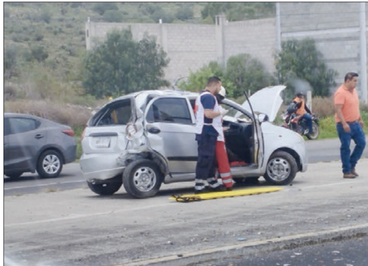
AGOSTO 5. Llamado a la población a manejar con precaución en las diferentes vías de acceso a la capital de Hidalgo que han sido escenario de diversos accidentes automovilísticos.

El percance también generó complicaciones viales en este tramo carretero en dirección a Ciudad Sahagún, lo cual complicó aún más a la circulación en el lugar en el que también se realizan labores de mejoramiento de la