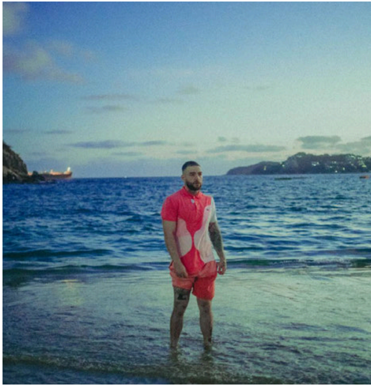
Imagen del videoclip 'Top Love' de Yoiker.

"Para mi, el amor en forma de droga suena así" reveló el rapero con respecto a el sencillo que marca una nueva dirección en su proyecto musical