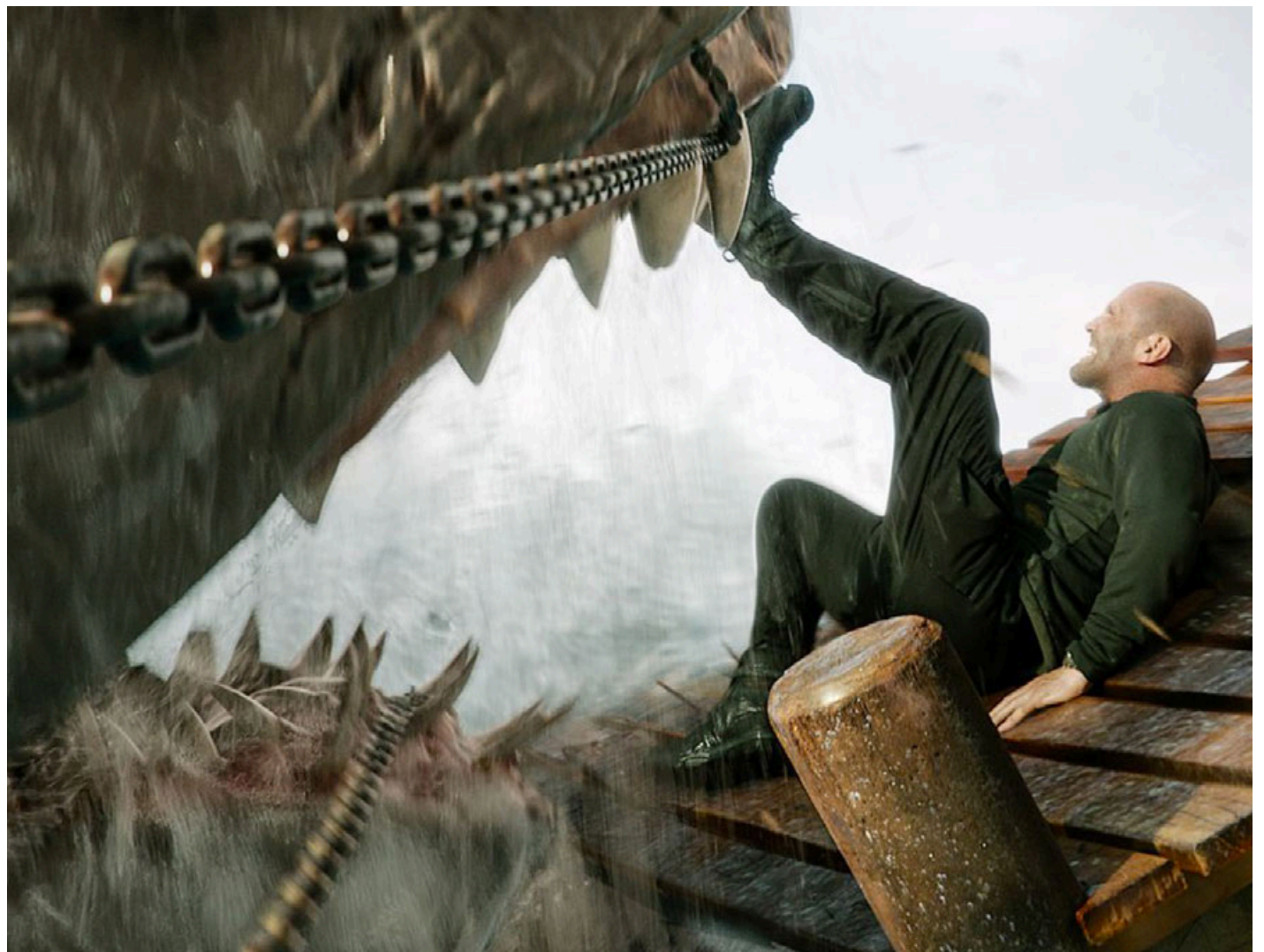
Fotograma del filme.

No todo es culpa del director. El guión escrito nuevamente por Dean Georgaris, Erich y Jon Hoeber, trata de incluir temas como el saqueo ambiental, la amenaza de la naturaleza y una explosión de criaturas de mar casi prehistóricas que se convertirán en los depredadores despiadados que buscan derrotar a Statham y compañía. El problema es el planteamiento inicial, mismo que se hace aletargado debido a la exploración