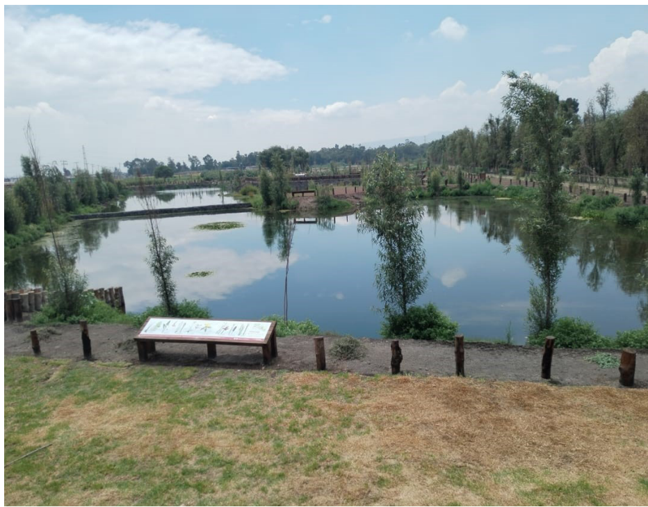
Una vista del humedal en la delegación Tláhuac.