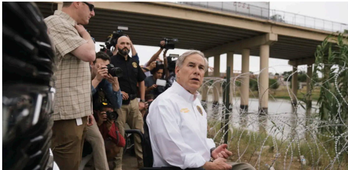
El gobernador de Texas, este lunes ante la orilla alambrada del lado estadounidense del río Bravo, a la altura de Eagle Pass X.

Las críticas contra las boyas aumentaron a principios de este mes cuando el cuerpo de un migrante fue encontrado atorado en las mismas. Abbott se defendió entonces diciendo que el