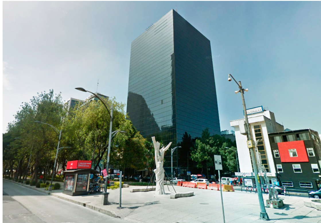
La Secretaría de Cultura federal.