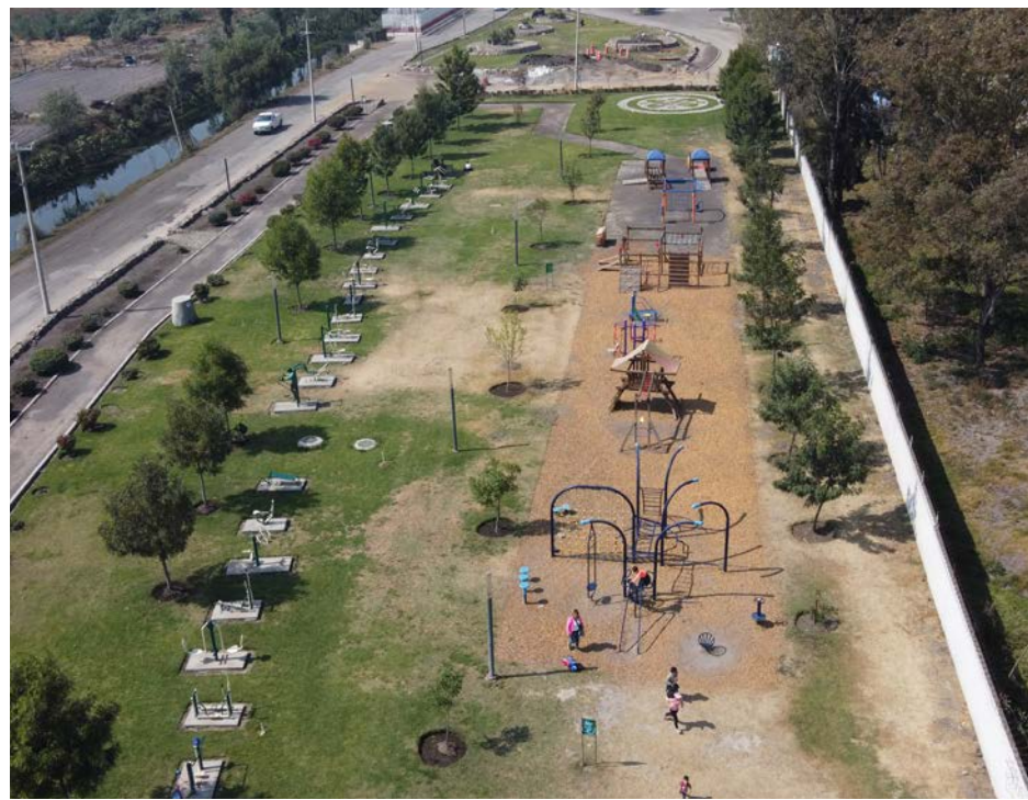
La brecha, el espacio biocultural.