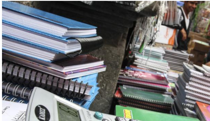
La iniciativa busca asegurar que los precios de los útiles escolares sean razonables y justos.

La Comisión Permanente del Congreso de la Ciudad de México ha emitido un llamado a Francisco Ricardo Sheffield, titular de la Procuraduría Federal del Consumidor (Profeco), para que se realicen campañas informativas que prevengan abusos en la venta de útiles escolares. La medida surge como respuesta al impacto de la inflación en los precios de estos materiales, lo cual