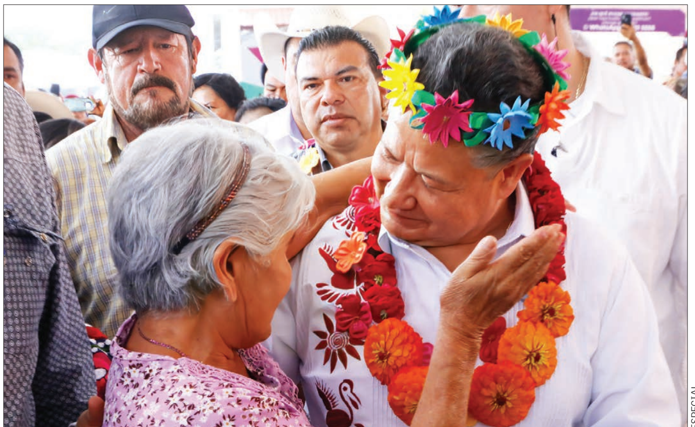
A menos de un año, el gobernador Julio Menchaca Salazar realizó 160 visitas a comunidades de los 84 municipios, como parte de las Rutas de la Transformación.

■ Formalizan convenio de colaboración entre el gobierno estatal y el Instituto de Salud para el Bienestar 4