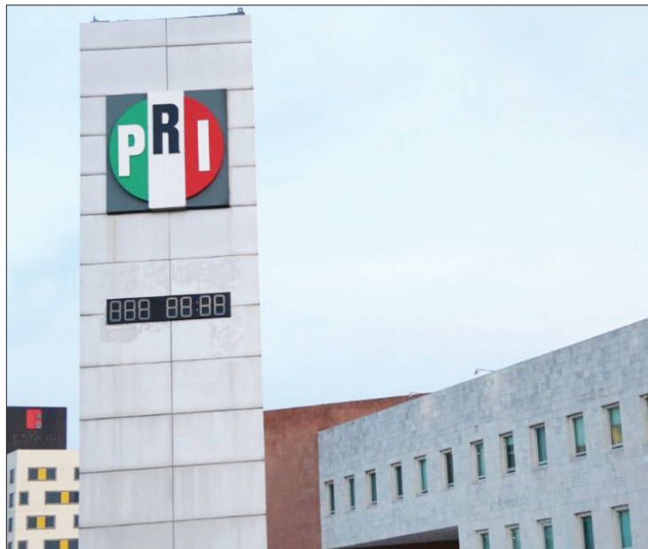
DATOS. Tan solo del 1 de enero al 31 de julio de este año refieren 8 mil 309 peticiones informativas.

El ITAIH recuerda a la ciudadanía que puede formalizar solicitudes de acceso a la información y de datos personales ante las respectivas unidades de transparencia de sujetos obligados, ya sea en el domicilio oficial desig-