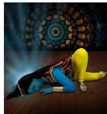
Una escena de la obra de teatro.

rimentación para tesis hace como 3 años”, indica.