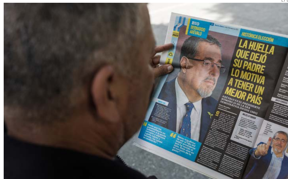
Bernardo Arévalo es hijo de Juan José Arévalo, el primer presidente popularmente electo en Guatemala tras la Revolución de 1944.

El presidente del vecino El Salvador, Nayib Bukele, felicitó por medio de la cancillería al presidente electo y mostró su disposición para “fortalecer lazos” entre ambos países. De igual manera, el dictador nicaragüense, Daniel Ortega, felicitó a Arévalo y le deseó suerte en los desafíos que encontrará “en búsqueda de la paz”.