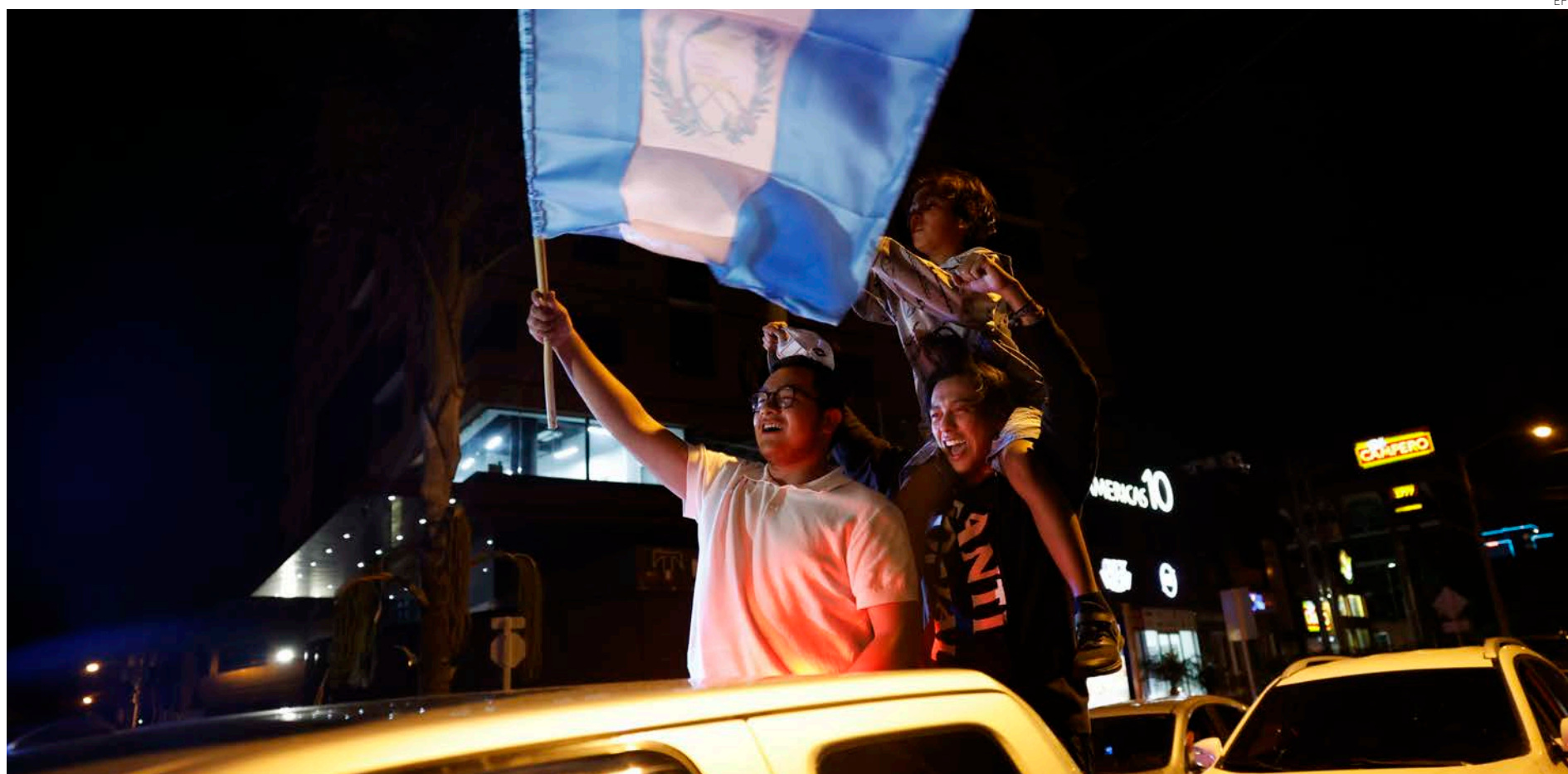
Guatemaltecos, en su mayoría jóvenes, celebraron toda la madrugada en la capital la victoria del candidato progresista.