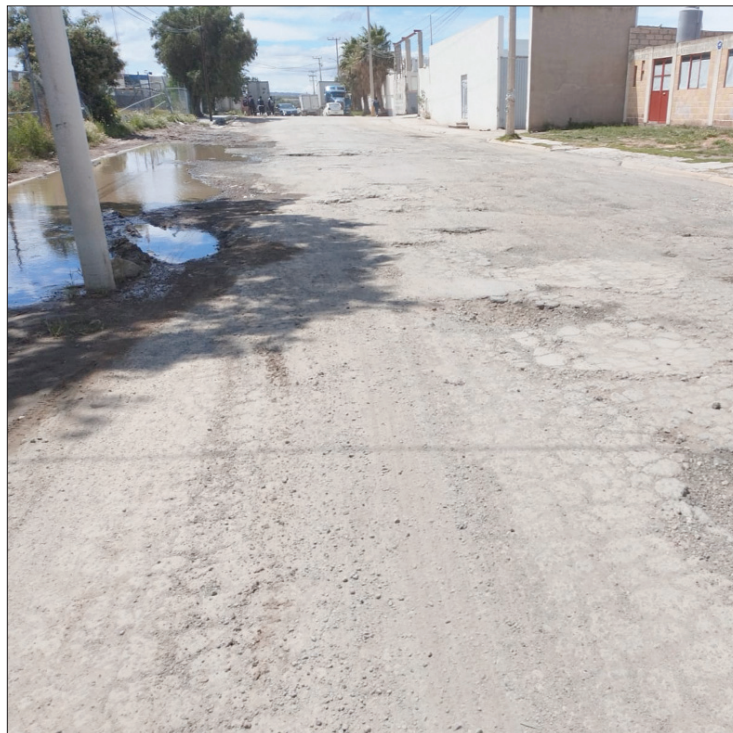
OIDOS SORDOS. Comentaron que solicitaron la intervención del alcalde Israel Félix para rehabilitar las diversas calles y no hay una respuesta positiva.

Israel Félix Soto en lugar de realizar su tradicional feria en el municipio, esos recursos públicos que los destine para la rehabilitación de calles, alumbrado