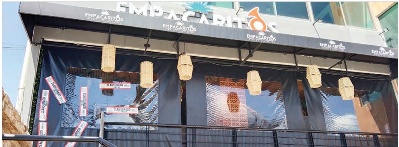
HECHOS. Anteriormente, guardias de seguridad golpearon en vía pública a un joven a las afueras de un antro de Zona Plateada.

Se advirtió que para el municipio es necesario garantizar que las familias y asistentes a estos lugares acudan espacios seguros, por lo que también establecieron que no existen, ni existirán