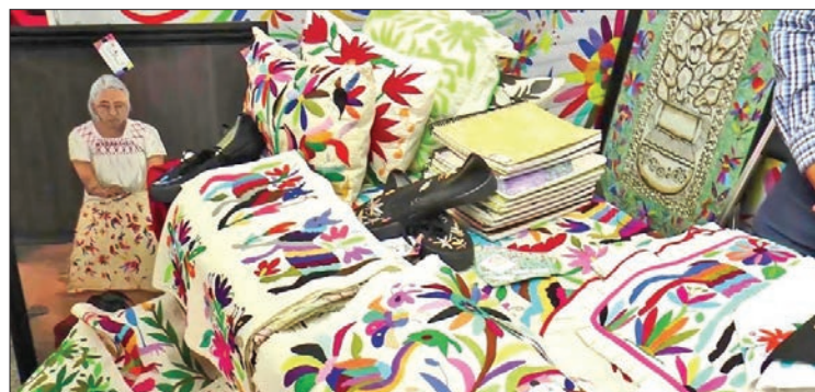
SITUACIÓN. Artesanos hoy viven una crisis económica.

Añadió que las dos fechas de celebraciones en las que han fijado su atención están prácticamente a un mes y medio, tiempo suficiente, dijeron, para trabajar en favor del sector artesanal de Hidalgo.