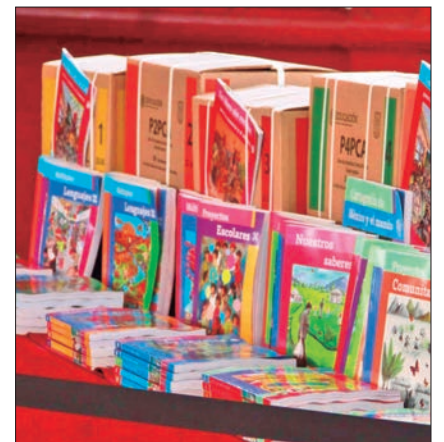
El gobernador Julio Menchaca realizó la entrega simbólica de útiles, libros y uniformes escolares.

El mandatario acudió a la develación de la placa conmemorativa en las instalaciones de RTH para retomar las frecuencias "La Voz de la Sierra Gorda". 3