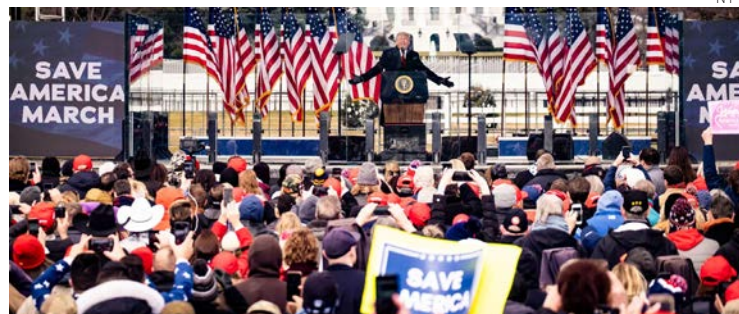
Trump arenga a sus seguidores a impedir que los legisladores ratifiquen la victoria de Biden, momentos antes del asalto al Capitolio, el 6 de enero de 2021.

La magistrada, que juzgará el caso que culminó con el asalto al Capitolio el 6 de enero de 2021, desestimó así el deseo del fiscal especial, Jack Smith, de que el juicio arrancara en enero de