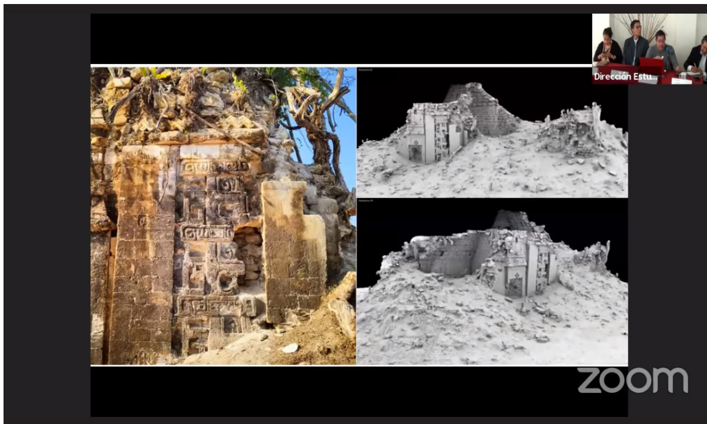
Epigrafe. Lorem ipsum dolor sit amet, consectetur adipiscing e enas bibendum lorem id rhoncu nc molestie pellentesque accumsan.

En ese tramo se realizaron 15 modificaciones de ruta, añaden expertos en la mesa “Tren Maya, proyecto arqueológico”