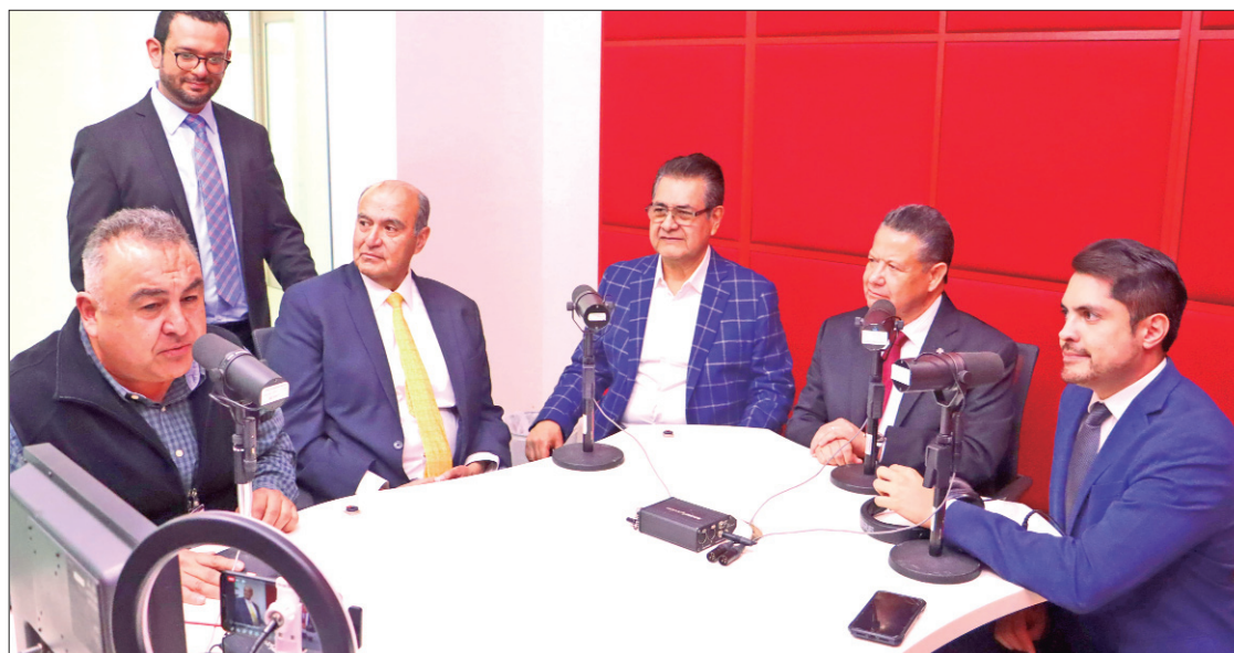
ACTO. El mandatario acudió a la develación de la placa conmemorativa en las instalaciones de RYTH para retomar las frecuencias La Voz de la Sierra Gorda.