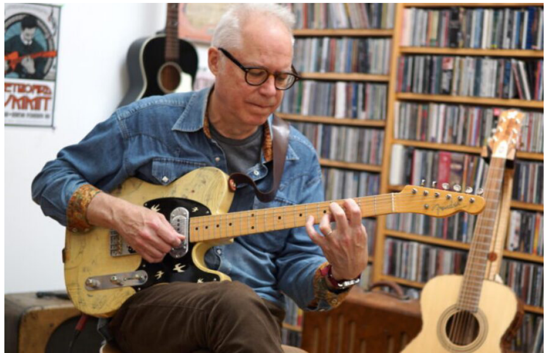
El guitarrista Bill Frisell.

El álbum “Valentine” fue grabado antes de la pandemia y se lanzó durante ese periodo tan “raro” – en palabras del guitarrista– al terminar una gira en 2019: grabaron en tres días un total de 13 piezas que el trío ya había interpretado en varias ocasiones y las cuales integran el disco.