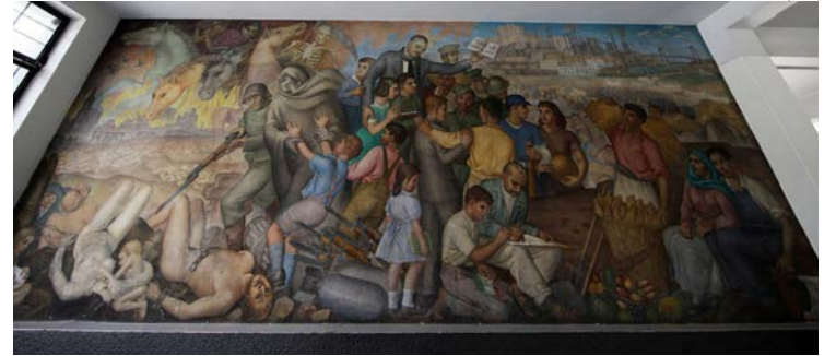
Los trabajos para preservar y restaurar los murales de Monroy serán posibles gracias a la aportación económica de diferentes entidades universitarias de la UdeG.

Detalló que en el mural “La paz y el trabajo”, fueron identifica-