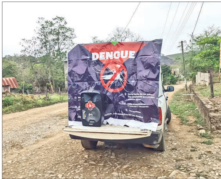
BALANCE. Son 35 casos de dengue (30 no graves, tres con signos de alarma y dos graves), en municipios endémicos.

De forma particular, derivado de la época de lluvias y dada la prevalencia de las arbovirosis a nivel estatal, las acciones contra las ETV's se mantendrán no únicamente para mejorar la calidad de vida de la población hidalguense, también para hacer conciencia ante la introducción eventual de nuevos padecimientos como la fiebre amarilla y el virus del Mayaro.