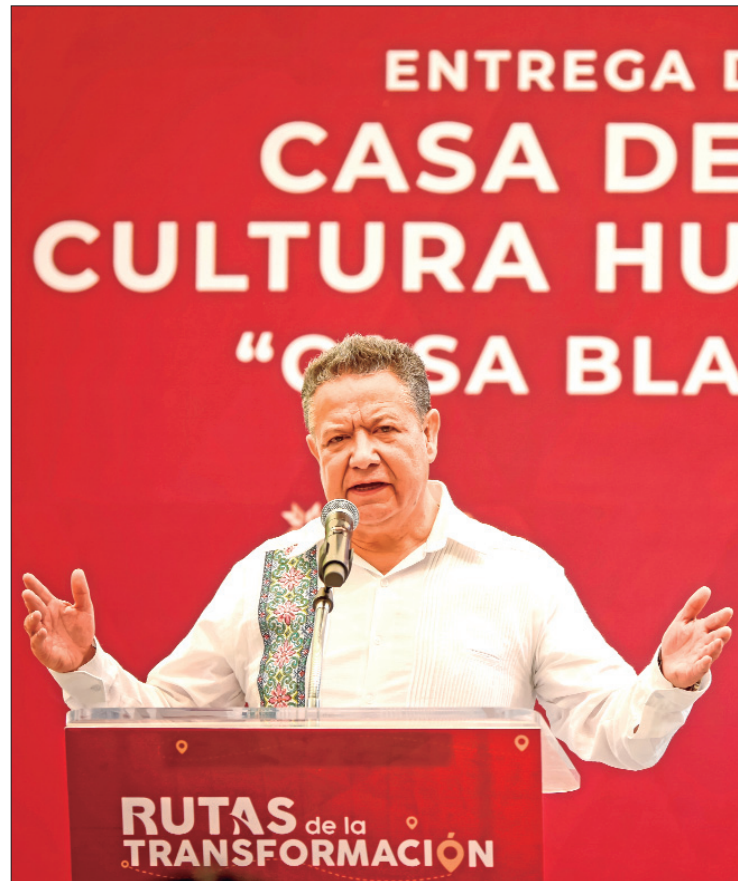
JULIO MENCHACA. Desde el inicio nos comprometimos a trabajar con pasión y dedicación para lograr un Hidalgo más próspero.

Se creó un cuerpo policial especializado en temas de violencia de género y protección familiar y gracias a la "Estrategia Estatal de Búsqueda", en cola-