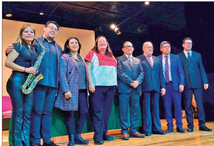
PESPECTIVA. La primera generación de 54 estudiantes será capacitada por docentes alineados a la Nueva Escuela Mexicana.

El Bachillerato en Artes de la EMEH cuenta con una modali-