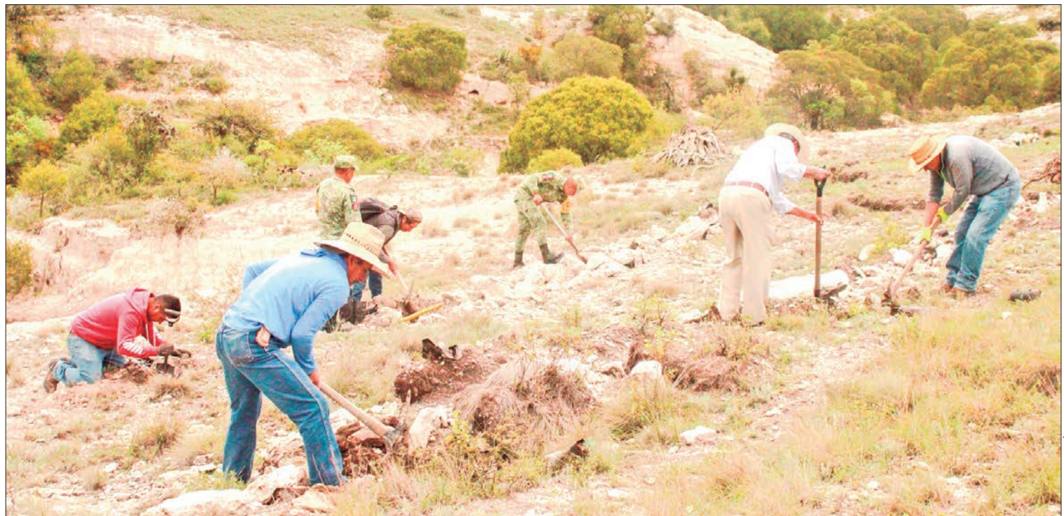
ACCIONES. Se prevé plantar poco más de cinco mil ejemplares de árboles de pino.

De acuerdo con la información emitida por los integrantes del Comité de Restauración, actualmente está cruz presenta daños por sus 125 años de edad, por lo que se han dado a la tarea de conservar este monolito de cantera que forma parte del patrimonio cultural, artístico y religioso del municipio. (Hugo Cardón Martínez)