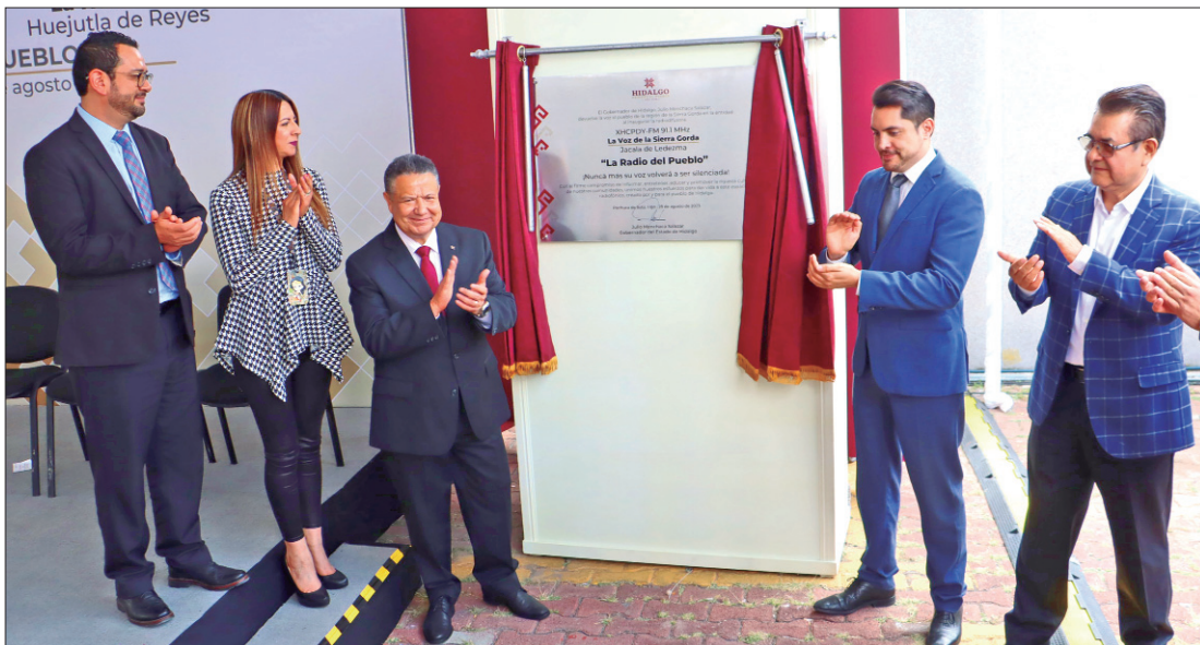
El mandatario Julio Menchaca acudió a la develación de la placa conmemorativa en las instalaciones de Radio y Televisión de Hidalgo para retomar las frecuencias La Voz de la Sierra Gorda.

■ El gobernador reiteró el compromiso de fortalecer y mejorar el sistema de Radio y Televisión de Hidalgo durante su sexenio