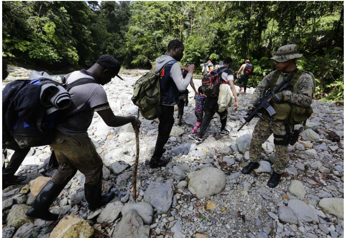
Un agente de fronteras panameño vigila el tránsito de migrantes, muchos menores de edad.

Ante el llamado de atención que Panamá viene lanzado desde hace tiempo al resto de la región por la crisis migratoria, “la