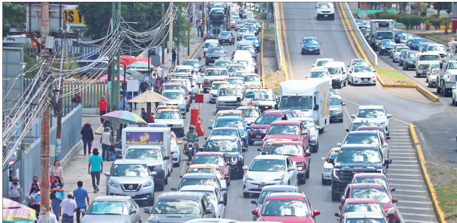
SEGURIDAD. De manera habitual regresarán los operativos de vigilancia durante los horarios de ingreso y salida de las instituciones públicas.

En municipio de la zona metropolitana como Mineral de la Reforma, Zapotlán, Zempoala, entre otros, tampoco se registró incidente alguno, salvo el notable incremento en la movilidad.