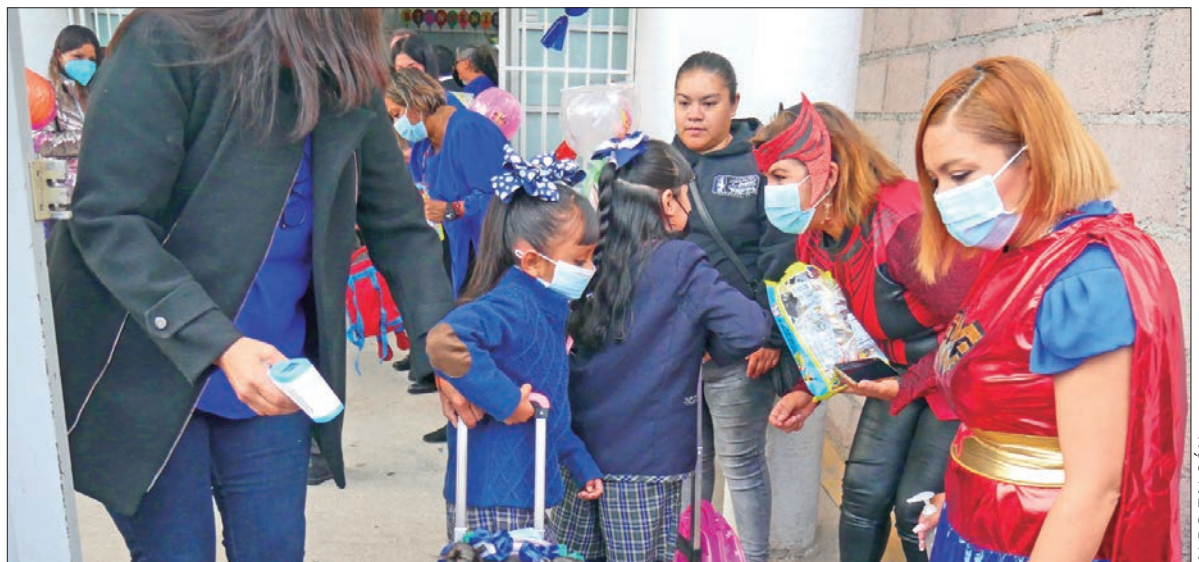
COMPROMISO. Manifestó que se redoblan esfuerzos para que la juventud y las infancias cuenten con los insumos suficientes para salir adelante.

El secretario de Educación Pública, Natividad Castrejón Valdez, recordó que la Nueva Escuela Mexicana pretende generar cambios profundos en el sector educativo con una perspectiva transformadora, humanista y de inclusión: "Gracias al esfuerzo del Gobierno de México y de Hidalgo, para este ciclo escolar 2023-2024 se entregarán 3 millones 600 mil libros de texto gratuito, además de 610 mil uniformes, e igual número de paquetes de útiles escolares".