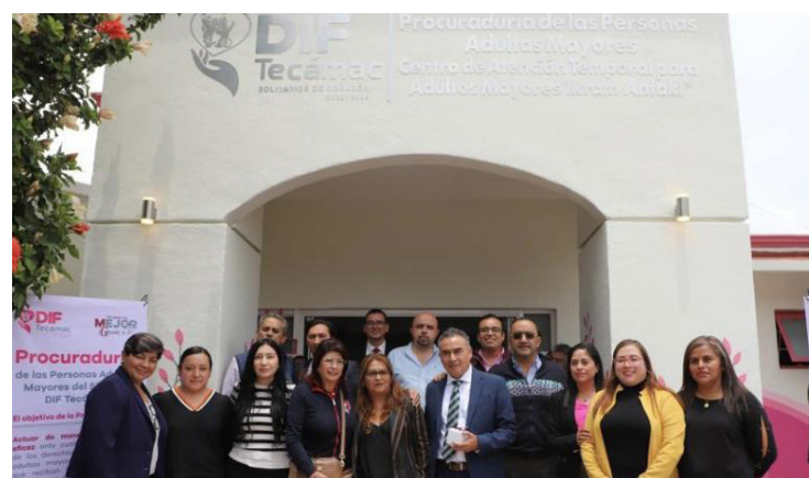
Al conmemorar el Día del Abuelo, la presidenta municipal lamentó los casos de abandono, maltrato y violencia contra este sector poblacional

En el marco del Día del Abuelo, que conmemoró en el albergue temporal "Ikram Antaki, donde se atiende a un promedio de 30 personas, indicó que desde el inicio de su gobierno se tiene este centro de atención, ante la necesidad urgente que se detectó de contar con instalaciones para atender a adultos mayores ante la indiferencia de sus familiares. ● (Redacción / Crónica)