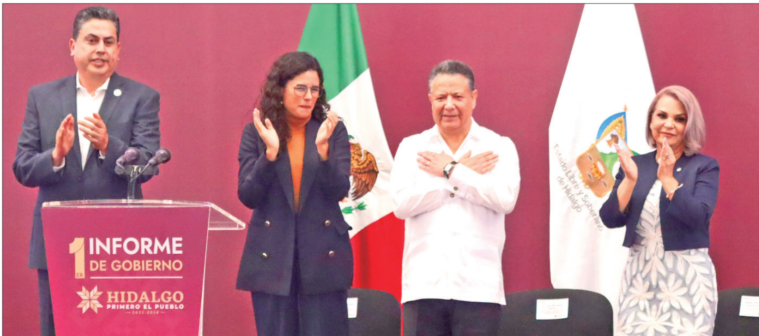
El compromiso de erradicar la corrupción es firme y será permanente, como nunca antes se ha dado el combate frontal a esta práctica que lastima y traiciona a los hidalguenses; al margen de la ley nada y por encima de la ley nadie: jefe del Ejecutivo estatal.

■ En el Primer Informe de Gobierno, Julio Menchaca convocó a funcionarios públicos a redoblar esfuerzos para trascender en la historia, tengamos presente que el compromiso de esta administración es servir .3-4