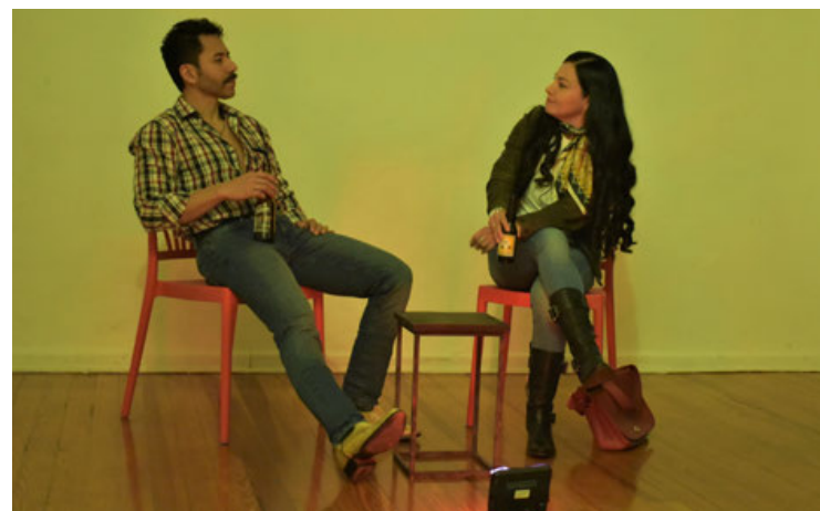
Una escena de la obra de teatro.