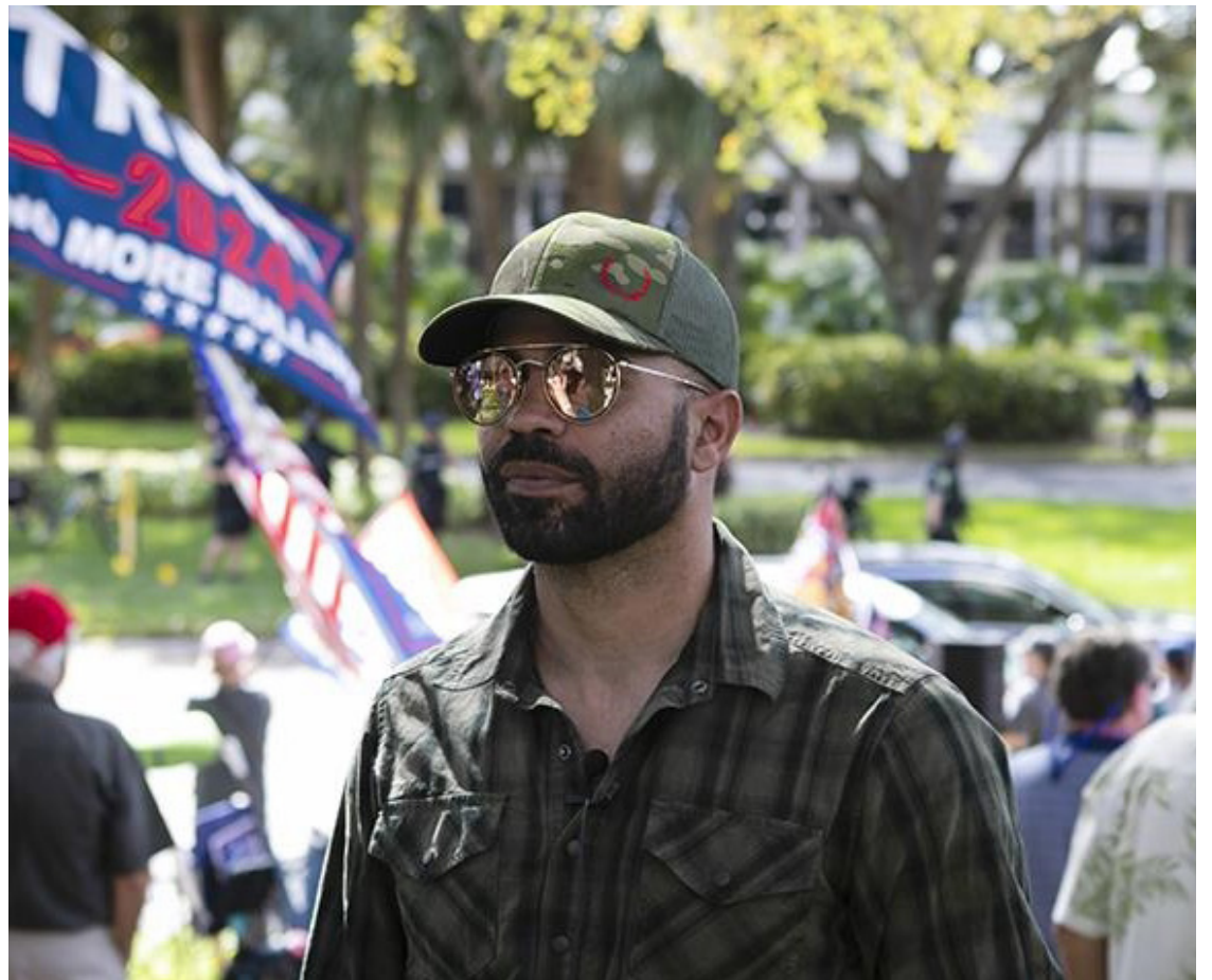
Enrique Tarrío, líder de los Proud Boys, considerado brazo armado del movimiento de apoyo a Trump.

Pese a que pudo ser un atenuante su no participación en los disturbios, la fiscalía considera que incitó a decenas de Proud Boys a marchar sobre el Capitolio y que les envió mensajes para que no cesaran en su empeño mientras se desarrolla-