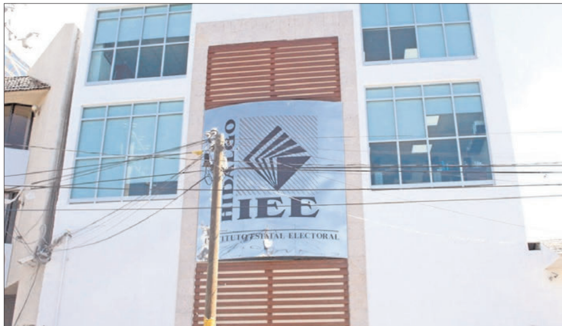
RECURSOS. También licitan para limpieza de material durante septiembre y noviembre del 2023, específicamente para retirar polvo de 3 mil 400 cancelas.

En la LP-IEEH-001-2023 detalla el requerimiento de proveedores para arrendar nueve uni-