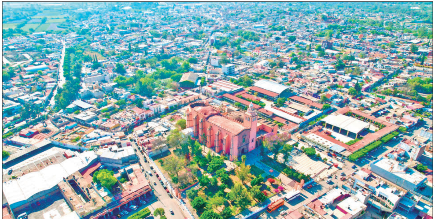
AVISO. Permanecerá cerradas las avenidas Felipe Ángeles, Circuito Plaza Juárez, avenida Jesús del Rosal y la avenida Lazon Cárdenas.

También se informó que, en esta ocasión, el trayecto de la procesión será hacia la localidad El Nith por lo que piden se tomen vías alternas para evitar embotellamientos o incidentes durante su desarrollo.