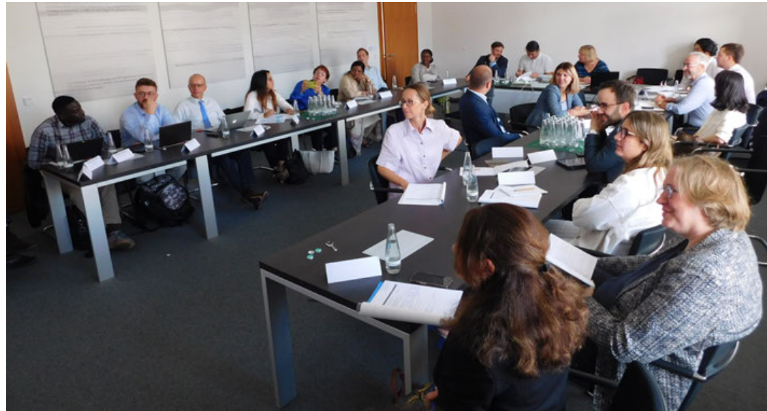
Invitados por el gobierno alemán, agrónomos, economistas, sociólogos y periodistas de 18 países analizan el futuro de la agricultura en el mundo.

También son considerados como retos: 3) Reducir el uso excesivo de Nitrógeno en los ferti-