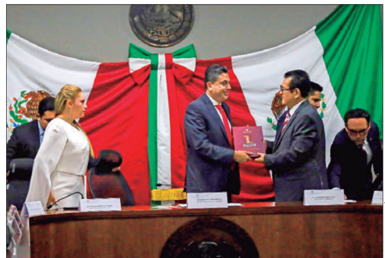
ENTORNOS. Reiteró el presidente de la Junta de Gobierno del Congreso de Hidalgo, al secretario de Gobierno, el compromiso del Poder Legislativo a mantener canales abiertos y efectivos de comunicación para construir el Hidalgo que será potencia como lo ha señalado el mandatario estatal, Julio Menchaca Salazar.

Por primera vez, las personas con discapacidad tendrán cobertura universal en la entidad, así como el incremento al presupuesto para apoyar a las mujeres hidalguenses en 40 por ciento, esto significa una inversión total de 66 millones de pesos entre la aportación estatal y federal, indicó Olivares Reyna.