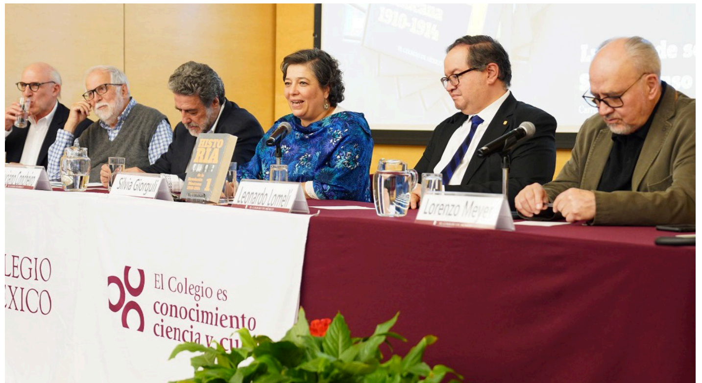
Los participantes en la presentación de “Historia de la Revolución Mexicana”.

“Generó una enorme innovación en materia historiográfica en México, pero también provocó muchos rechazos y so-