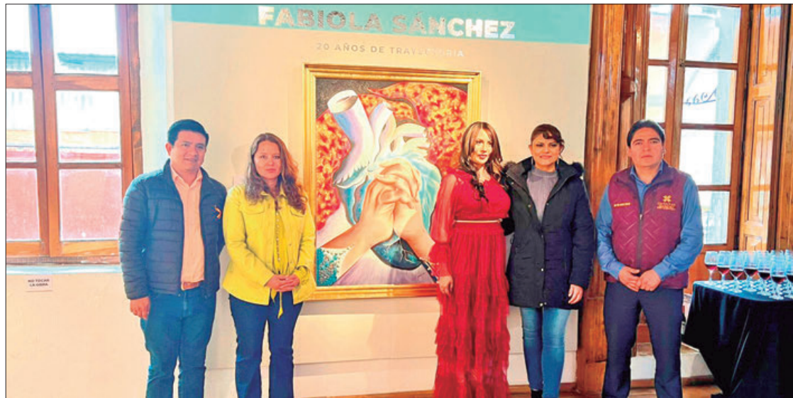
APRECIACIÓN. Mediante sus piezas busca transmitir con una perspectiva femenina su viaje entre virtudes y vicios humanos.

Destacó que mediante sus piezas busca transmitir con una perspectiva femenina su viaje entre virtudes y vicios humanos como el amor propio, la compasión, la hermandad, el desamor y el placer; además, que la visión de su trabajo es que todas y todos podamos, desde la perspectiva de su arte, entender que los seres