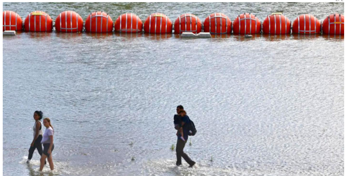
La barrera forma parte de la "Operación estrella solitaria", campaña para abordar la migración.

La decisión del tribunal de apelaciones contrasta con la tomada el miércoles por el magistrado David Ezra, del distrito oeste de Texas, en la que señalaba que el grupo de boyas, de 300 metros de longitud, obstruía "la capacidad navegable" del cauce fluvial, reprendía al Gobierno estatal por no haber solicitado permiso y ordenaba retirarla antes del 15 de septiembre.