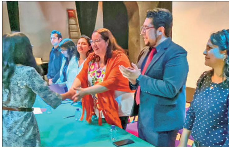
ANTECEDENTE. La institución recibió de manera histórica a la primera generación del Bachillerato en Artes, que cuenta con un modelo único en el país.