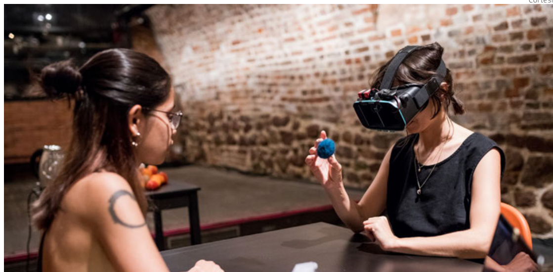
Una escena de la obra “Insider”.