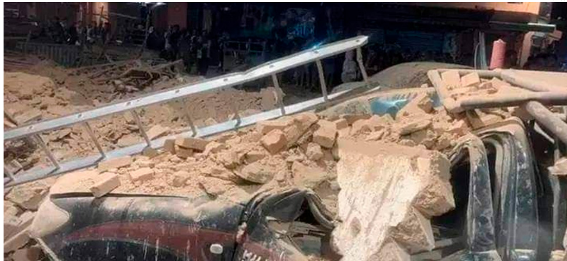
Varios edificios de la medina (ciudad antigua) de Marrakech resultaron dañados.

Según informó el Ministerio del Interior marroquí en una nota, hasta las 2:00 hora local (GMT+1) se registraron fallecidos en las provincias y prefecturas de Al Haouz, Marrakech, Ouarzazate, Azilal, Chichaoua y Taroudant.