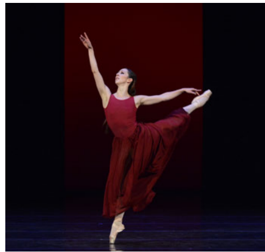
La cultura con más recursos.

Para el próximo año se prevé que el Instituto Nacional de Bellas Artes reciba 3 mil 631 millones de pesos, en comparación con los 3 mil 460 millones de 2023; y que a la Dirección General de Vinculación Cultural se le asignen 357 millones de pesos, en contraste con los 334 millones de pesos. En tanto, el Consejo Nacional de Humanidades, Ciencia y Tecnología (Conahcyt) apare-