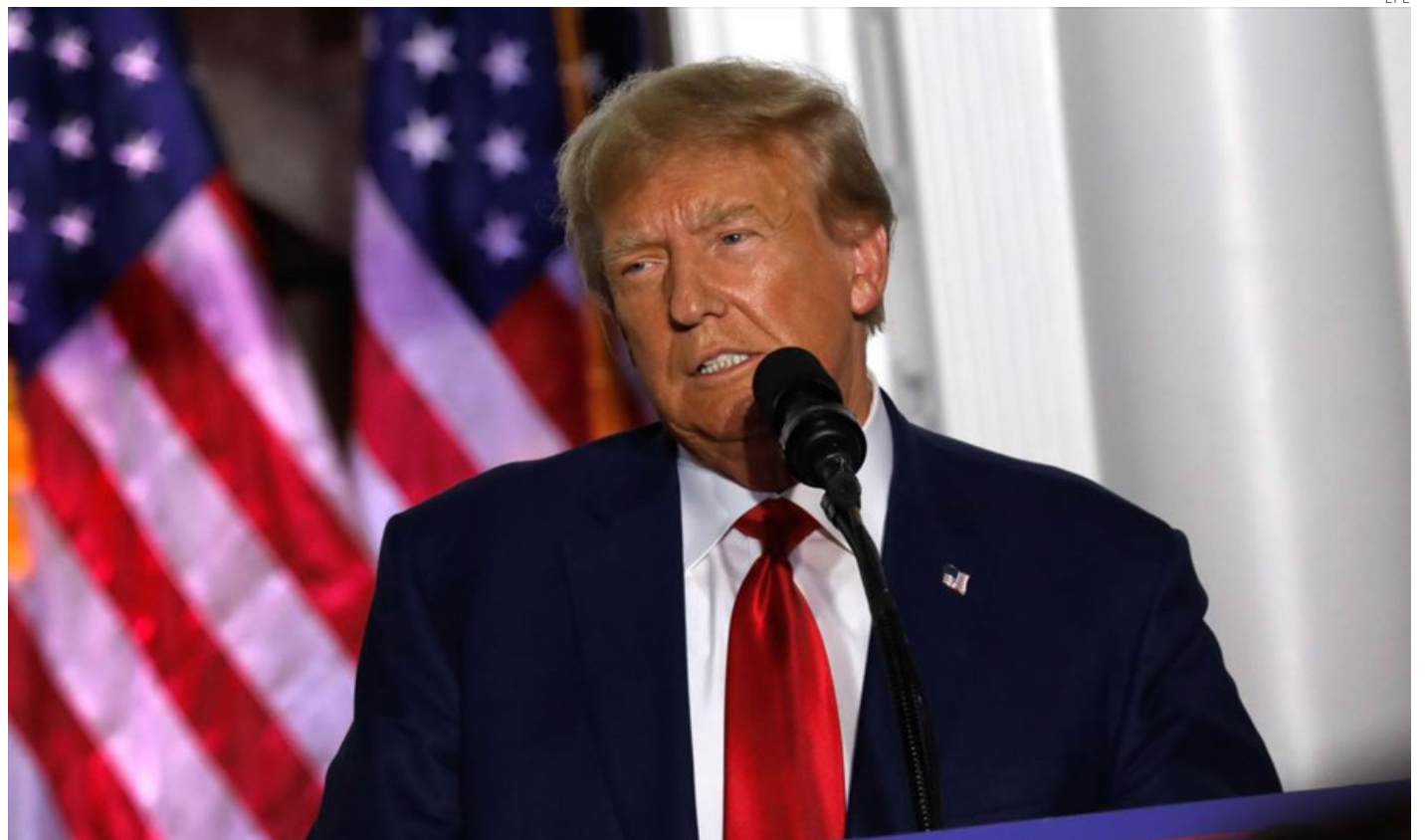
Las acusaciones son contra el ex mandatario y varios de sus hijos.

El expediente judicial presentado por la fiscal James es parte de un caso más amplio en el que se acusa a Trump y a sus coacusados de defraudar a bancos, compañías de seguros y otras entidades con el fin de beneficiar a la Organización Trump. La fiscal está buscando una compensación de 250 millones de dólares en daños y perjuicios. Esta no es la primera vez que Trump se enfrenta a acusaciones legales significativas desde que dejó el cargo presidencial en enero de 2021. Entre las acusaciones que enfrenta se incluyen problemas económicos, asuntos de seguridad nacional y cuestiones políticas.