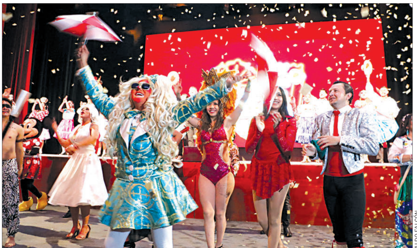
Durante la noche de este viernes, se presentaron las actividades a desarrollarse en la ya tradicional Feria de San Francisco Pachuca Hidalgo 2023, por parte de la Secretaría de Turismo de la entidad, y la Operadora de Eventos.

■ La dirigencia morenista de Hidalgo exponen su respaldo total a Claudia Sheinbaum Pardo .7