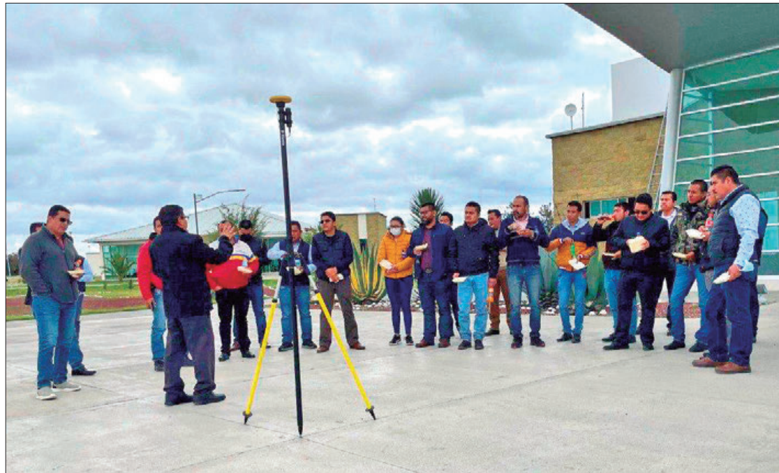
PROYECTO. La entidad obtuvo recursos federales para proyectos de modernización catastral.

Con el resultado de la evaluación en el mencionado índice, en mayo de 2023 la entidad tuvo la posibilidad de acceder en coparticipación a recursos federales para poner en marcha proyectos de modernización catastral, por un monto de más de 8 millones 524 mil pesos, de los cuales 41 % son federales y 59 % estatales. Los proyectos contemplados