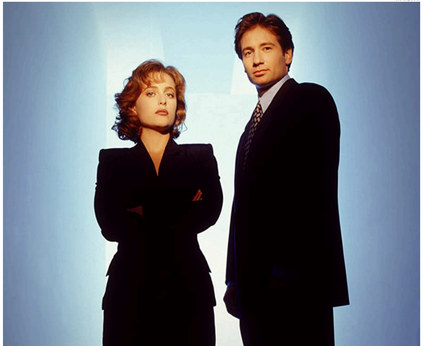
Imagen de la serie.

Lo común hasta antes de la llegada de Scully y Mulder era que, en las parejas de colegas, la mujer fuera “masculinizada” en actitudes y comportamientos para demostrar una fortaleza a la par de su colega masculino sin dejar a un lado el atractivo físico; sin embargo, al final de cada capítulo o película, sobre todo en las décadas de los 40 a los 50, el gallardo hombre cual caballero de la brillante armadura es quien rescataba a la “damisela