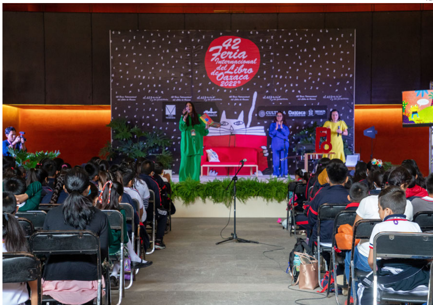
Una imagen de la edición 42 de la FILO.

«Habrá 62 expositores entre editoriales, librerías, distribuidoras y papeleras. Tendrá siete sedes como la biblioteca Chipi Chipi, en San Juan Chapultepec;