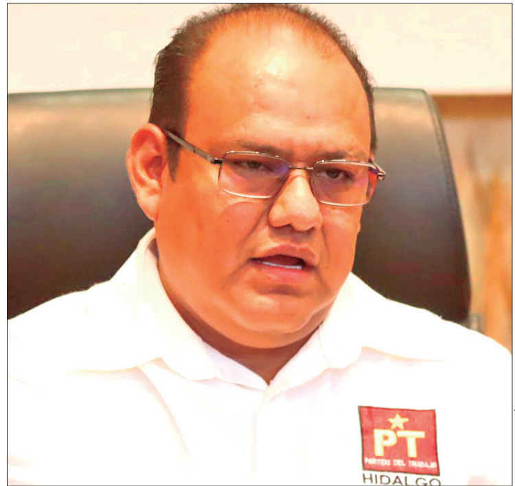
OPINIÓN. El comisionado político del PT consideró que el diputado no es culpable y criticó el uso de instituciones para afectar a liderazgos políticos.

"Por supuesto que es muy grave que la PGJEH se preste para este tipo de actos, vamos a pedir que se esclarezca y que no haya injerencia de actores políticos en esos temas, se supone que eso se acabó, que se acabó la corrupción y no podemos permitir que un gobierno que ha llegado a través de la cuarta transformación se preste a este tipo de actos".