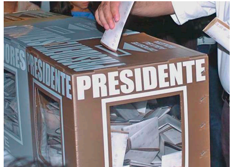
El próximo año en el país se elegirá al próximo Presidente.

El gobierno mexicano entregó el 8 de septiembre al Congreso el proyecto de presupuesto de 2024, que marcará el último año de Gobierno del presidente Andrés Manuel López Obrador. En su análisis, UBS explicó que la mayor parte del aumento se debe a un alza en los programas