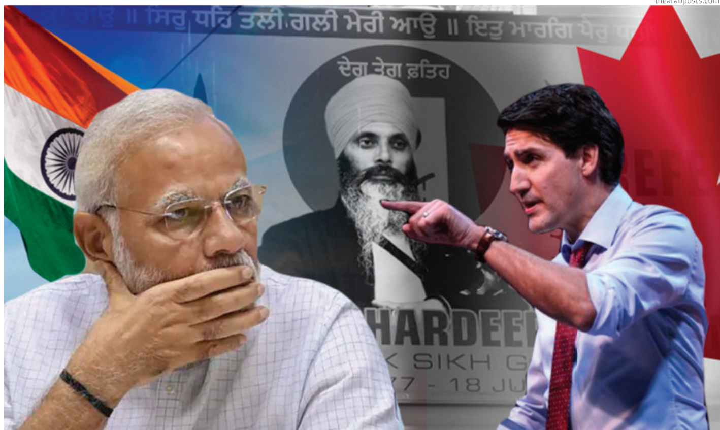
El conflicto estalló tras el asesinato de un líder separatista sij y ciudadano canadiense.

Previamente, el miércoles el gobierno indio había exhortado a sus ciudadanos a extremar la cautela: "En vista de las cre-