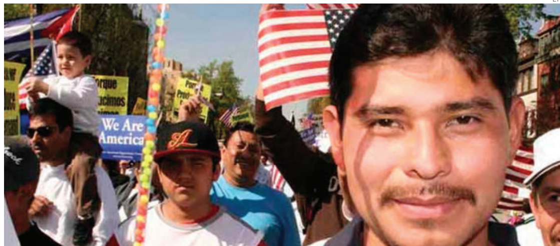
Los aportes de la población latina a la economía estadounidense "no son reconocidos", asegura la UCLA.

A pesar de políticas migratorias que presionan a la comuni-