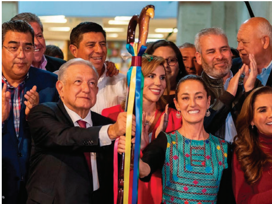
Representante de pueblos reclama a AMLO por entrega de bastón a Sheinbaum.

Y por extraño como parezca, la reciente e inapropiada utilización partidaria del señor presidente del mítico “Bastón de Mando” de uno de tantos grupos, para legitimar la continuidad de un movimiento político alejado completamente de la visión indígena, como talismán de la legalidad partidaria, derivada no de la respetable leyenda sino de la confusión entre el bastión morenista, con