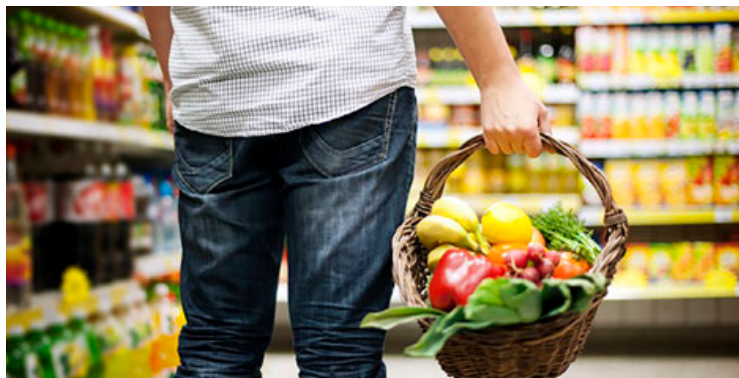
Hay cosas muy nuestras

Las ventas fueron impulsadas por el sector de alimentos y bebidas, y los enseres domésticos.