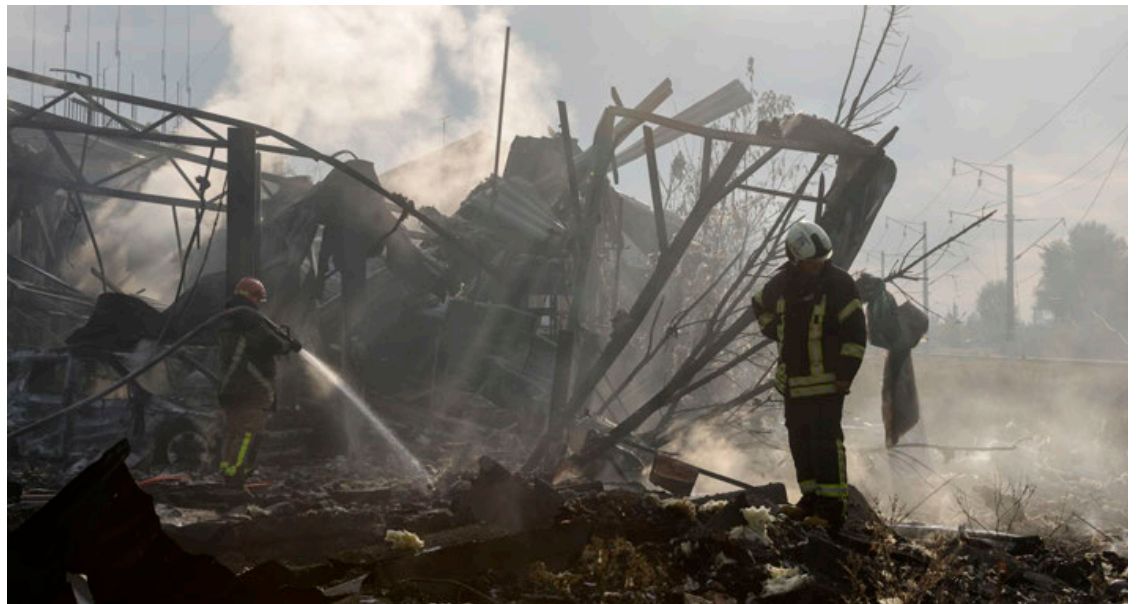
Rescatistas ucranianos en una zona residencial en Kiev.

“Si no recibimos ayuda, perderemos la guerra”, afirmó durante una reunión a puerta cerrada con un grupo de senadores, según reveló posteriormente el líder demócrata de la