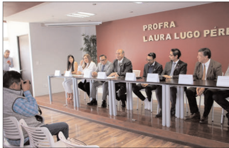
FECHA. Será el 26 de septiembre, en el Centro de Convenciones Tuzoforum de Pachuca.

Castrejón Valdez precisó que en la SEPH se impulsan una serie de acciones orientadas a brindar a las alumnas y alumnos, actividades que complementen su formación escolar, de tal forma que amplíen su visión, cuenten con mayores conocimientos, habilidades y competencias, que les posibiliten un mejor desempeño