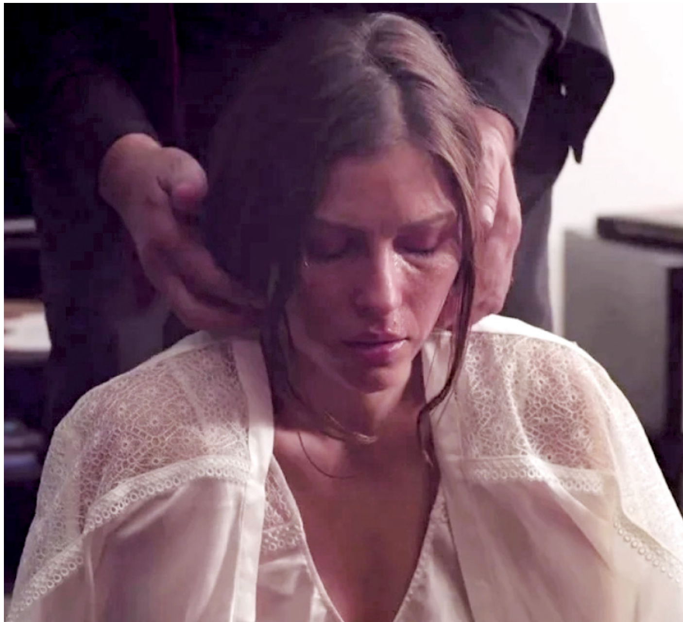
Fotograma del filme.