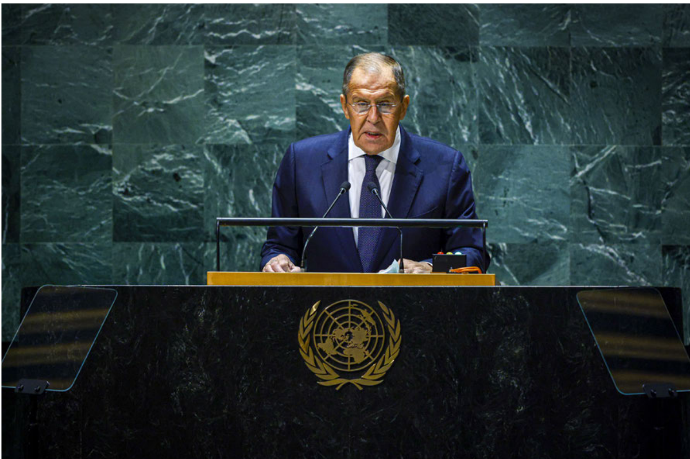
El ministro de Asuntos Exteriores de Rusia Sergei Lavrov en la ONU.

Su ministro de Exteriores anunció la disposición: “¿Quieren que sea sobre el campo de batalla? Muy bien”