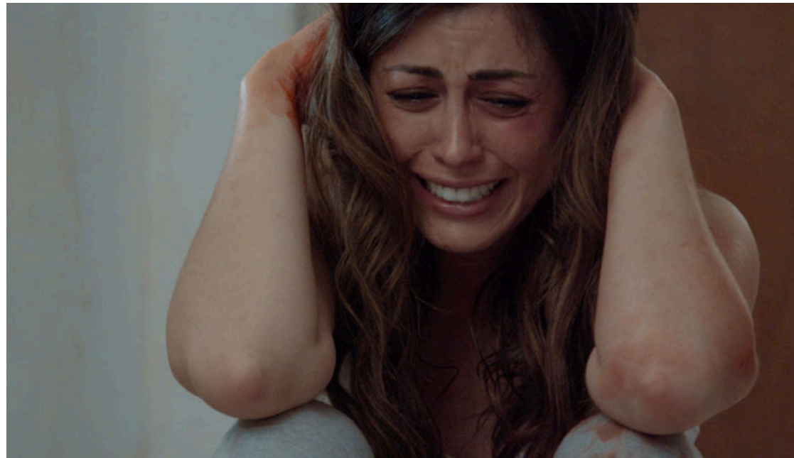
Fotograma del filme.

Sin embargo, las carencias más notorias de Por favor no me abandones no se limitan a su aspecto técnico. Las actuaciones, lamentablemente, son uno de los puntos más débiles de la cinta. Los personajes se entregan a interpretaciones exageradas que, en lugar de profundizar en sus emociones, los convierten en caricaturas. Es-