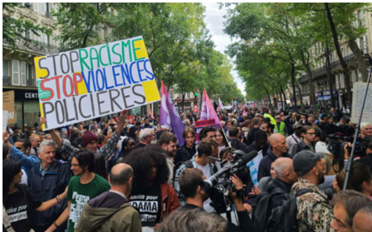
Manifestantes en París en contra de la violencia policial y el racismo.

Denuncian ultraje a derechos humanos y racismo; exigen reformas a la institución policial