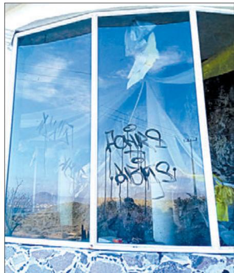
VECINOS. Exigen que se investigue los hechos y se castigue a los responsables.

► Realizaron pintas obscenas y ofensivas en el inmueble religioso de la zona