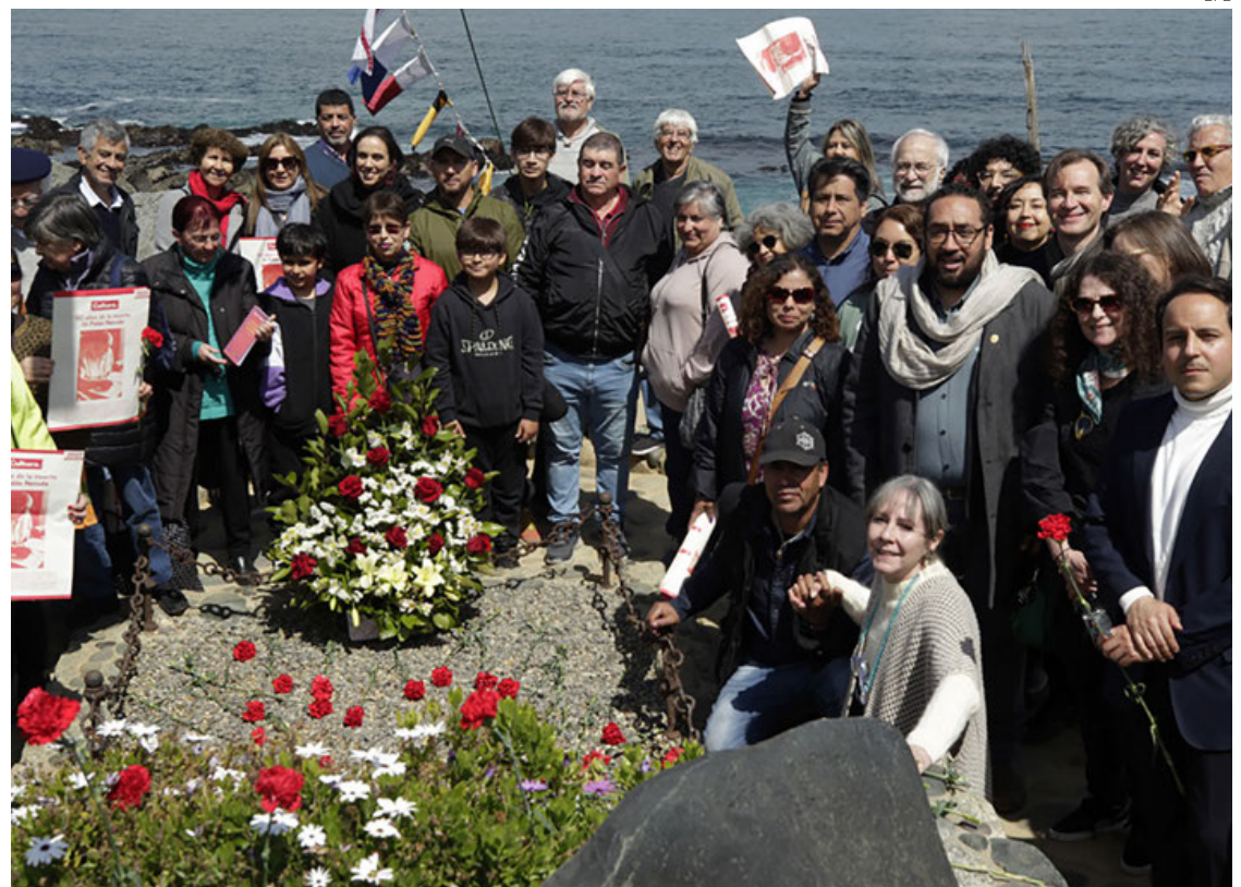
Amigos, familiares y autoridades recordaron a Pablo Neruda en su tumba en Isla Negra, Chile.