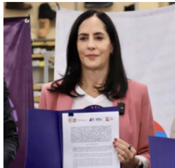
La alcaldesa de Álvaro Obregón, Lía Limón, instaló el Punto Violeta 157.

La alcaldesa de Álvaro Obregón, Lía Limón, instaló el Punto Violeta 157 en la sucursal Olivar del Conde 2ª Sección de la empresa Coppel, durante el evento explicó que son espacios de resguardo para mujeres que viven situaciones de riesgo o de peligro, ya sea en la calle, en sus casas, en sus trabajos o en donde estén: "siempre que vivan una situación de riesgo pueden acudir a nuestros Puntos Violeta y en ellos encontrarán la protección