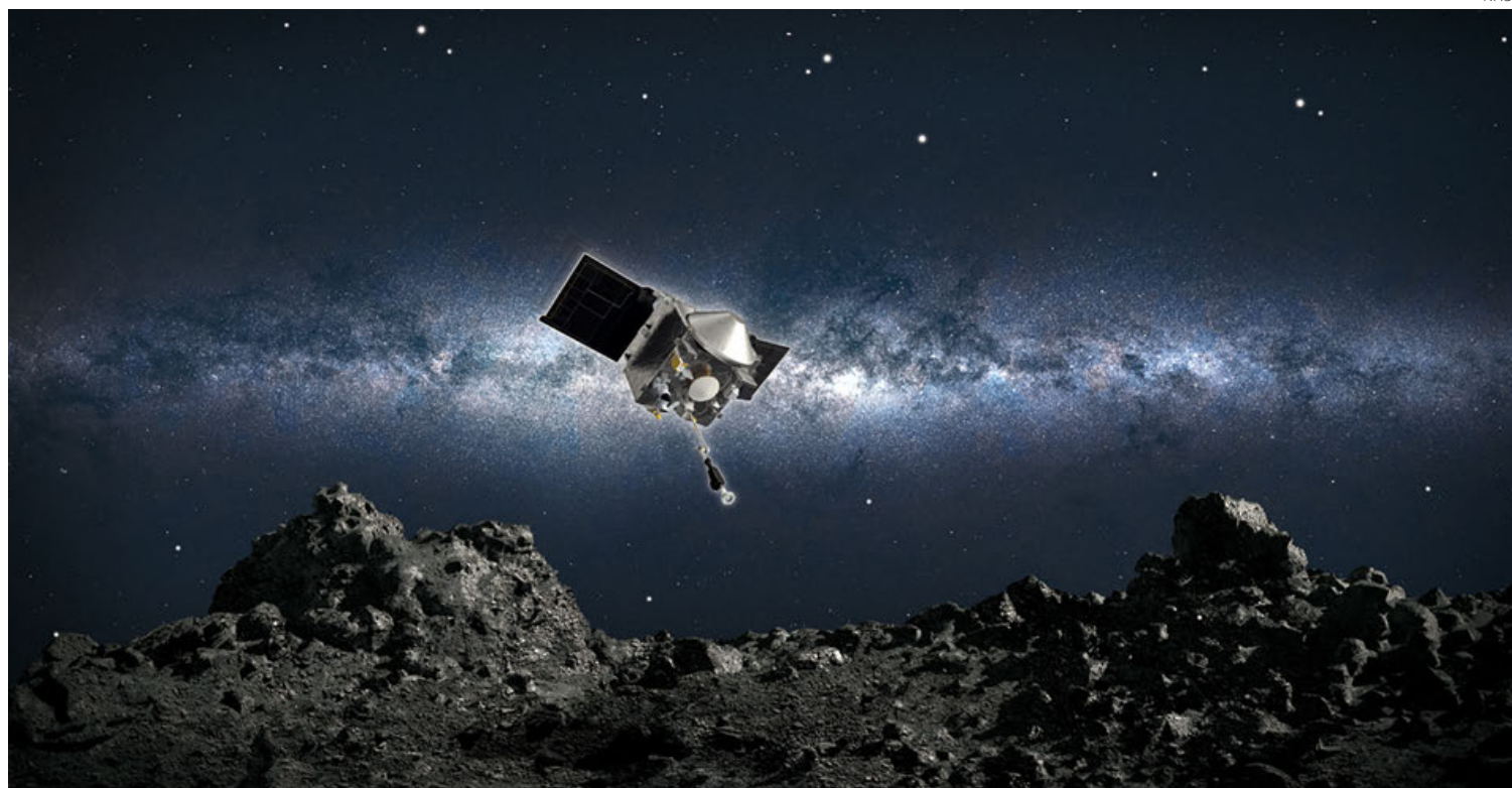
Recreación del despegue de la sonda Osiris-Rex del asteroide Bennu para regresar a la Tierra.

La sonda de la NASA aterrizará en la mañana de este domingo en el desierto de Utah. Trae 250 gramos en rocas y polvo, un cargamento muy valioso