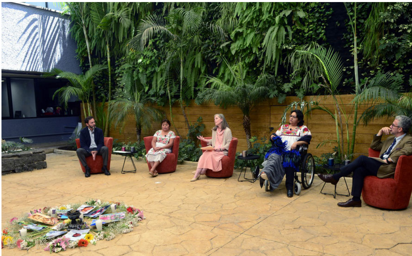
La nueva Clínica Jurídica contará con un Consejo integrado por defensores de derechos humanos de diferentes comunidades originarias.

México es un país peligroso para defensores de garantías fundamentales y los territorios: Mónica González