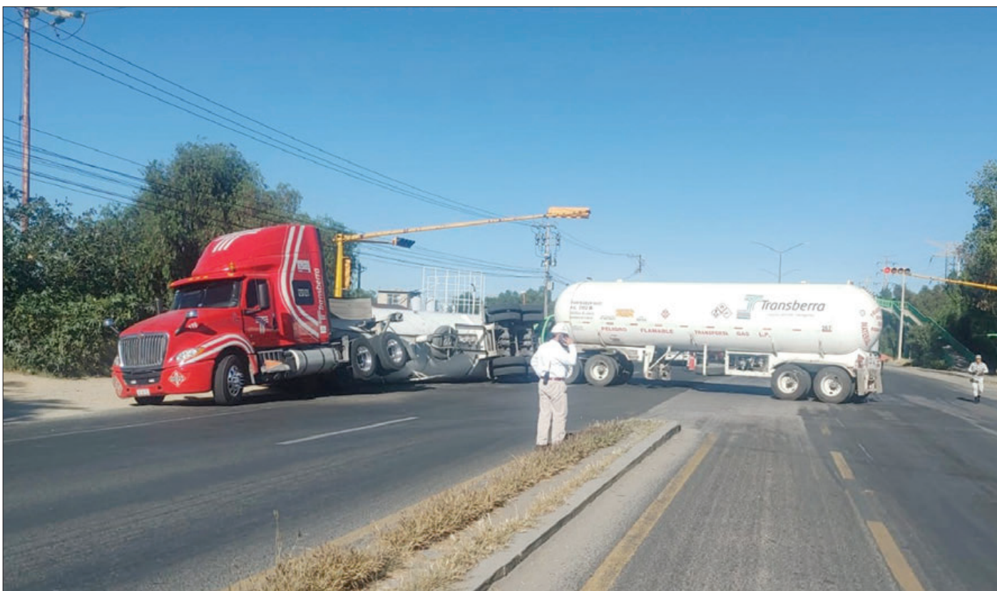
La volcadura de una pipa cargada con gas LP, provocó la movilización de los cuerpos de emergencia en Tula de Allende. Los hechos se registraron en la carretera Tula-Refinería, donde una pipa de la empresa Transberra, se accidentó. Cabe mencionar que por este hecho no se reportan personas lesionadas.

Manuel Vera Ríos señaló que en Hidalgo restan pocos talleres que se encuentran perfectamente establecidos, que trabajan bajo normas de protección civil y en las que se ejerce esa actividad de forma responsable y bajo altas medidas de seguridad. 3