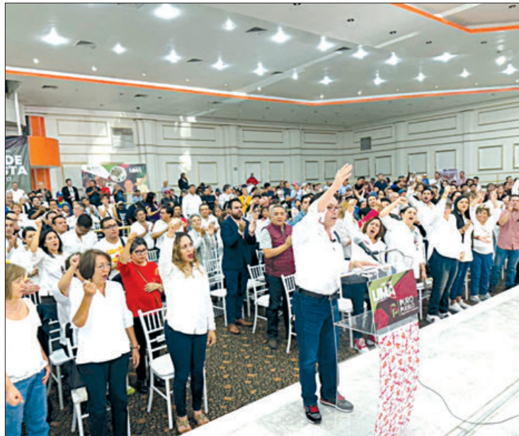
DISCURSO. Enfatizó que no son seguidores ciegos, sino críticos constructivos y aliados leales.

Sin embargo, enfatizó que no son seguidores ciegos, sino críticos constructivos y aliados leales, conscientes de que la transformación se logra con hechos y