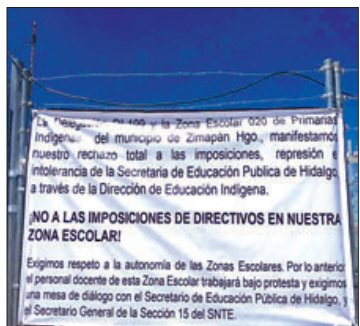
MANIFESTACIONES. Colocaron lonas en edificios educativos.

► Los maestros de la zona escolar 020 acusan imposición de autoridades educativas