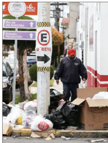
MECANISMO. El problema comienza a disminuir a raíz de la entrada en vigor del reglamento para sancionar a quienes tiren o dispersen desechos sólidos.

Aunque no dieron a conocer las zonas en las que se detectó está disminución en cuanto a la contaminación urbana, señalaron que es un hecho que en algunas zonas de la ciudad el problema comienza a disminuir a raíz de la entrada en vigor del reglamento para sancionar a quienes tiren o dispersen desechos