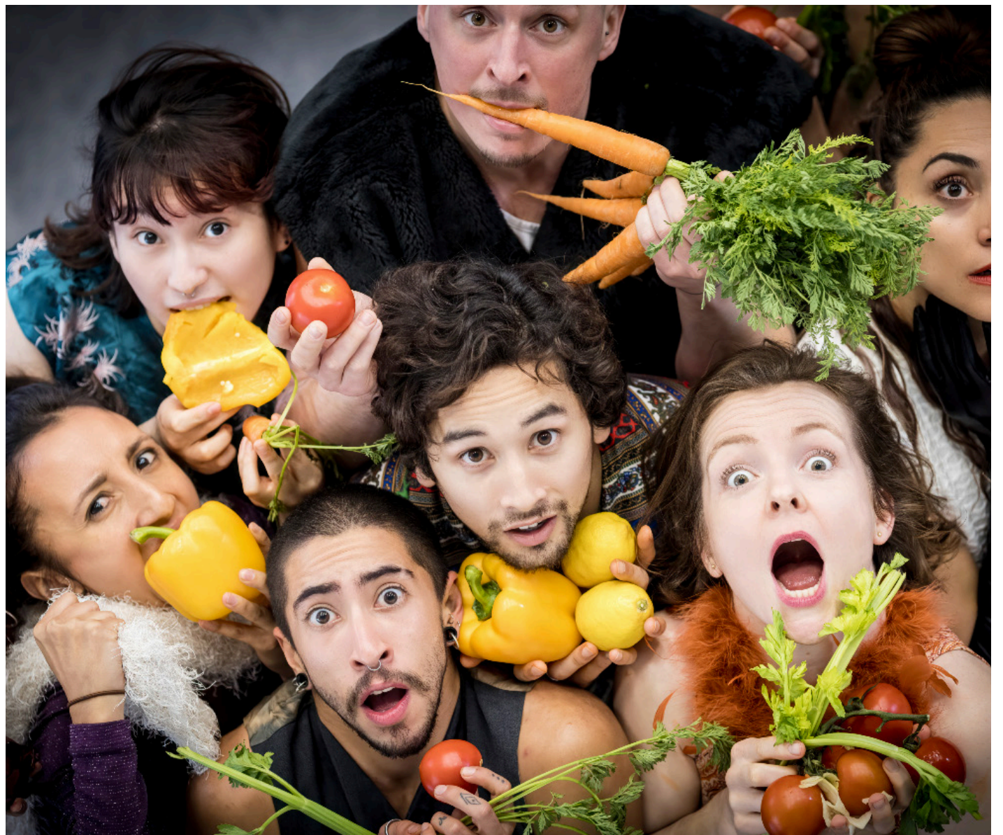
Las funciones se realizan en del foro Un Teatro.

El punto de partida fueron los mitos y leyendas en torno a la antropofagia, así como diversas reflexiones y cuestionamientos en torno a la piel y el cuerpo. Partieron de sus características sensitivas que nos permiten sentir placer o dolor y las vinculaciones que tienen con los sentidos del gusto y del olfato; sin embargo, también exploraron el uso que se le da en la vida cotidiana e íntima a la piel y al cuerpo, llegando a los extremos de su comercio y explotación.