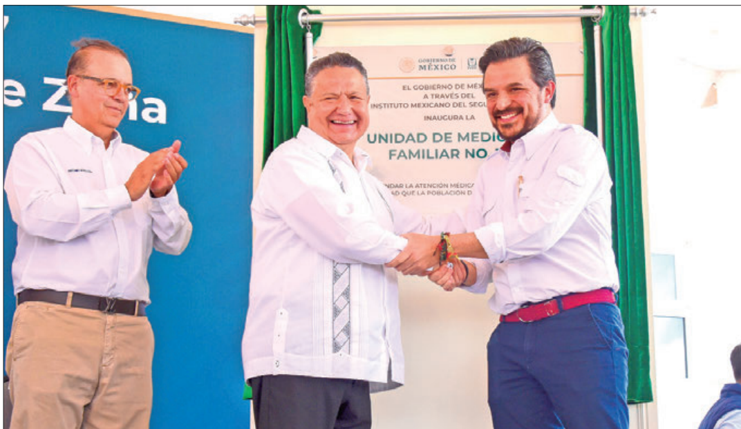
SINTONÍA. Director general del IMSS agradece al primer mandatario hidalguense, la colaboración porque sólo así es posible recuperar la confianza de la gente.

■ Encabezan Julio Menchaca y Zoé Robledo inauguración de la Unidad de Medicina Familiar No. 37, en esta demarcación, y recorrido para revisar avances en la construcción del Hospital General de Zona del Instituto Mexicano del Seguro Social