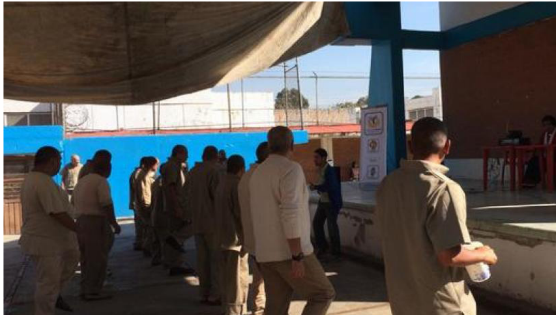
La administración del CEVAREPSI ha bloqueado toda la información del estado físico de los presidiarios.

DERECHO A LA SALUD INEXISTENTE La administración del CEVAREPSI ha bloqueado toda la información del estado físico de los presidiarios. Cuando las madres, hermanas y esposas de los internos solicitan al director el seguimiento de los infectados, Abasolo solamente responde “Todo va a estar bien, no se preocupe”, además de mentir acerca de falsos tratamientos médicos, como la aplicación de