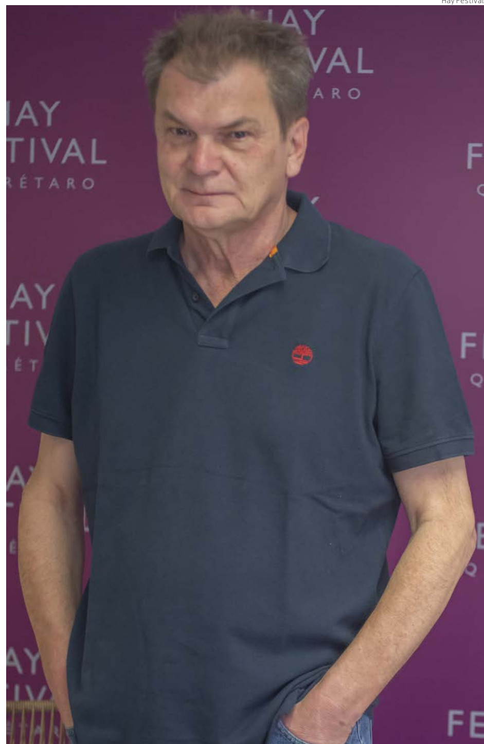
Los escritores por lo general son críticos hacia los políticos e historiadores, pero muy pocas veces a su propio trabajo, señala Goran Petrović.

Ambas cosas, efectivamente. Si sólo se tratara de satisfacer las necesidades bá-