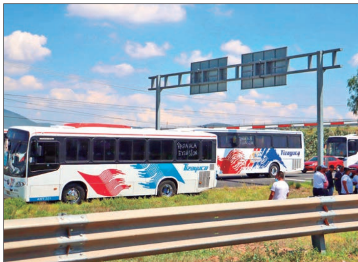
ARBITRARIEDAD. Pasaje de 35 a 45 pesos ante la demanda que se presenta.

dades pasaban cada 5 o 10 minutos por Tizayuca, actualmente los usuarios tienen que esperar hasta media hora o más para abordar los autobuses.