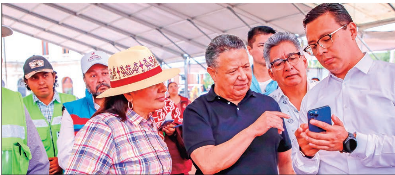
JMS. También explicó el gobernador que a través de esta iniciativa proponen una serie de reglas sobre la colocación y el mantenimiento de la nomenclatura y señalización en calles y espacios públicos, a fin de disminuir la contaminación visual que afecta tanto a la población de la entidad como al sector turístico

■ Julio Menchaca Salazar envió al Congreso iniciativa con proyecto de decreto para expedir la Ley de Imagen Urbana para el Estado