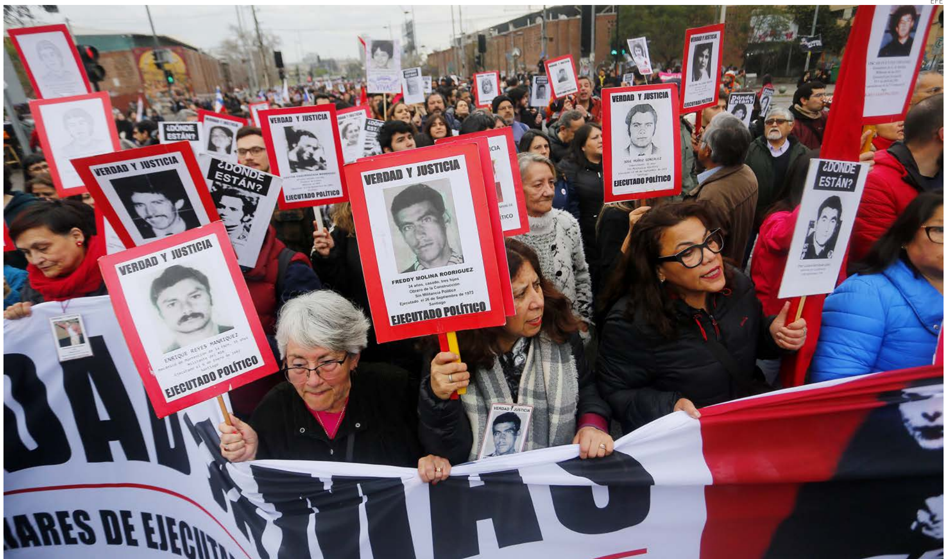
Familiares de asesinados y desaparecidos durante la dictadura chilena se manifiestan este domingo en Santiago para exigir justicia.