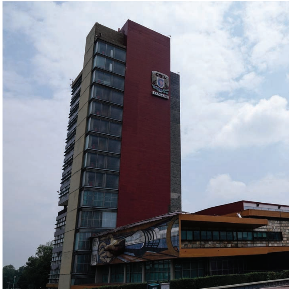
Rectoría de la UNAM, en Ciudad Universitaria.

Los gobernantes populistas acostumbran desdeñar el conocimiento científico y académico. No reconocen más fuente