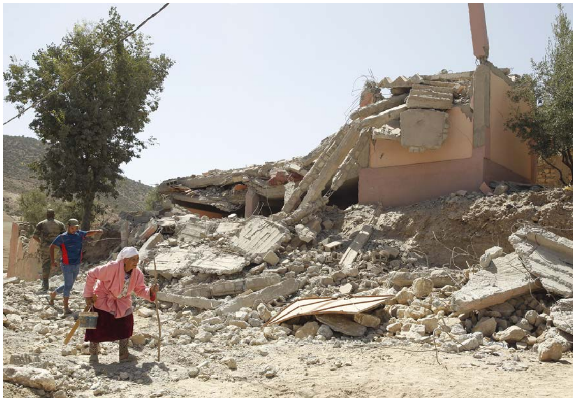
Una anciana camina entre los escombros en la aldea de Tafagajt, en Marruecos, cerca del epicentro del devastador terremoto.