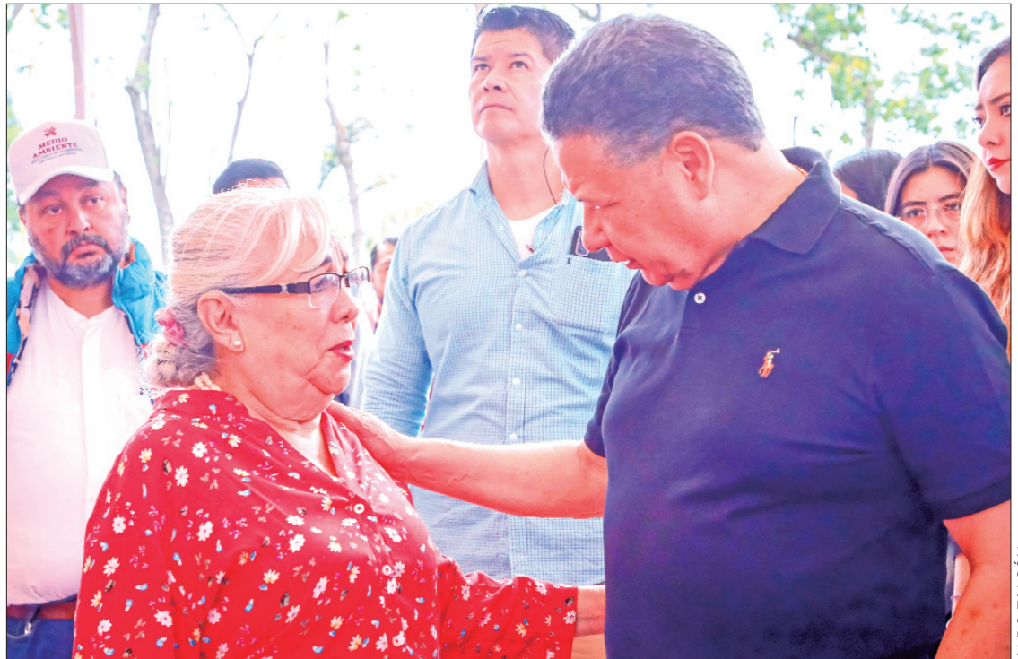
GOBERNADOR. También apuntó que la construcción de obra pública dejará de ser parte de la propaganda política, pues se prohíbe fijar relieves con logotipos institucionales alusivos al gobierno en turno, en vialidades y muros de contención, así como en mobiliario, equipamiento e infraestructura

"Estamos poniendo orden y ello también incluye a nuestras comunidades, vamos a transformar los espacios que nos pertenecen, pues si bien no estamos peleados con la modernidad, necesitamos que este crecimiento sea regulado y acorde a las necesidades de la población", remató.