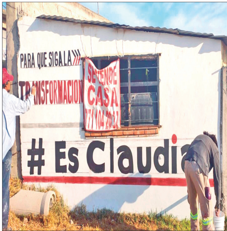
TONO. Interpusieron quejas contra al menos un centenar de bardas y espectaculares localizados en diferentes puntos del estado las cuales exhibieron imágenes de quienes buscaron una candidatura, además de la realización de eventos en donde acudían funcionarios o representantes populares.

Además, esperan los tiempos legales para presentar las demandas, primero que los partidos inscriban los posibles convenios de coalición o candidaturas comunes, así como definir los métodos de selección y eventuales precam-