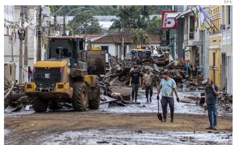
Residentes de Río Grande do Sul ayudan a levantar escombros tras el temporal.

"Esto llama nuestra atención porque fenómenos como éste han ocurrido en muchos lugares diferentes de nuestro planeta", comentó el presidente Lula da Silva, durante su intervención en la Cumbre del G20 en la India.